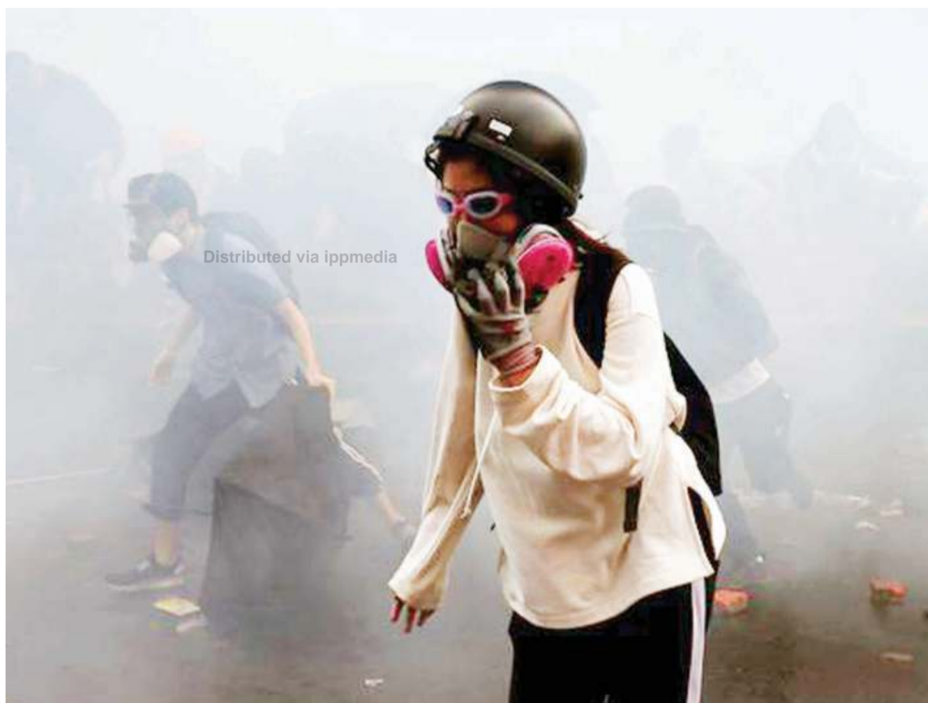
Distributed via ippmedia

Mwingine ni mkataba wa kupewa manuari tatu za doria kwa kikosi cha wanamaji cha Senegal. RFI