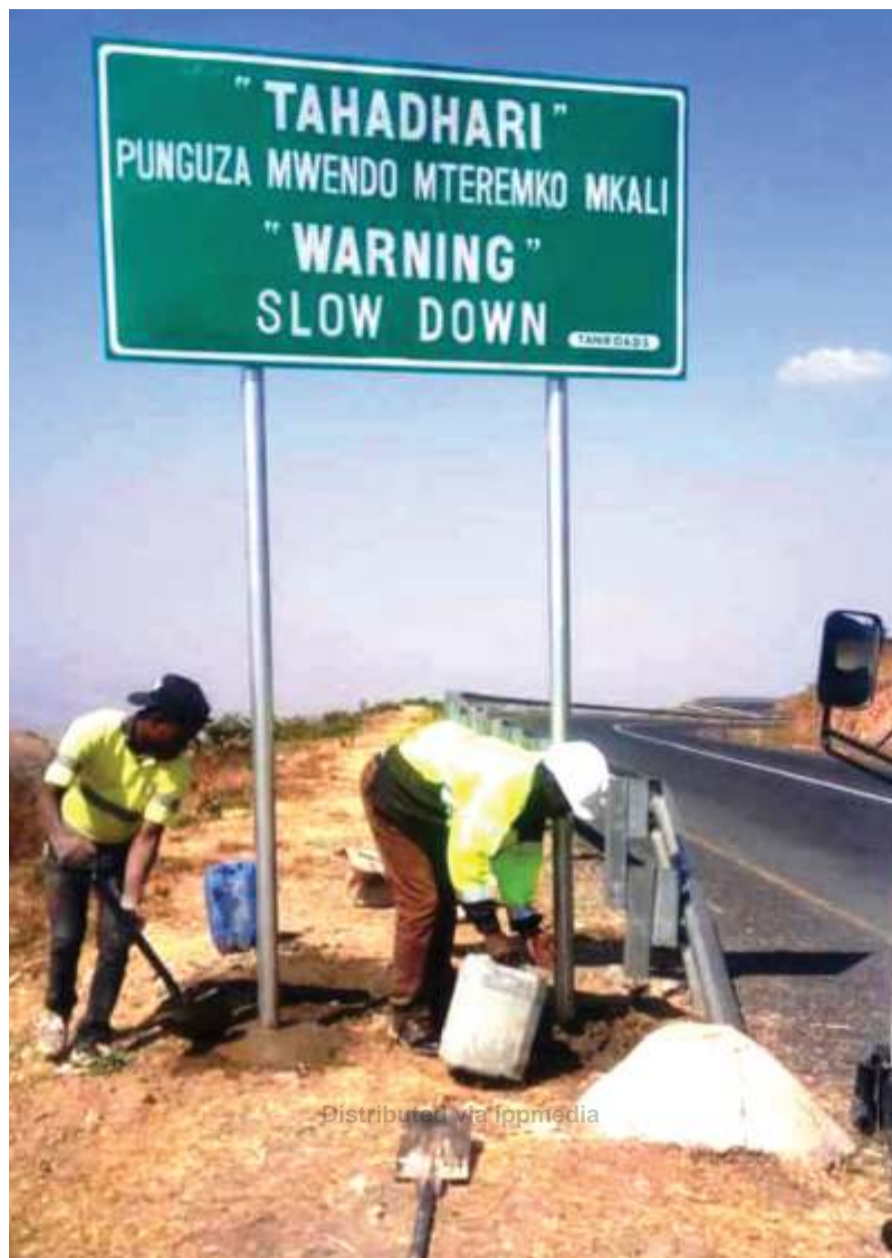
Wafanyakazi wa kampuni ya ujenzi ya DJ Lwamlema Investment ya jijini Mbeya, wakiweka alama za usalama barabarani katika Barabara ya Mbeya - Chunya, eneo la Kawetere juzi, ili kupunguza matukio ya ajali za barabarani.

Kwa mujibu wa Matei, kampeni zinaendelea katika maeneo mbalimbali ya mkoa wa Mbeya na kwamba katika maeneo hayo wameimarisha ulinzi na usalama.