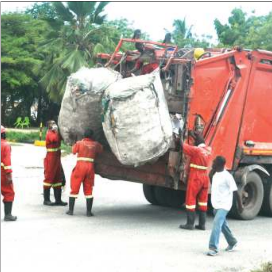
Wafanyakazi wa kampuni ya usafi wakisaidiana kupakia mafurushi ya takataka kwenye gari, katika eneo la Kimara, jijini Dar es Salaam wikiendi.