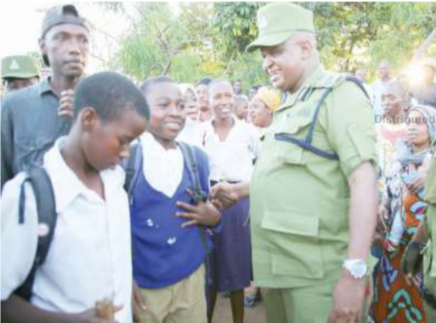
Kamishna CP Sabas akifurahia jambo na wanafunzi wa shule za msingi waliokuja kumsalimia baada ya kumalizika kwa mkutano wake na wananchi. Zaidi amewapongeza kwa kushirikiana na vyombo vya ulinzi na usalama katika kupunguza uhalifu kwenye makazi yao.