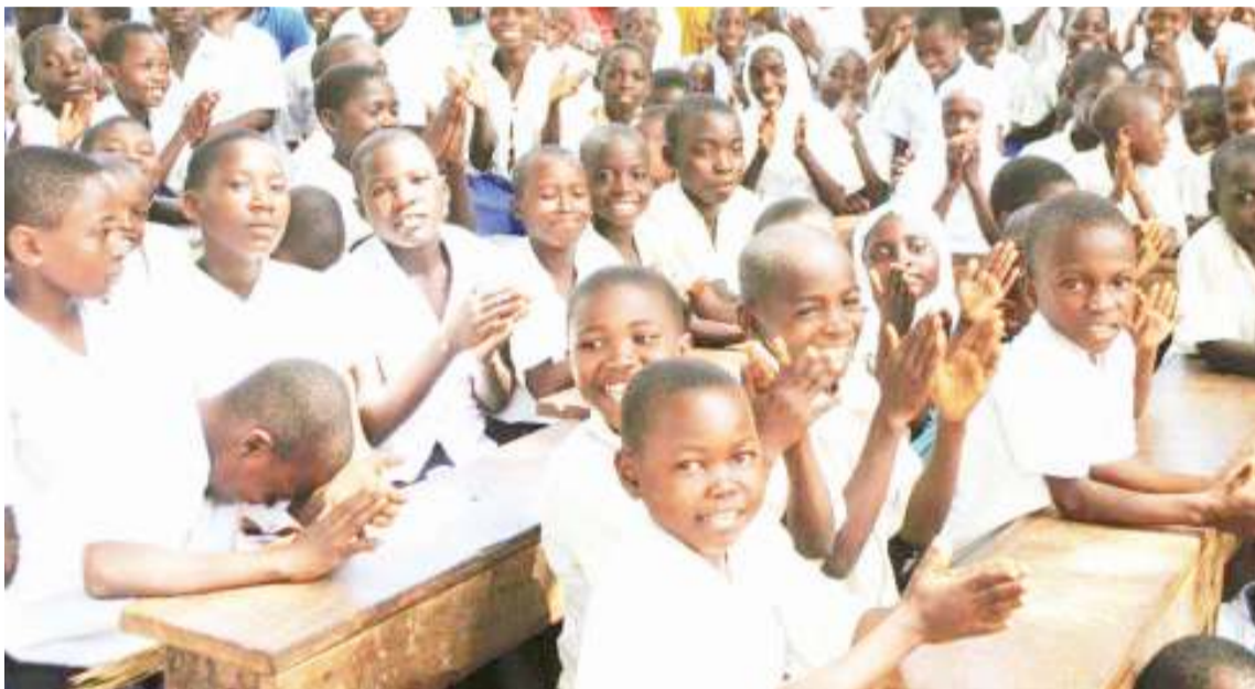
Kwa kutumia utaratibu wa EP4R wanafunzi hawatarundikana darasani kama hivi.

K UTEKELEZA sera ya elimu bila malipo kumeleta mwamko mkubwa kwa wazazi na walezi kupeleka watoto wao shuleni. Kutokana na hali hiyo ongezeko kubwa la wanafunzi katika shule za msingi na sekondari kote nchini ni kubwa, hatua inayosababisha kuwapo na changamoto ya miundombinu ya kutosheleza mahitaji ya wanafunzi. Shule nyingi za msingi na sekondari zina uhitaji wa madarasa, madawati, meza, viti, ofisi za walimu, nyumba za walimu na vyoo ili kuweza kuhudumia kikamilifu wanafunzi waliopo shuleni.