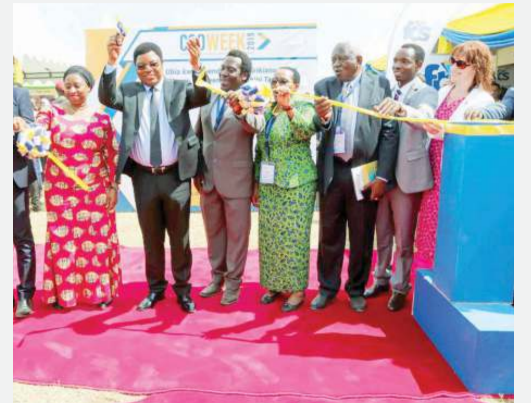
Waziri Mkuu Kassim Majaliwa, akikata utepe kuashiria ufunguzi wa Maonyesho ya Wiki ya Azaki katika Uwanja wa Jamhuri, jijini Dodoma.