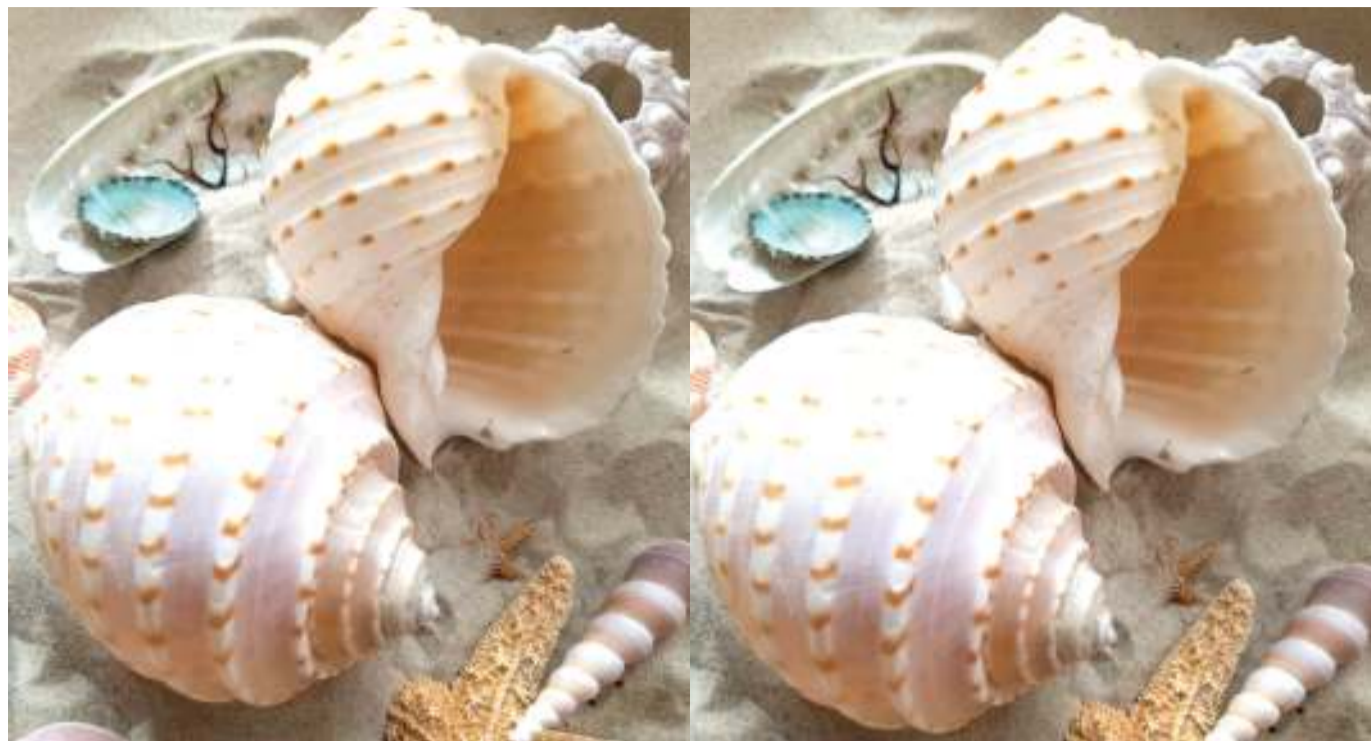
Mazao ya bahari kama vikonyo hivi ni miongoni mwa samaki wanaolalamikiwa na wavuvi kuwa leseni zao zinatozwa pesa nyingi.