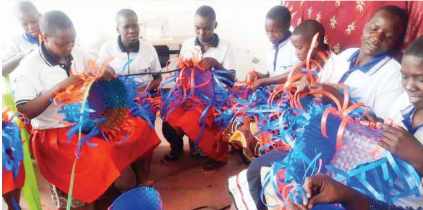
Baadhi ya wasichana wanaotarajia kufanyiwa mahafali wakiwa kwenye mafunzo ya kusuka vikapu katika nyumba salama ya Mugumu.