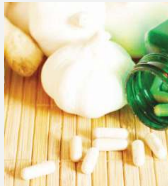
Vidongetiba mbadala vya saratani.

“Nia ya dawa ni muhimu kumbuka ni kutoleta madhara”, alisema. BBC