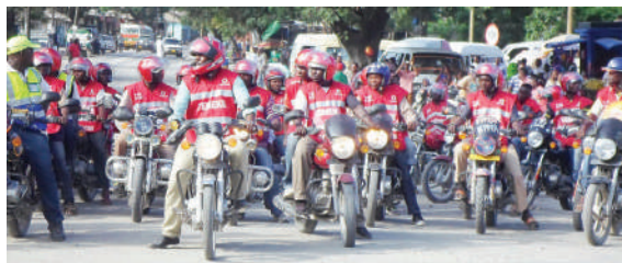
UVIKO 19 SEKTA YA KAZI