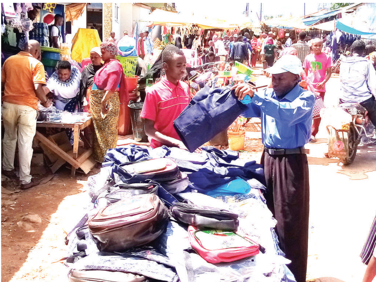
Wakazi wa Wilaya ya Muheza mkoani Tanga wakinunua nguo na vifaa vya shule katika gulio la Jumatatu kwa ajili ya maandalizi ya watoto ambao wanaanza shule mwaka huu, wamedai vifaa vya shule vimepanda bei.

Kwa upande wake, Chisumo aliishukuru kampuni ya Vodacom, na kuwasihii wateja kushiriki shindano la Tusua Mapene, pia wasambaze upendo kwa wapendwa wao ili waweze kujishindia zawadi mbalimbali zinazotolewa katika msimu huu wa sikukuu.