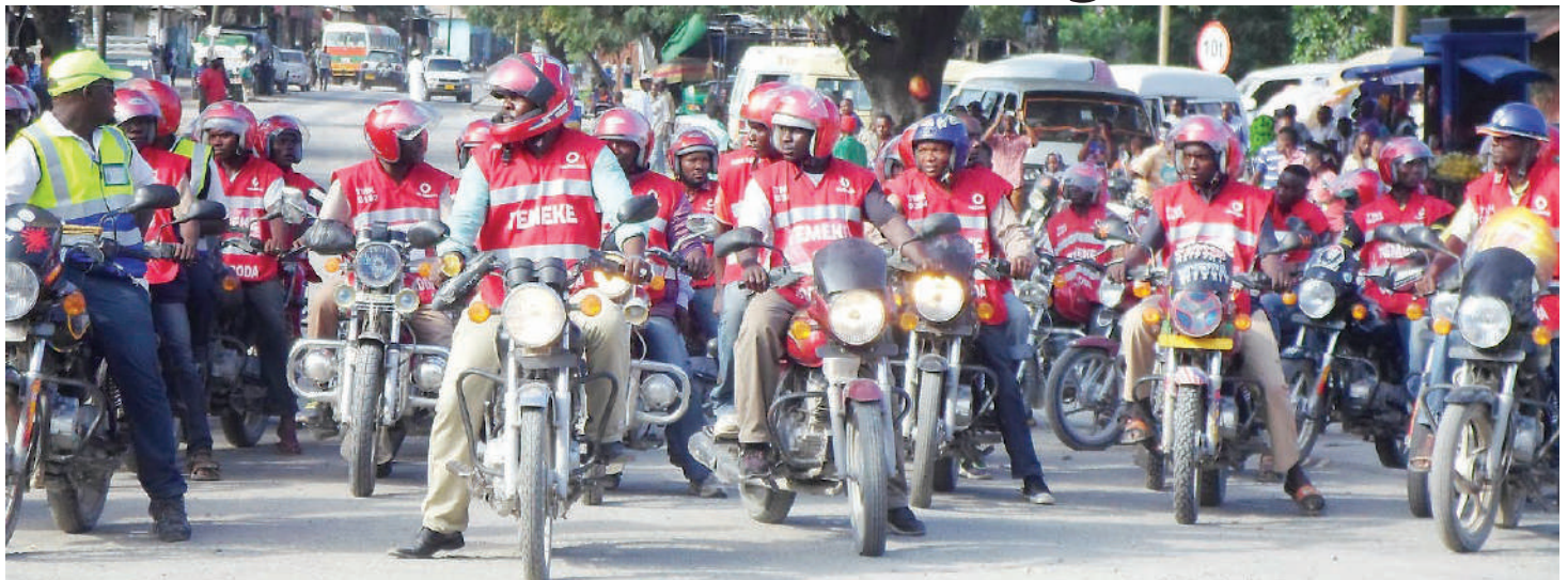
Madereva wa bodaboda waliohamasika na kujisajili kutetea maslahi yao.

“Kuna upungufu mkubwa kwenye sheria hii haisemi hatua za kuchukua wakati yanapotokea