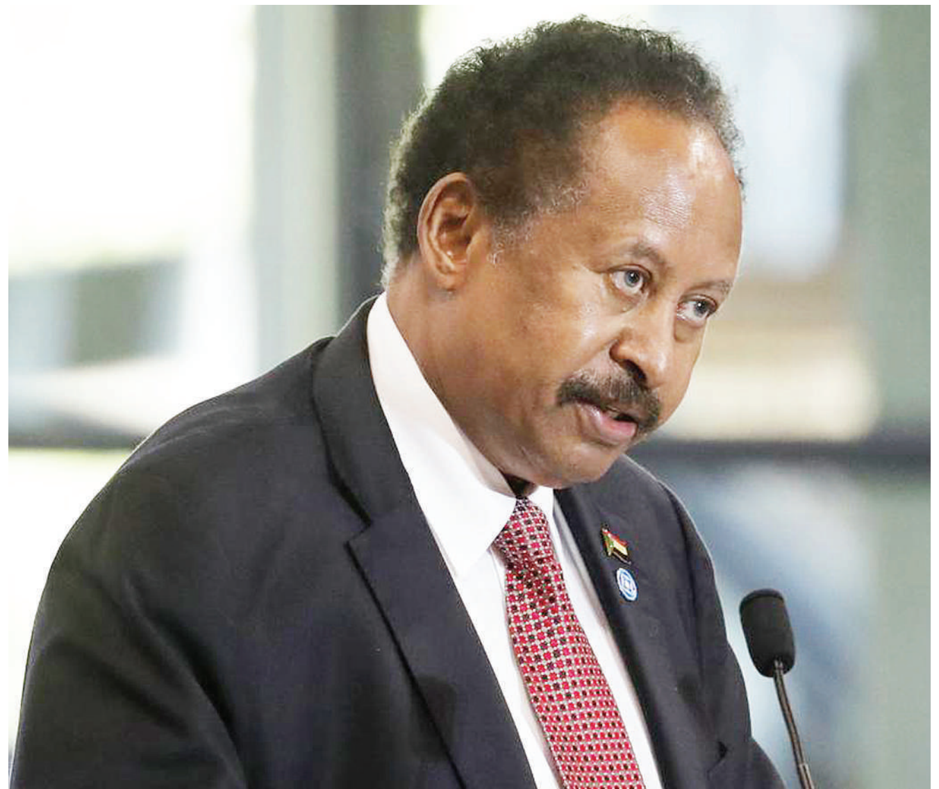
Abdalla Hamdok, aliyetangaza kujiuzulu nafasi ya uwaziri mkuu, nchini Sudan.

Kujiuzulu kwa Hamdok, kunaicha Sudan kwenye mzozo mwingine wa kisiasa, katika taifa ambalo limeendelea kuwa na historia ya mapinduzi ya kijeshi. RFI