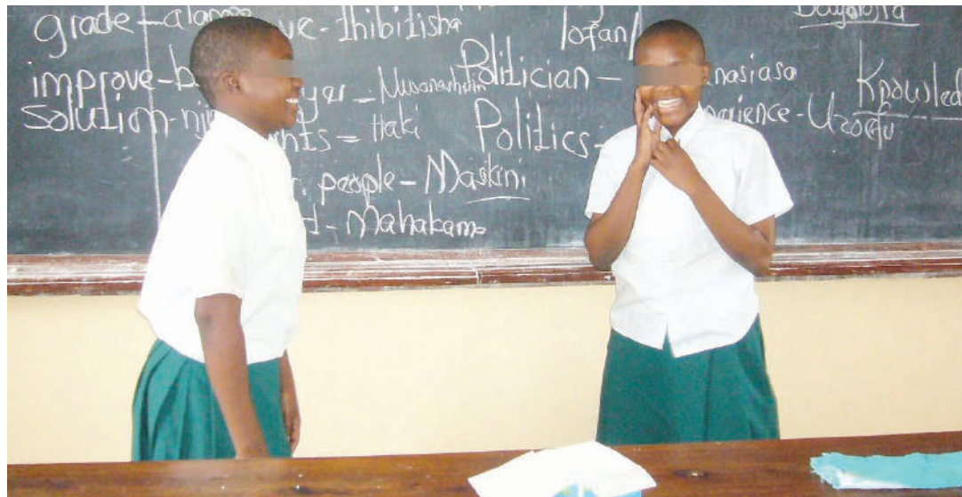
Mabinti wapewe elimu ya kulinda viungo vya uzazi na kuepusha ngono za utotoni zinazoweza kuhatarisha uzazi.

Wasichana vyaoni na mabinti wanaosoma shule za msingi na sekondari wajilinde na kuachana na ngono utotoni au kutumia