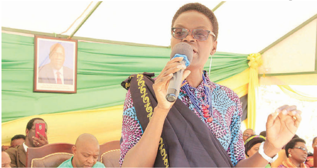
Naibu Spika Dk. Tulia Ackson.