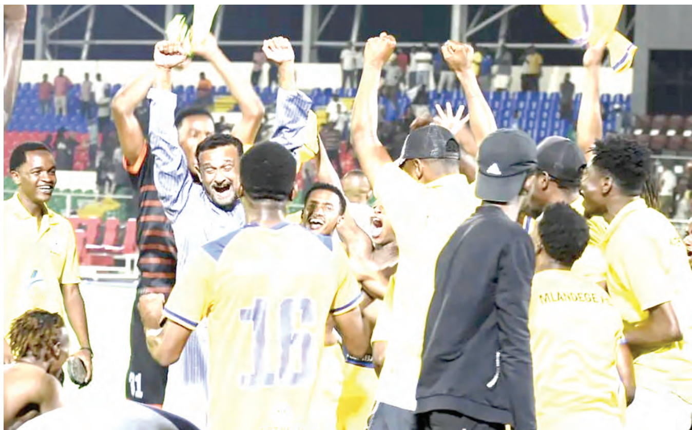
Wachezaji na viongozi wa Timu ya Mlandege wakishangilia juzi usiku kutinga hatua ya fainali ya michuano ya Kombe la Mapinduzi baada ya kuifunga APR kwa mikwaju ya penalti 4-2. Timu hizo hazikufungana kwenye muda wa kawaida.

Ihefu FC tayari imeshacheza mechi 14 za duru la kwanza imeshinda mechi tatu, imetoka sare mechi nne na wamepoteza michezo saba, wamekusanya pointi 13 wakishika nafasi ya 13 kwenye msimamo.