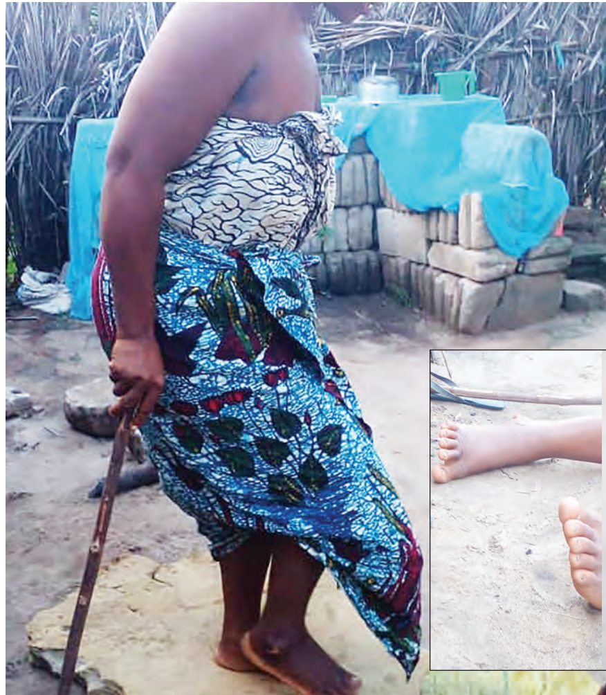
Hali ya mwathirika huyo ilivyokuwa Jumapili iliyopita.

"Tuliruhusiwa kutoka hospitalini jana (Jumanne) jioni baada ya mke wangu