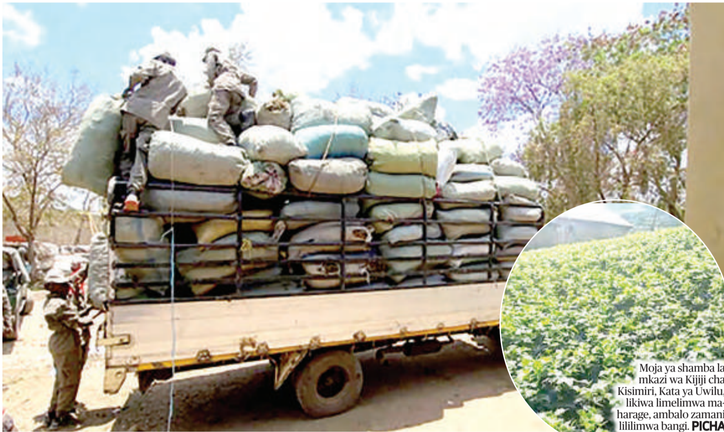
Moja ya shamba la mkazi wa Kijiji cha Kisimiri, Kata ya Uwilu, likiwa limelimwa maharage, ambalo zamani lililimwa bangi.

Gunia za bangi na mbegu zake kilo 310, zilizokamatwa huko Arumeru, tayari kwa ajili ya kuchomwa moto.