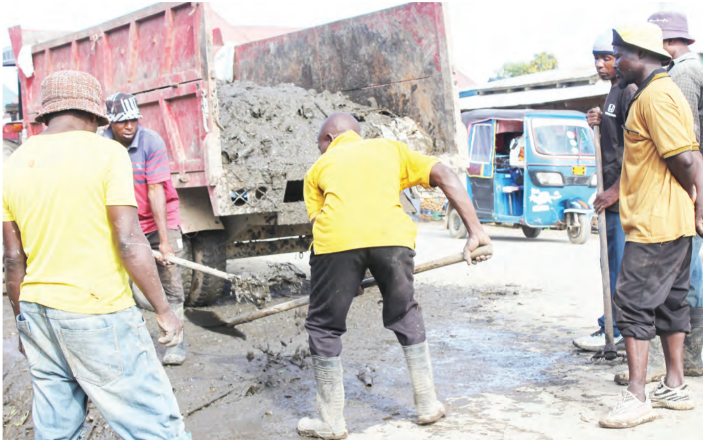
Baadhi ya vijana wakazi wa Mji Mdogo wa Mbalizi, mkoani Mbeya wakiondoa tope lililoziba moja ya mitaro na kusababisha maji kushindwa kupita na kujaa kwenye maduka na makazi ya watu katika mji huo, juzi.