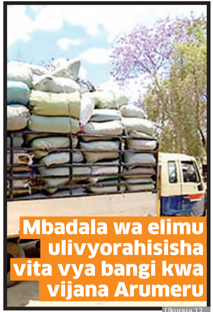
Mbadala wa elimu ulivyorahisisha vita vya bangi kwa vijana Arumeru