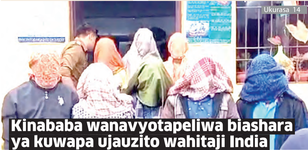
Kinababa wanavyotapeliwa biashara ya kuwapa ujauzito wahitaji India