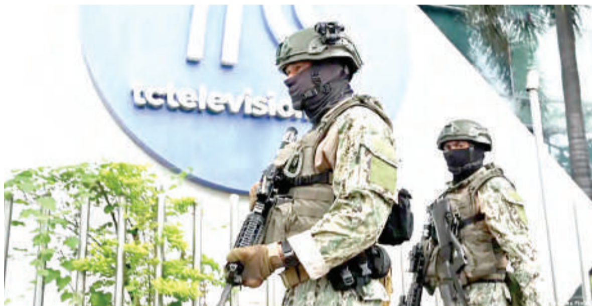
Wanajeshi wa Ecuador wakifanya doria nje ya kituo cha TV ambacho juzi kilivamiwa na waasi na kuwaweka mateka watan-gazaji.