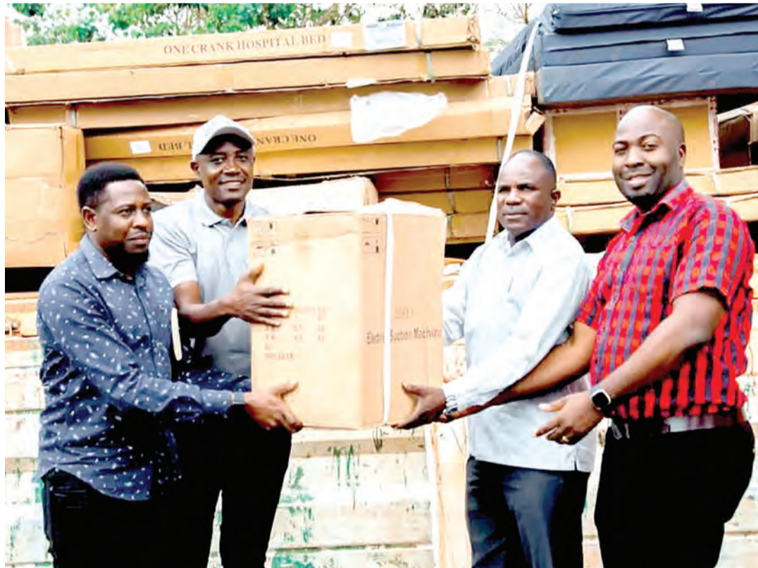
Hafla inayohusu taasisi binafsi kutoa vifaa tiba hospitalini.