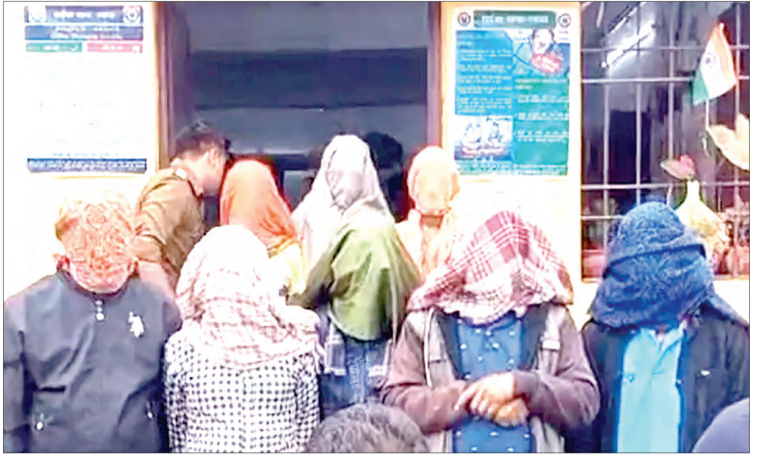
Walionaswa kutokana na kuhusika na biashara za ujauzito.

"Mimi ni maskini, nahitaji sana pesa kwa hiyo niliwaamini," baba wa watoto wawili wa kiume alin-