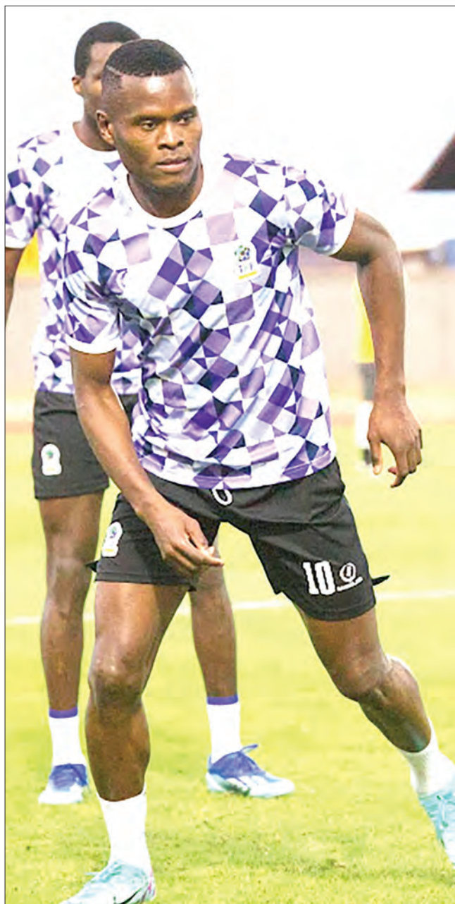
Nahodha wa Taifa Stars, Mbwana Samatta, akiwa mazoezini nchini Ivory Coast kujiandaa na Fainali ya Mataifa ya Afrika (AFCON) itakayoanza Januari 17.