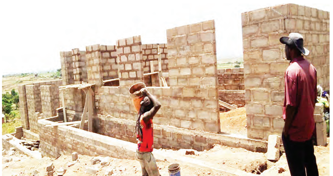
Mafundi wakiendelea na ujenzi wa shule shikizi (awali) ya kijiji cha Kamguruki, Musoma Vijijini mkoani Mara juzi, ili kupunguzia watoto wadogo kutembea umbali mrefu kufuata elimu.