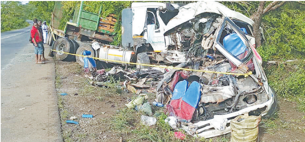
Baadhi ya wakazi wa eneo la Mikese, mkoani Morogoro, wakiangalia lori lililogongana na basi dogo la abiria aina ya Toyota Coaster katika barabara kuu ya Morogoro- Dar es Salaam na kusababisha watu 15 kupoteza maisha, saba kujeruhiwa na kulazwa katika Hospitali ya Rufani ya Mkoa wa Morogoro jana.

Alitaka vijana kushiriki kikamilifu katika maendeleo ya taifa kwa kufanya kazi kwa bidii, kujajiri na kudumisha nidhamu na mshikamano kuelekea uchaguzi mkuu wa mwaka 2025.