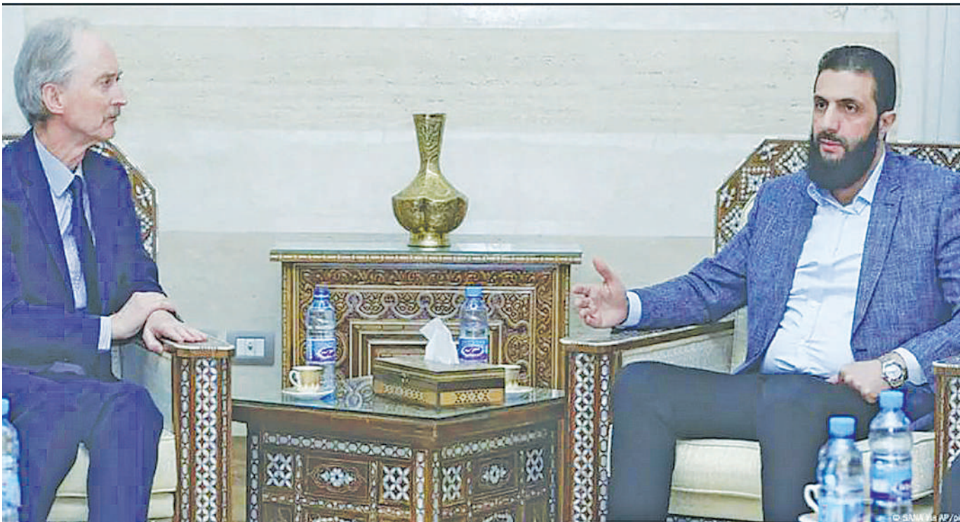
Kiongozi wa kundi la HTS linaloongoza Syria, Abu Muhammad al-Joulani (kulia) akizungumza na mjumbe maalum wa Umoja wa Mataifa nchini Syria, Geir Pederson, jana.