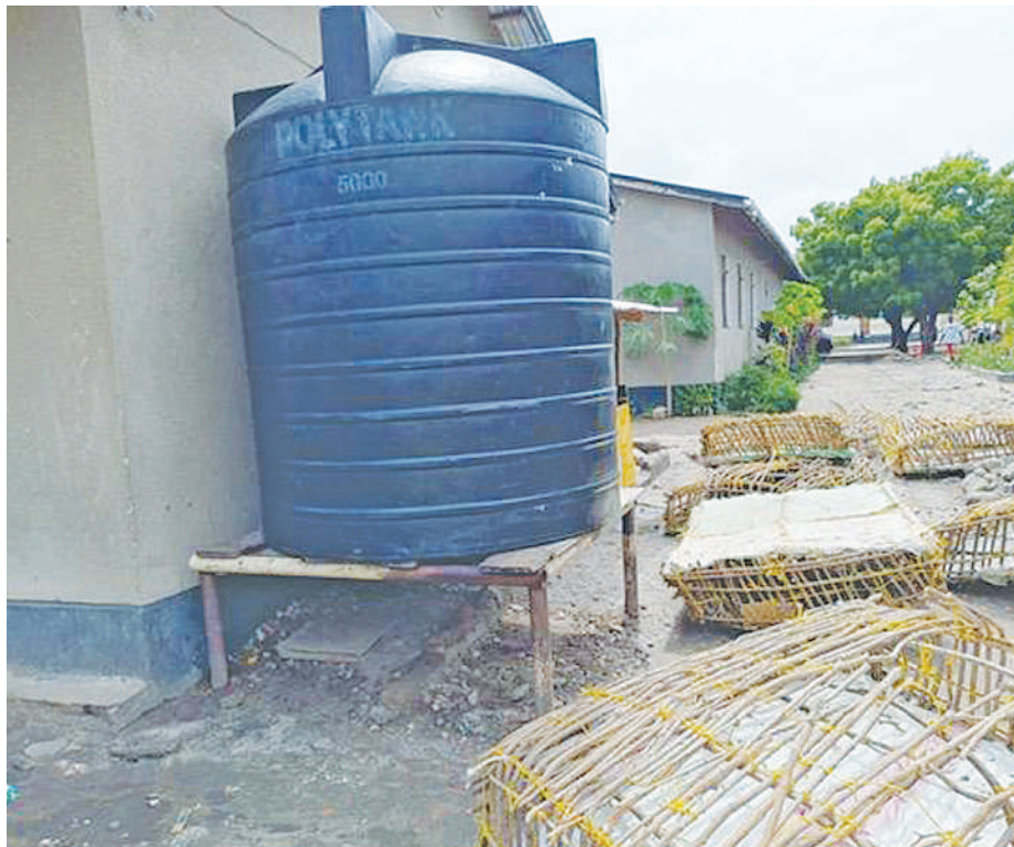
Baadhi ya matangi ya maji yaliyowekwa katika Shule ya Msingi Kawe A kwa ajili ya wanafunzi kunywa.

Klabu ya Wakulima Chipukizi, imeanzishwa kupitia mradi wa 'Pamoja Tudumishe Elimu,' unaotekelezwa shuleni Kawe 'A' kupitia ushirikiano wake na asasi binafsi, Shirika la WeWorld, Ni mradi wa wanafunzi kuhifadhi mazingira, kuwa