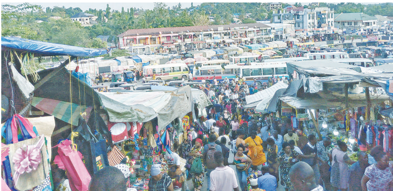
Umati wa watu wakitoka na wengine ku-ingia katika kituo cha daladala za kuelekea Segerea kilichopo Mbezi Mwisho Dar es Sa-laam jana. Kituo hicho kwa sasa kimezidiwa na wingi wa daladala, bajaj, bodaboda na wafan-yabiashara.