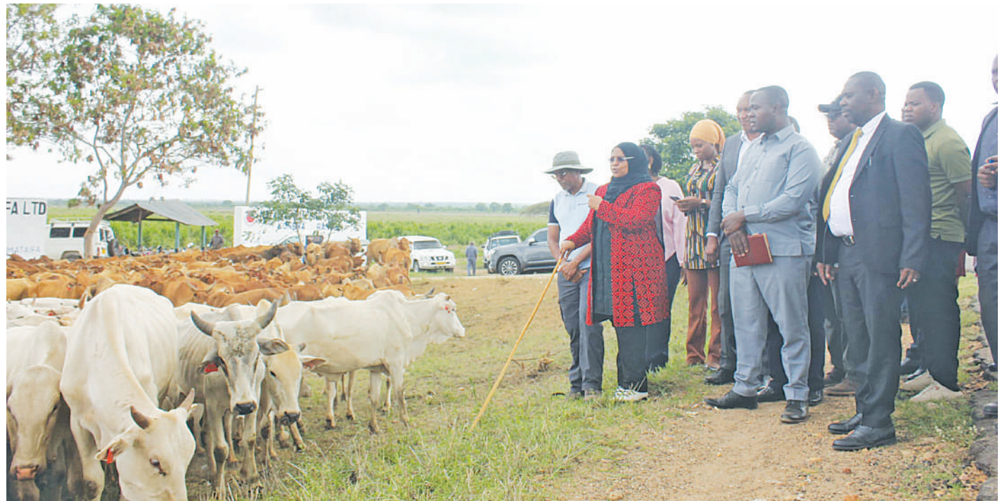
Waziri wa Mifugo na Uvuvi, Dk. Ashatu Kijaji (mwenye fimbo), akikagua ng'ombe bora wanaopatikana kwenye Ranchi ya Taifa (NARCO LTD) iliyopo Wilaya ya Kongwa, mkoani Dodoma baada ya kuitembelea jana.