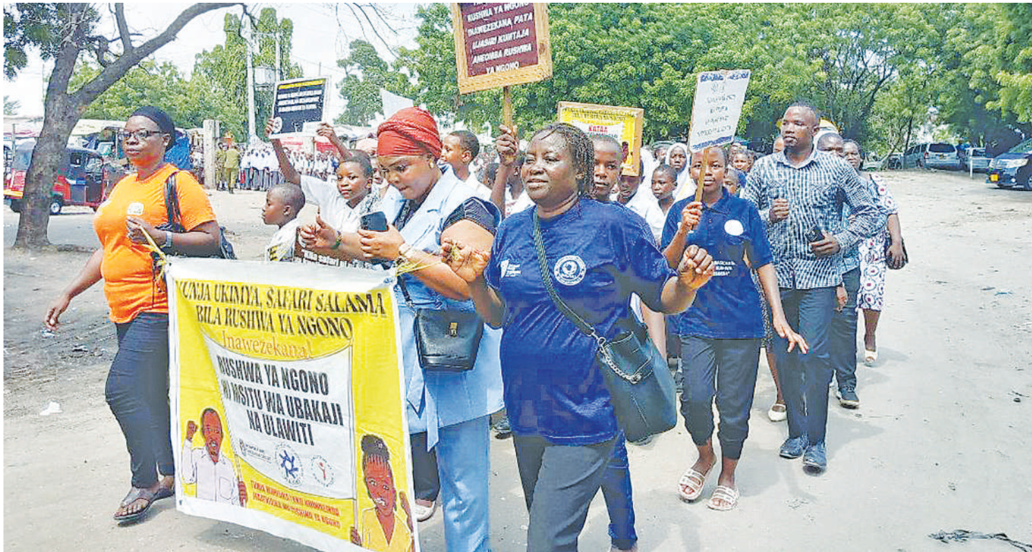
WAJIKI wakiwa katika maadhimisho hayo.