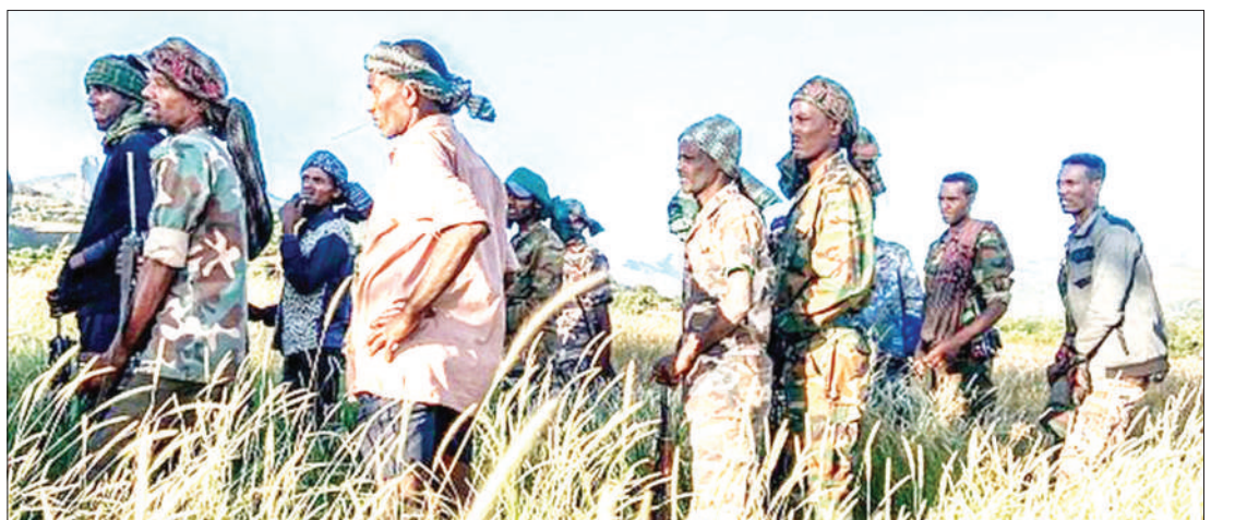
Baadhi ya wanajeshi wakiangalia namna ya kuanza mashambulizi.