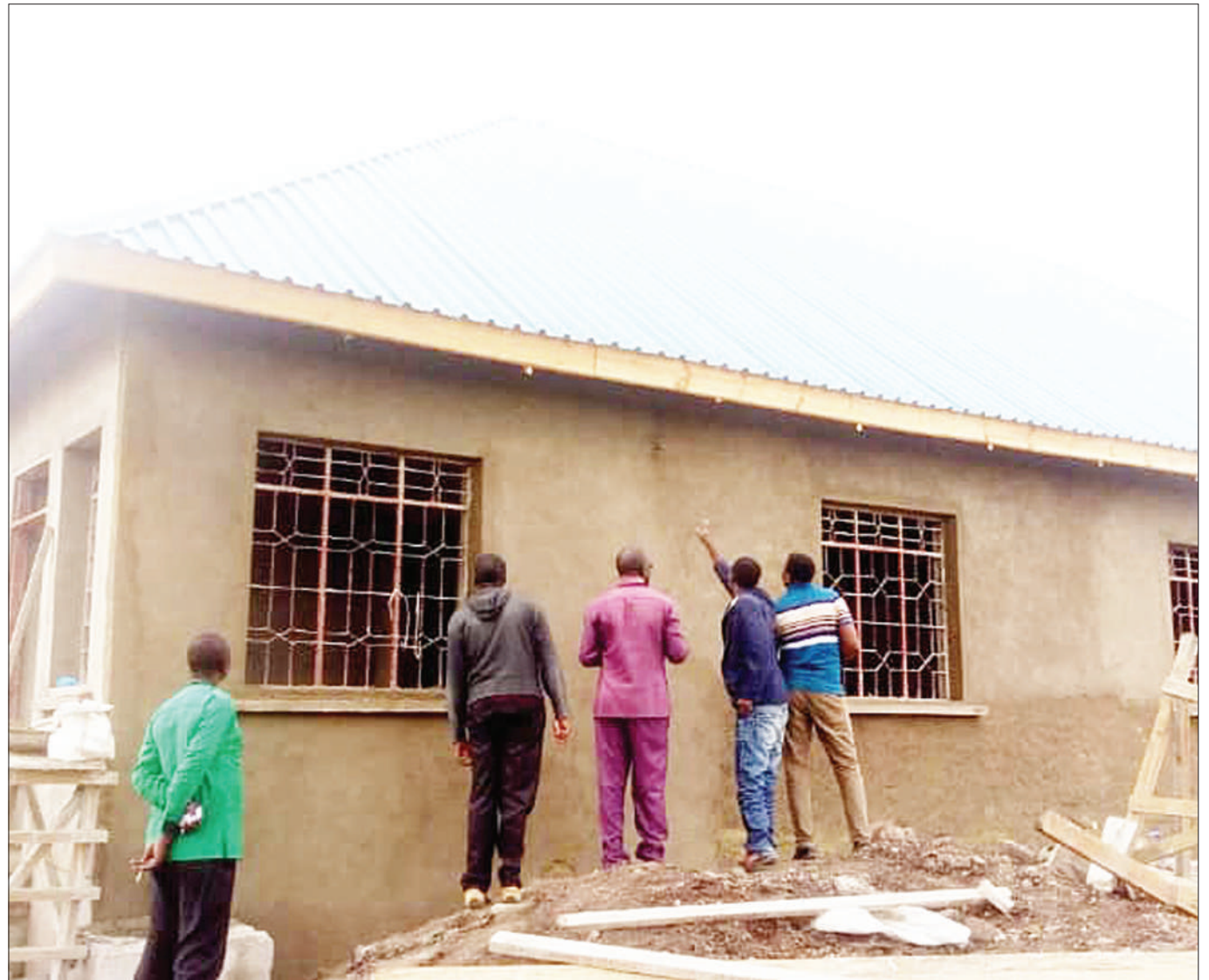
Mafundi wakipiga plasta moja ya majengo ya Kituo cha Afya cha Kata ya Bugwema Wilaya ya Musoma mkoani Mara juzi, ambacho kinajengwa kwa nguvu za wananchi kwa kushirikiana na serikali na wadau wengine.

Aliwataka wakazi wa Mwanza kukataa kupokea na kuwahifadhi wahamiaji kutoka nchi yoyote kwa kuwa kufanya hivyo ni kosa kisheria, badala yake wakiwaona watu wa namna hiyo, watoe taarifa kwenye vyombo vya ulinzi na usalama.