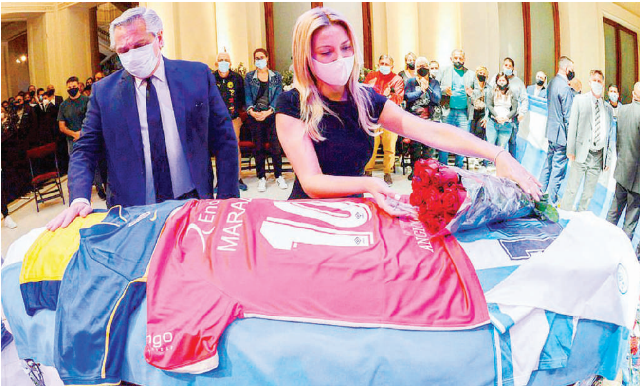
Rais wa Argentina, Alberto Fernandez (kushoto), akiwa na rafiki yake wa kike, Fabiola Yanez, wakitoa heshima ya mwisho katika jenze la nyota wa zamani wa nchi hiyo, Diego Maradona, ambaye alizikwa kwenye makaburi ya Bella Vista mjini Buenos Aires juzi.