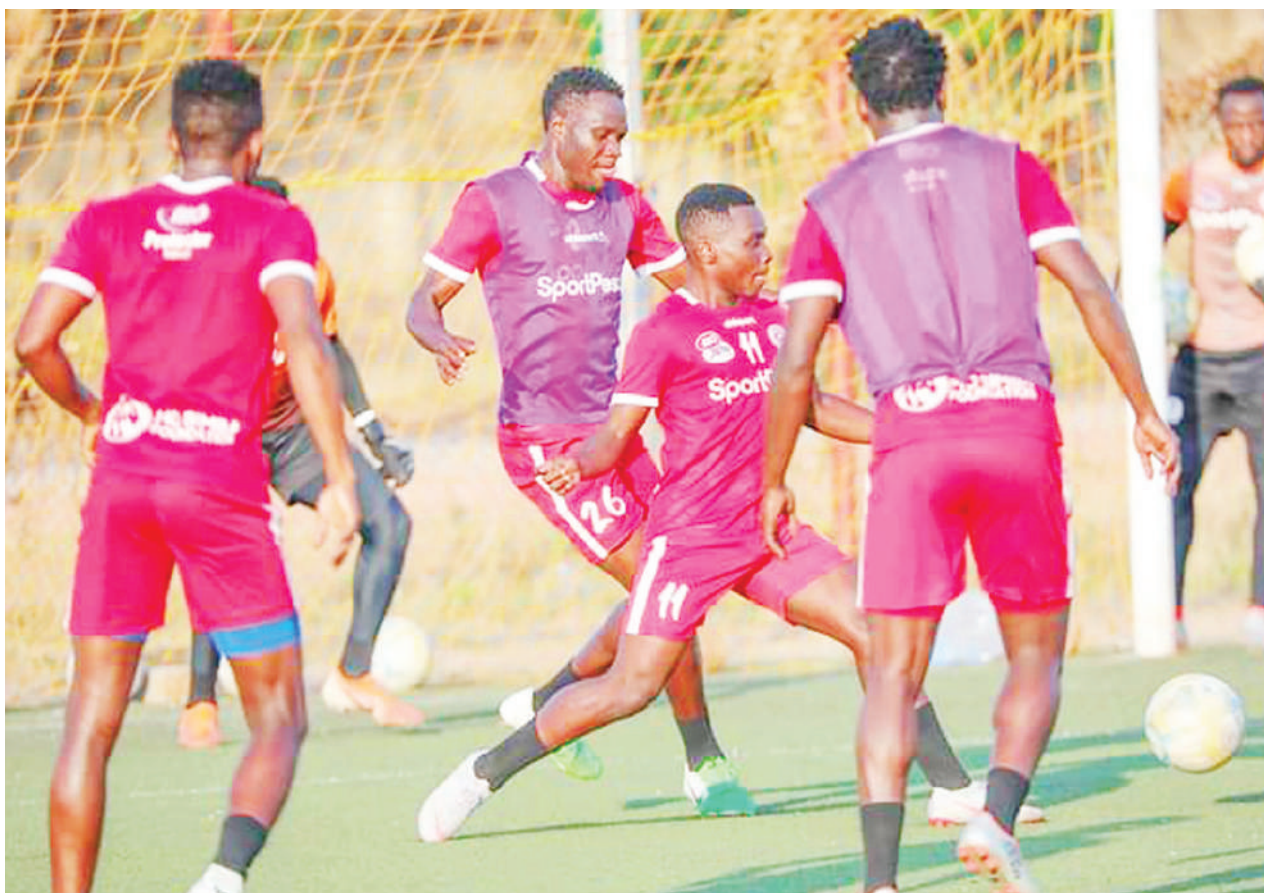
Wachezaji wa Simba wakiwa katika mazoezi jijini Abuja, Nigeria ili kujiandaa na mechi ya mashindano ya kimataifa ya Ligi ya Mabingwa Afrika dhidi ya Plateau United itakayochezwa kesho kwenye Mji wa Jos nchini humo.

Klabu hiyo ya Lindi ilipata tiketi ya kushiriki mashindano hayo ya kimataifa ikiwa ni mara yake ya kwanza baada ya kucheza fainali ya Kombe la FA dhidi ya Simba, ambayo ilishinda kombe hilo pamoja na taji la Ligi Kuu Tanzania Bara.