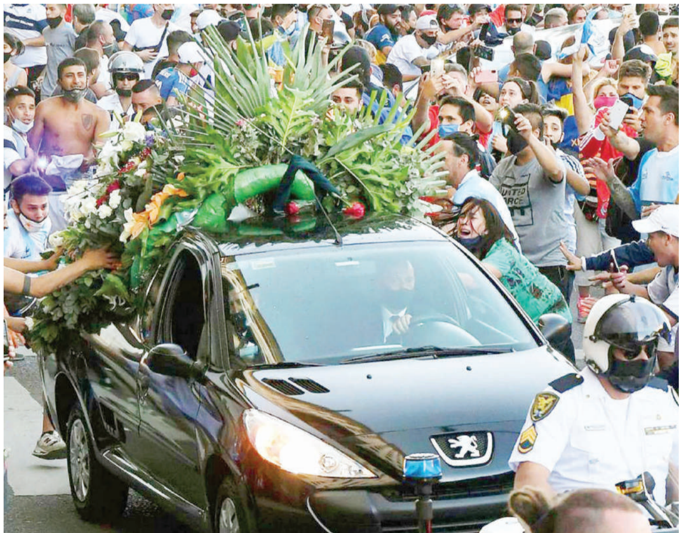
Raia wa Argentina wakigombea kulishika gari lilobeba mwili wa mwanasoka maarufu Diego Armando Maradona, wakati likiingia katika makazi ya Rais ya Casa Rosada, eneo la Buenos Aires juzi. Maradona alifariki kwa matatizo ya moyo akiwa na miaka 60.

Alisema wameonyesha orodha ya makamanda waliohusika katika kitengo hicho na uhusiano wake na Ikulu ya Rais. DW