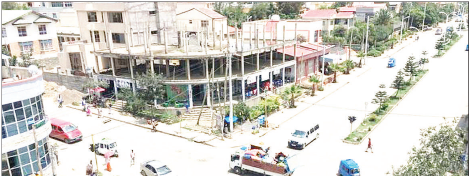
Mji Mikelle ukiwa tupu baada ya raia kukimbilia nchi jirani ya Sudan.