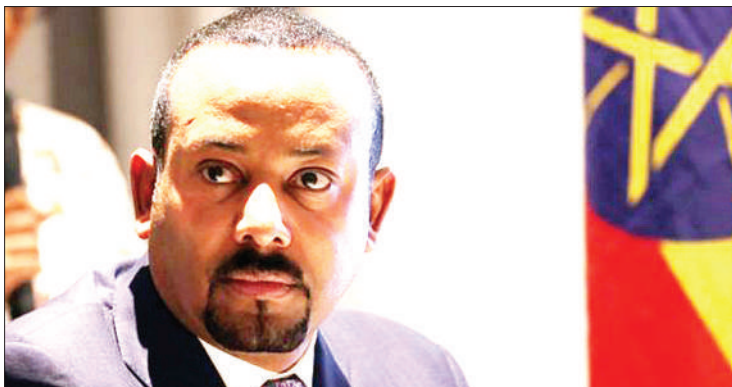
Waziri Mkuu wa Ethiopia, Abiy Ahmed.

Ahmed, amekataa maombi yanayotolewa na mataifa mbalimbali kufanyika kwa mazungumzo ya kumaliza mgogoro huo.