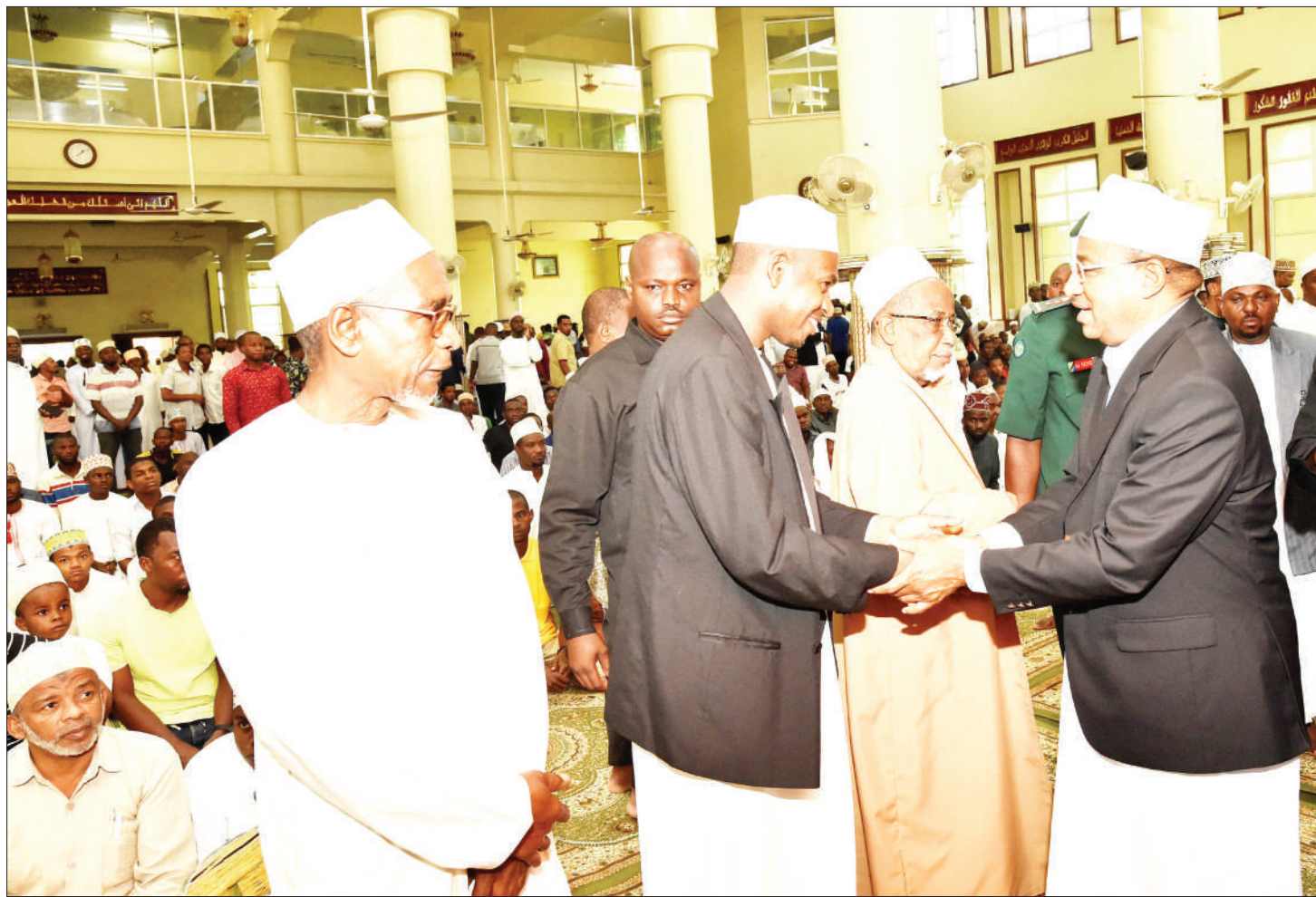
Rais wa Zanzibar na Mwenyekiti wa Baraza la Mapinduzi, Dk. Hussein Ali Mwinyi akisalimiana na Muumini wa Dini ya Kiislam, baada ya kuhudhuria Sala ya Ijmaa katika Masjid Noor Muhammad jijini Zanzibar jana.

Aidha, aliwasihi wachimbaji wenzake kuendelea kuchimba kisasa na kumuamini Mungu, ili wapate madini mengi.