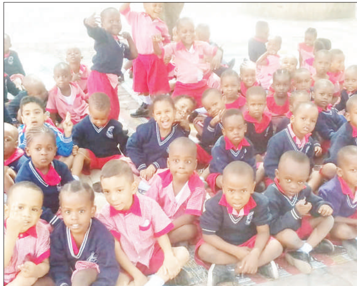
Wanafunzi wa chekechea mjini Bukoba wakiwa masomoni.

Nyangoma anasema, shule za awali zinapokuwa na viwanja vya kuchezea na wanafunzi wakapewa muda wa kucheza na kubuni itawasaidia kungeza uelewa na ndicho wanachokifanya hata Kagera kunang'ara kielimu.