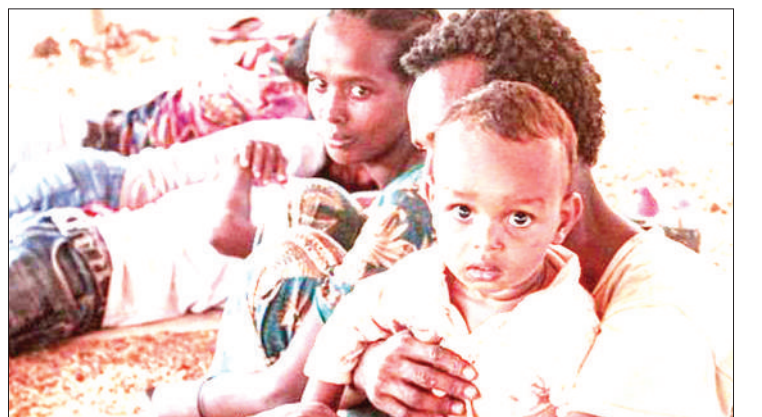
Baadhi ya raia wa Tigray wakiwa wamepumzika baada ya kuukimbia mji wa Mikelle.

Amekasirishwa na matendo yao kiasi ambacho alimuru mashambulio ya kijeshi dhidi ya TPLF baada ya kusema kuwa wapiganaji wake walikuwa wamevuka kwa kushambulia kambi za jeshi.