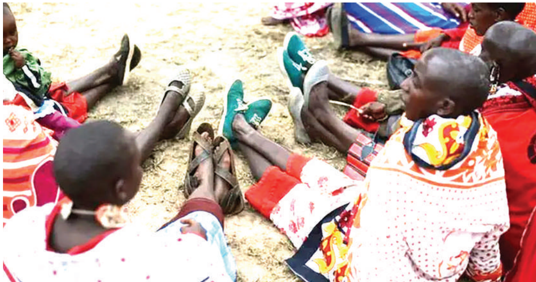
Kinamama waliokusanyika kupata elimu ya madhara ya ukeketaji.

Anatumka ni hali inayochangia kukosekana takwimu sahihi, huku hofu nyingine iliyopo kwa njia mbadala ya ukaguzi kliniki kwa 'vichanga' nayo inahatarisha