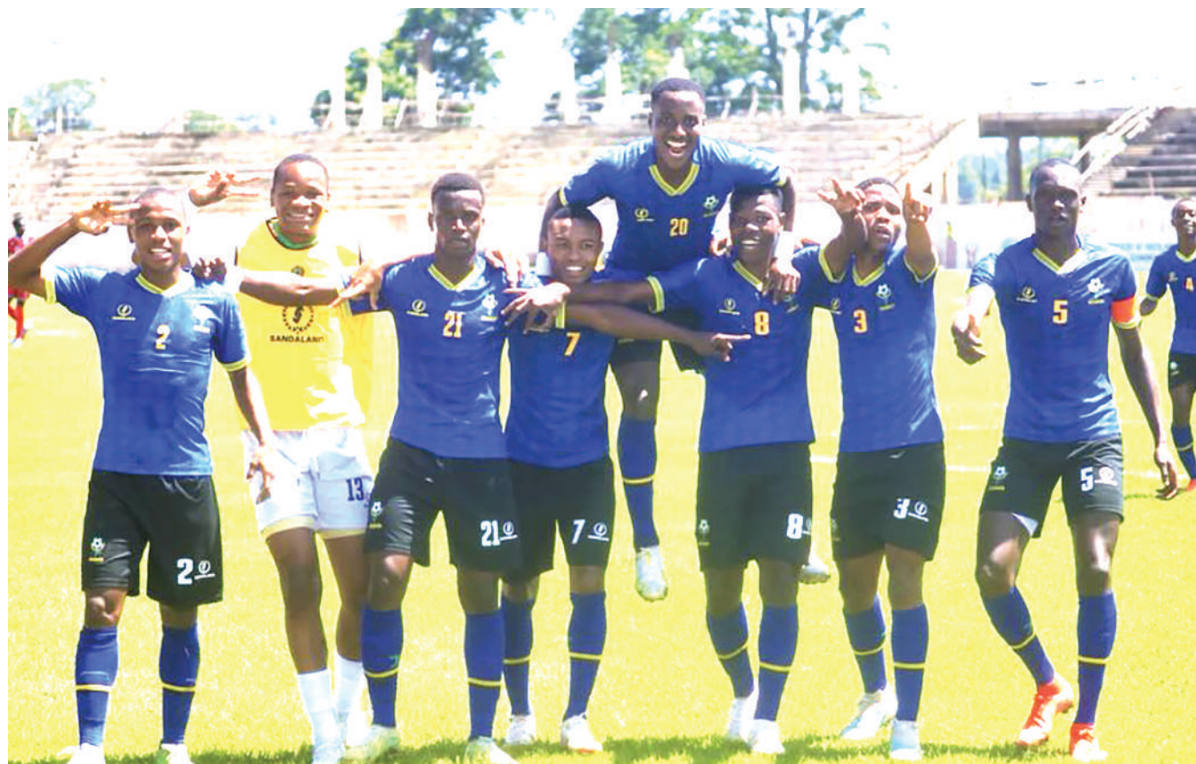
Wachezaji wa Timu ya Taifa ya Tanzania Bara ya umri chini ya miaka 18 wakishangilia bao katika mechi ya hatua ya makundi ya mashindano ya CEFA U-18 dhidi ya Sudan Kusini iliyochezwa mjini Kakamega, Kenya jana. Sudan Kusini ilishinda mabao 2-1.

Yanga ndio vinara ya ligi hiyo yenye timu 16 wakiwa na pointi 24 wakifuatiwa na Azam FC iliyojikusanya pointi 22 huku Simba ikifuata na pointi 19, ikiwa na mechi mbili mkononi.