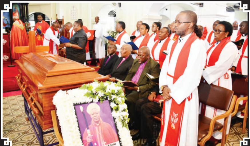
Wachungaji na maaskofu wastaafu wakiimba nyimbo za maombolezo katika ibada hiyo.