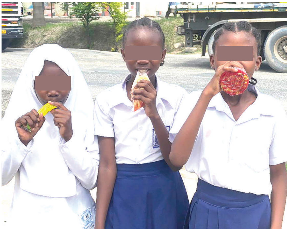
Wanafunzi wakila vyakula vyenye vifungashio vya plastiki.

Muuzaji huyo akawatetea kwamba wanafunzi wanapokula mifuko hiyo inasaidia kuhifadhi mazingira, kwa sababu wanapokula karanga peke yake, wanatupa mifuko hiyo ovyo na kusababisha wao kusumbu-