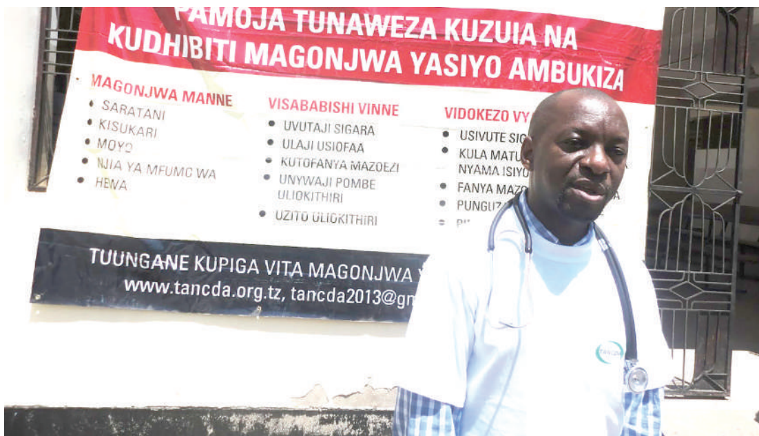
Kampeni dhidi ya magonjwa yasiyoambukiza ikiendelea.

Pia anafanua kisukari na magonjwa yanayotokana na kisukari yanaongezeka duniani kote, nchi za dunia ya tatu zikiathirika zaidi, sasa iko katika orodha ya magonjwa 10