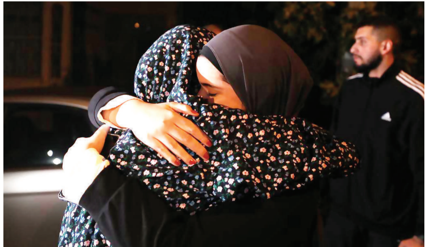
Mfungwa wa Kipalestina aliyeachiwa na Israel akikumbatiana na jamaa yake jana alipowasili ukingo wa Magharibi.