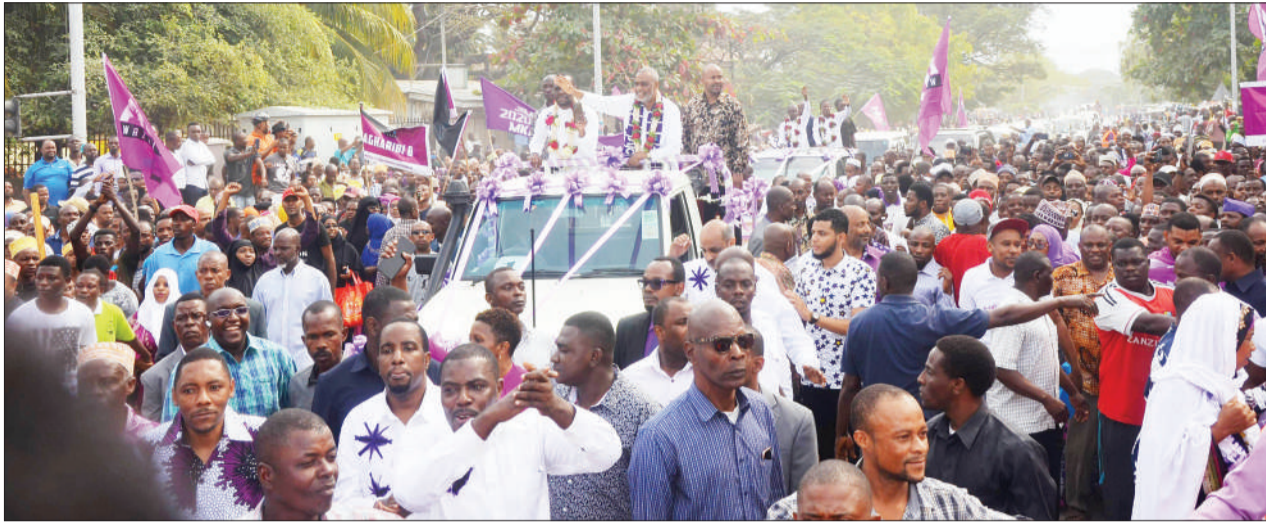
Wagombea urais wa Tanzania Bara na Visiwani wa Chama cha ACT-Wazalendo wakipokelewa jana walipowasili Zanzibar, baada ya kuteuliwa na Mkutano Mkuu wa chama hicho hivi karibuni, jijini Dar es Salaam.