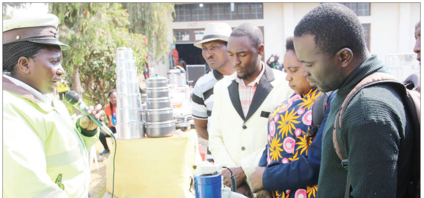
Mmoja wa askari polisi wa Mkoa wa Mbeya Kitengo cha Usalama Barabarani (kushoto), akitoa elimu ya usalama barabarani kwa wananchi wakati wa maonyesho ya Nanene Kanda ya Nyanda za Juu Kusini yaliyofanyika katika viwanja vya John Mwakangale jijini Mbeya.

Mikoa ya Kanda ya Nyanda za Juu Kusini inaongoza kwa uzalishaji wa chakula nchini, hali ambayo ilifanyika ibatizwe jina la Ghala la Taifa la Chakula, lakini bado mikoa hiyo inakabiliwa na tatizo la udumavu wa watoto.