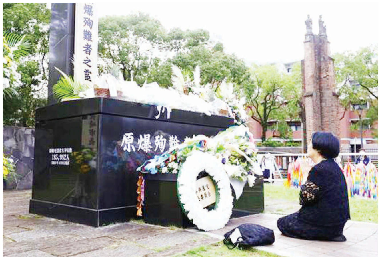
Mmoja wa wakazi wa mji wa Nagasaki nchini Japan akiwa katika moja ya kaburi akiadhimisha kumbukumbu ya miaka 75 tangu mji huo uliposhambuliwa kwa bomu la nyuklia na Marekani.

Kulingana na wizara hiyo pia, watu 886 wamekufa kutokana na ugonjwa wa corona na kufanya idadi ya vifo kupindukia 41,585. DW