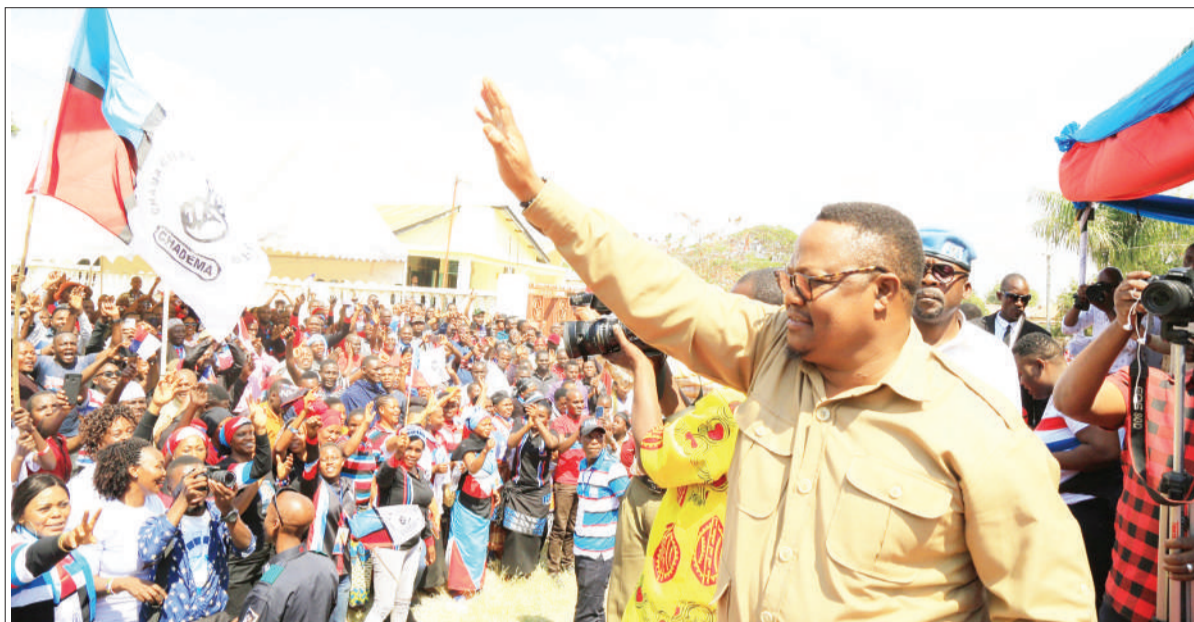
Mgombea urais kupitia CHADEMA, Tundu Lissu, akiwasalimia wananchi waliofika ofisi za chama hicho, Kanda ya Kati zilizopo eneo la Area 'C' jijini Dodoma, baada ya kuchukua fomu ya kuomba kuwania urais Tume ya Taifa ya Uchaguzi (NEC) mwishoni mwa wiki.