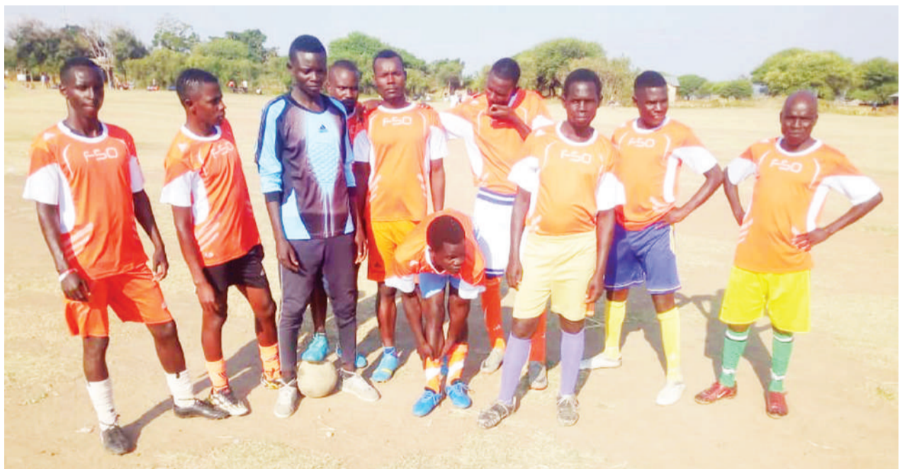
Kikosi cha Rifa FC, kilichowatupa nje mabingwa watetezi Kirengo FC kwa kuwachapa mabao 4-0 kwenye mechi ya robo fainali ya Umoja Cup iliyopigwa mwishoni mwa wiki kwenye Uwanja wa Maji Sota, Rorya.