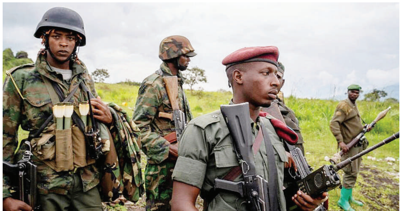
Waasi wa M23 wanaoripotiwa kuendelea kutekeleza mashambulizi dhidi ya raia Kaskazini Mashariki mwa Jamhuri ya Kidemokrasia ya Kongo (DRC), licha ya kutakiwa kusitisha mapigano.