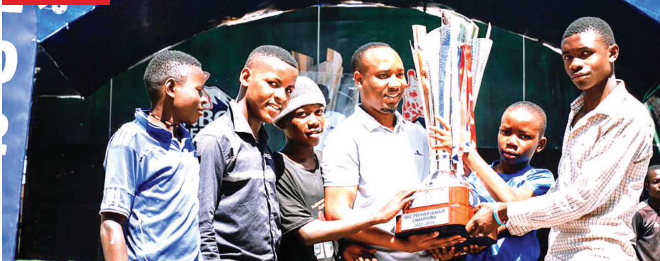
Baadhi ya mashabiki na wapenda soka wa Mkoa wa Mwanza wakipiga picha na Kombe la Ligi Kuu ya NBC ikiwa ni sehemu ya utaratibu wa Benki ya NBC ambayo ni Mdamini Mkuu wa Ligi Kuu Tanzania Bara, kuwapelekea wateja wake pamoja na mashabiki wa soka kombe hilo na kuwapa fursa ya kuliona na kupiga nalo picha.