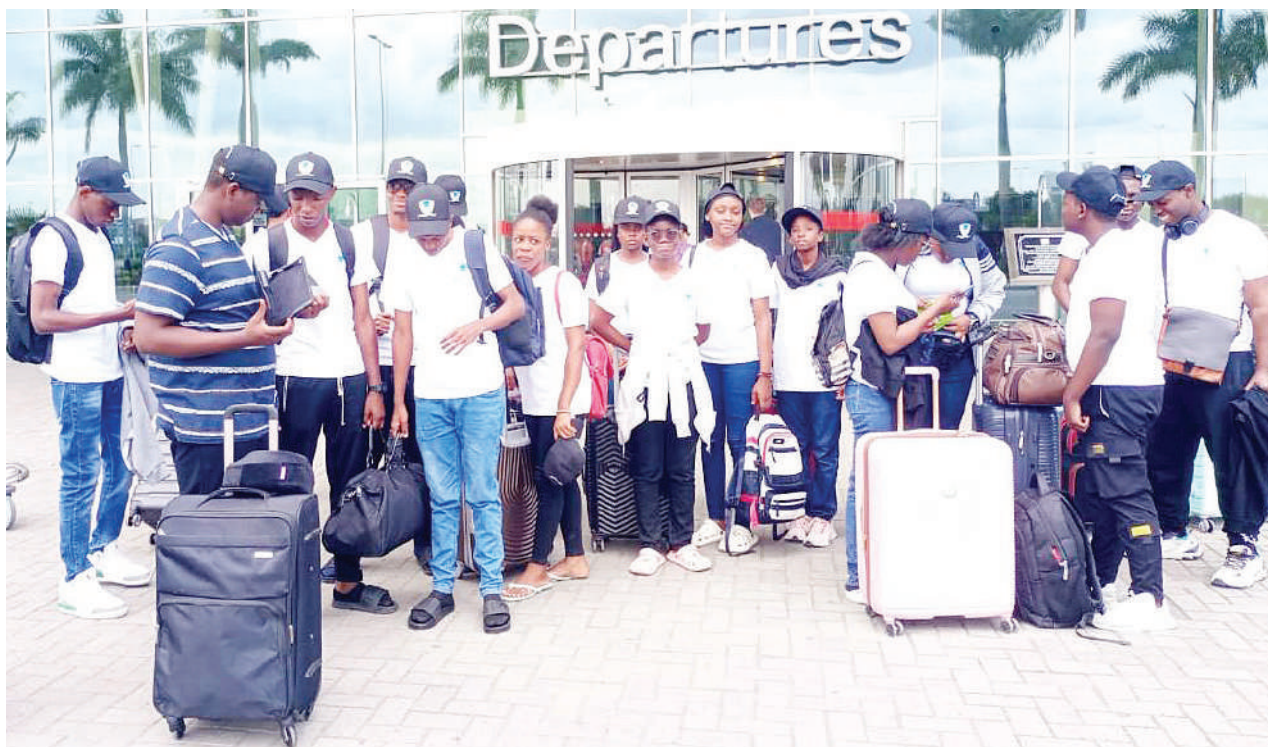
Wanafunzi 30 wa Shule ya Imperial ya Msolwa Chalinze mkoani Pwani, wakiwa katika Uwanja wa Ndege wa Kimataifa wa Julius Nyerere jijini Dar es Salaam juzi, kabla ya kuondoka kuelekea nchini Misri na Israel kwa ajili ya kujifunza kilimo na ufugaji wa kisasa.

CAG aliitaka serikali kujenga miundombinu mipya na kuiboresha iliyopo.