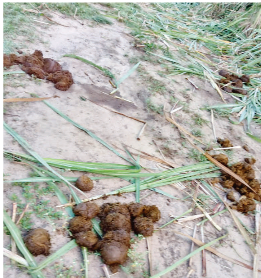
Tembo walipopita katika shamba la miwa la BSL wilayani Bagamoyo, mkoani Pwani hivi karibuni