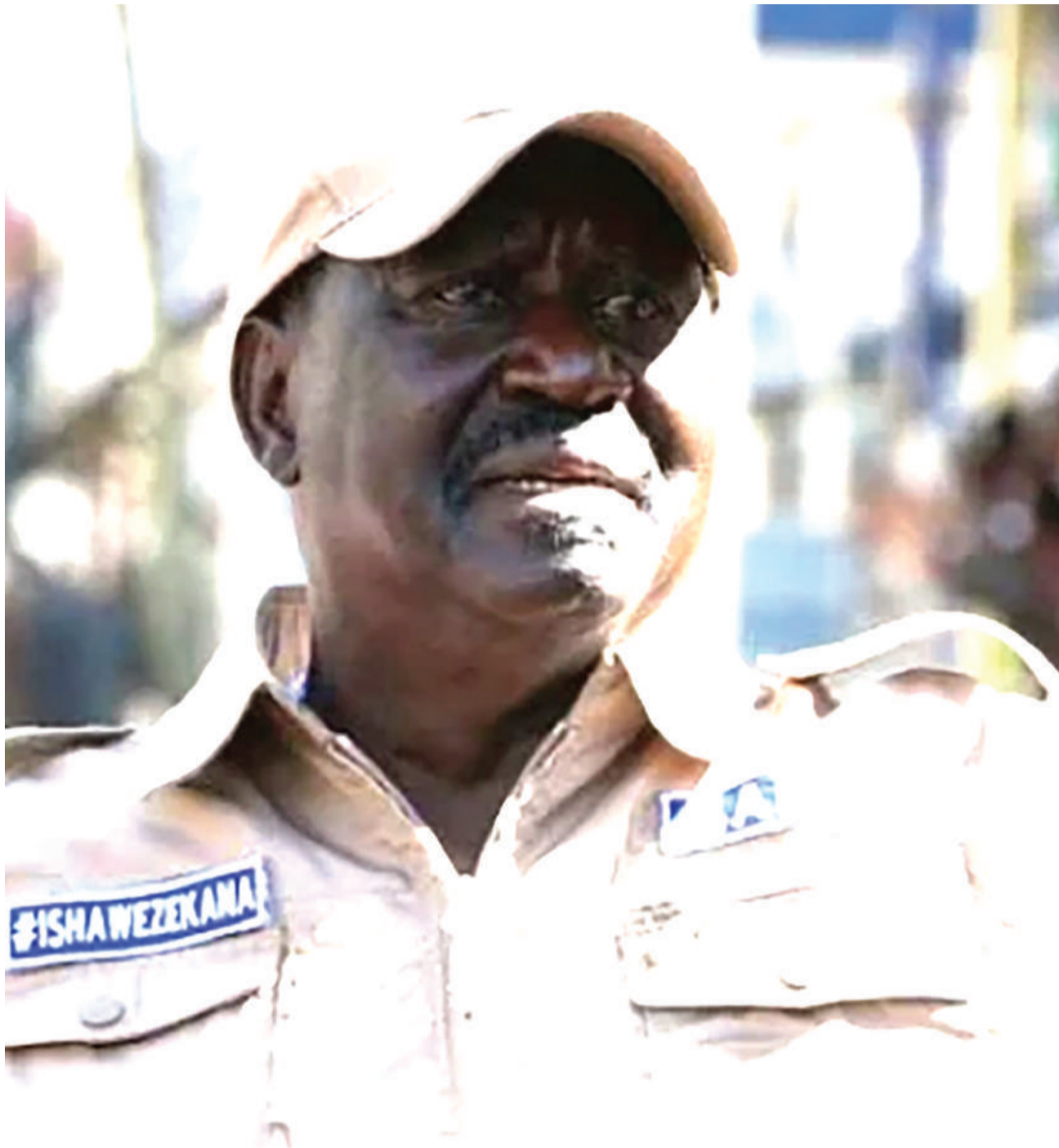
Raila Odinga.