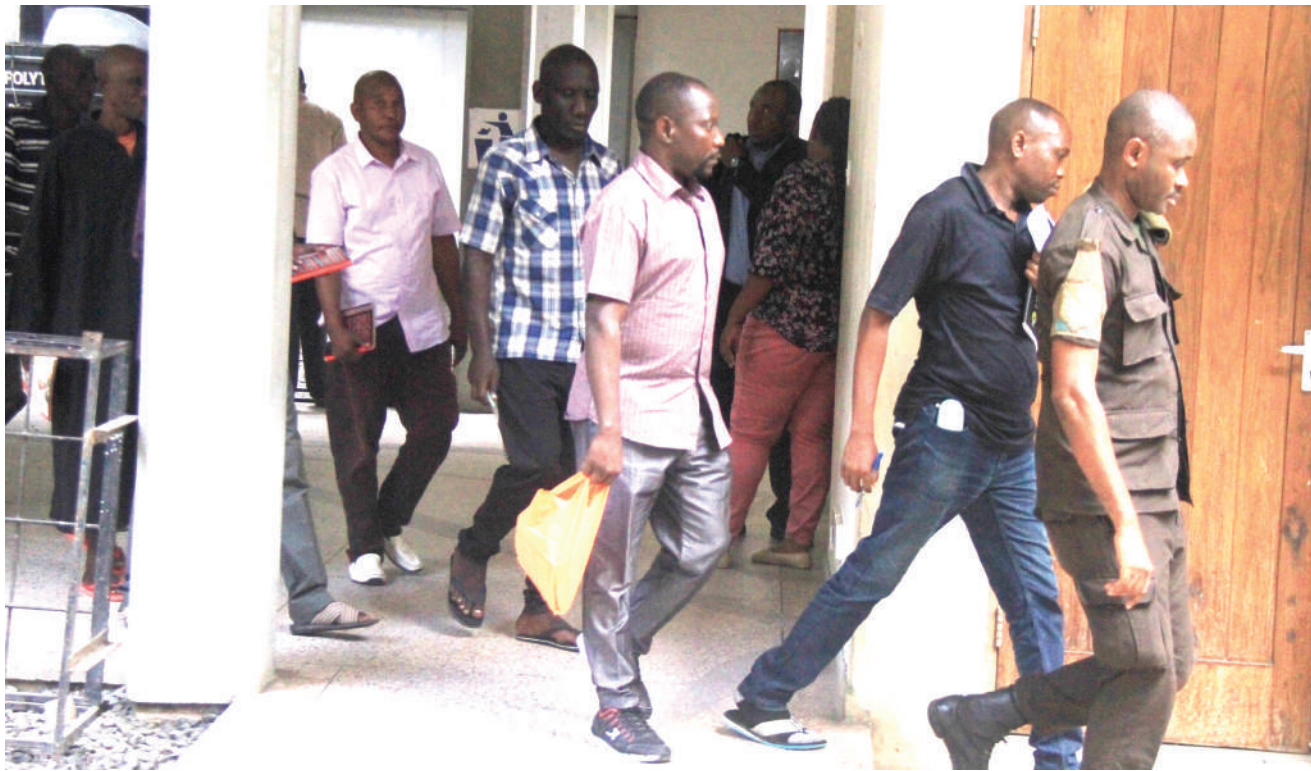
Watuhumiwa wa kosa la wizi wa fedha zaidi ya Sh. bilioni moja za Benki ya NMB, wakitoka katika Mahakama ya Hakimu Mkazi Kisutu jijini Dar es Salaam jana, kusikiliza mashtaka yanayowakabili.