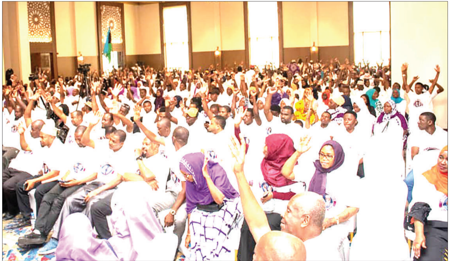
Kongamano la Vijana wa ACT- Wazalendo.

ahuweni baada ya kuja Rais Samia na kukumbusha kuwa hakuna utekeaji, wala watu kuokotwa miili iliyoharibika katika viroba na kwamba Watanzania wanafanya shughuli za kisiasa bila kukwamishwa. Tena wanayo haki ya kusema ya moyoni na pia kukusanyika na mikutano inaendelea hata kama wanatofautiana na CCM.