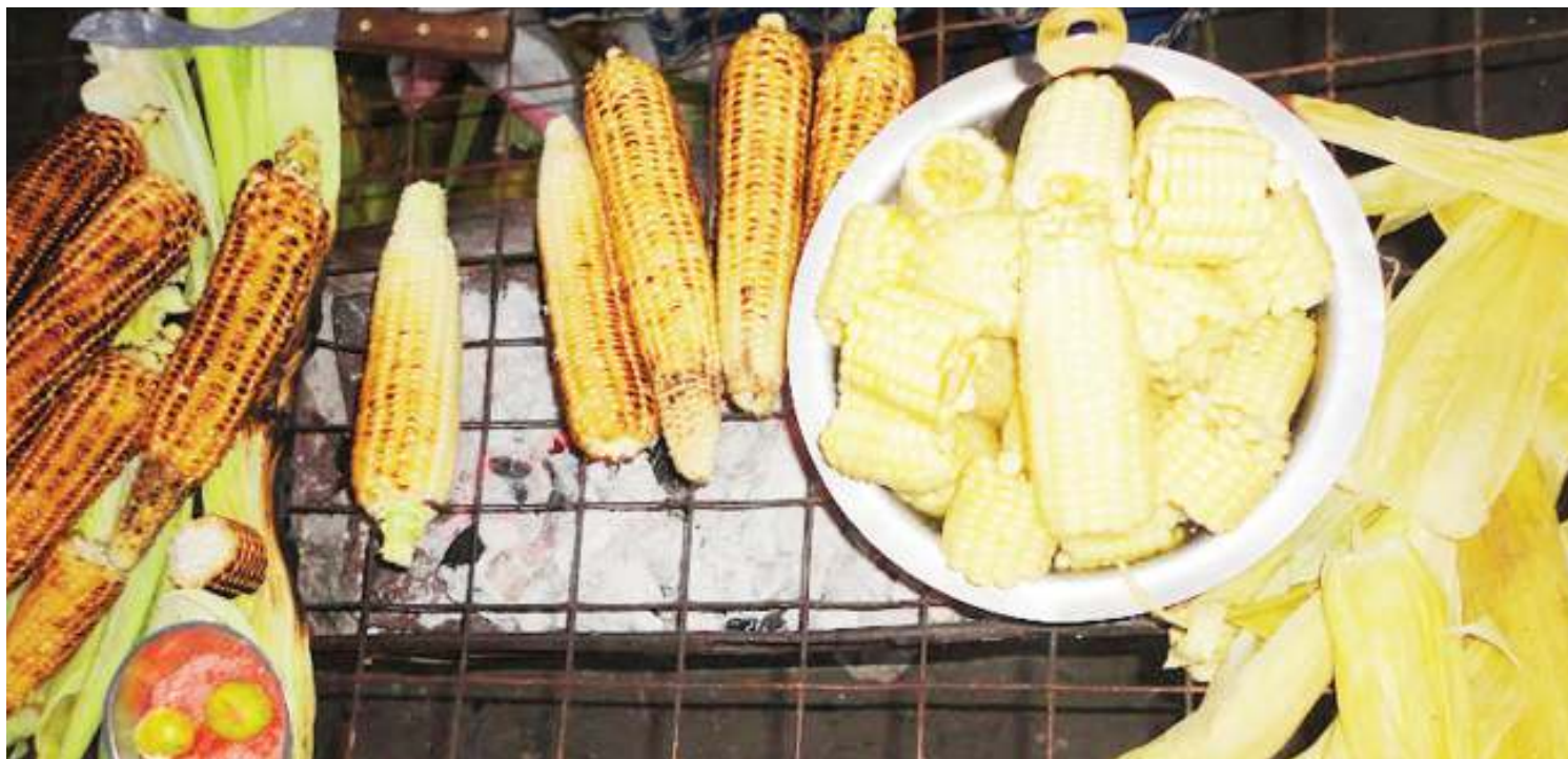
Biashara ya mahindi ikiendelea. PICHA ZOTE: MTANDAO.

• Wasifia kiungo wa 'pasi ndefu' • Mauzo yanalipa; ina afya tele • Ya kuchoma wanaume kona zote