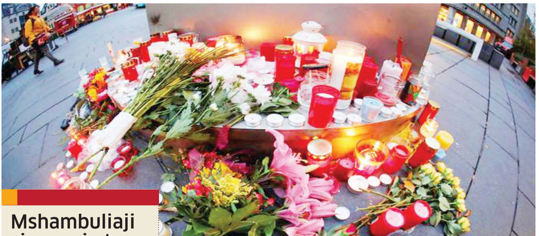
Mishumaa na maua ikiwekwa kuwakumbua waliouawa mji wa Halle Mashariki mwa Ujerumani.

Pakistani imesalia kuwa mshirika asiyeaminika katika vita vya Marekani dhidi ya wapiganaji wa Kiislamu. BBC