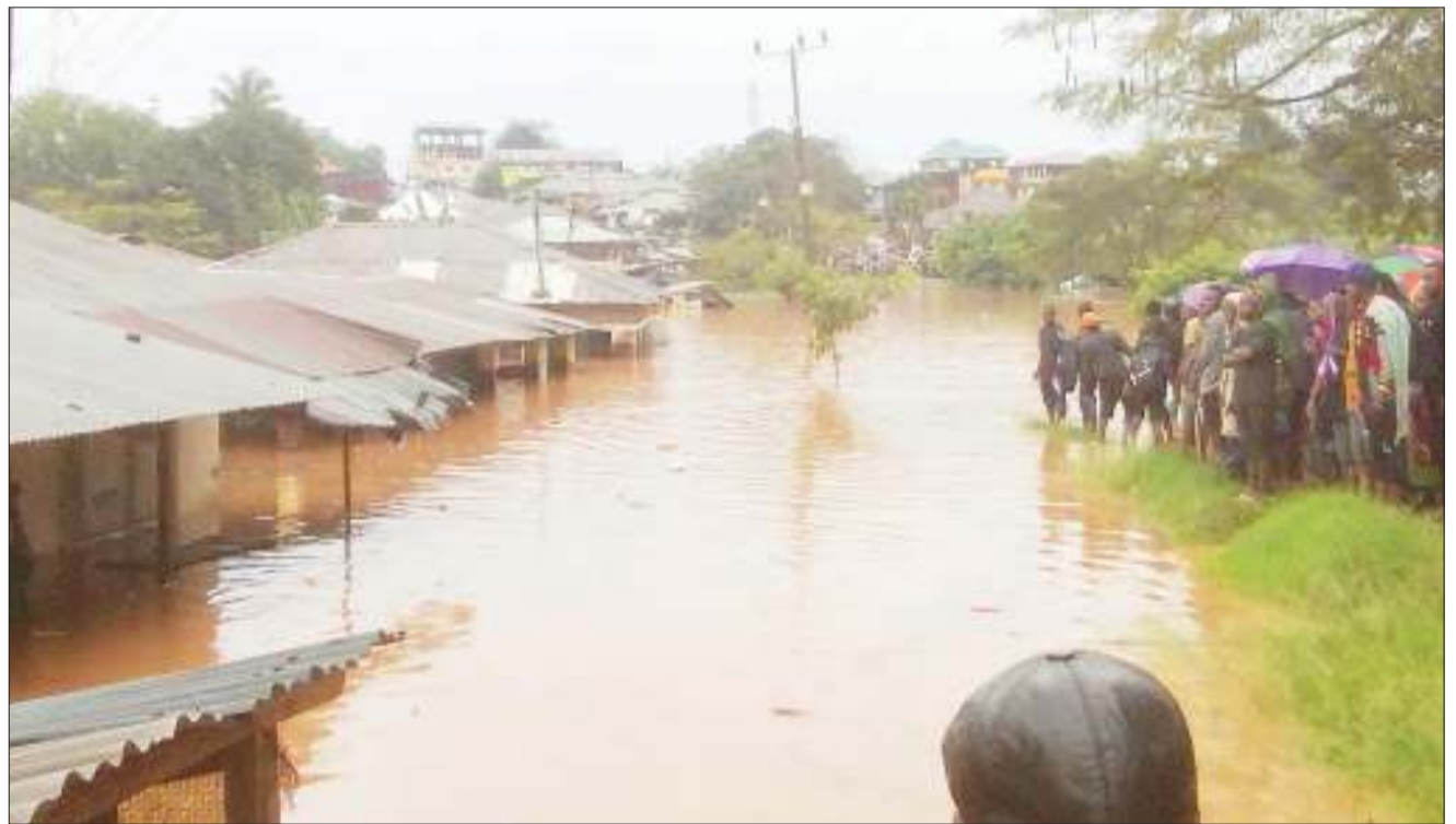
Wakazi wa Mji wa Muheza mkoani Tanga, wakiangalia maji ya mafuriko yaliyozizingira nyumba katika eneo la Mto Amtico, juzi, kutokana na mvua kubwa zinazoendelea kunyesha.