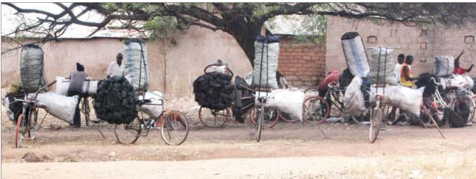
Wauza mkaa wakiwa wamejipumzisha chini ya mti majira ya mchana katika eneo la Kata ya Tinde, Halmashauri ya Wilaya ya Shinyanga Vijijini jana, wakiwa safarini kupeleka bidhaa hiyo, Shinyanga Mjini.