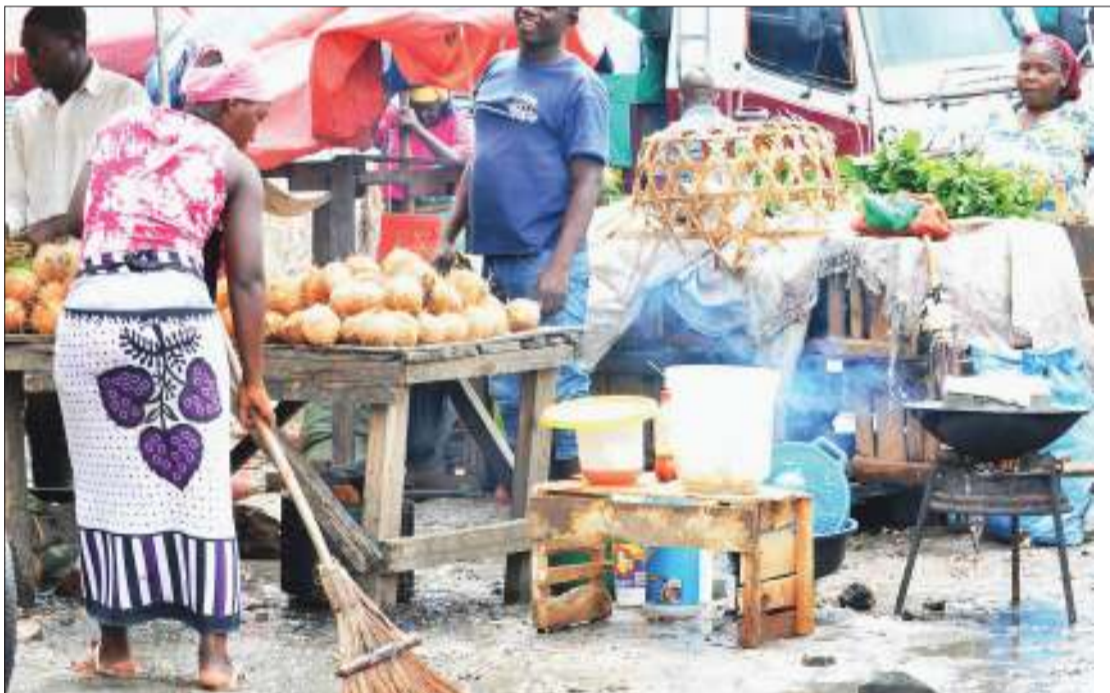
Mchuuzi wa mihogo ya kukaanga akifagia kuondoa maji yaliyotuma katika eneo lake la biashara, Mazense, kutokana na mvua zinazoendelea kunyesha jijini Dar es Salaam jana.