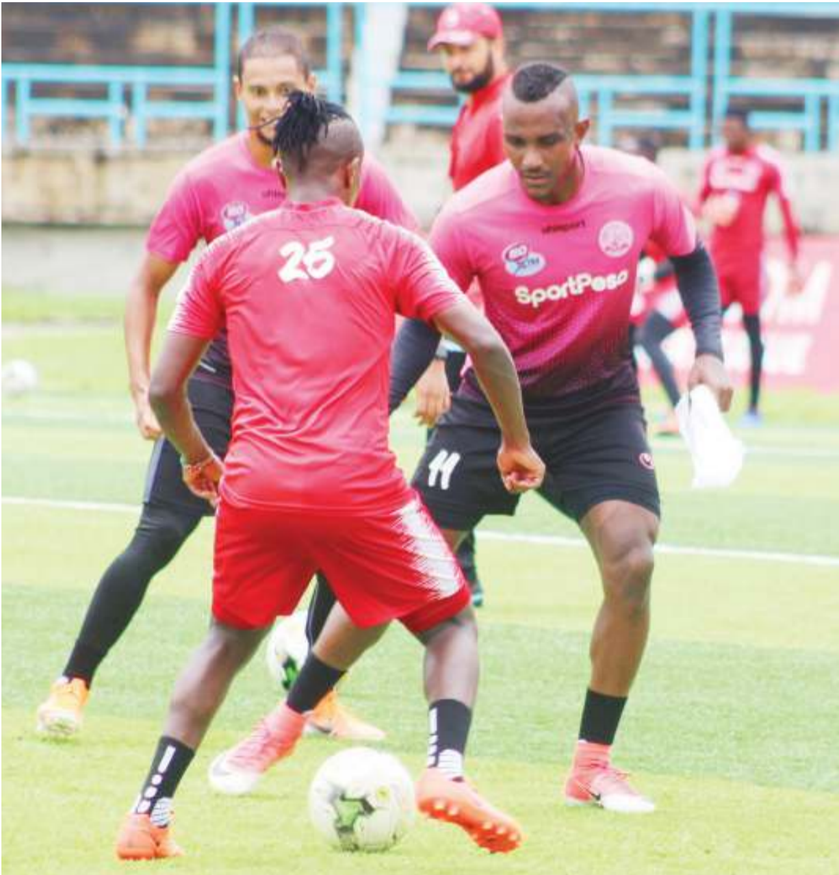
Wachezaji wa Simba wakiwa kwenye mazoezi ya timu hiyo kwa ajili ya kujiandaa na mechi ya kirafiki ya kimataifa dhidi ya Bandari FC kutoka Kenya itakayochezwa kesho kwenye Uwanja wa Taifa jijini Dar es Salaam.