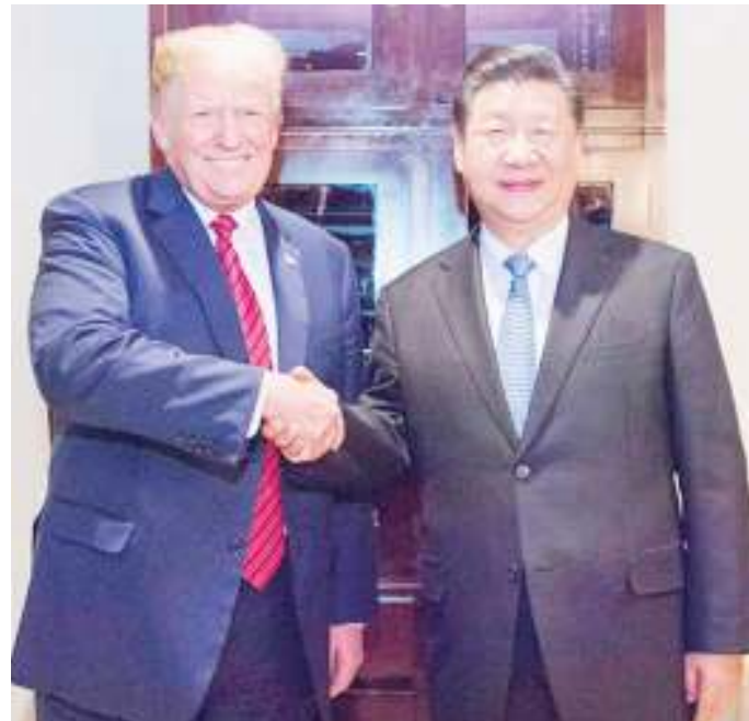
Marais, Xi Jinping wa China na Donald Trump wa Marekani.