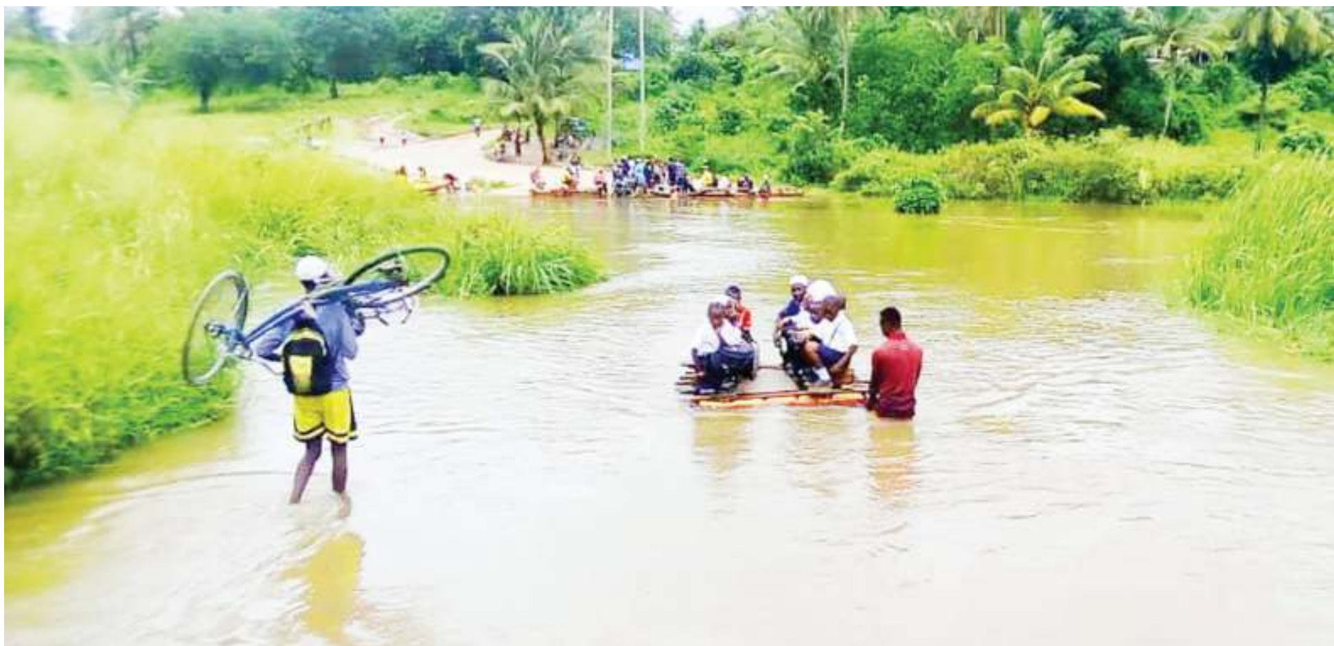
Picha mbili, zinazoonyesha tofauti ya uvushaji kabla ya kuwa na daraja kwa miaka 21 na baada ya kujengwa daraja jipya.

• Biashara sasa ni bodaboda • Bei viwanja juu, shule zajaa • Kijiji mpakan