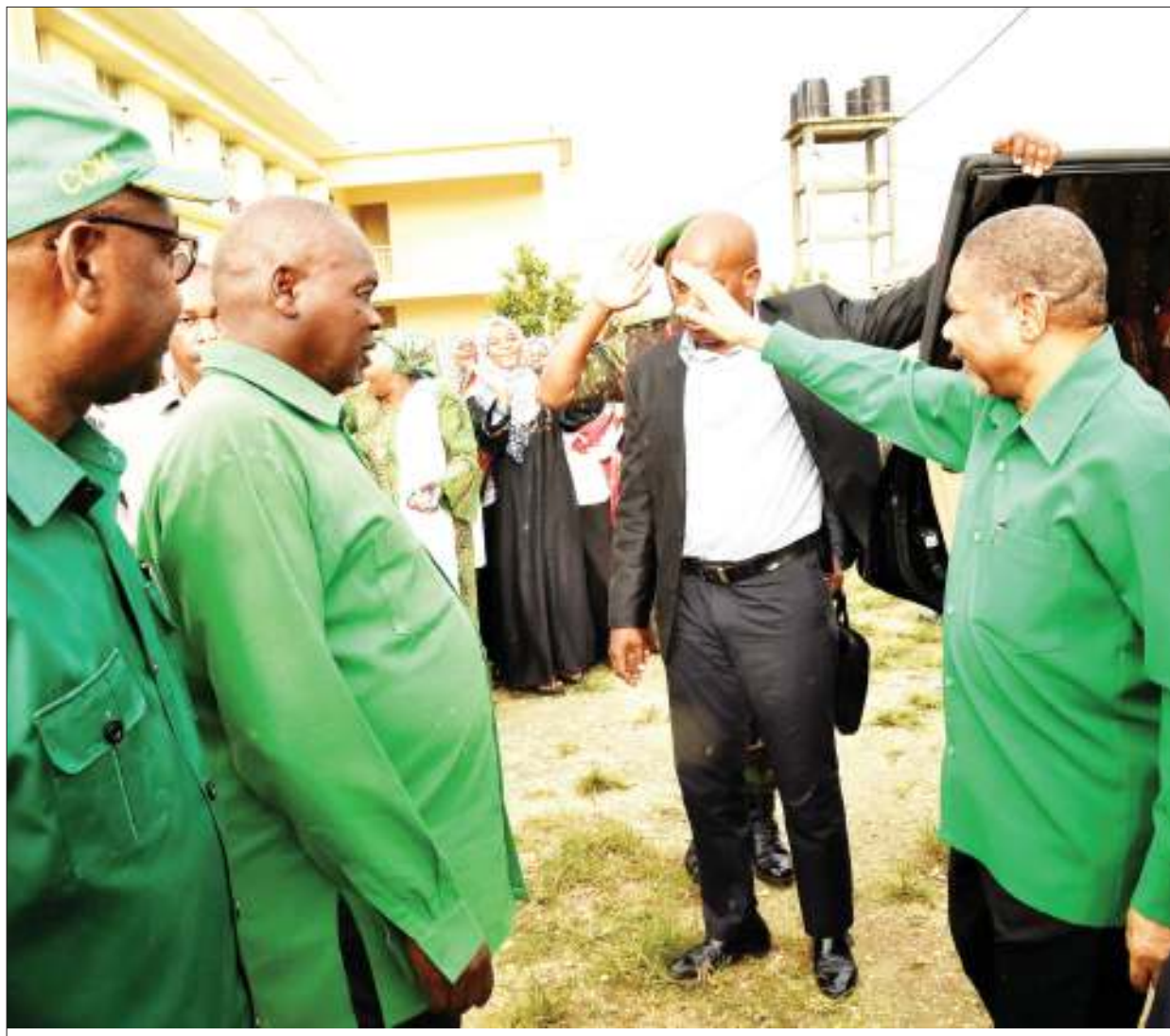
Rais wa Zanzibar na Mwenyekiti wa Baraza la Mapinduzi, Dk. Ali Mohamed Shein, akiwapungia mkono wananchi wa Wilaya ya Mkoani Kisiwani Pemba, alipowasili katika viwanja vya ukumbi wa Shule ya Sekondari ya Mohamed Juma Pindua, kuzungumza na wazee wa chama hicho, jana.