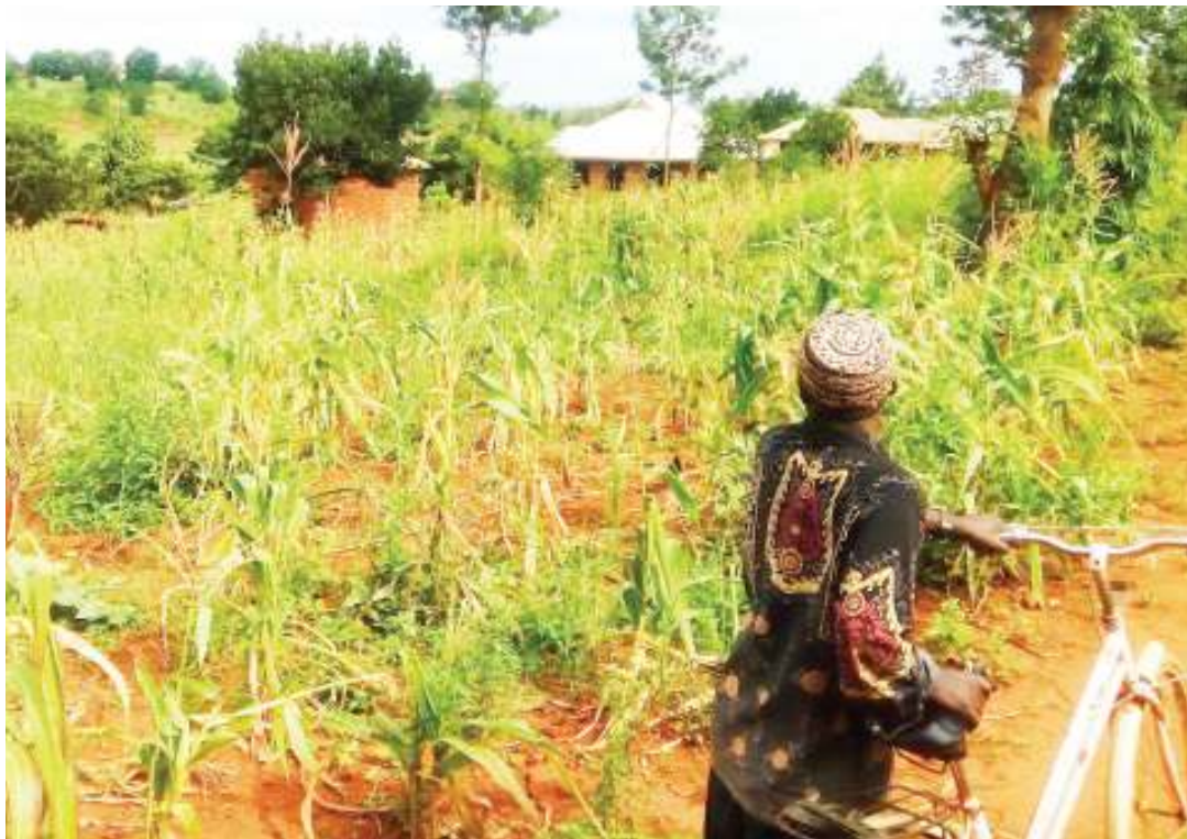
Hivi ndivyo hali ya mahindi ilivyokuwa Juni mwaka huu.

Tofauti na waliorudia kupanda mara mbili, wapo waliokata tamaa ya kurudia kupanda mbegu zilivyo-ooza mara ya kwanza, kutokana na kukosa pesa za kununua mbegu na kuandaa mashamba kama