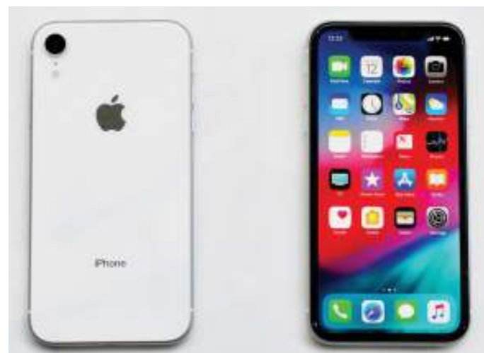
Simu aina ya Apple.