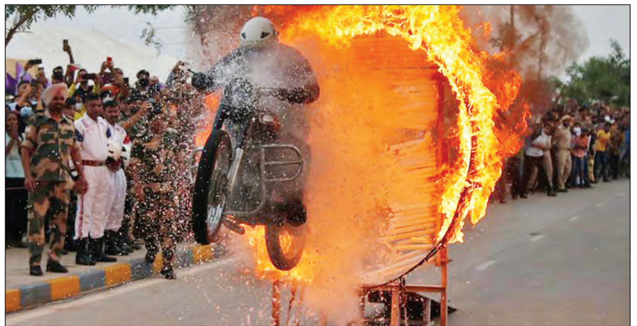
Askari wa Kikosi cha Usalama Mpakani (BSF) akiruka moto, kuonyesha umahiri wake wa kuendesha pikipiki wakati wa onyesho barabarani, kwenye maadhimisho ya miaka 75 ya Uhuru wa India, jijini Ahmedabad, nchini India.