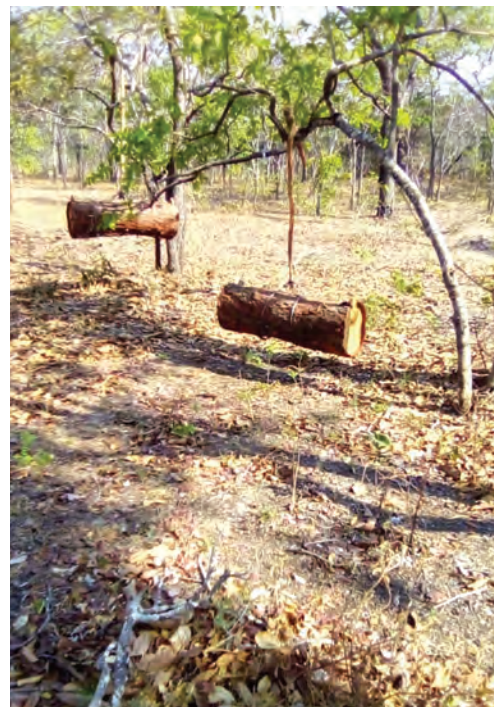
Baadhi ya mizinga yake anayomiliki

Akiwa na mtaji wa Shilingi 200,000, alidhani dumu la lita 20 ni Sh. 100,000, lakini anababwaa kulinunua kwa watoto hao kwa Sh. 70,000 kila moja na hivyo