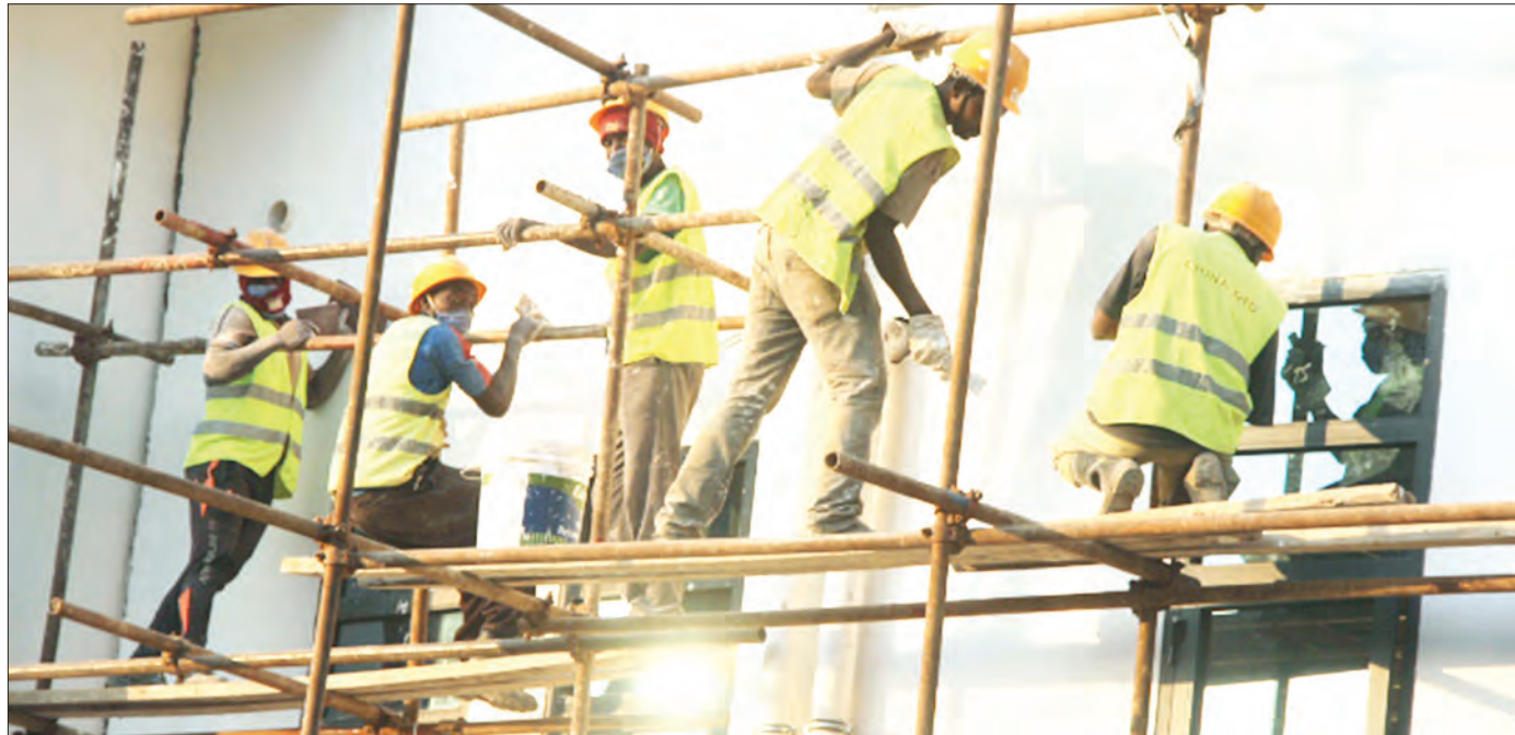
Mafundi wakiendelea na ujenzi wa moja ya majengo ya kituo cha pamoja cha Forodha kwenye mpaka wa Tanzania na Malawi wa Kasumulu wilayani Kyela, mkoani Mbeya, juzi.

Alisema mafanikio ya ujenzi wa shule hizo unatokana na michango ya hiari ya wananchi katika kuharukisha sekta ya elimu wilayani humo, pamoja na mipango thabiti ya wilaya katika kuondokana na kikwazo kwa wanafunzi wanaokosa elimu kwa sababu ambao zipo ndani ya uwezo wa wilaya.