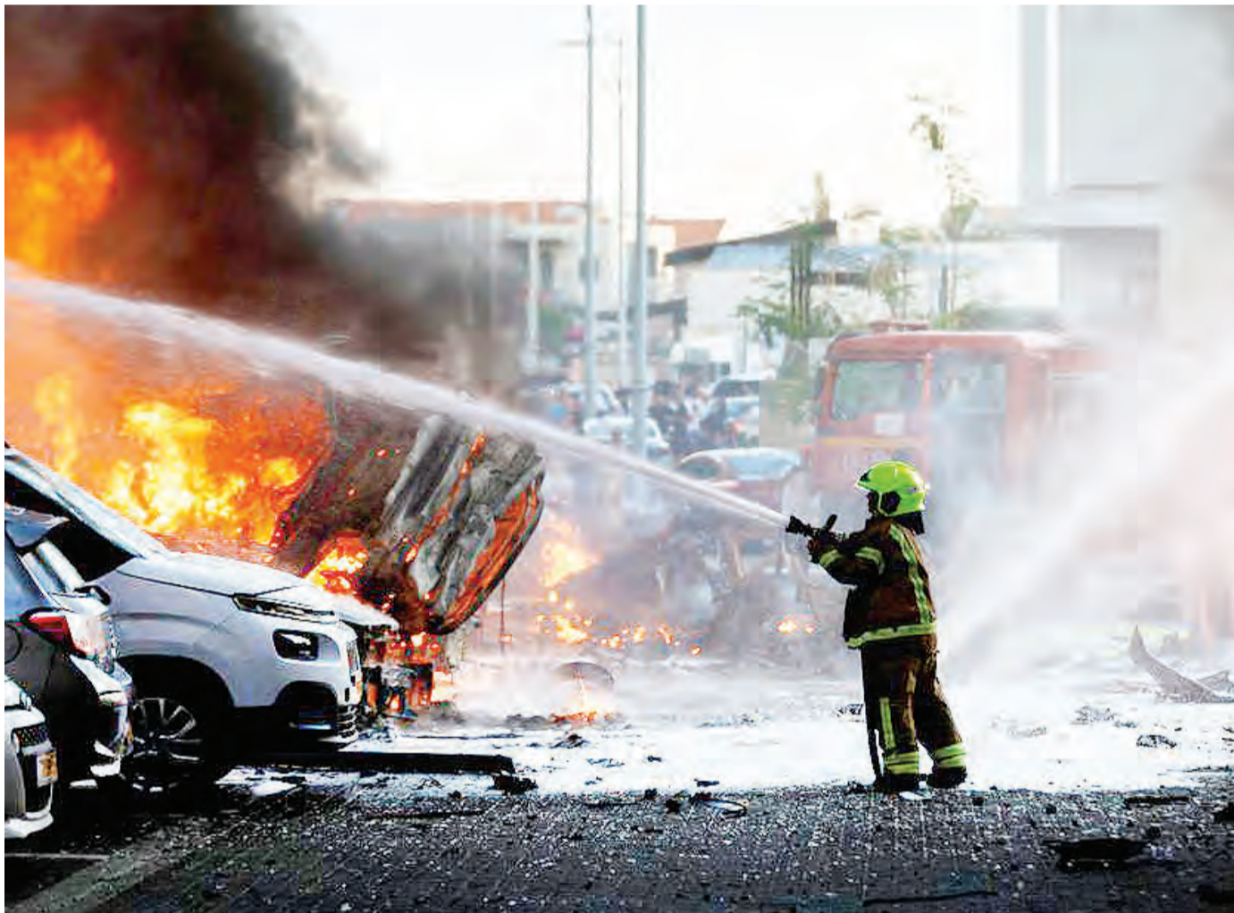
Kikosi cha zimamoto kikiuzima moto uliotokana na mashambulizi.

Taarifa ya pamoja ya Shirika la Kimataifa la Uhamiaji na Shirika la Umoja wa Mataifa la Kuhudumia Wakimbizi, ilisema "Afghanistan inapitia mzozo mbaya wa kibinadamu pamoja na changamoto kadhaa za haki za binadamu, hasa kwa wanawake na wasichana." VOA