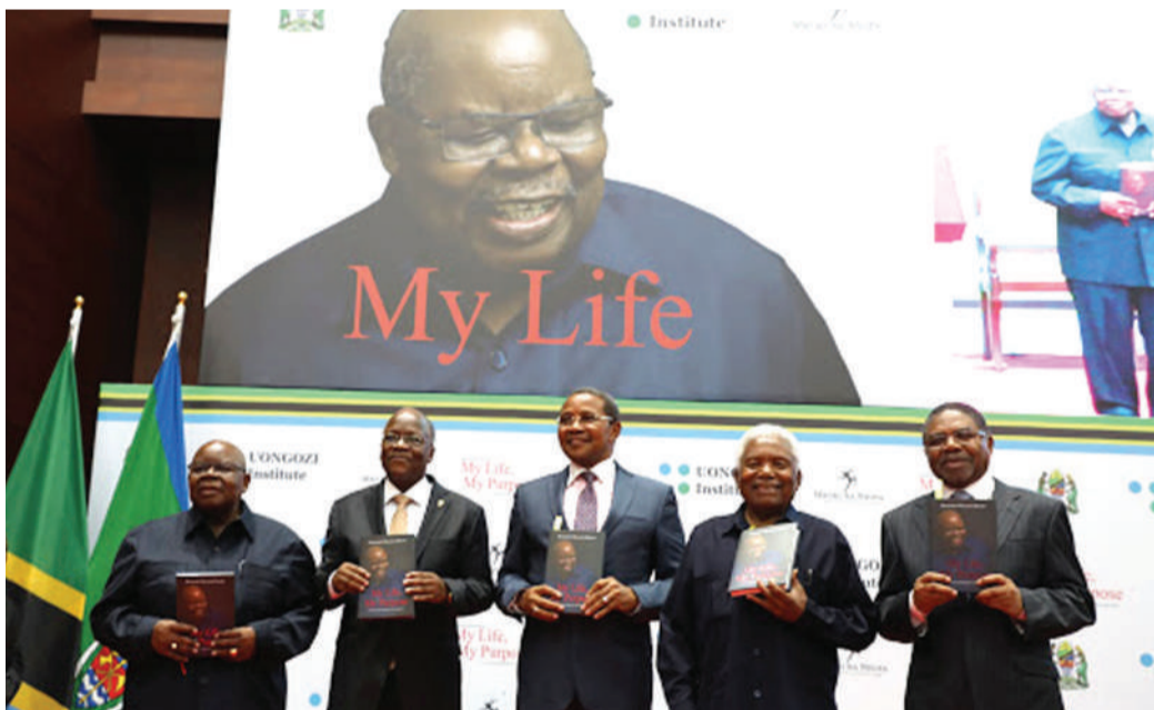
Ulikuwa uzinduzi wa kitabu cha historia ya maisha ya mstaafu Benjamin Mkapa, jijini Dar es Salaam mwaka huu.

Akitoa taarifa baada ya kumwondoa katika chama, Katibu Mwenezi na Itikadi wa CCM, Humphrey Polepole, alisema adhabu mbalimbali zingeweza