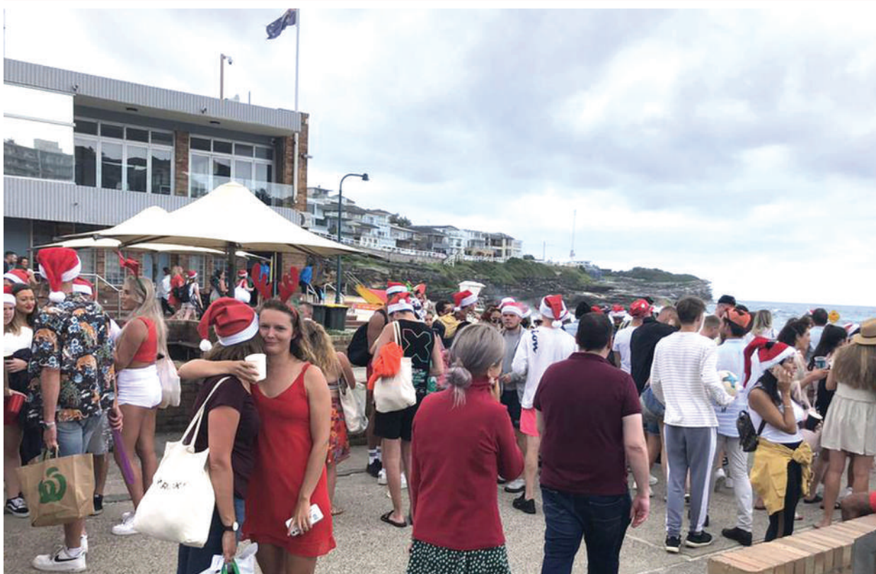
Wakazi wa Australia waliotembelea ufukwe wa Bronte mjini Sydney siku ya Krismasi. Wasiwasi umeongezeka hivi sasa kufuatia aina mpya ya kirusi cha corona, kilichogunduliwa kwa mara ya kwanza Uingereza, na wataalamu wanaamini kwamba kinasambaa kwa kasi.