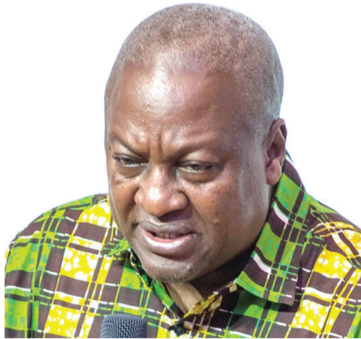
John Mahama, rais wa sasa wa Ghana