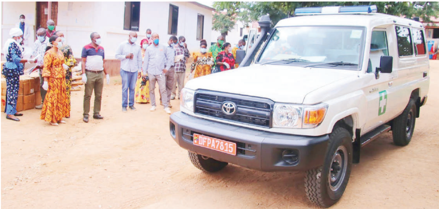
Tukio la kukabidhiwa gari la wagonjwa kwenye Kituo cha Afya Tinde, ambako ndiyo mbadala wa huduma ya tiba zinakopatikana kwa wanakijiji wa Masunula.