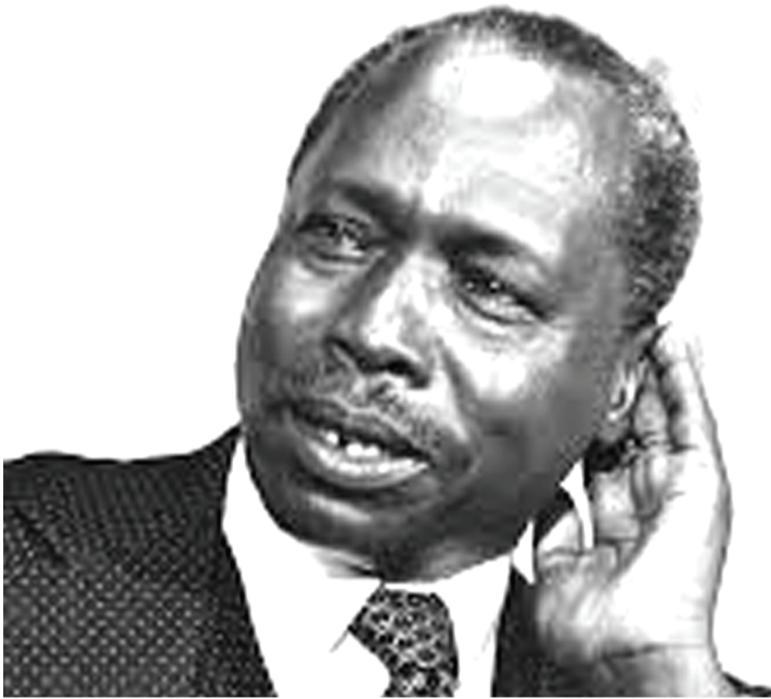
Daniel Arap Moi, enzi za uhai wake.