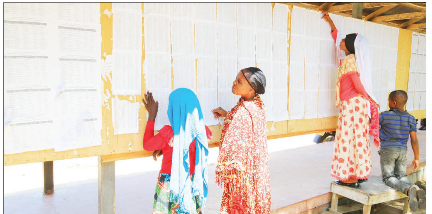
Baadhi ya wanafunzi na wazazi wakiangalia majina ya wanafunzi wa darasa la saba mwaka huu, waliochaguliwa kujifunza na masomo ya sekondari katika shule mbalimbali, majina hayo yamebandikwa nje ya ofisi ya Halmashauri ya Jiji la Dodoma.

“Tunaomba serikali itusaidie katika kulisukuma jambo hili. Hii fursa ya kwenda Korea Kusini kwa ajili ya mafunzo tuipele kwa maslahi ya taifa letu, ili kuufikia uchumi wa viwanda kama ambavyo serikali ya awamu ya tano imekuwa ikitamani,” alisema Dioniz.