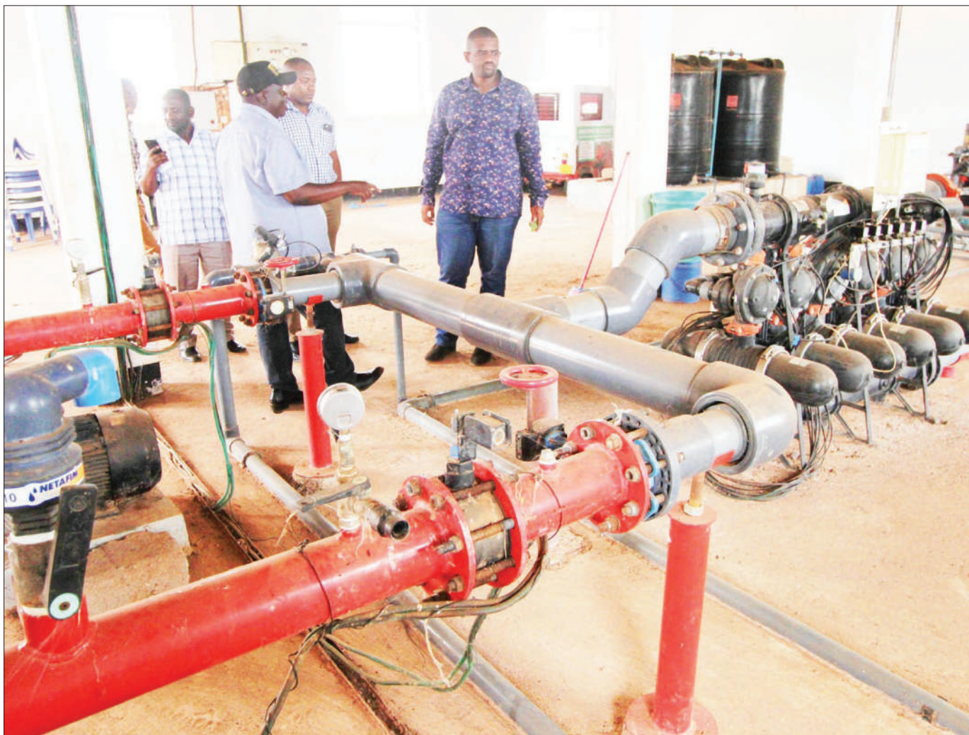
Naibu Waziri Ofisi ya Rais Menejimenti ya Utumishi wa Umma na Mbunge wa Jimbo la Chamwino, Deogratus Ndejemi (kulia), akiwa na baadhi ya wakulima wa mradi wa shamba la zabibu akikagua mitambo ya kusukuma maji na mbolea kwa njia ya matone iliyoopo kwenye eneo la Kijiji cha Chinangali II, Wilaya ya Chamwino mkoani Dodoma, juzi.