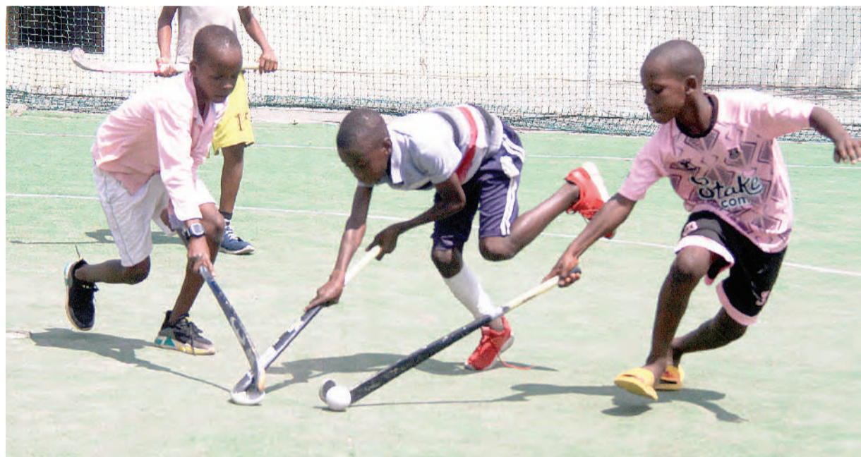
Watoto kutoka sehemu mbalimbali wakicheza mpira wa magongo katika viwanja vya JKM Park, Dar es Salaam, juzi.

"Tuko tayari kwa ajili ya kulipa kisasi, tunaamini siku ya kesho (leo) tutawapa furaha mashabiki wetu kwa kuvuka hatua hii na kusonga mbele hadi kucheza makundi," alisema Mbombo.