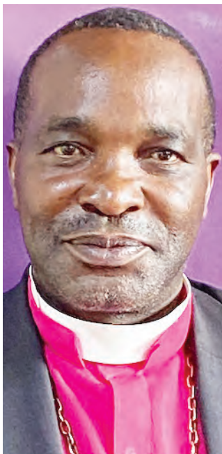
Askofu Dk. George Fihavango