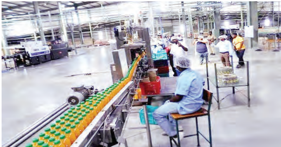
Shughuli za uzalishaji kiwandani zikiendelea, eneo mojawapo ambalo Rais Dk. Samia Suluhu Hassan, anapigania uwekezaji uongezeke, kupitia sera ya PPP.