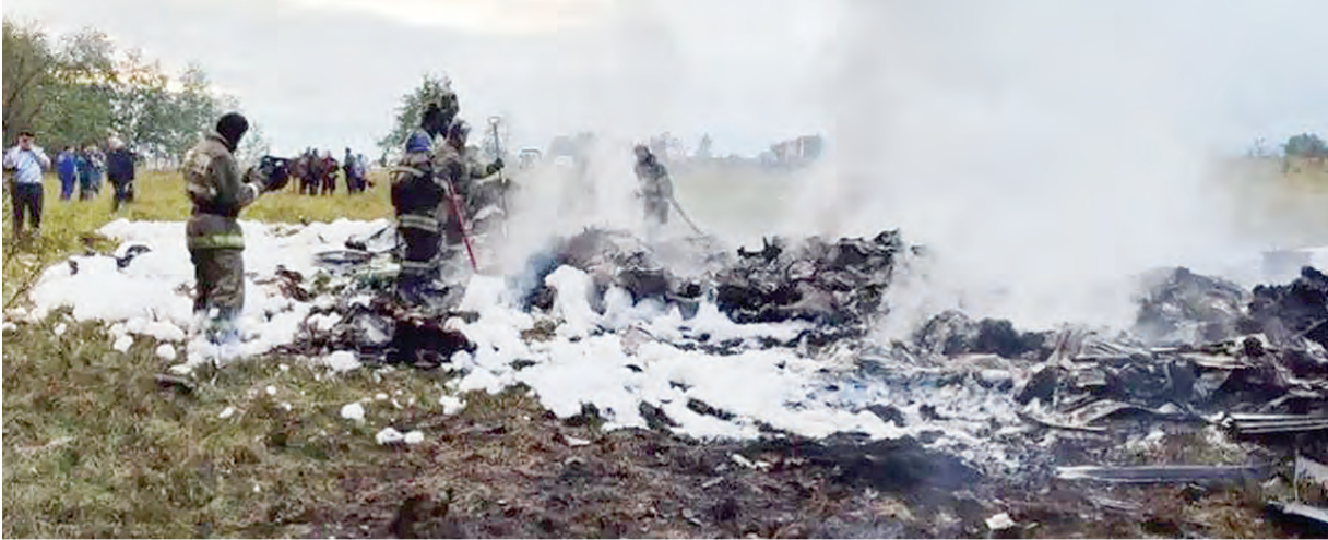
Mabaki ya ndege inayoaminika alikuwamo Mkuu wa Kundi la Wagner, Yevgeny Prigozhin.