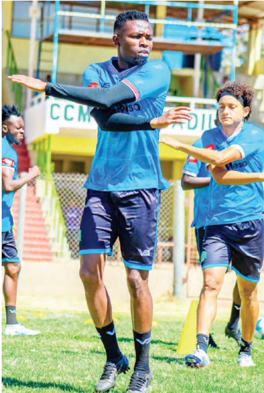
Wachezaji wa Singida Fountain Gate, wakifanya mazoezi kwa ajili ya kujiandaa na mechi ya marudiano ya Kombe la Shirikisho Afrika dhidi ya JKU ya Zanzibar itakayochezwa keshokutwa. Tayari kikosi hicho kimeshatua Dar es Salaam.

Pia ameomba serikali iwasaidie kuwalipia ushuru ili wafanikiwe kupata vifaa vyao vya michezo ambavyo vimekwama bandarini kutokana na kukosa fedha za kuli-pa ushuru.