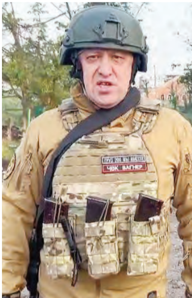
Kiongozi wa Wagner, Yevgeny Prigozhin.

kidole serikali ya Russia kwa kifo hicho na wengine wameitupia lawama Ukraine kuwa nyuma ya tukio hilo.