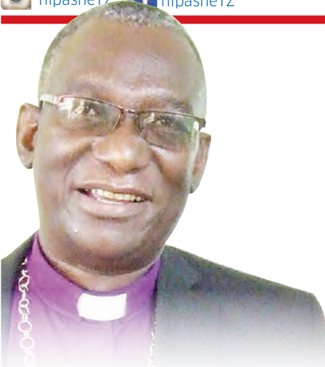
Askofu Dk. Fredrick Shoo