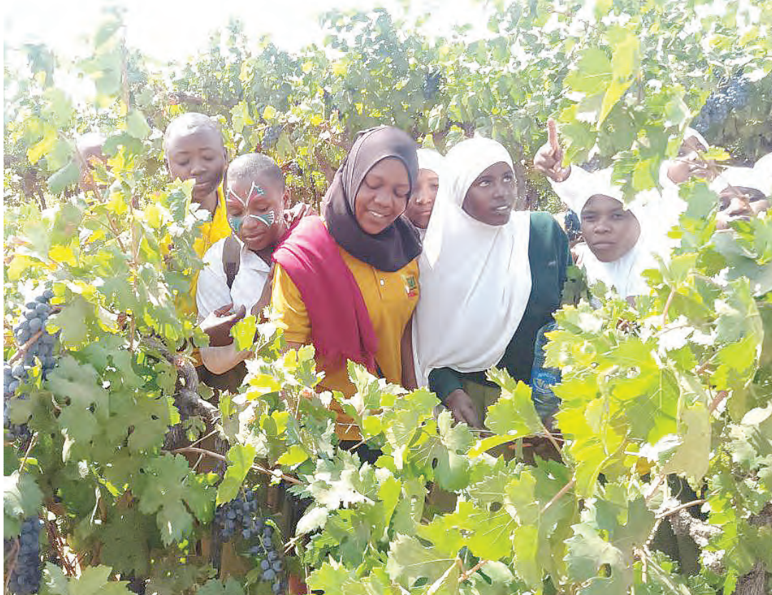
Ofisa Kilimo wa TARI Makutupora, akiwa na wanafunzi katika moja ya shamba la zabibu la kituo hicho. Picha nyingine , zabibu ikiwa imestawi shambani.

Saada anasema, tayari wame-shafanyia utafiti mbegu za zabibu na sasa zinazwa kwa wengi katika maeneo mbalimbali nchini, hivyo nao tayari wameshapata mwarobaini wa kuhakikisha wakulima wanafanya kilimo