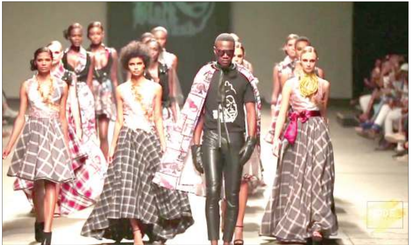
Vijana wakiwa katika maonyesho ya mitindo mbalimbali ya mavazi.