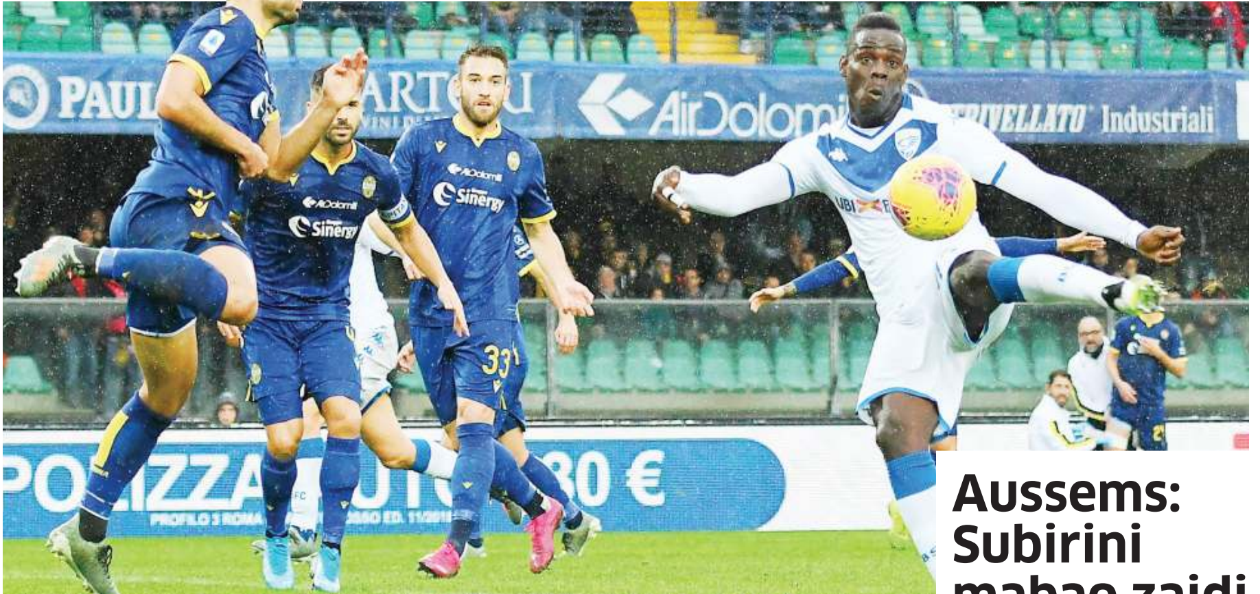
Mshambuliaji 'mtata' wa Brescia, Mario Balotelli akijaribu kufunga kwenye mechi ya Serie A wakati wakilala 2-1 dhidi ya Verona, na kukasirika kwa kitendo cha kuitwa nyani juji. HABARI UK. 29.