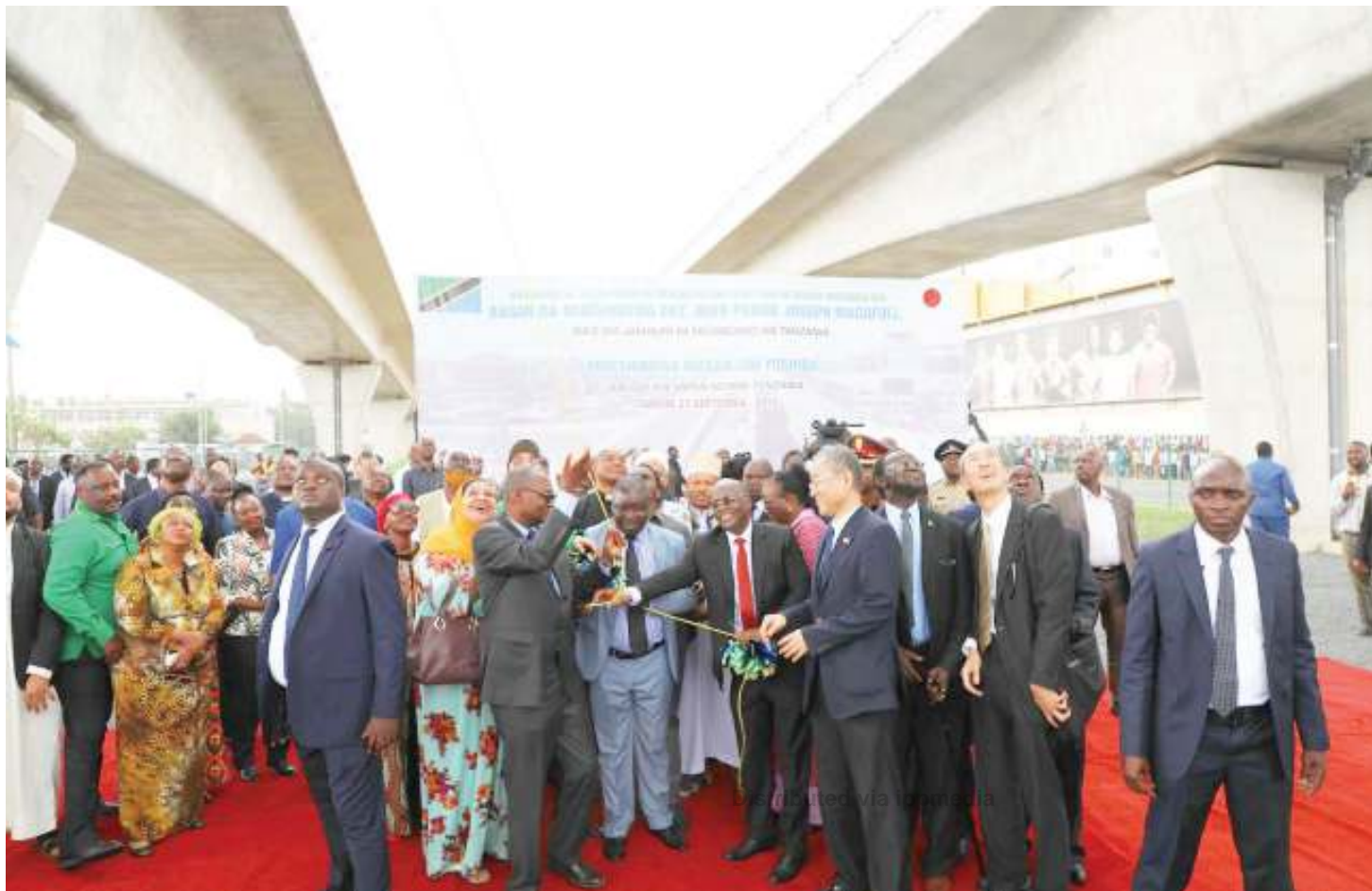
Rais Dk. John Magufuli akizindua ujenzi wa Daraja la Mfugale jijini Dar es Salaam, ambalo ujenzi wale ulianza akiwa Waziri wa Ujenzi.