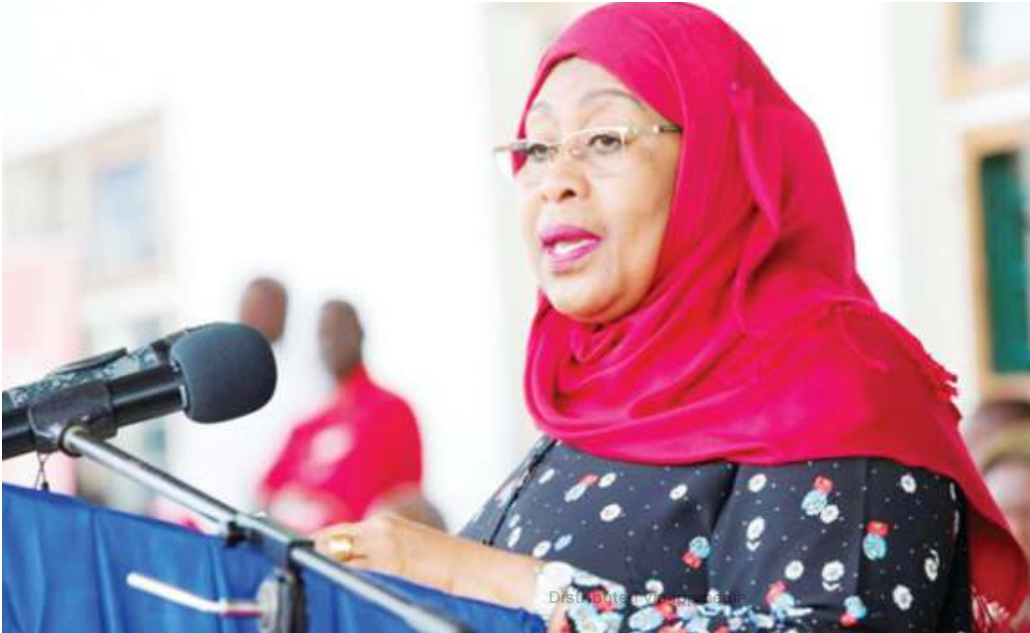
Makamu wa Rais, Samia Suluhu Hassan.