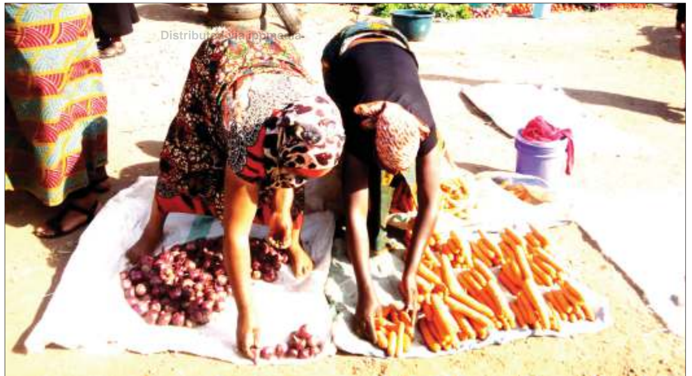
Wafanyabiashara wadogo maarufu machinga wakipanga bidhaa zao chini, katika eneo la Mianzini, jijini Arusha jana, kwa ajili ya kuwauzia wapita njia.

Mrema alipofuatwa kupata ufafanuzi wa jambo hilo, hakutoa ushirikiano badala yake alitimua mbio na kuingia kwenye gari na kutokomea kusikojulikana na kuwaacha waandishi waliokuwa wamejaza na katika hoteli ya Impala wakishangaa.