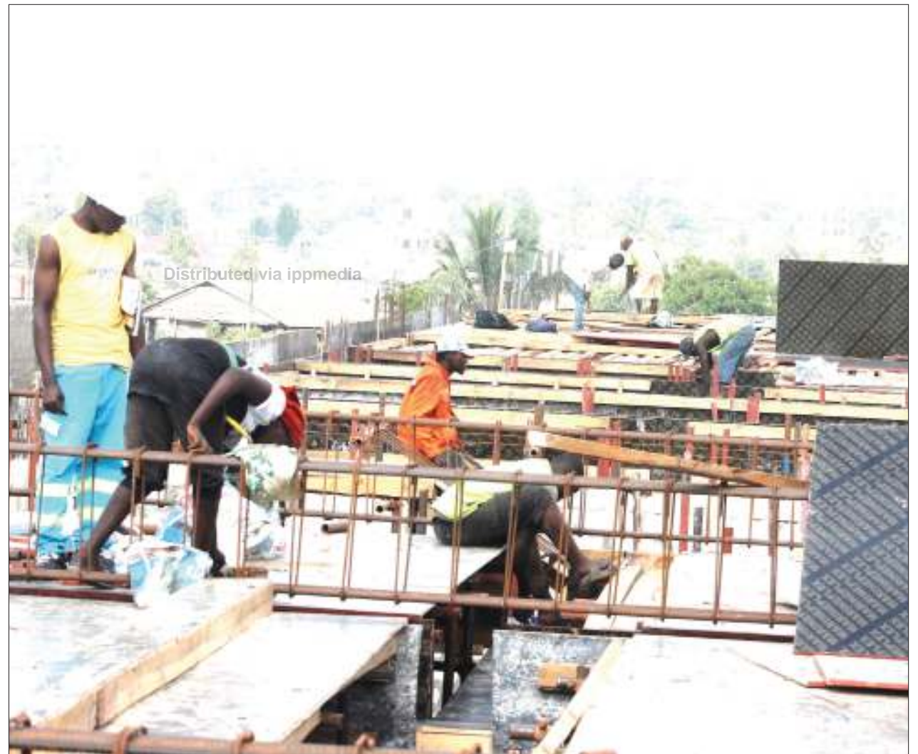
Mafundi wa Shirika la Nyumba la Taifa (NHC), wakiendelea na ujenzi wa jengo la machanjo ya kisasa, iliyoopo eneo la Vingunguti, jijini Dar es Salaam jana.

Hata hivyo, mshtakiwa alifanikiwa kulipa kiasi hicho cha fedha na kuachiwa huru.