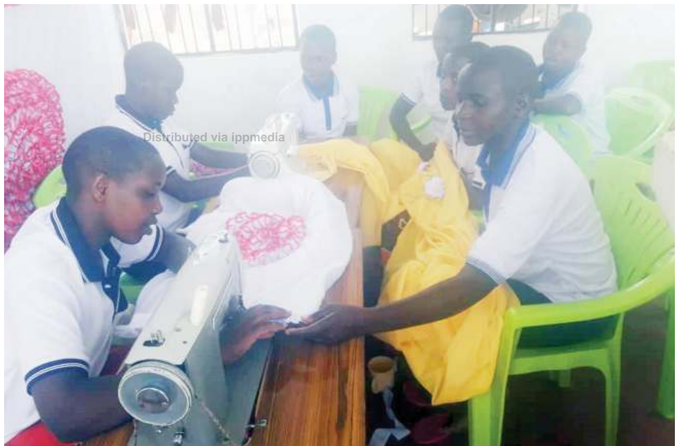
Baadhi ya wasichana waliokimbia vitendo vya ukatili nyumbani kwao na kulelewa na Shirika la Matumaini kwa Wanawake na Wasichana Tanzania (Hope For Girls And Women Tanzania), lililopo Mugumu Serengeti mkoani Mara, wakijifunza kushona nguo juzi.

Alisema kuna changamoto ya uelewa katika jamii kuhusiana na huduma za kibenki zinazotolewa na taasisi za fedha za kiislamu ikilinganishwa na benki zingine.