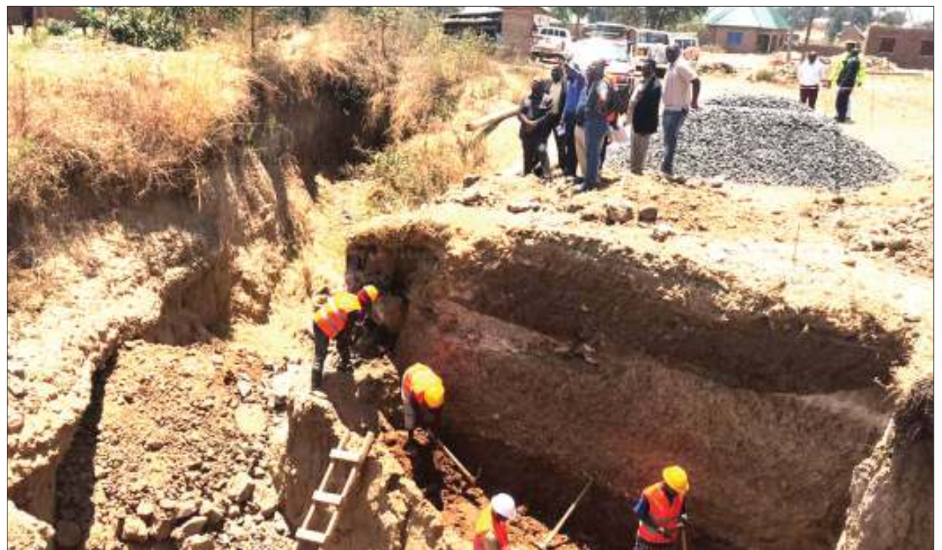
Mafundi wakiendelea na kazi ya kuchimba msingi kwa ajili ya ujenzi wa daraja katika Kata ya Itezi, jijini Mbeya mwishoni mwa wiki, wakati wajumbe wa Kamati ya Ulinzi na Usalama ya Mkoa huo, pamoja na Maofisa wa Wakala wa Barabara za Mijini na Vijijini (Tarura) mkoa, walipotembelea na kukagua baadhi ya miradi.

Alisema wanahabari wengi wamesahau misingi ya kazi zao na badala yake kukubali kutumika na watu wachache wenye malengo binafsi na matokeo yake kuleta chuki ndani ya jamii.