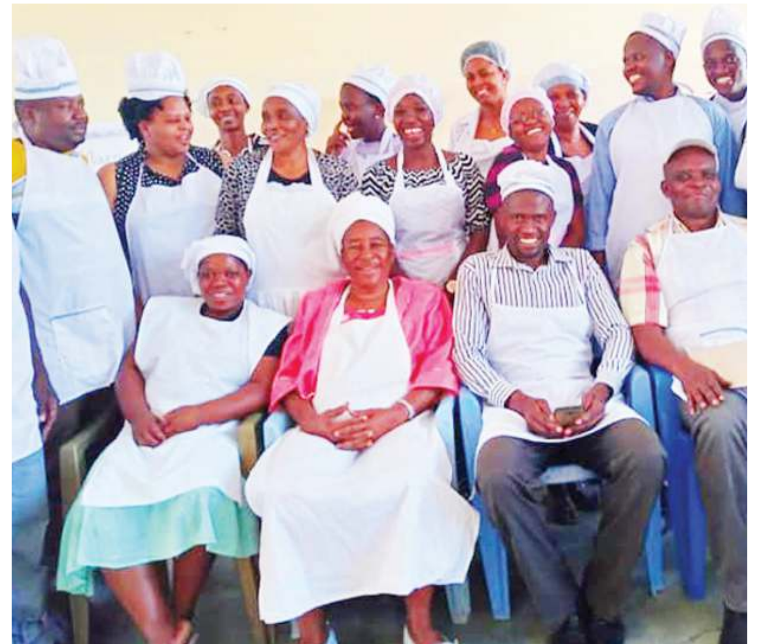
Baadhi ya wahitimu wa mafunzo maalumu ya ujasiriamali yanayoendesha na SIDO.

roshe, usindikaji mihogo na ukamuaji mafuta ya kula kutokana na michikichi;