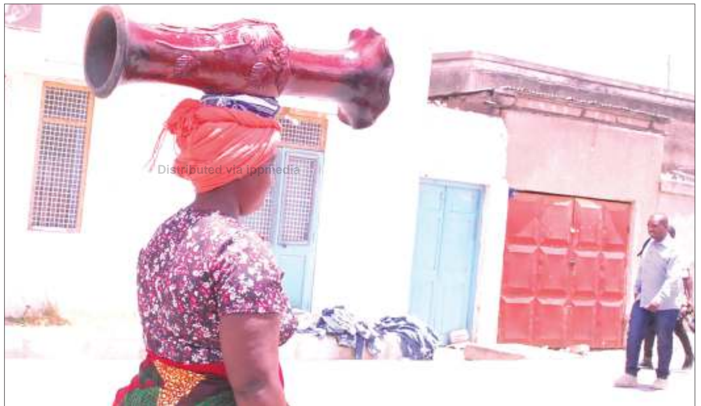
Mchuzi wa vyungu vya kuwekea maua akisaka wateja katika Mtaa wa Makole jijini Dodoma wikiendi.

Simon alisema Tanesco walikuwa kimya ndiyo maana wateja wasio waaminifu wametumia nafasi hiyo kufanya uhalifu huo wa kuiba umeme.