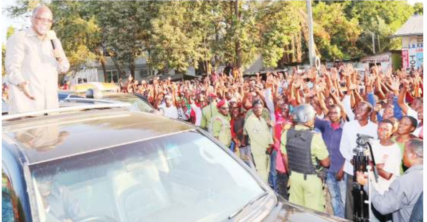
Rais John Magufuli, aliposalimiana na wakazi wa Mwanza.

Anataja miradi ya elimu Mwanza, kwamba Dk. Magufuli, ameiboresha mjini hadi vijijini, kwa kujengwa madarasa shule za msingi na sekondari ngazi ya kata, huku ikitolewa bure kuanzia elimu ya msingi, hadi sekondari kidato cha nne.