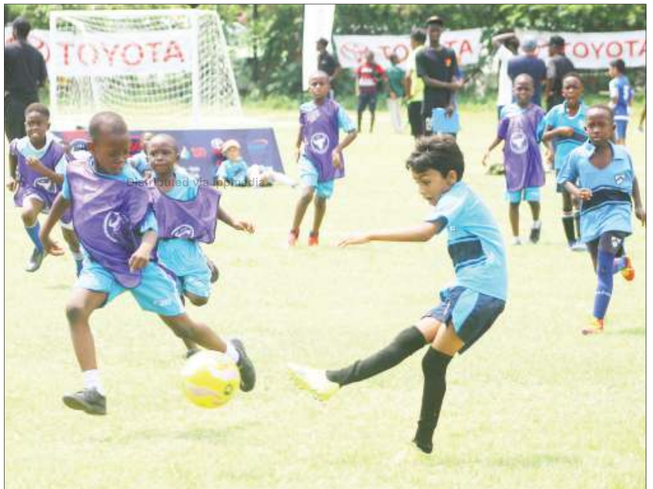
Wachezaji wa timu ya watoto ya Capstone ('waliovaa bips'), na wachezaji wa timu ya Bleubulnec, wa chini ya umri wa miaka 13, wakiwania mpira wakati wa mashindano ya Day Youth Cup, yaliyofanyika katika viwanja vya Gymkhana Dar es Salaam juzi. PICHA: JUMANNE JUMA

Kilimanjaro Queens ndio mabingwa watezezi wa michuano hiyo ambayo mwaka huu inafanyika kwa mara ya tatu.