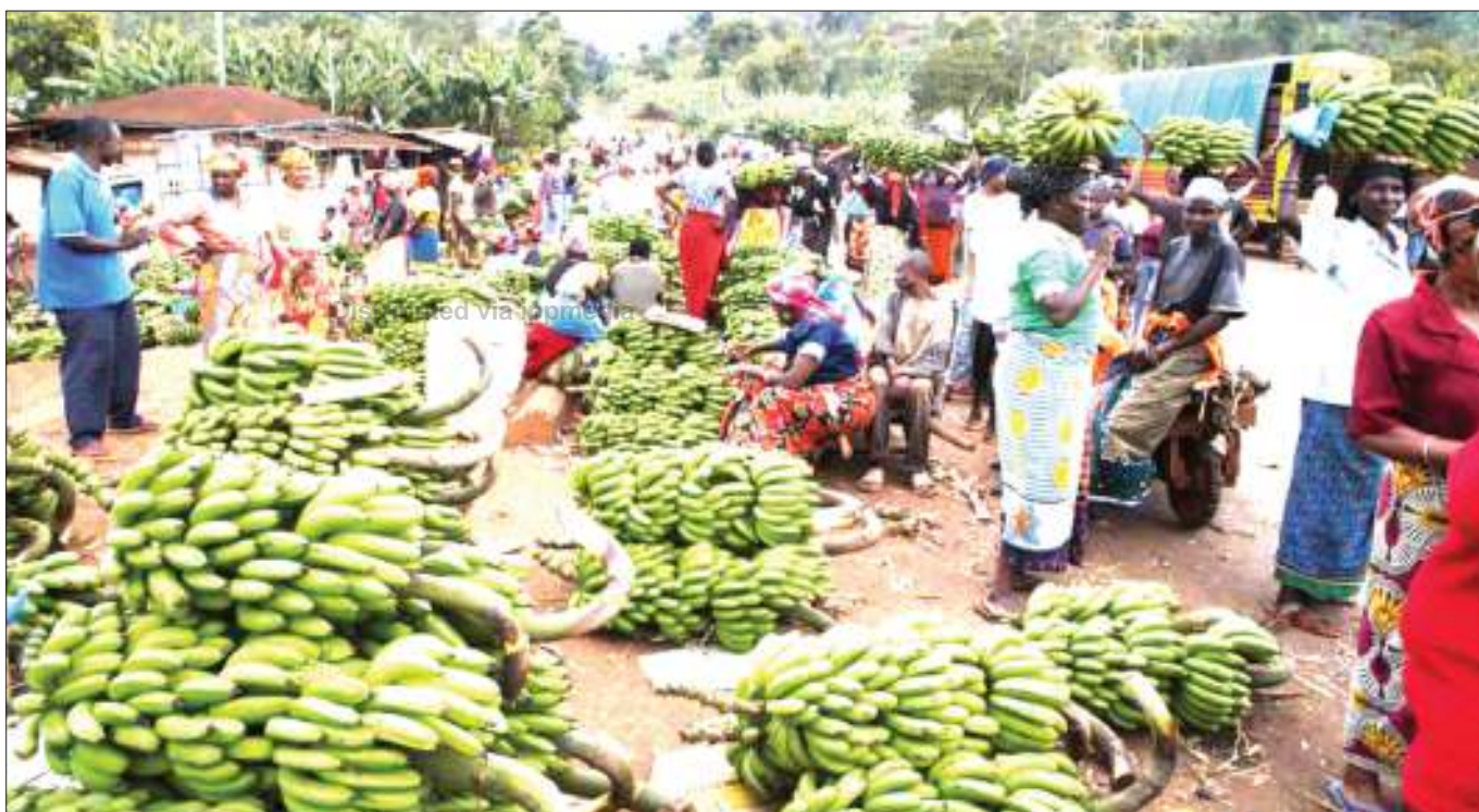
Wanawake wachuuzi wa ndizi, wakisubiri wateja katika Soko la Mamsera, wilayani Rombo, mkoani Kilimanjaro juji. Idadi kubwa ya wanawake wilayani humo ndio hujishughulisha na biashara hiyo.

Katika maoni yake, Kingazi alisema operesheni hiyo inaweza kusaidia kupunguza kasi ya uvuvi huo ambao umekuwa tishio kwa samaki wachanga.