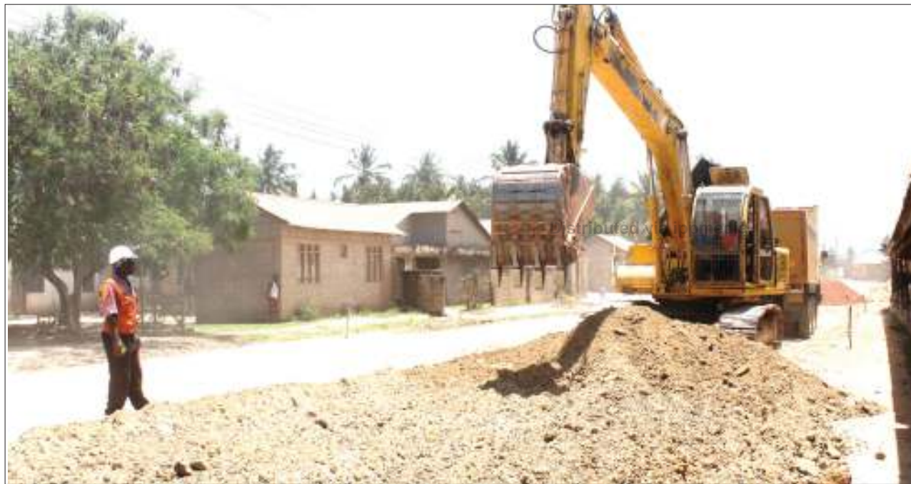
Mafundi wa kampuni ya Nyanza Road, wak- iendelea na ujenzi wa barabara ya Kitunda Kivule nje kidogo ya Jiji la Dar es Salaam jana, kutekeleza agizo la Mkuu wa mkoa huo, kuzitaka kampuni zote za ujenzi kutimiza wajibu wao.

"Wewe ni chombo muhimu na kushauri kuona namna gani matumizi mbalimbali yanavyokwenda, namna ya kurekebisha, kwa namna hiyo bungeni zipo kamati mbili, ipo Kamati ya mahesabu ya serikali na kamati ya mahesabu ya serikali za mitaa na nyingine," alisema.