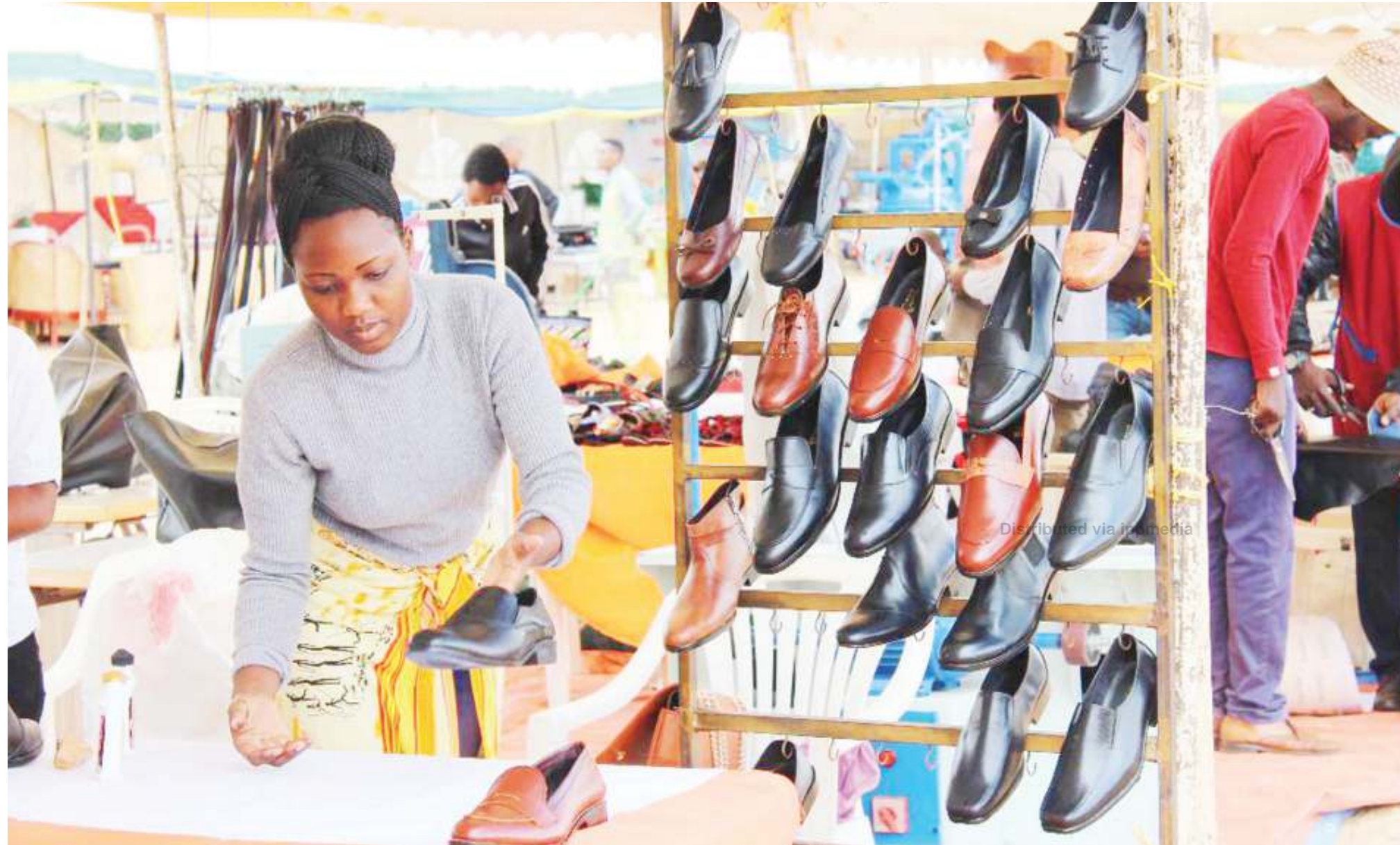
Bidhaa zitokanazo na Sido zikiwa katika soko la maonyesho.

Manyara, anasema kuna viwanda vinne vinayojumuisha cha kutengeneza mvinyo, vifungashio, mikate na pampu za kuendesha na nguvu jua.