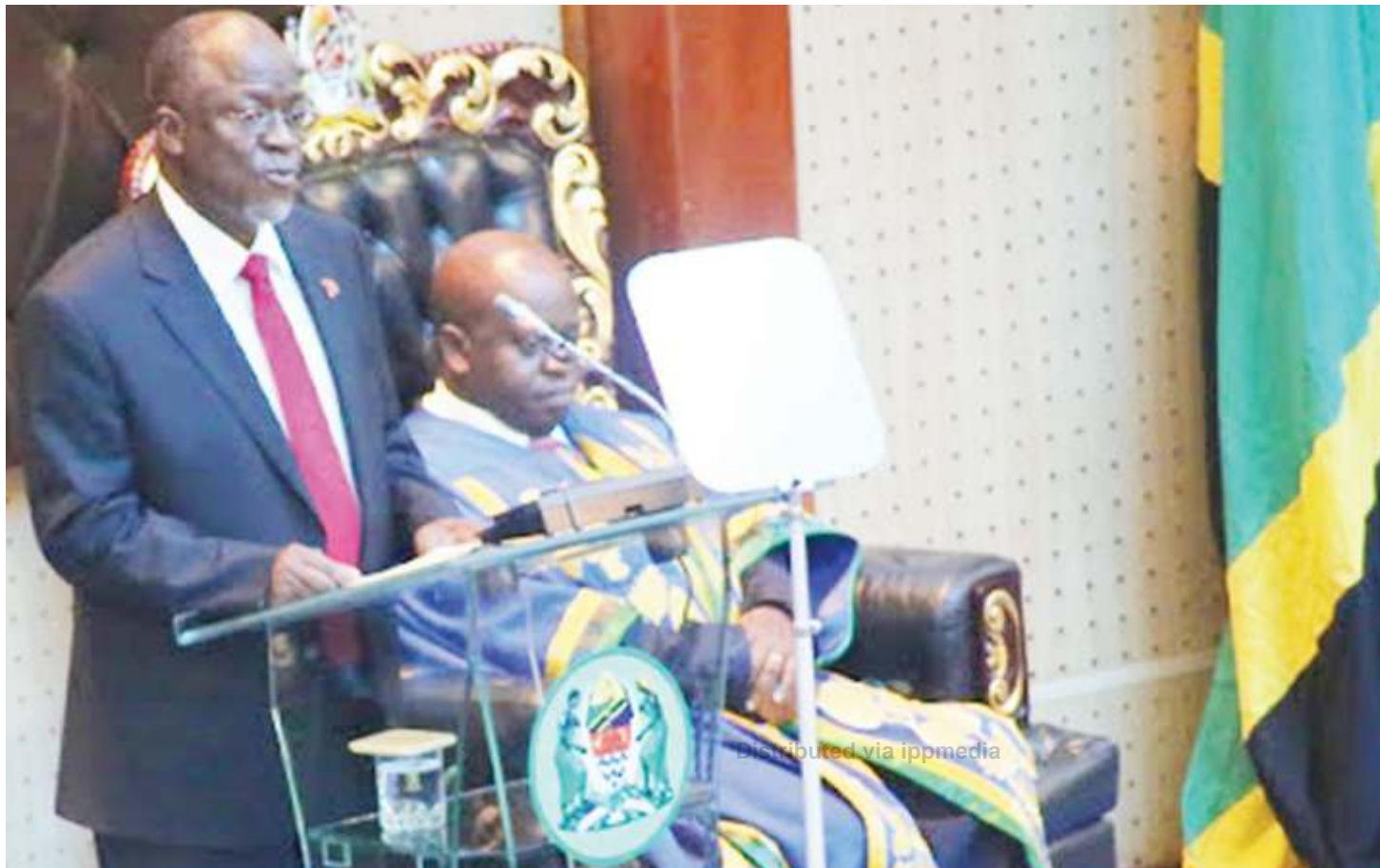
Rais John Magufuli, alipohutubia Bunge. Kushoto kwake ni Spika Job Ndugai.