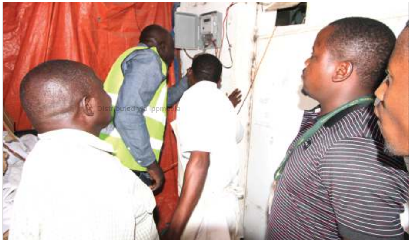
Baadhi ya wafanyakazi wa Shirika la Umeme Tanzania (TANESCO), wakikagua mita za wateja katika eneo la Mji Mpya, jijini Dodoma mwishoni mwa wiki. Tanesco waliendesha zoezi la kukagua mita kubaini wezi wa umeme ambapo jumla ya wateja 13 walikamatwa kwa kuiba umeme.

Alisema kuanza sasa akiwa mkoani Mtwara ataendelea kula panya ili kuhamasisha mila na desturi za baadhi ya watu wa kusini wanaokula panya.