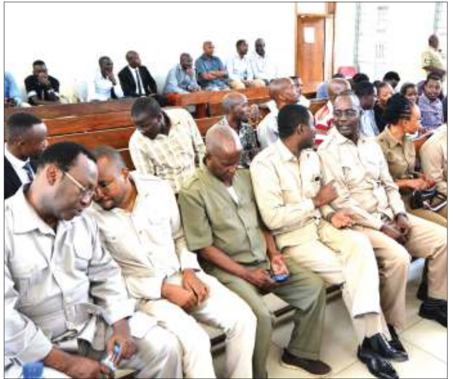
Mwenyekiti wa Taifa wa Chama cha Demokrasia na Maendeleo (Chadema), Freeman Mbowe (kushoto) na viongozi wenzake, wakiwa katika Mahakama ya Hakimu Mkazi Kisutu, jijini Dar es Salaam jana.