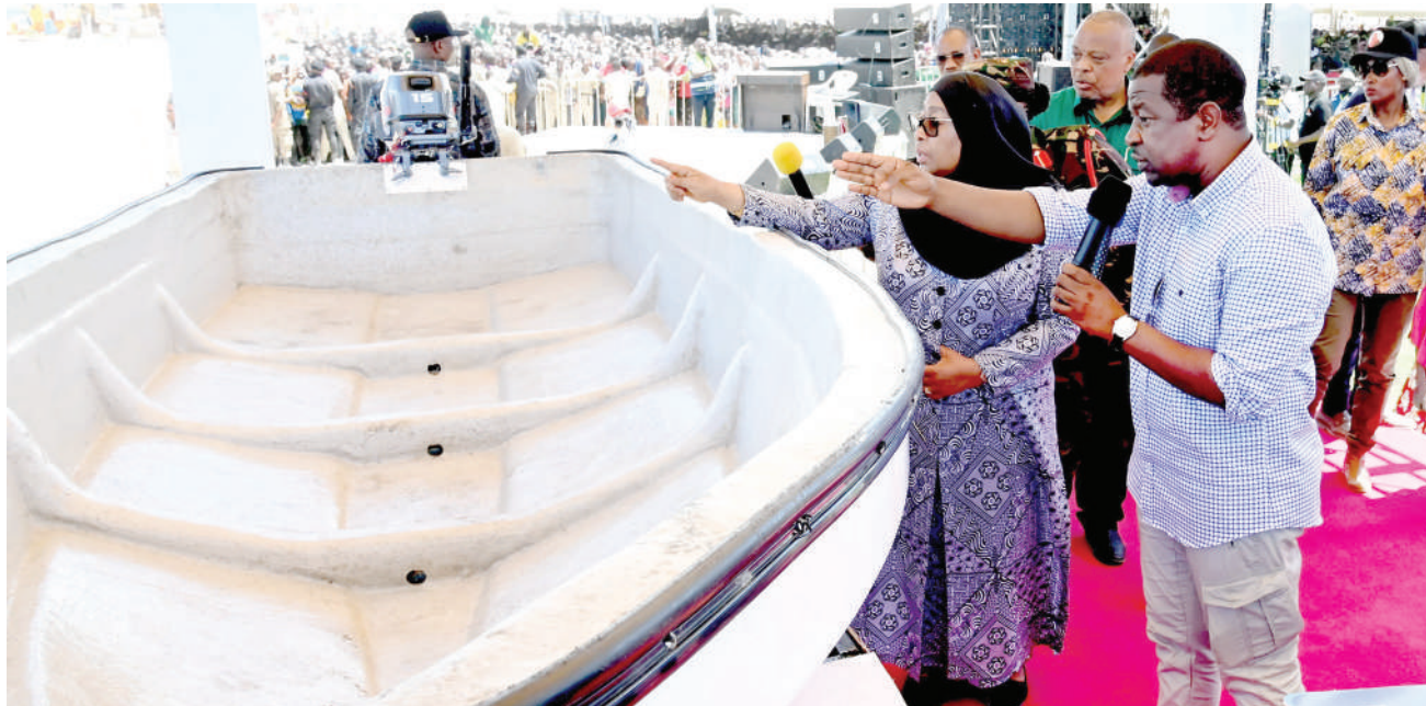
Rais Samia Suluhu Hassan akimsikiliza Waziri wa Mifugo na Uvuvi, Abdallah Ulega, aliyetoa ufafanuzi kuhusu vifaa vya kisasa vya uvuvi, baada ya kuweka jiwe la msingi la ujenzi wa Bandari ya Uvuvi ya Kilwa Masoko, mkoani Lindi jana.

• Ahoji waliko viongozi, mbunge kulinyamazia... Uk.2