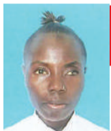
Na Tuntule Swebe