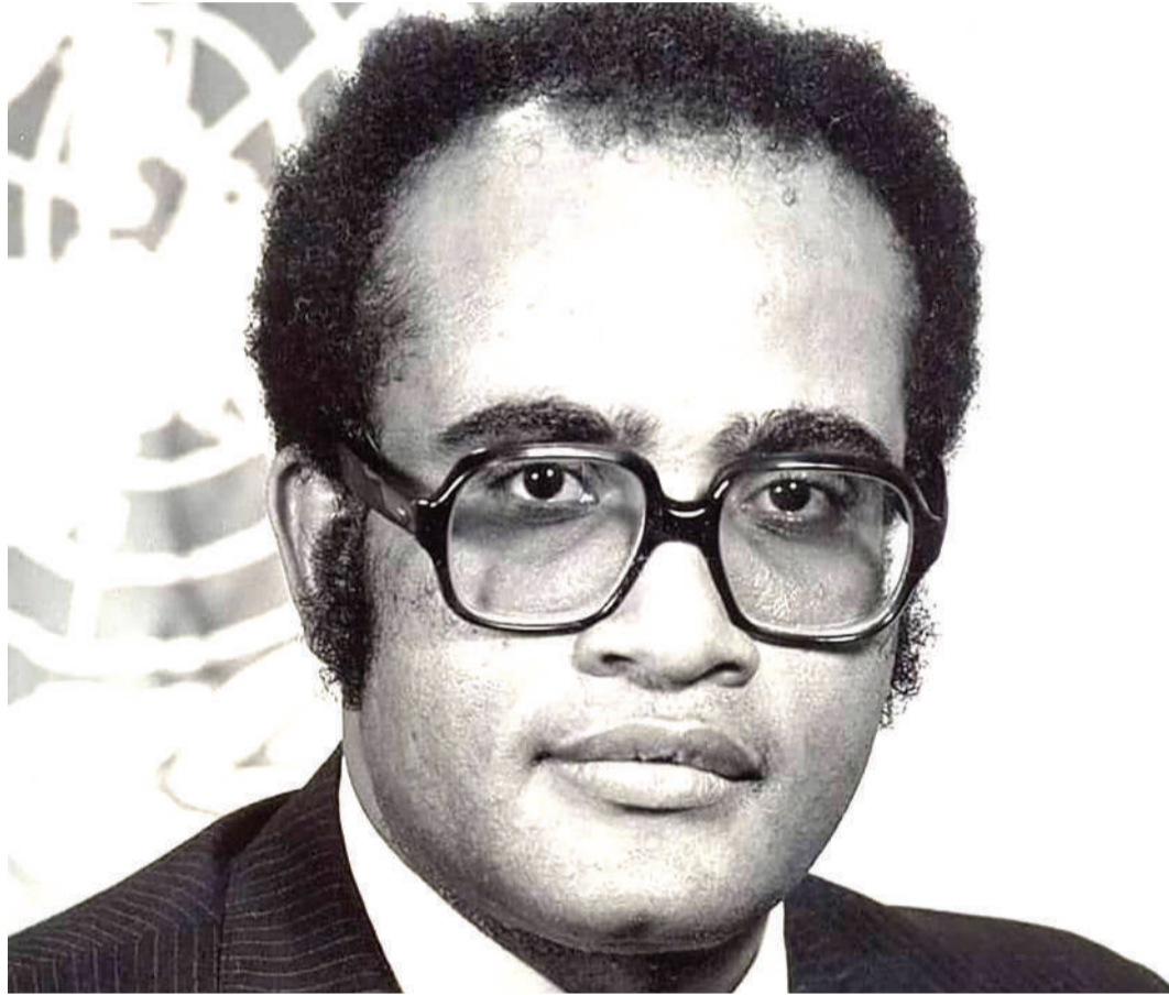
Balozi Dk. Salim Ahmed Salim, katika zama za ujana.

Bado ninakumbuka umma tulivyohamasika mithiili ya watu sasa wanavyowehuka mitaani na matokeo ya mechi za soka