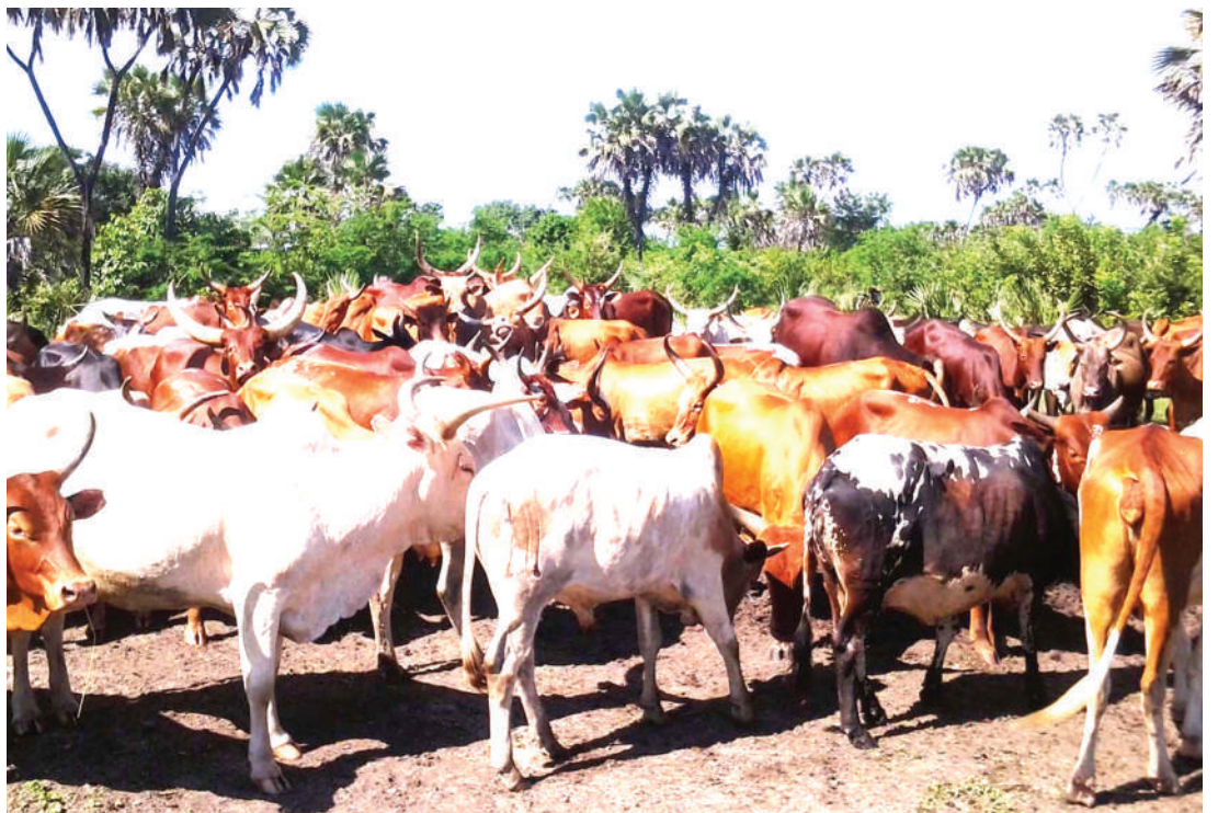
Ng'ombe wakiwa machungani, wilayani Liwale.

"Kinachotakiwa nyie viongozi wa vijijini ni kuangalia kama kuna changamoto miongoni mwa wakulima na wafugaji katika maeneo yenu na kuzitafutia ufumbuzi ili makundi yote yaendeleo kuishi kwa amani," anaeleza.