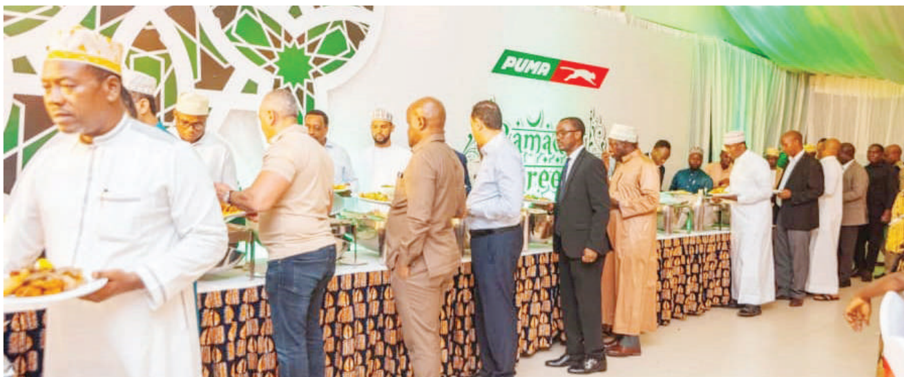
Wadau mbalimbali pamoja na wafanyakazi wa kampuni ya mafuta ya Puma Tanzania wakipata futari iliyoandaliwa na kampuni hiyo kwa ajili ya kufuturisha katika kipindi hiki cha mfunzo wa Ramadhan jijini Dar es Salaam juzi.

Alisema tayari wamewasiliana na Wizara ya Maliasili, wamepewa eneo mkoani Dodoma ambalo watajenga makumbusho itakayotumiwa na watu mbalimbali kwenda kujifunza historia ya nchi yao.