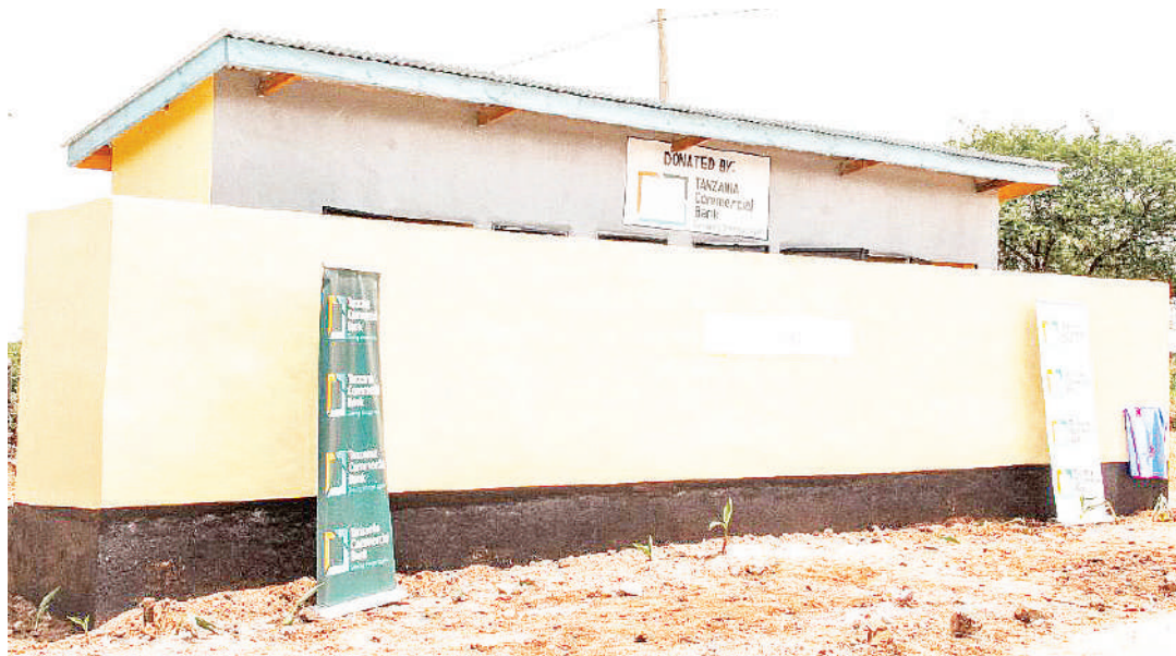
Vyoo vipya vilivyojengwa katika Shule ya Sekondari Busiya wilayani Kishapu.

“Wanafunzi wa huku vijijini ni tofauti na wa mjini. wenzetu wana uwezo wa kupata taalo za kike, la-