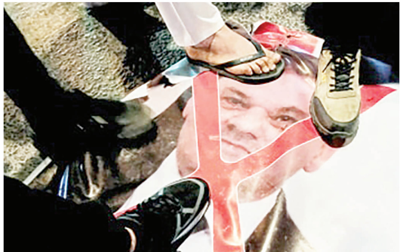
Miguo ya baadhi ya wananchi wa Libya ikikanyaga picha ya Waziri Mkuu wa Taifa hilo, Abdulhamid Al-Dbeibah, ambaye makazi yake yalishambuliwa jana kwa makombora yanayorushwa kwa roketi.