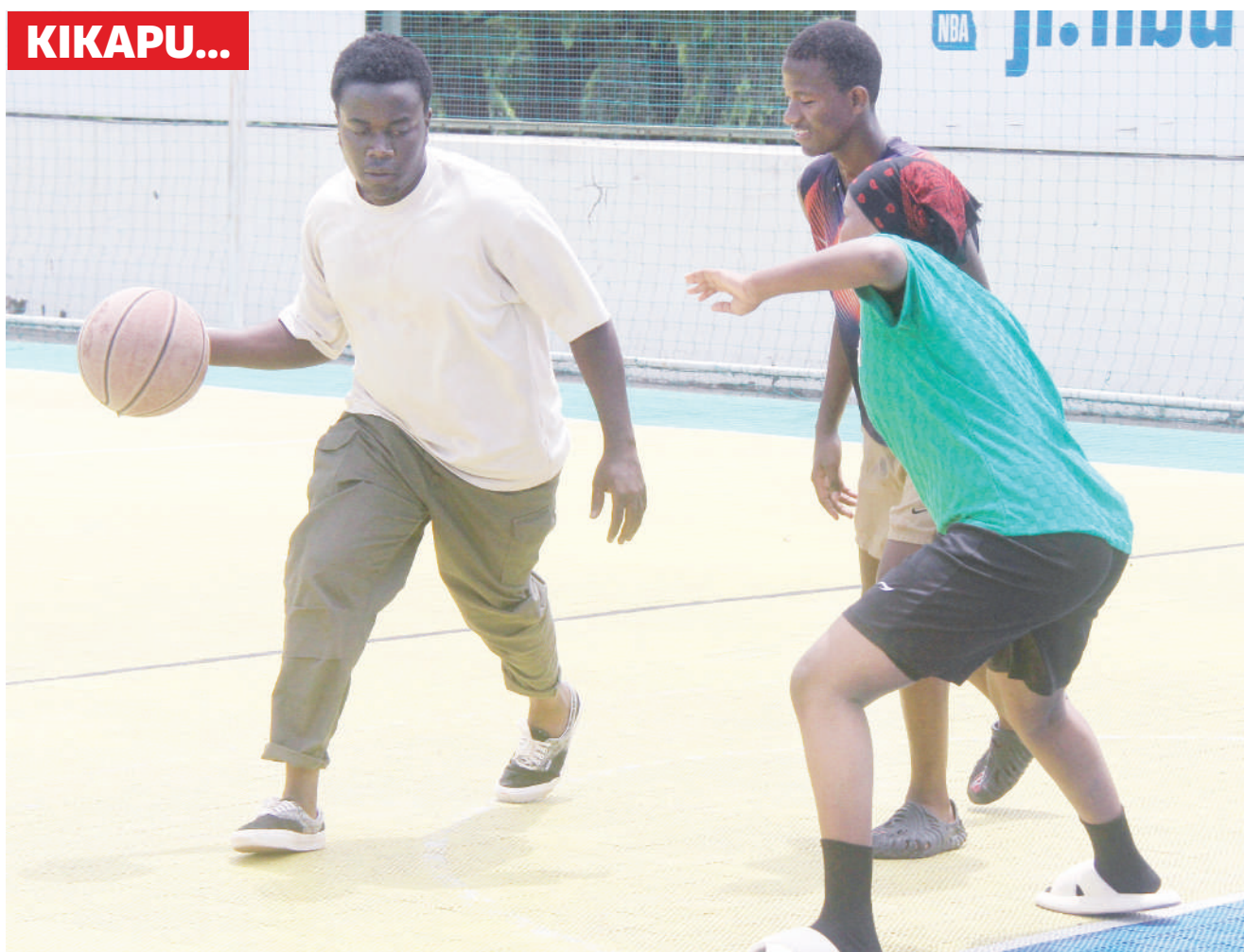
Vijana wakiwania mpira wakati wakifanya mazoezi ya mpira wa Kikapu katika viwanja vya Kituo cha Michezo cha Jakaya Kikwete jijini Dar es Salaam jana.