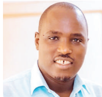
Naibu Waziri Mkuu, Dotto Biteko

Anavitaja baadhi ni ujenzi wa nyumba za walimu kwenye halmashauri za pembezozi; kuimarisha mfumo wa motisha kwa walimu ili kuwafanya wabaki kwenye kazi yao.