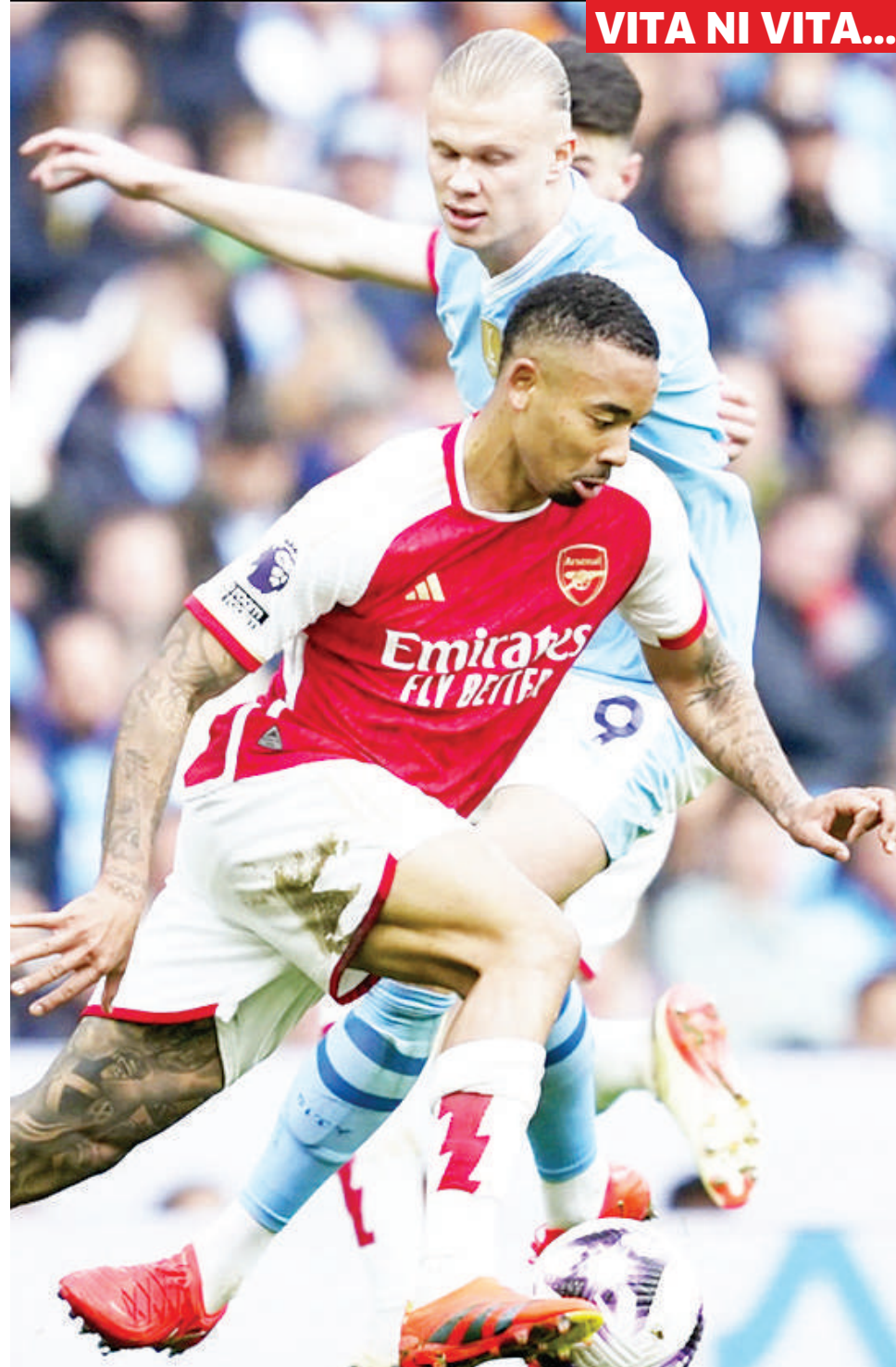
Mshambuliaji wa Arsenal, Gabriel Jesus (kushoto) na straiika wa Manchester City, Erling Haaland, wakiwania kumiliki mpira kwenye mechi ya Ligi Kuu England iliyo-pigwa juzi katika Uwanja wa Etihad na kumalizika kwa sare tasa.