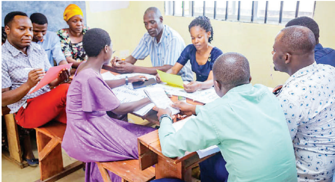
Walimu wa shule wakiwa katika mafunzo ya maendeleo kazini. PICHA ZOTE: MTANDAO.