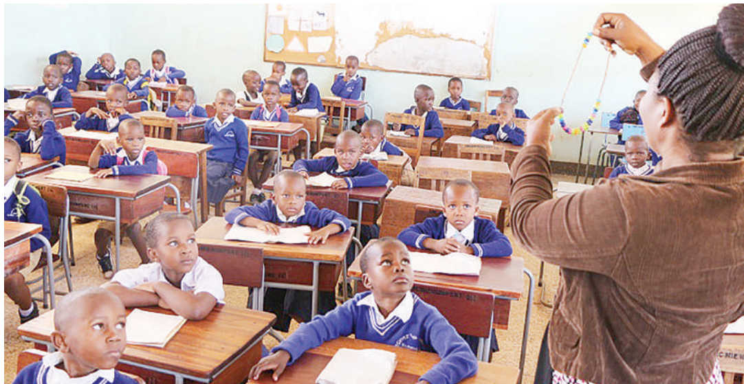
Darasa la Elimu ya Watu Wazima likiendelea.

Kwa ujumla, nafasi ya elimu ina sura mbili, rasmi na isiyorasmi. Elimu isiyorasmi mtu hupewa