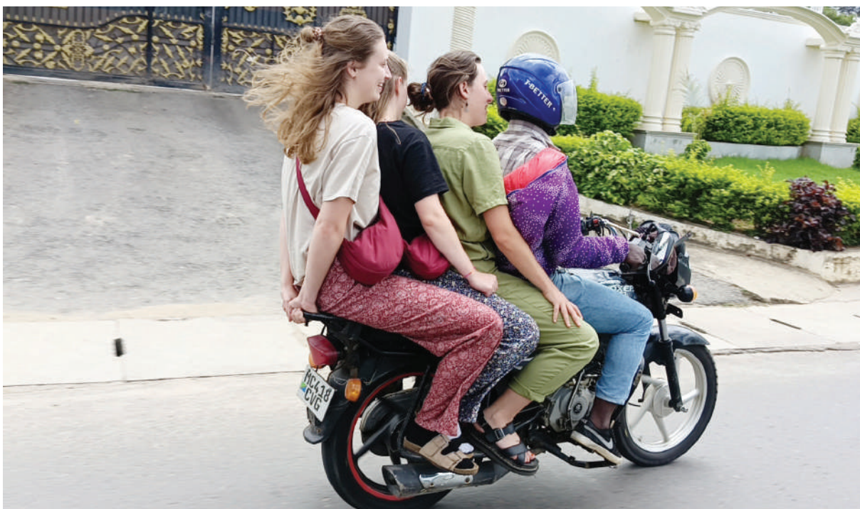
Mwendesha pikipiki Manispaa ya Iringa ambaye jina lake halikuweza kupatikana akiwa amepakia mshikaki raia wa kigeni watatu kama alivyokutwa eneo la RETCO barabara kuu ya Iringa -Dodoma jana.

Mfanyabiashara Hamis Nurdin aliwaomba TRA kutoa mashine za kieletroniki bure kwa wafanyabiashara sambamba na matumizi teknolojia ya simu kutoa risiti.