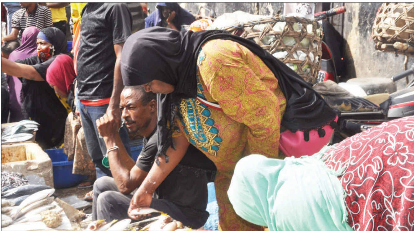
Kinamama katika Soko Kuu la Darajani Mjini Zanzibar, wakiwa katika biashara ya samaki, licha ya uhaba uliopo hivi sasa wa kitoweo hicho.