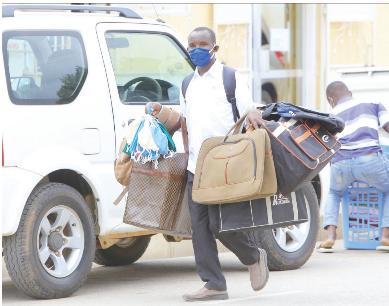
Mchuzi wa biashara ndogo ambaye jina lake halikupatikana, akitafuta wateja wa barakoa na biashara ya mabegi katika Barabara ya Tabora jijini Dodoma jana. Uwapo wa ugonjwa wa Covid-19 unaosababishwa na virusi vya corona, umetoa fursa kwa kundi hilo la wajasiriamali kuchangamkia soko la barakoa.

Alisisitiza viongozi ndani ya misikiti kuendelea kutoa elimu kwa waumini wao kwa vitendo ili kuwanusuru na maambukizo ya ugonjwa huo.