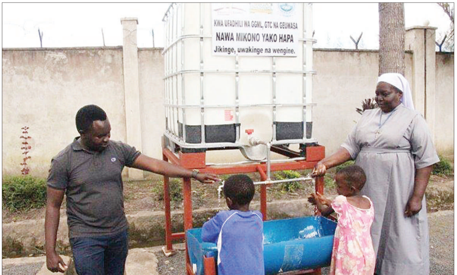
Baadhi ya wakazi wa Mji wa Geita, wakiosha mikono kwa maji tiririka na sabuni kutoka kwenye vifaa vilivyotolewa na kampuni ya GGML.