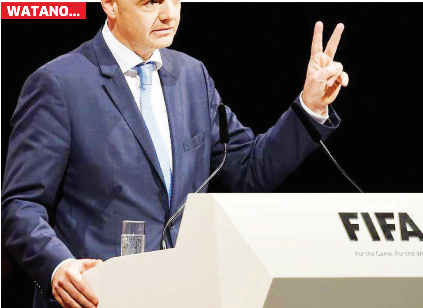
Rais wa Shirikisho la Soka duniani (Fifa), Gianni Infantino, ambaye jopo lake limependekeza kuongezwa kwa wachezaji watano wanaotokea benchi 'sab' wakati ligi zitakaporejea.