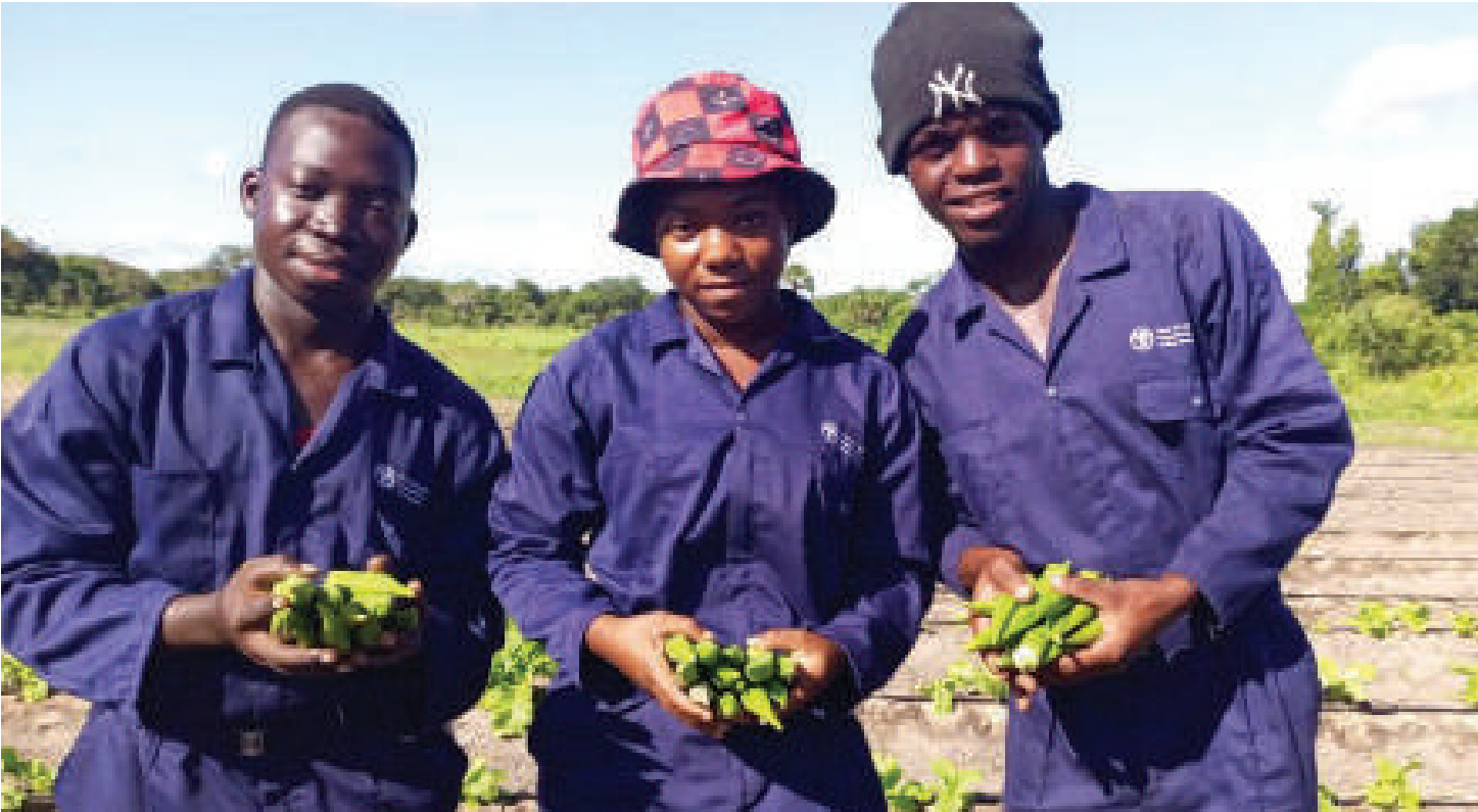
Vijana wakulima wakiwa kazini wilayani Rufiji wakifanyakazi chini ya mpango wa kilimo cha kibiashara unaofanywa na FAO.

V IJANA wa mikoa ya Pwani, Dodoma, Singida na Arusha, ni wanufaika wa mpango wa Shirika la Chakula na Kilimo la Umoja wa Mataifa-FAO la kuwaatamia vijana likiwa elimu na maarifa ili wajanzishie miradi, wakope na wajiondoe kwenye umaskini, kupitia kilimo biashara.