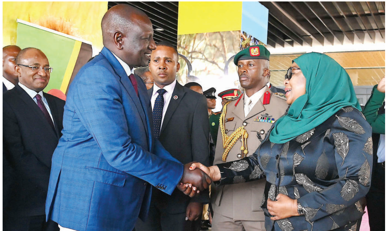
Rais Samia Suluhu Hassan akiagana na Rais wa Jamhuri ya Kenya, Dk. William Ruto, baada ya kuhitimisha ziara yake ya kikazi ya siku mbili jijini Dar es Salaam jana.

• Samia , Ruto wasema sasa hakuna majibizano ni ushirikiano... Endelea ukurasa 2