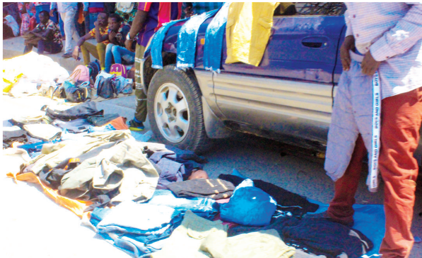
Baadhi ya wafanyabiashara wadogo maarufu machinga, wakiendelea na biashara zao katikati ya Jiji la Mwanza baada ya kuondolewa mjini na kutengewa maeneo ya pembezoni kwa ajili ya kufanyia biashara.