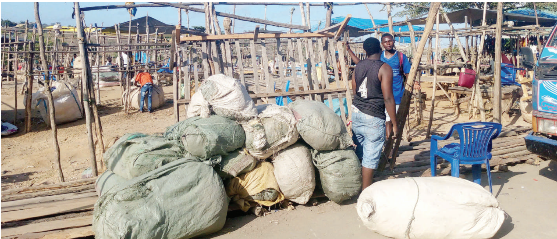
Wafanyabiashara wakiwa wameegesa mafurushi ya bidhaa zao jana, kabla ya kupanga kwenye meza katika mnada unaofanyika kila Jumamosi Loliondo, Kibaha mkoani Pwani.