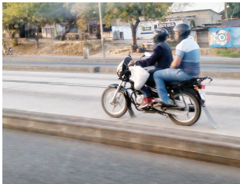
Dereva wa bodaboda akipita katika barabara ya mabasi ya mwendokasi Kimara Baruti Dar es Salaam juzi, wakati Jeshi la Polisi limeshataja vyombo vya moto vinavyoruhusiwa kupita kwa dharura katika barabara hiyo.