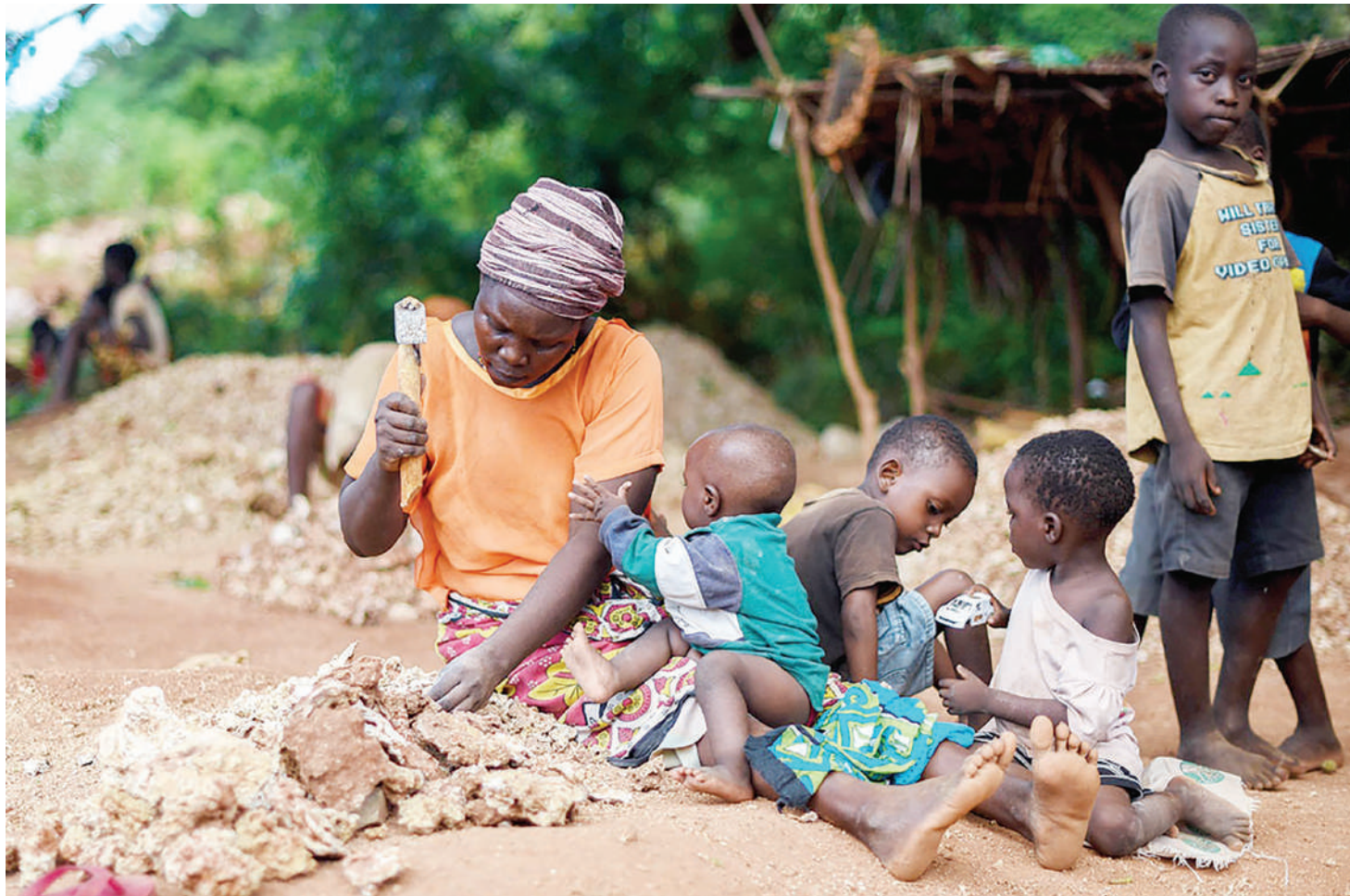
Hali duni ya maisha inayokwamisha masomo inapungua baada ya serikali kubeba mzigo wa elimu ya msingi na sekondari, lakini pia imeanza kuwalipia gharama zote za vyuo vikuu watakaofanya vizuri kwenye kozi za sayansi.

• Wanasiasa, wazazi wafikishe ujumbe kona zote