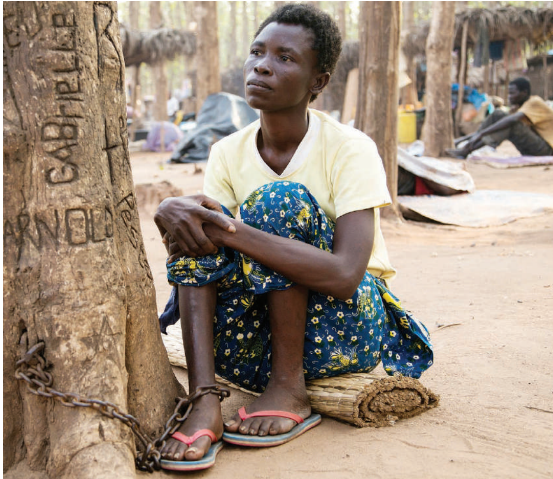
Kuwatesa kwa kuwafunga minyororo wenye matatizo ya afya ya akili siyo tiba, wanatakiwa kupelekwa hospitali kutibiwa.

“Ukiumwa miguu, tumbo au kichwa unakimbilia hospitalini, unapopata matatizo ya akili unayapeleka wapi? Vitu kama hisia za huzuni, sonona, uchungu mkali na maumivu ya kuachwa na mwenza au kutelekezwa, kudharauliwa na kunyanyaswa kijinsia yanabaki moyoni. Utaishi nayo mpaka lini na yatakuumiza mpaka wapi? Ni wakati wa kuchukua