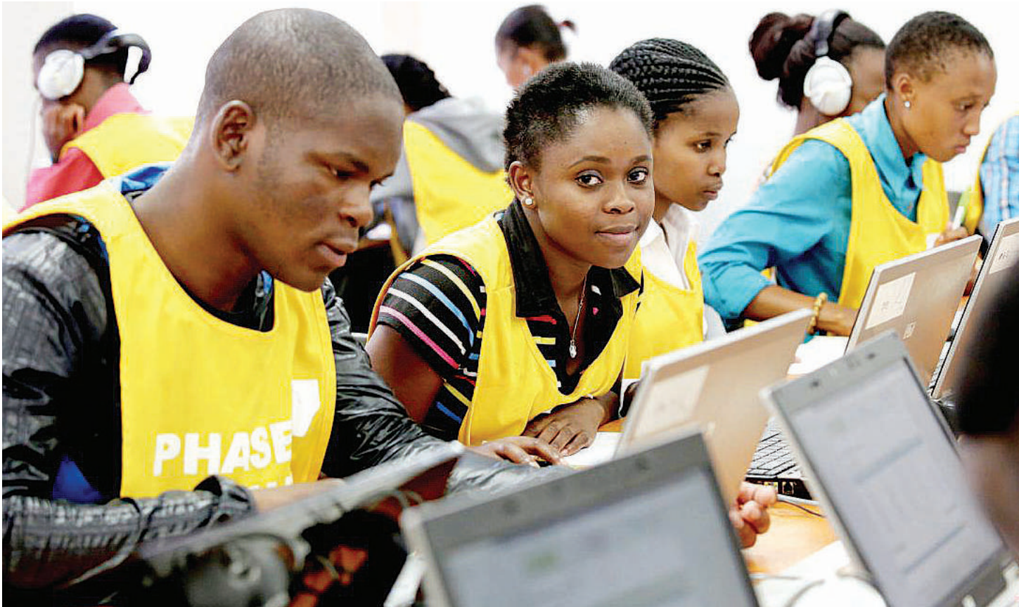
Vijana wakiwa kazini kwenye moja ya viwanda.

• Wasomi wapikwa pande mbili darasani, ofisini