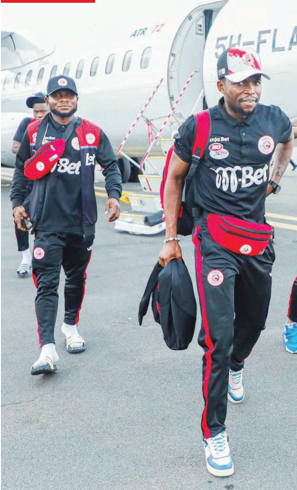
Wachezaji wa Simba wakirejea nchini kutokea Angola jana, baada ya juzi kuibuka na ushindi wa mabao 3-1 dhidi ya Primeiro de Agosto, kwenye mechi ya mkondo wa kwanza ya Raundi ya Kwanza ya Ligi ya Mabingwa Afrika.