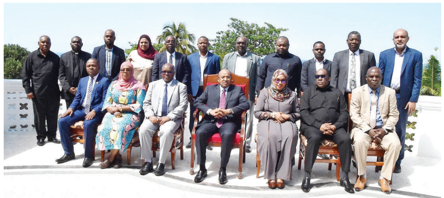
Rais wa Zanzibar, Dk. Hussein Ali Mwinyi, akiwa pamoja na kamati maalum (kikosi kazi) ya kuchambua maoni ya washiriki wa mkutano wa wadau wa demokrasia ya vyama vingi vya siasa, baada ya kumalizika kwa hafla ya kukabidhiwa ripoti ya maoni Ikulu Zanzibar jana.