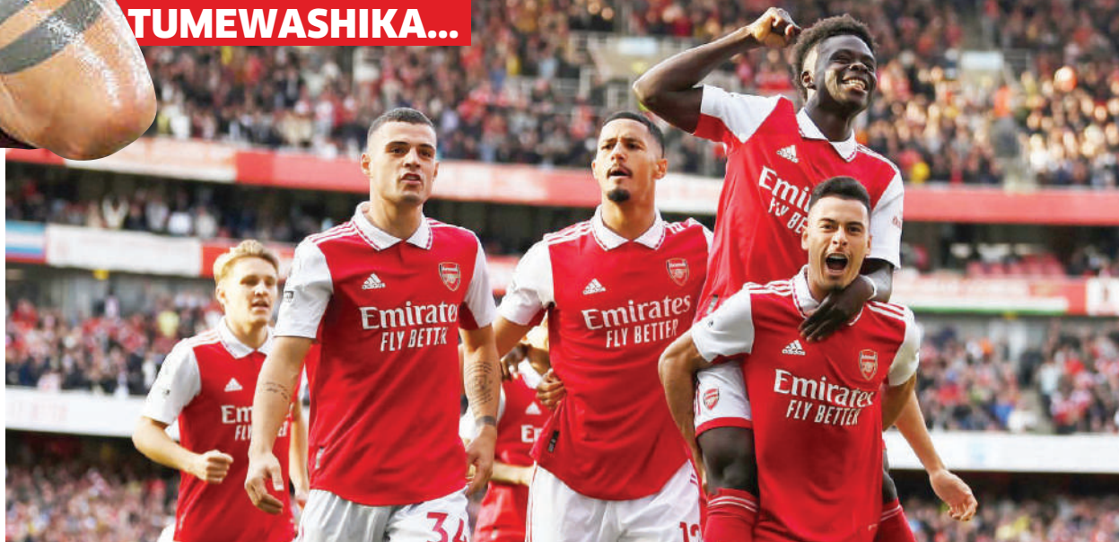
Bukayo Saka akimpongeza Gabriel Martinelli kwa kumdandia mgongoni baada ya kuifungia timu yake bao la kwanza wakati wakishinda 3-2 dhidi ya Liverpool kwenye Ligi Kuu England iliyopigwa Uwanja wa Emirates juzi. Mabao mengine mawili ya Arsenal yalifungwa na Saka.