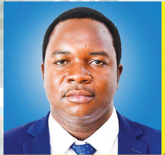
MHE. ATUPELE MWAKIBETE (MB) NAIBU WAZIRI (UCHUKUZI)