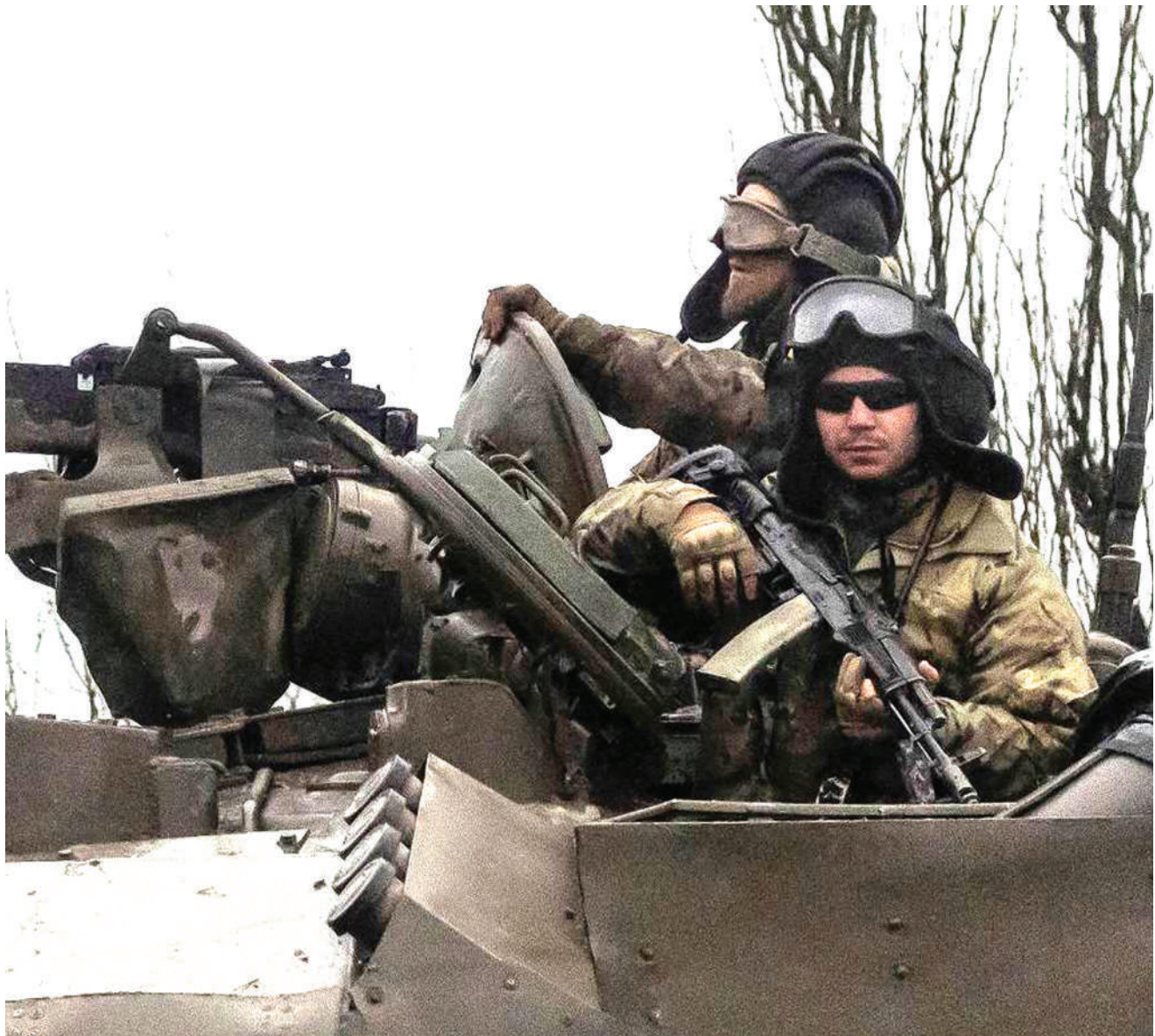
Wanajeshi wa Ukraine wakiongoza mapambano ya kuutetea mji wa Mashariki wa Donbas juzi.