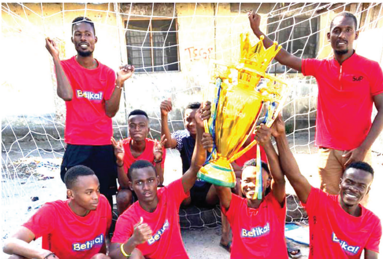
Wachezaji wa Espanyola wakiwa na kikombe cha ubingwa wa Ligi ya Betika Sodo baada ya kuutwaa wiki hii.