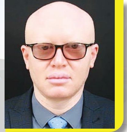
DKT. ALLY POSSI. NAIBU KATIBU MKUU (UCHUKUZI)