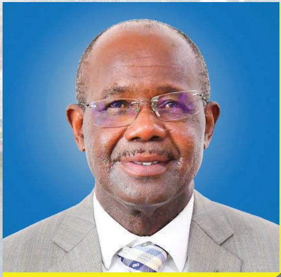
MHE. PROF. MAKAME MBARAWA (MB) WAZIRI WA UJENZI NA UCHUKUZI