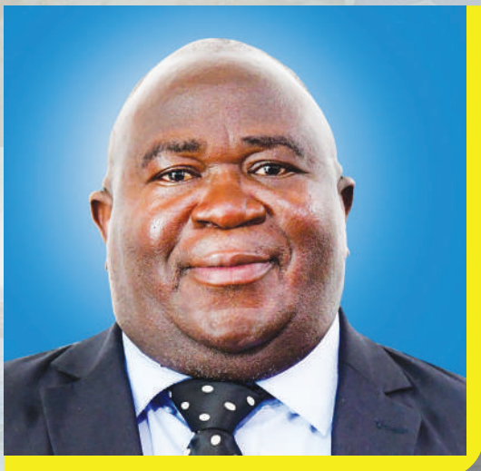
MHE. GODFREY KASEKENYA (MB) NAIBU WAZIRI (UJENZI)