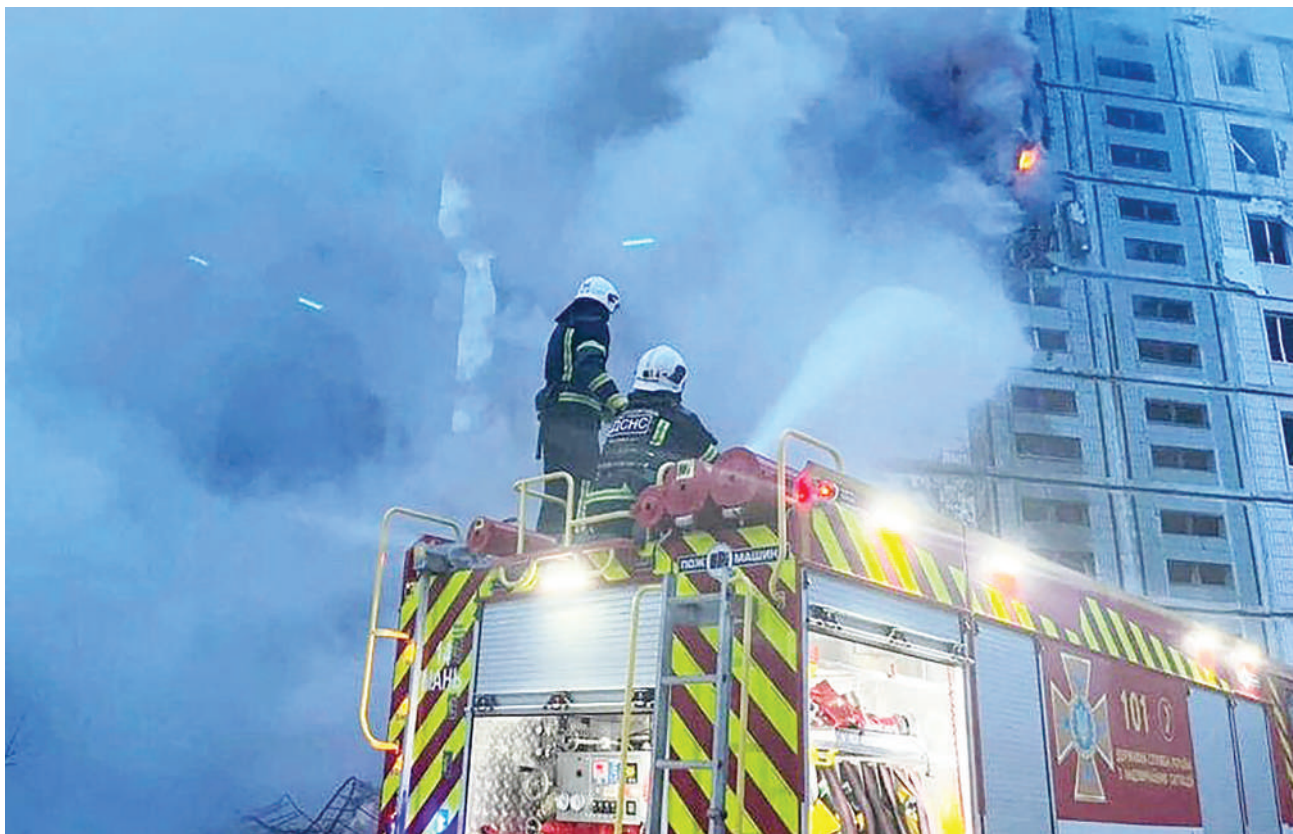
Maofisa wa zimamoto wakipambana kuzima moto katika nyumba moja nchini Ukraine baada ya makombora ya Russia kuishambulia nchi hiyo usiku wa kuamkia jana.