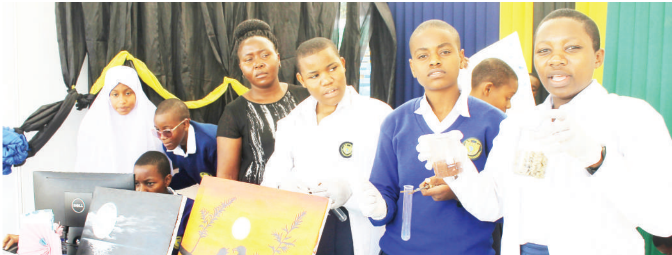
Wanafunzi wa Shule ya Sekondari Dodoma, wakitoa elimu ya jinsi ya kuondoa sumu iliyoathiri maini ya binadamu kutokana na unywaji wa pombe na uvutaji wa sigara, wakati wa maonyesho ya ubunifu, jijini Dodoma juzi.