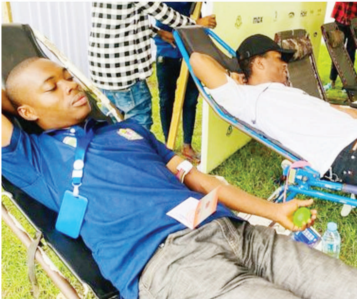
Mashabiki wa Yanga wakichangia damu na baadaye kupewa tiketi za kushuhudia mechi ya robo faili ya mashindano ya Kombe la Shirikisho Afrika dhidi ya Rivers United kutoka Nigeria itakayochezwa kesho kwenye Uwanja wa Benjamin Mkapa, Dar es Salaam.

Aliongeza anaendelea kuwajenga kisaikolojia wachezaji ili wasicheze chini ya kiwango huku akiendelea kushukuru wanaendelea vyema kifa.