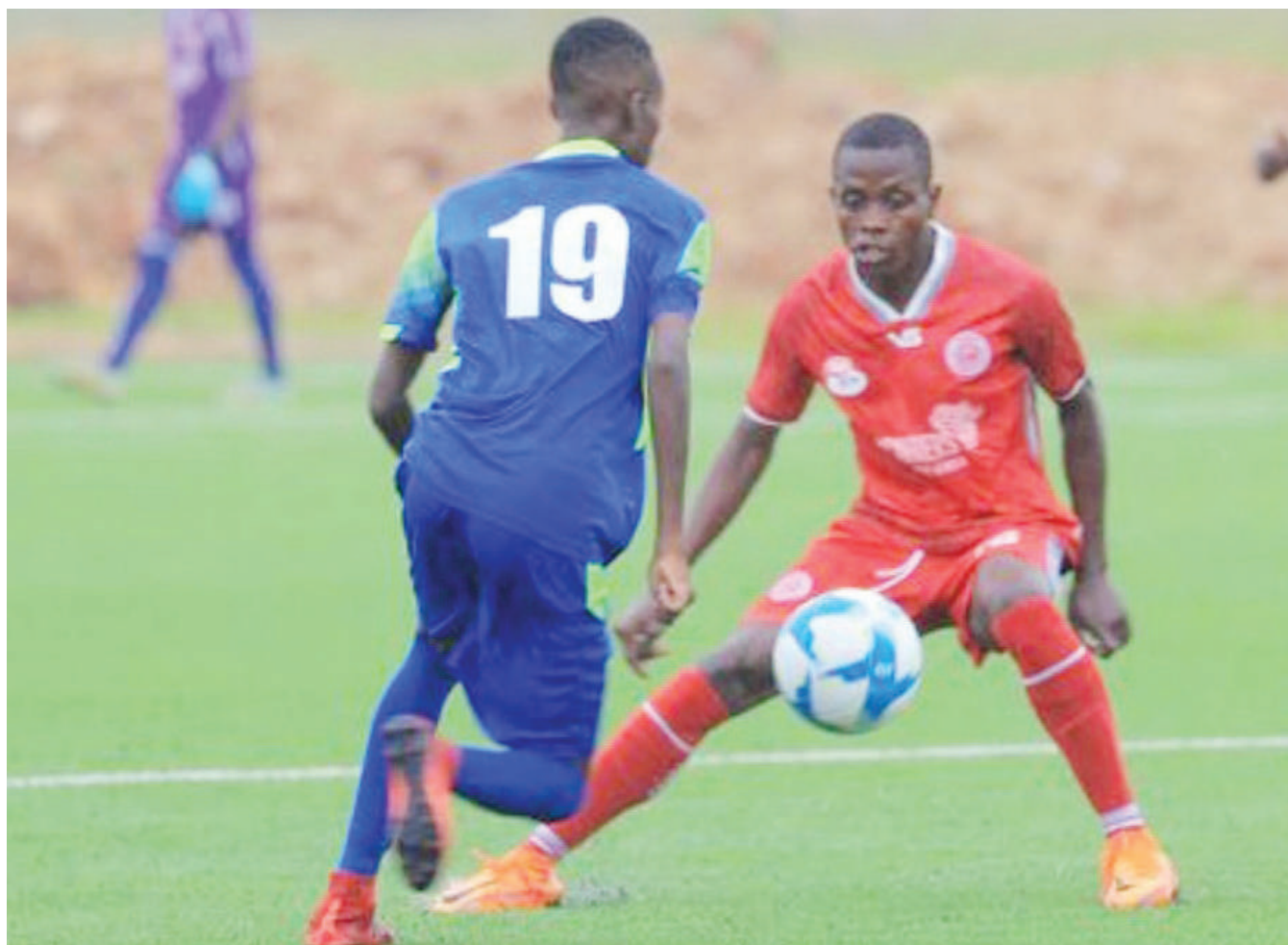
Mshambuliaji wa Timu ya vijana ya Simba (kulia), akijiandaa kumtoka nyota wa Ihefu katika mechi ya Ligi ya U-17 ya Shirikisho la Soka Tanzania (TFF) inayoendelea jijini, Dar es Salaam. Timu hizo zilitoka sare ya mabao 2-2.

Aliongeza chaguo la Bet Behind litampa fursa mchezaji kuweka dau hata kama atachelewa kuanza na mchezeshaji atasaidiwa namna anayotakiwa kufanya kwenye mchezo huo.