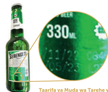
Taarifa ya Muda wa Tarehe ya Mwisho wa Matumizi kwa teknolojia mpya ya chapisho ya "leser"