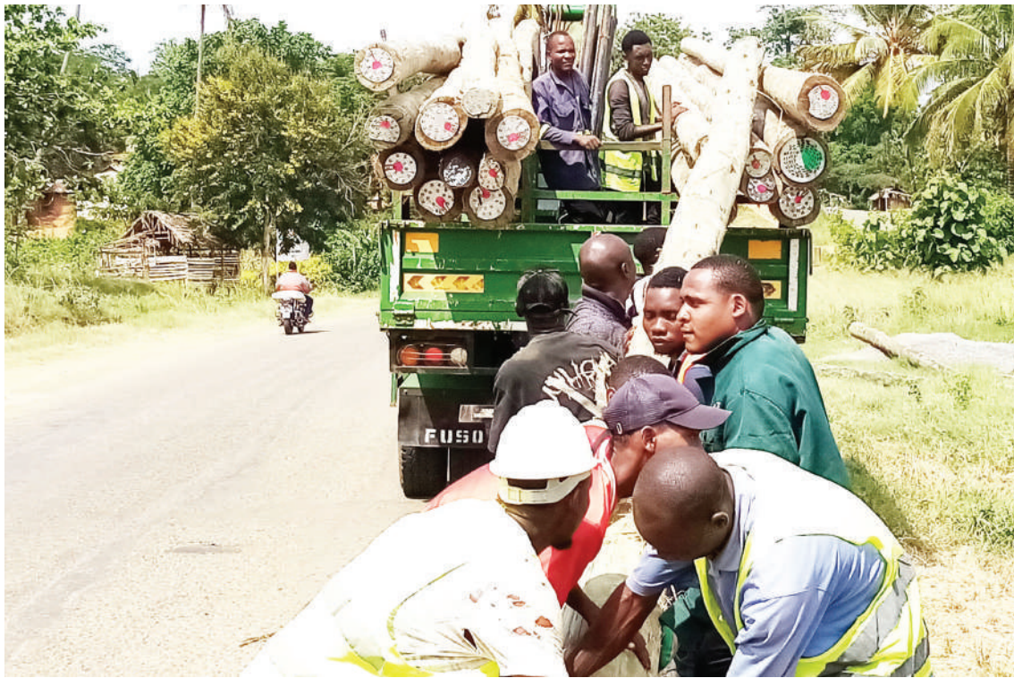
Mafundi wa Shirika la Umeme (TANESCO) wilayani Muheza, mkoani Tanga, wakipakia nguzo katika lori eneo la Msangazi kwa ajili ya kuwasambazia umeme wananchi wa vijijini juji.