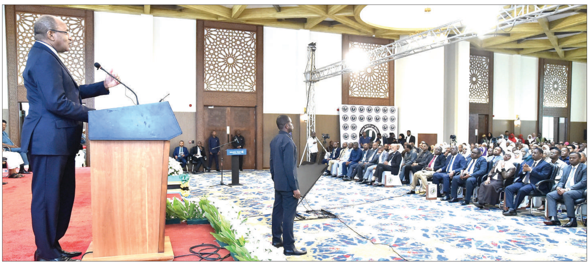
Rais wa Zanzibar, Dk. Hussein Ali Mwinyi, akihutubia katika maadhimisho ya Siku ya Shukrani na Furaha kwa Walipakodi Zanzibar kwa mwaka 2021/2022, Bodi ya Mapato jana.