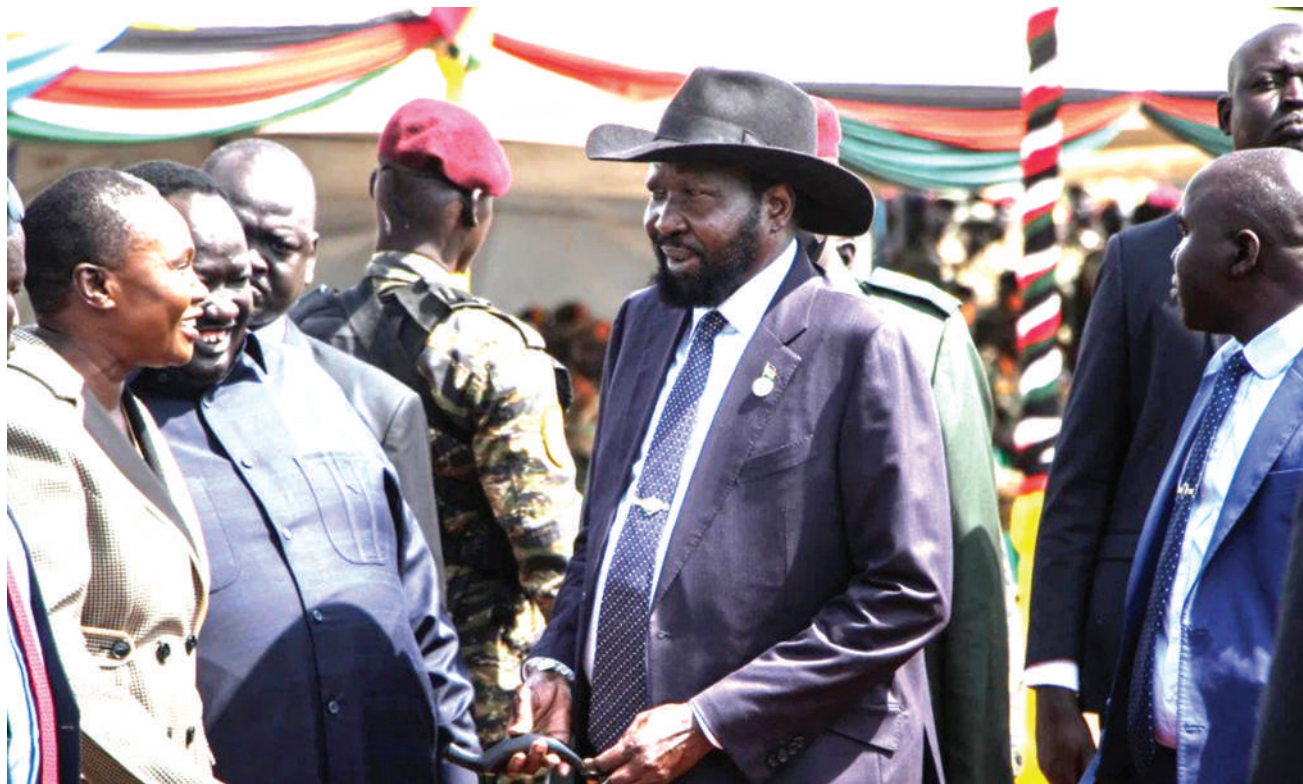
Rais wa Sudan Kusini, Salva Kiir akiwa katika hafla ya kuwaaga wanajeshi wa jeshi la watu wa Sudan Kusini, mjini Juba, wakielekea DRC kulinda amani.