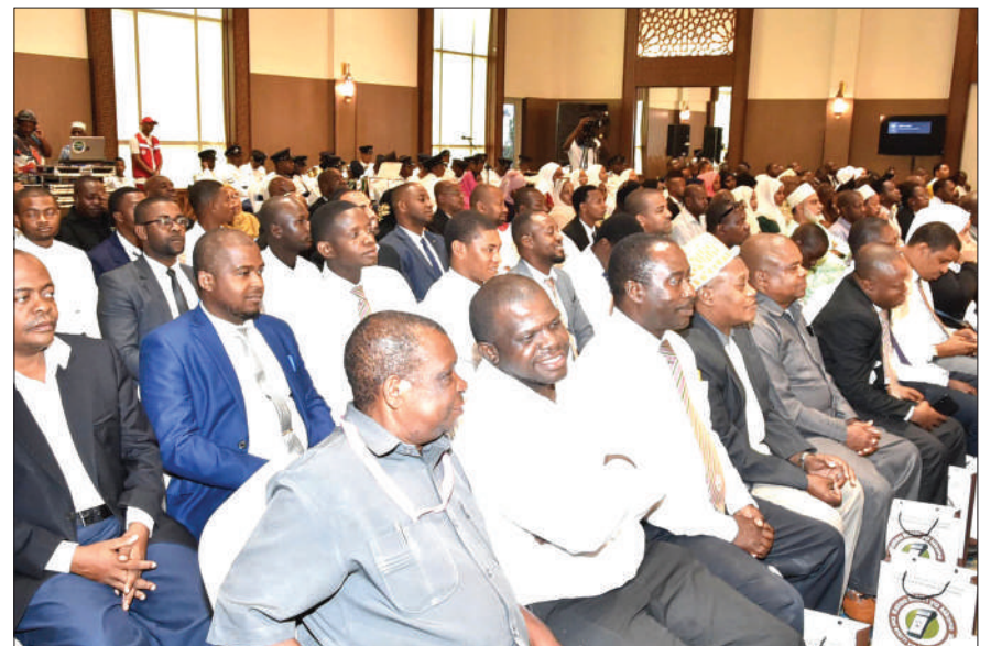
Wafanyakazi wa Mamlaka ya Mapato Zanzibar (ZRB) wakifuatilia kwa makini hotuba iliyotolewa na Rais wa Zanzibar Dk. Hussein Mwinyi.