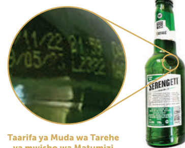
Taarifa ya Muda wa Tarehe ya mwisho wa Matumizi kama ilivyo sasa