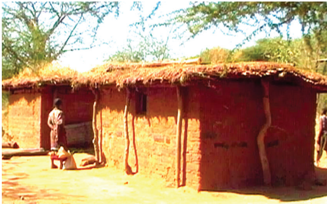
Nyumba katika hali duni.

Majibu ya maswali hayo, hutumiwa kulinganishwa na malengo yaliyopangwa na kuona kama kweli utekezaji umefikia malengo au la. Kwa kutumia mfano wa ujenzi wa nyumba hapo juu, muda wa miezi 12 na siku zilizopita mpaka sasa, yaani imebaki siku moja kabla ya muda wa utekezaji mradi au malengo kuisha basi tunategemea nyumba zote nne ziwe zimeshajengwa au nyumba ya tatu imekamilika na nyumba ya nne ipo kwenye hatua za mwisho za umaliziaji. Hivyo, inatoa picha kwamba malengo ya kujenga jumla ya nyumba nne kwa mwaka mzima yamefikwa au la.