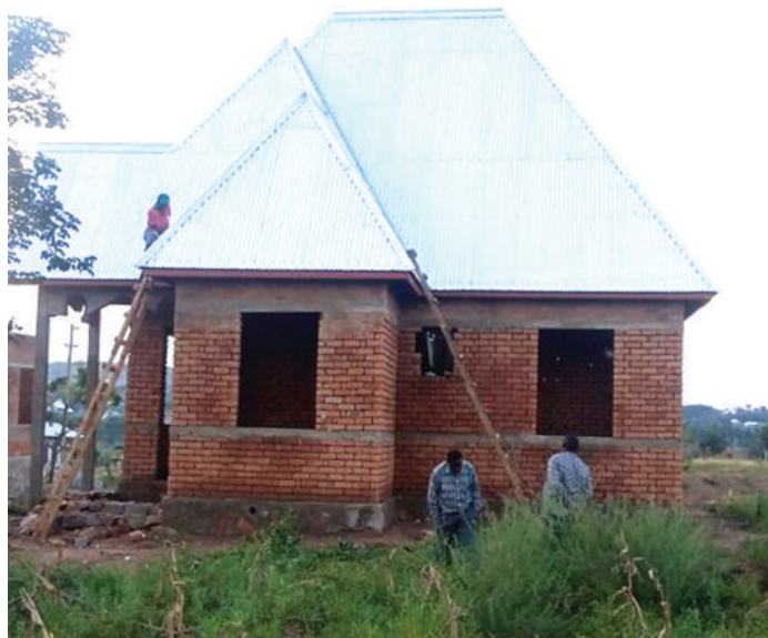
Nyumba bora katika hatua za ujenzi.

Kibaya zaidi inakuwa, inapofika mwaka 2024, mtu anaanza kufuga kuku kabla ya kutimiza lengo la mwaka 2023. Na zaidi ya hayo yote tathimini ya kina mwishoni mwa mwaka husaidia