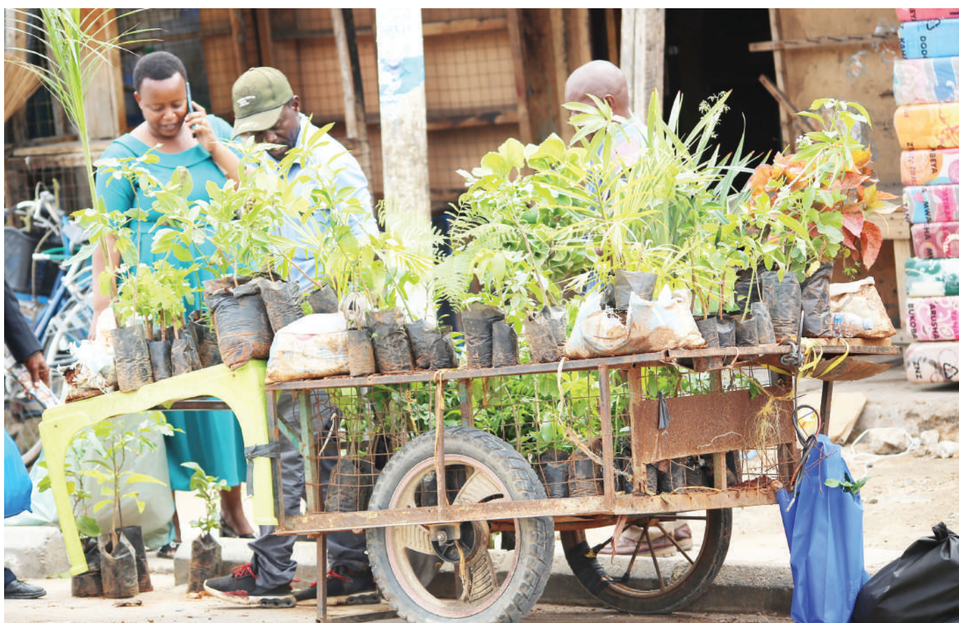
Mjasiriamali wa miti ambaye jina lake halikupatikana akiwauzia wateja wake miche ya miti nje ya soko kuu la Majengo jijini Dodoma jana.

“Kaulimbiu ya mkesha huo kila mwaka ni amani, utulivu na ustawi nchi nzima, sauti moja, ambapo mkesha huo wa kuliombea taifa umekuwa ukifanyika kila mwaka tangu mwaka 1997,” alisema.