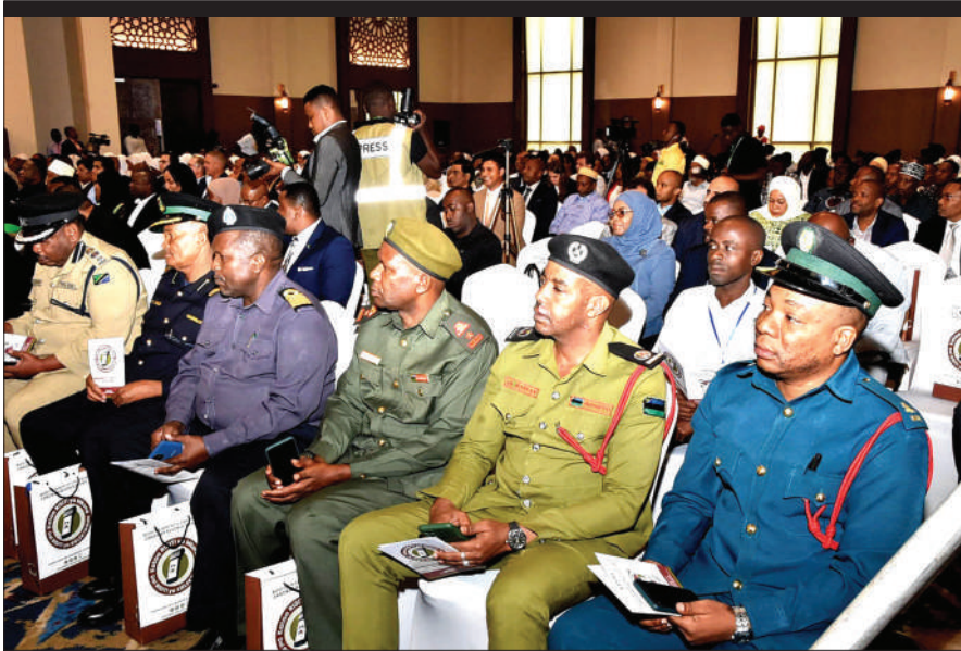
Wakuu wa Vyombo vya Ulinzi na Usalama wakiwa ni miongoni mwa washiriki katika sherehe ya maadhimisho ya siku ya shukurani na furaha kwa Mlipakodi ambayo Rais wa Zanzibar Dk Hussein Mwinyi alitoa tuzo mbalimbali.