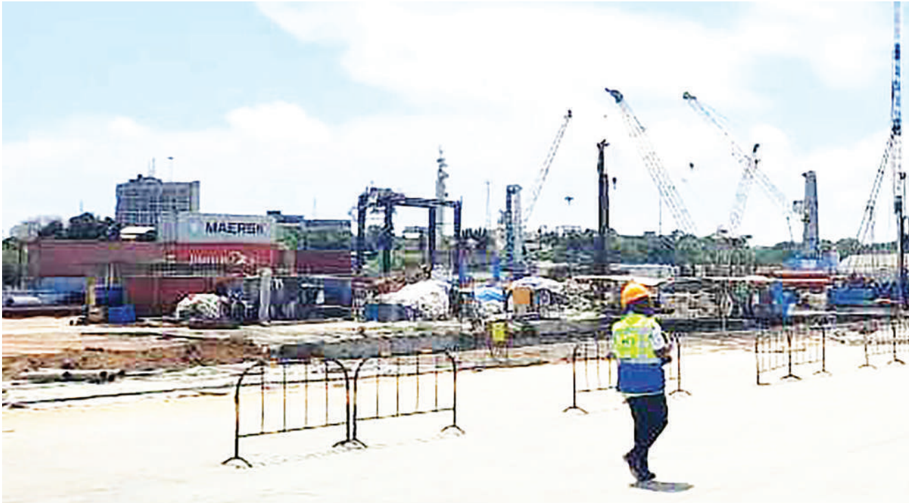
Mafundi wakiendelea na maboresho ya Bandari ya Tanga kwa kuongeza kina cha maji kutoka mita tatu hadi 13 na upana wa mita 73 kwenye njia ya kuingiza/kutokea meli kilomita 1.7.