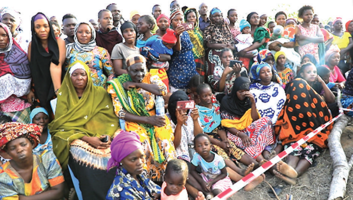
Baadhi ya wananchi wakimsikiliza Naibu Waziri wa Maliasili na Utalii, Mary Masanja (hayupo pichani), alipozungumza nao kuhusu uvamizi katika msitu wa kuni, wilayani Mvomero, mkoani Morogoro katika ziara yake.

Anasimulia zamani hapakuwapa zahanati kwenye kijiji hicho na walitembea umbali mrefu kwenda kliniki vijiji jirani akavitaja majina ya Pemba, Kibati na Bwagala kupata huduma za matibabu na kujifungua, jambo lilochangia wakajifungua majum-