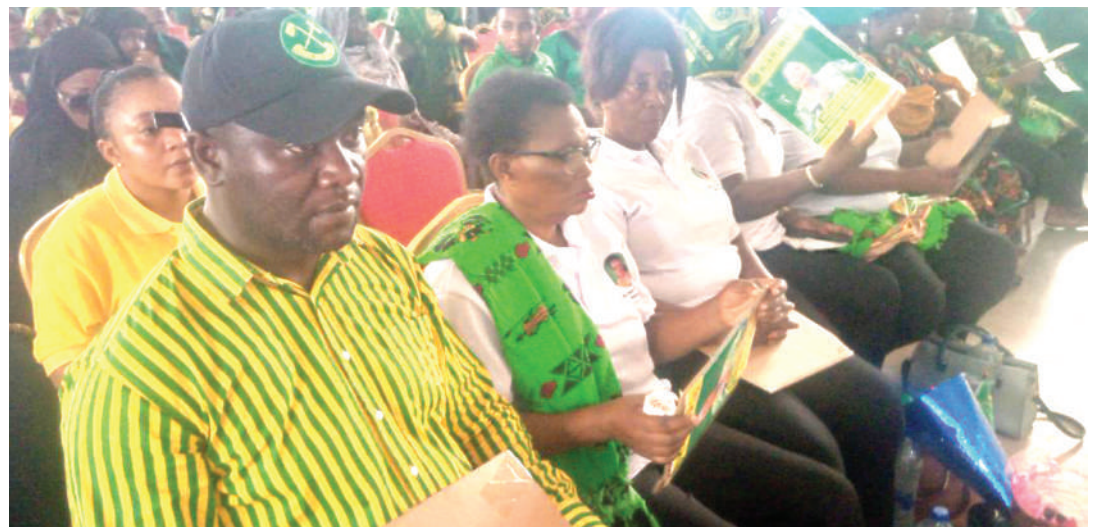
Baadhi ya wanachama wa UWT na CCM wakiwa katika mkutano wa mwenyekiti huyo mjini Korogwe alipotangaza ajenda za kubuni miradi zaidi ya kiuchumi na kuongeza idadi ya wanachama wa umoja huo.

“Baada ya hapo tutakuwa tunafuatilia kuona kama wanaendelea vizuri au kama kuna changamoto, zilizo ndani ya uwezo wetu, basi tuwasaidie kuzitua ili kuhakikisha mradi huo wa kufuga nyuki uwe na tija,” anasema Mchafu.