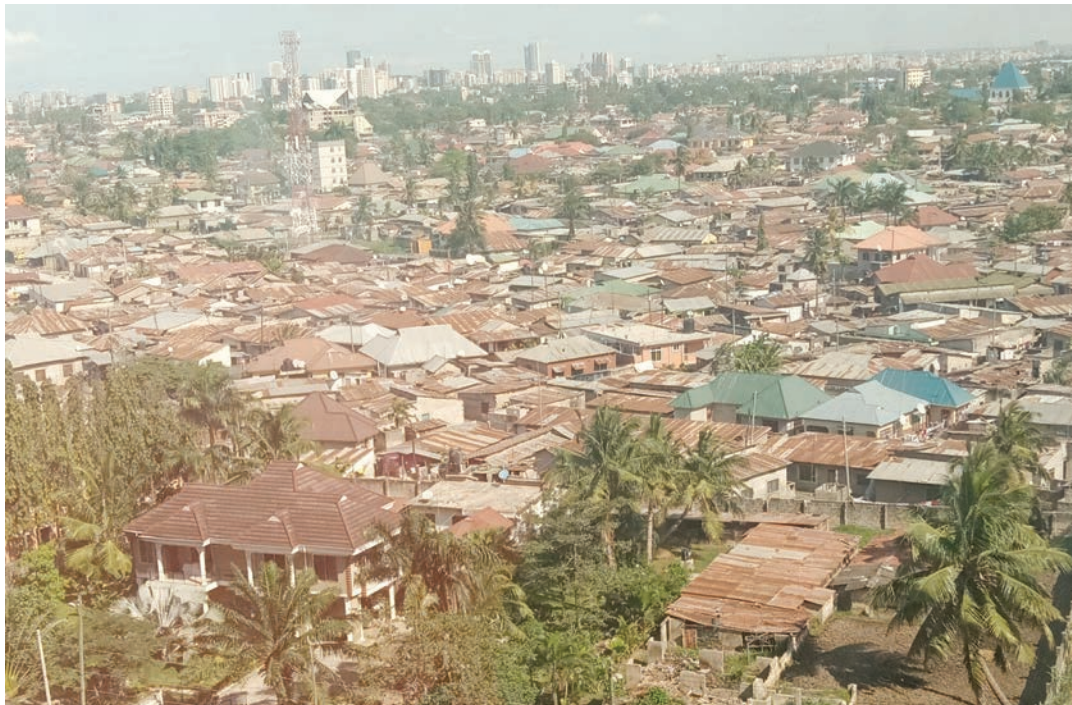
Mandhari ya Mwananyamala, jijini Dar es Salaam sasa, ambako kihistoria kulikuwa porini hata kuwapo na angalizo la wazazi 'mtoto nyamaza' kuhofia wanyama.

barabara au njia maarufu uliyotumia kuwaswaga ng'ombe kutoka ikaitwa 'cow way', kwa maana yake 'njia ya ng'ombe.'