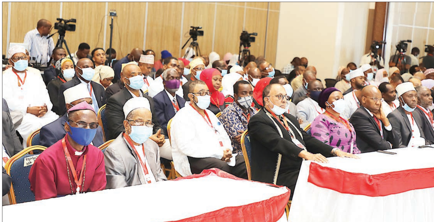
Sehemu ya viongozi mbalimbali wakifuatilia kwa makini hotuba ya Rais Samia Suluhu Hassan (hayupo pichani), wakati wa ufunguzi wa Kongamano la Kumbukizi ya Maisha ya Maalim Seif Sharif Hamad, jijini Zanzibar jana.

Amesema hali hiyo inatokana na chuo hicho kimo ndani ya hifadhi ya Mji Mkongwe ambao ndio kitovu cha utalii.