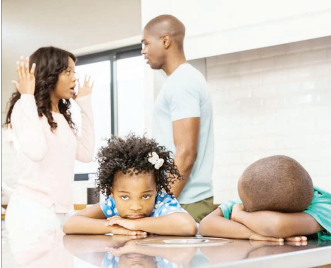
Ongezeko la migogoro ya ndoa limesababisha watoto kukosa malezi ya wazazi pamoja na kukosekana ustawi wa jamii na taifa kwa jumla.

●Yaibua kliniki ya ndoa na uhusiano wa ustawi majumbani