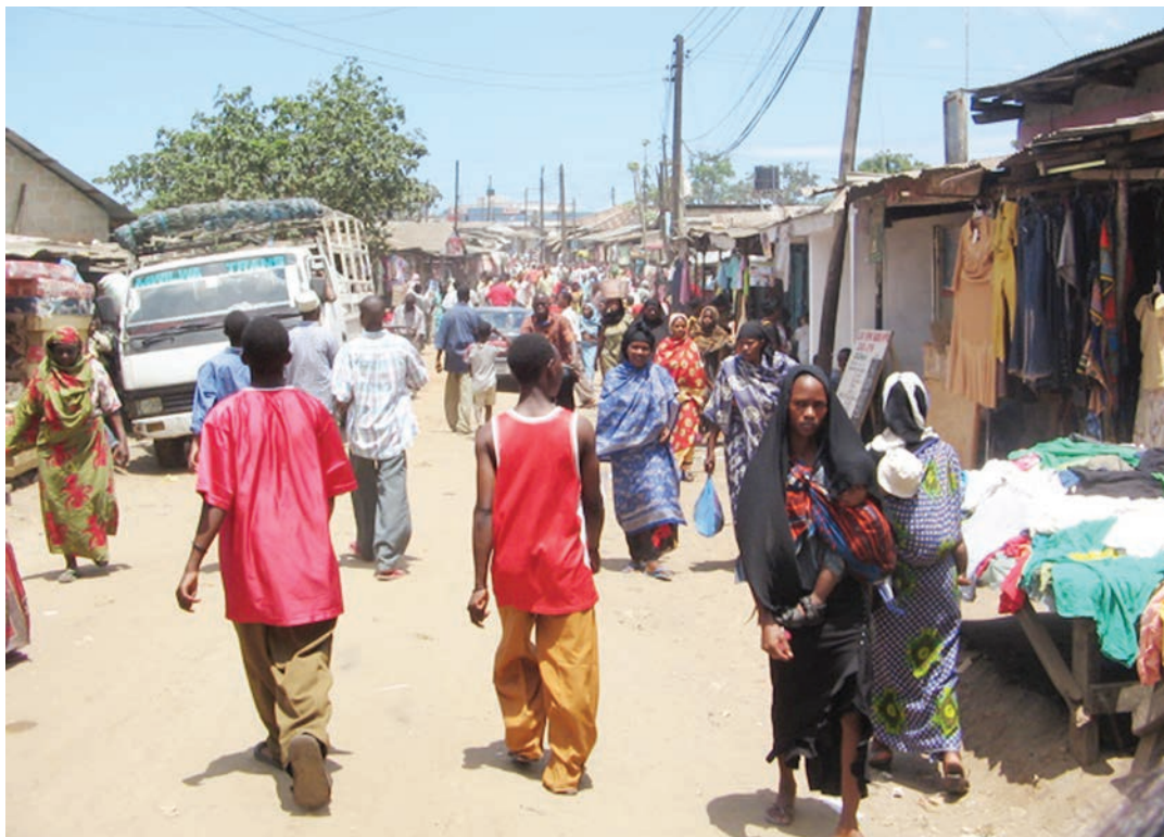
Sehemu ya Buguruni kwa Kimbengele sasa, kulikopatiwa jina kutokana na Mzee maarufu, Kimbengele, aliyekuwapo zama zilizopita.

Kwa wakati huo wenyewe waswahili walikuwa wakiwata makuli, ambao nalo ni zao kutoka kiingereza 'Coolie' kwa maana ya kibarua, Kariakoo ni mahali ambako ajira hiyo ilipatikana kwa wingi.