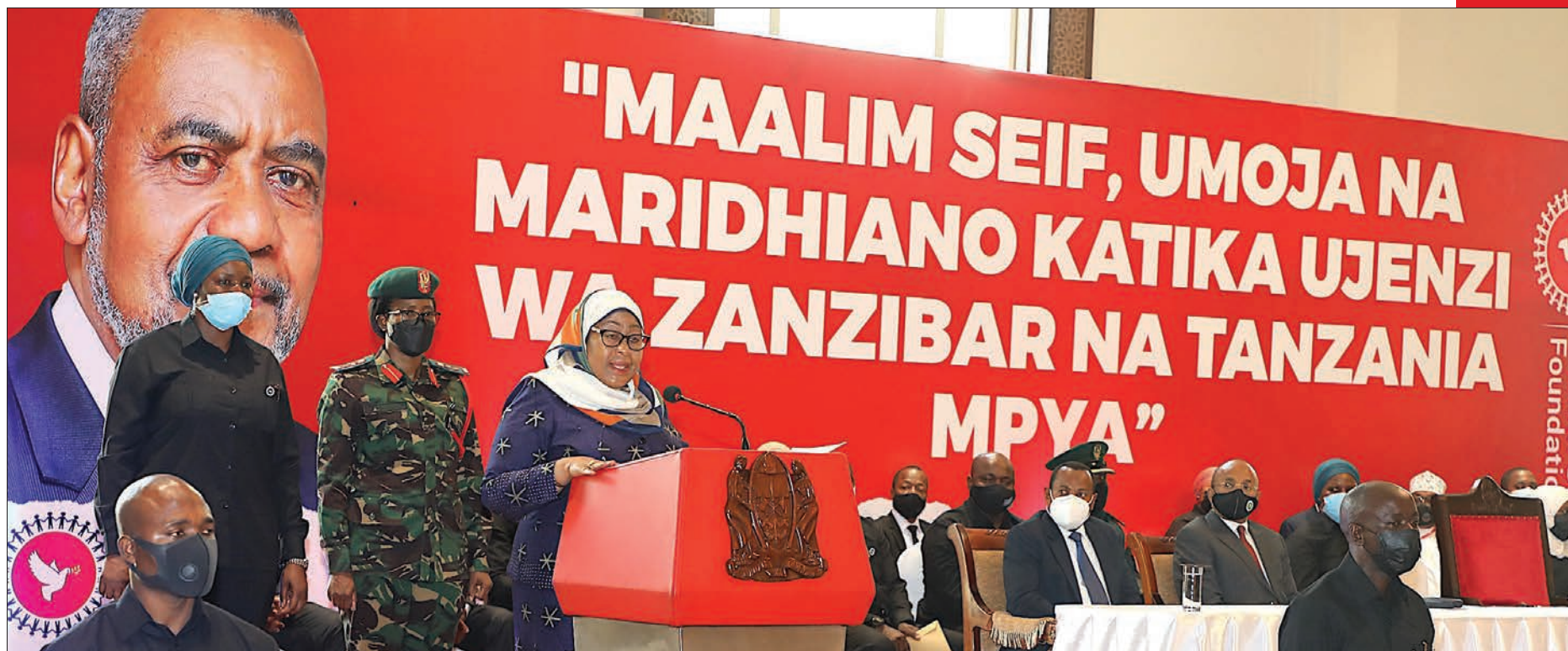
Rais Samia Suluhu Hassan, akihutubia kwenye ufunguzi wa Kongamano la Kumbukizi ya Maisha ya aliyekuwa Mwenyekiti wa Taifa wa Chama cha ACT-Wazalendo na Makamu wa Kwanza wa Rais Zanzibar, Maalim Seif Sharif Hamad, jijini Zanzibar jana.