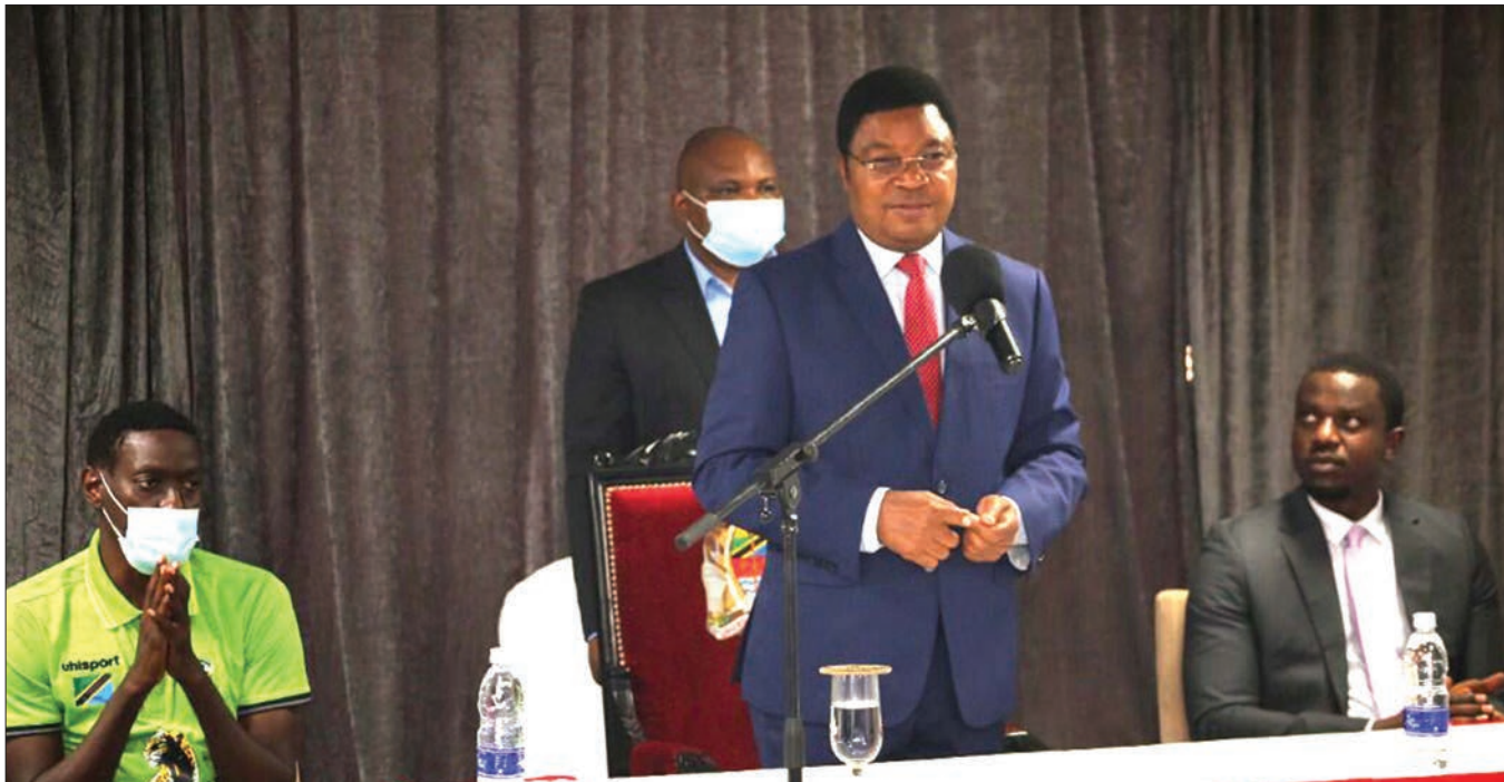
Waziri Mkuu Kassim Majaliwa (katikati), akizungumza na wachezaji wa Timu ya Soka ya Taifa (Taifa Stars), ambayo inajiandaa na mechi za kusaka tiketi ya kushiriki fainali za Kombe la Dunia dhidi ya Jamhuri ya Kidemokrasia ya Congo (DRC) na Madagascar. Kulia ni Waziri wa Utamaduni, Sanaa na Michezo, Innocent Bashungwa na kushoto ni nahodha wa Stars, John Bocco. Katika kikao hicho, Sh. bilioni 1.6 zilikusanywa kusaidia maandalizi ya timu hiyo.