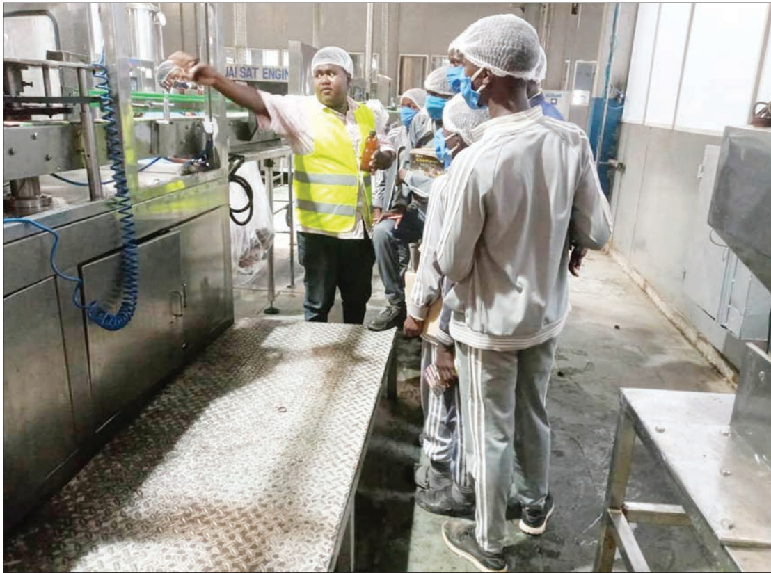
Picha tofauti za wanafunzi wa Shule ya Msingi Kadama, iliyoko mkoani Geita, wakiwa kwenye ziara ya mafunzo katika kiwanda cha kutengeneza vinyuwaji baridi, jijini Mwanza.