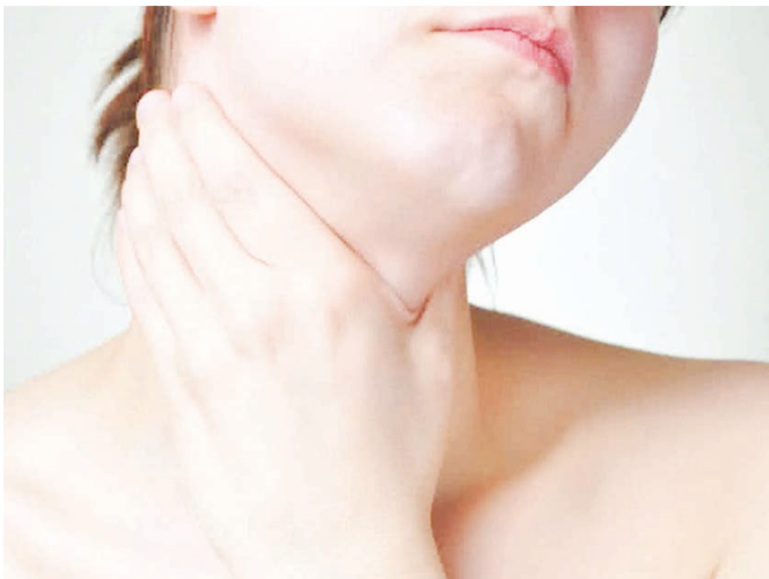
Iivyo sura halisi ya tezi na inavyosumbua.

Kusukutua kwa kutumia maji yenye chumvi, ni aina nyingine