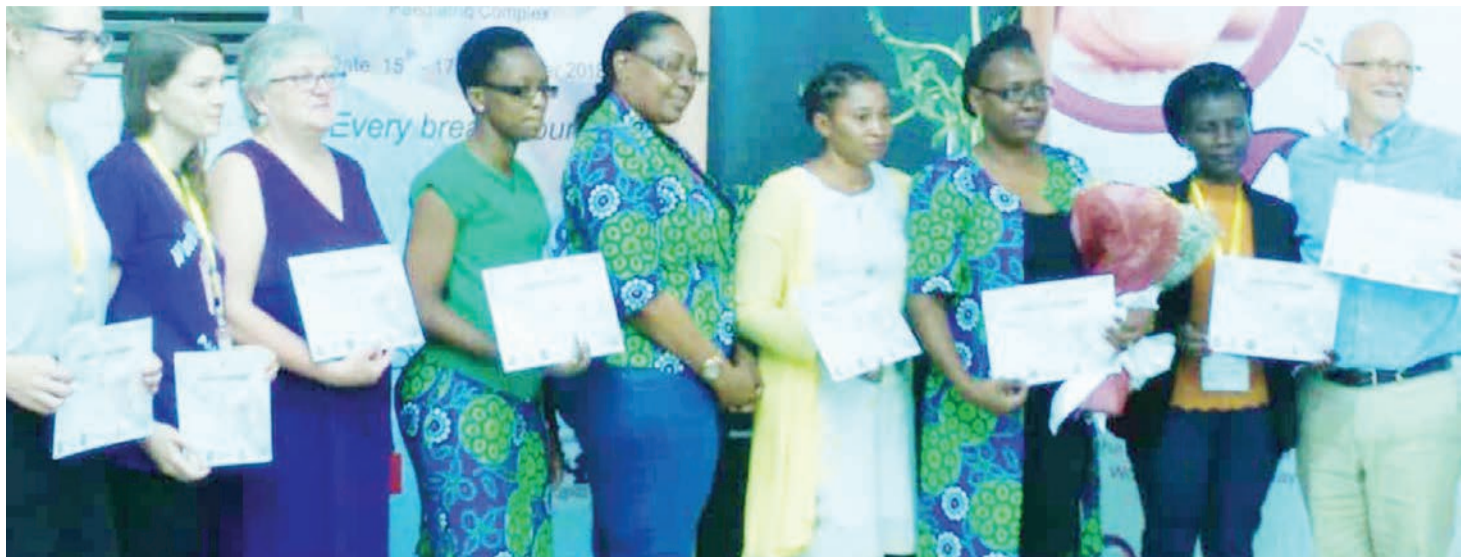
Madaktari mabingwa wa watoto, wakiwa pamoja baada ya kukutana ili kuongeza ujuzi kuhusu kuhudumia watoto njiti, hospitalini Muhimbili. Chini; wageni wanaowatembelea kinamama wenye watoto njiti hospitalini.

Taarifa ya Unicef mwaka 2014, iliyotolewa kwa kushirikiana na wadau, inasema vifo vya watoto