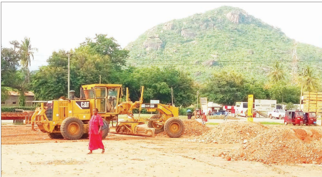
Greda la kuchonga barabara likiwa linasawazisha udongo eneo la stendi kuu ya mabasi wilayani Masasi, mkoani Mtwara, jana, kutokana na mashimo yaliyokuwapo.