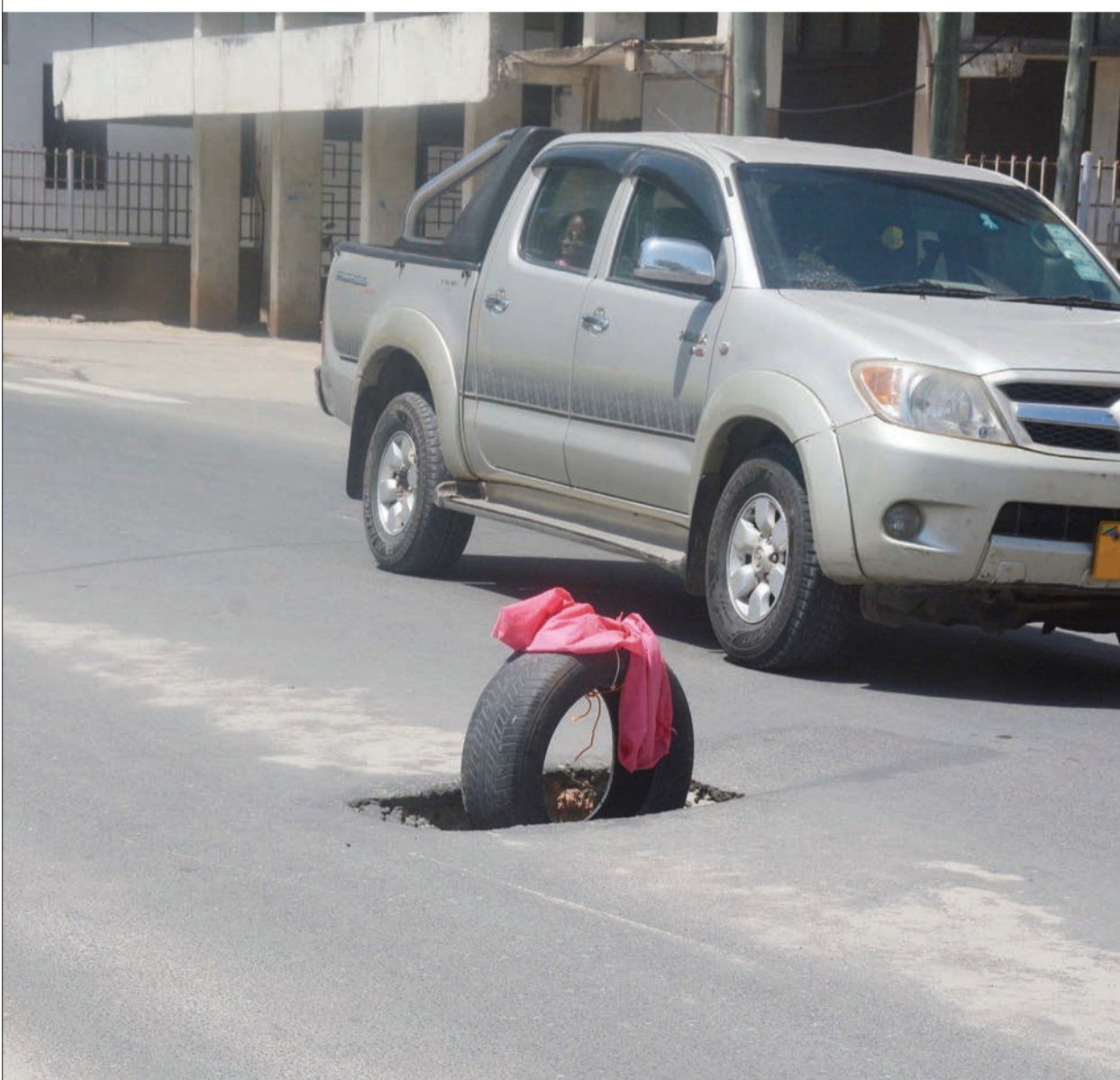
Gari likipita karibu na shimo lililowekewa alama ya tairi kama tahadhari Mtaa wa Sokoine jijini Dar es Salaam jana.

Aliongeza kuwa wananchi wasianganalie gharama za vifurushi bali waangalie huduma zinazopatikana na wakumbuke matibabu ni gharama sana.