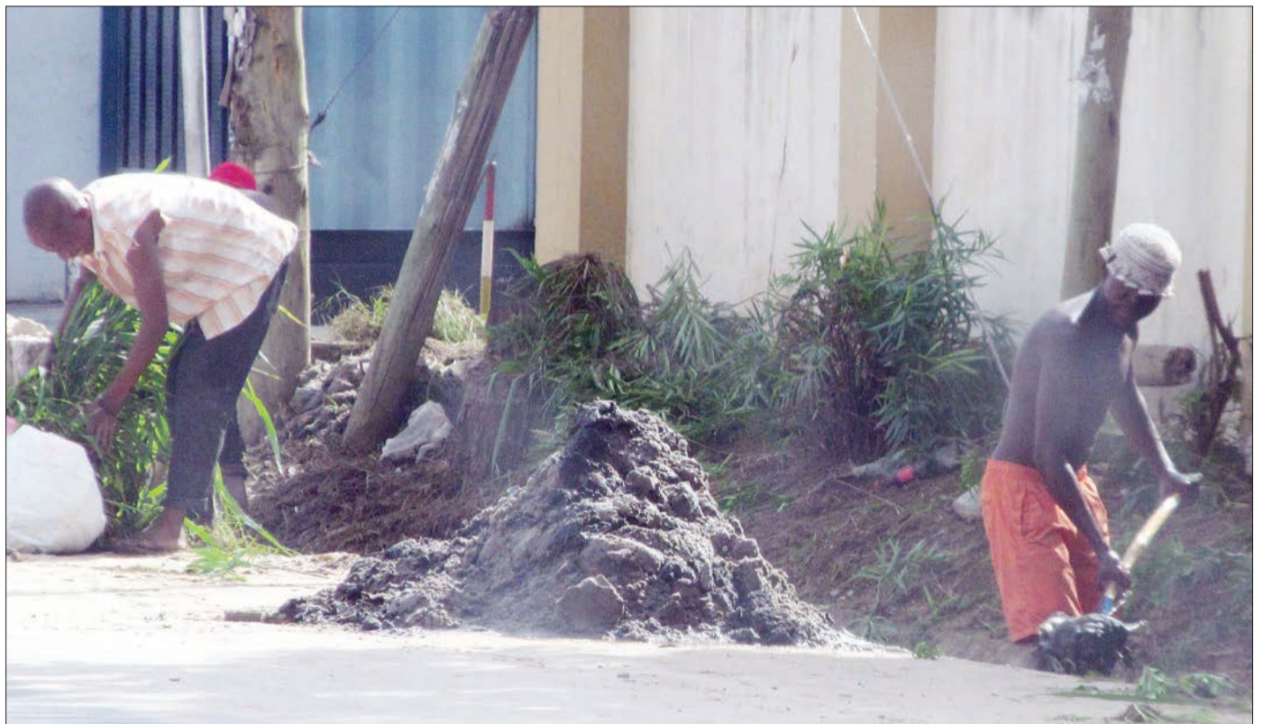
Mkazi wa jijini akiondoa taka kwenye mtaro eneo la Mbezi Masana jijini Dar es Salaam, jana, zilizosababisha kuziba mtaro huo, kutokana na mvua zinazoendelea kuonyesha.