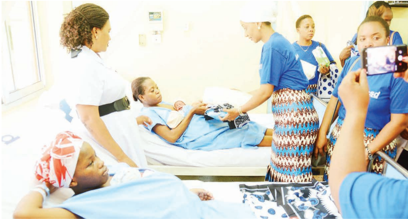
Kinamama wenye watoto njiti walipotembelewa hospitalini.

"Hali yangu ikawa sio nzuri, daktari akaniambia mtoto ana kilo moja tumboni, kwa hiyo akizaliwa uzito unaweza kupungua zaidi au wanifanyie operesheni, wamtoe mtoto kama atakuwa mzima au nijifungue kawaida".