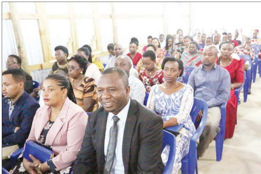
Baadhi ya waumini wa Kikristo Kanisa la Kiinjili la Kilutheri Tanzania (KKKT) Mtaa wa Kisasa wakishiriki ibada ya Krismasi ambayo husherehekewa kila mwaka Desemba 25, ikiwa ni kumbukumbu ya kuzaliwa kwa Yesu Kristo zaidi ya miaka 2000 iliyopita.