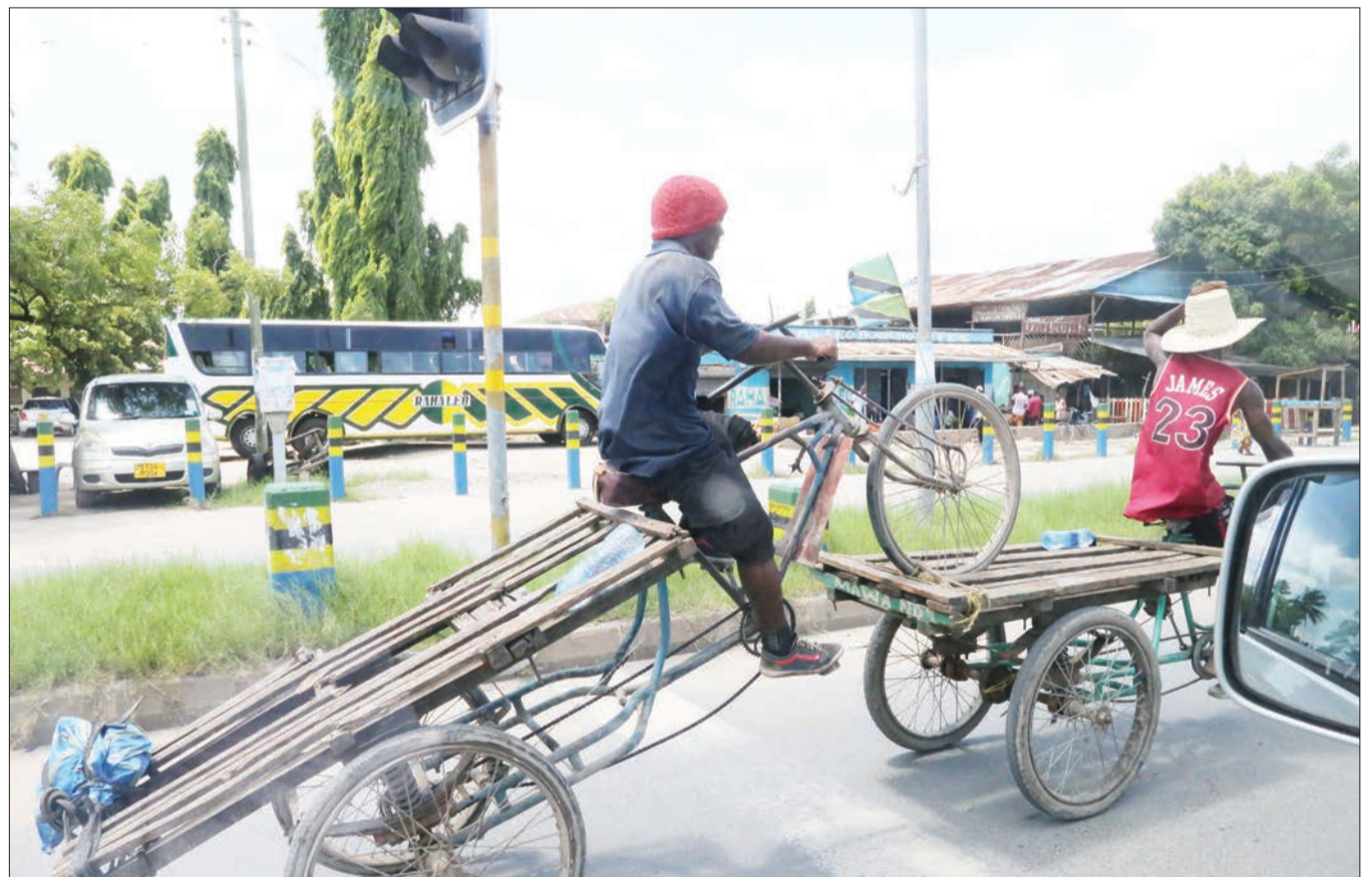
Mwendesha guta akipewa msaada wa kuvutiwa mkokoteni wake baada ya kuharibika na kushindwa kutembea eneo la Manzese hivi karibuni.