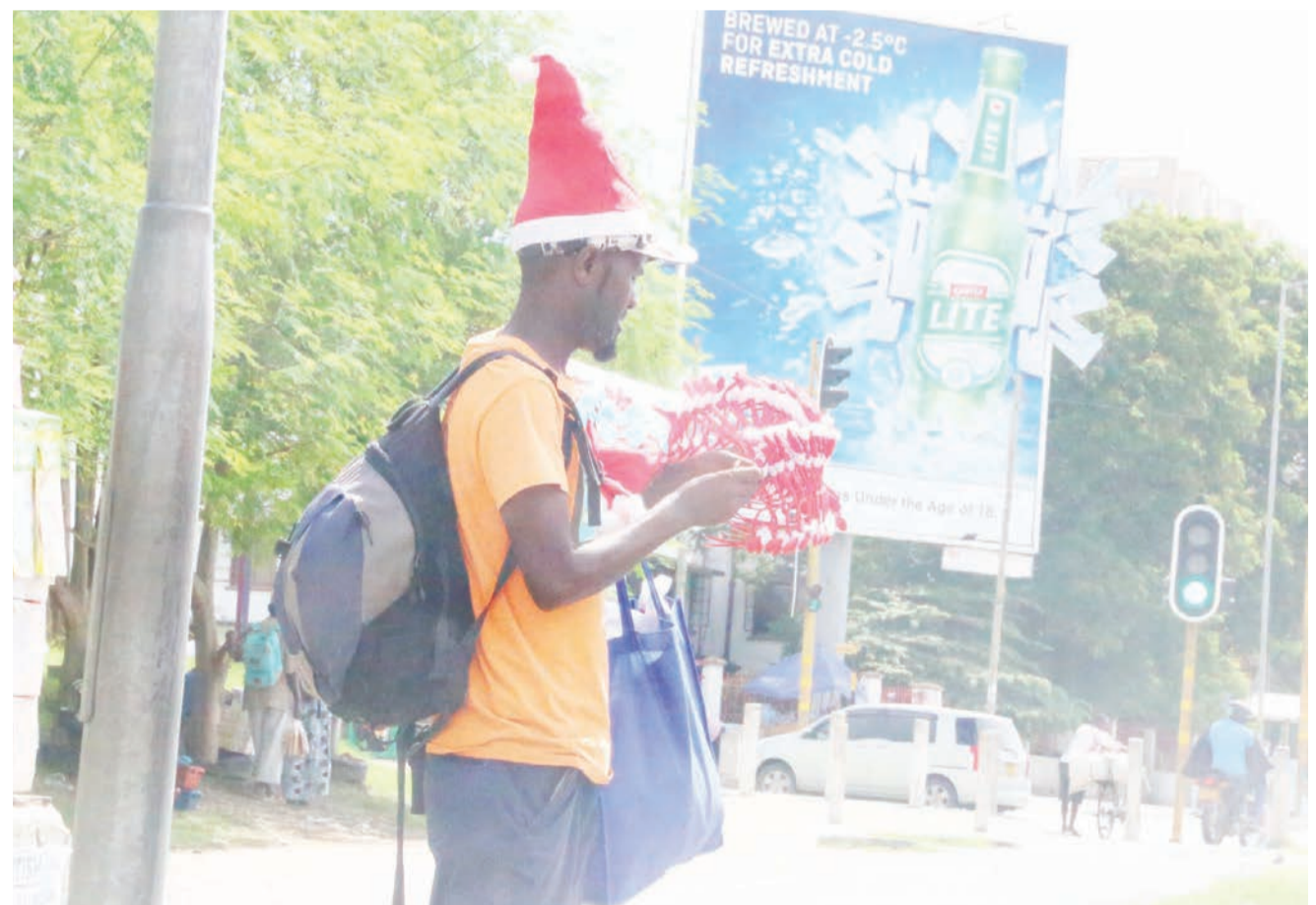
Mfanyabiashara ndogo akiwa anatembeza kofia za Father Krismasi eneo la Fire jijini Dar es Salaam, jana.

Changamoto nyingine aliyoitaja ni pamoja na kuwekewa vikwazo vya kuelekea kwenye utekelezaji wa agizo la serikali la kuhakikisha madini yote yanachakatwa nchini ambapo licha ya kuwapata wahisani wa kuwasaidia wamekuwa wakiwekewa masharti magumu ya kuingia nchini.