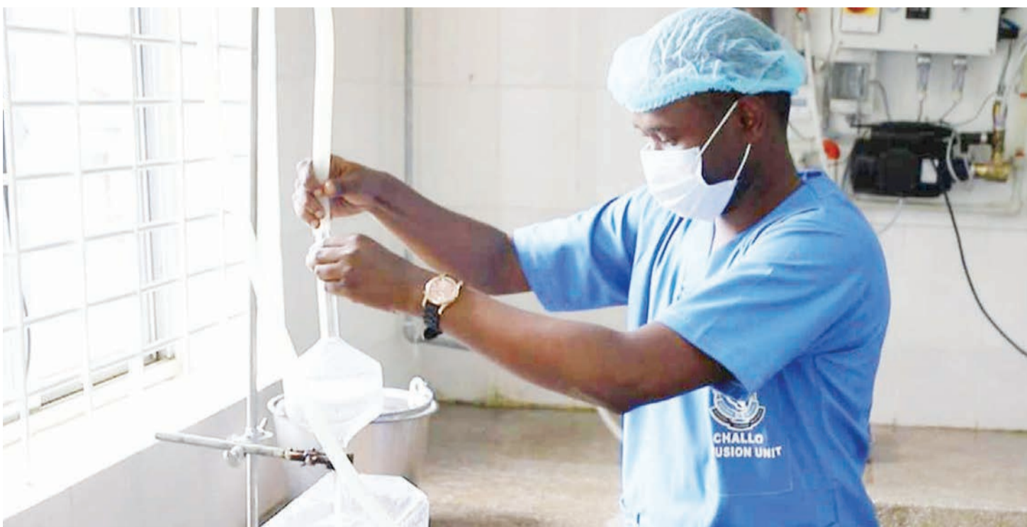
Mtaalamu akionyesha namna ya kutengeneza maji tiba.