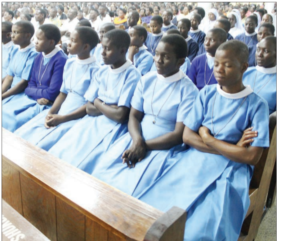
Wanafunzi wanaosoma utawa wakiwa kwenye mkeshwa wa sikukuu ya kuzaliwa Yesu Kristo (Krismasi), iliyofanyika katika Kanisa Katoliki la Mama Mwenye Huruma, Ngokolo, Shinyanga Mjini.