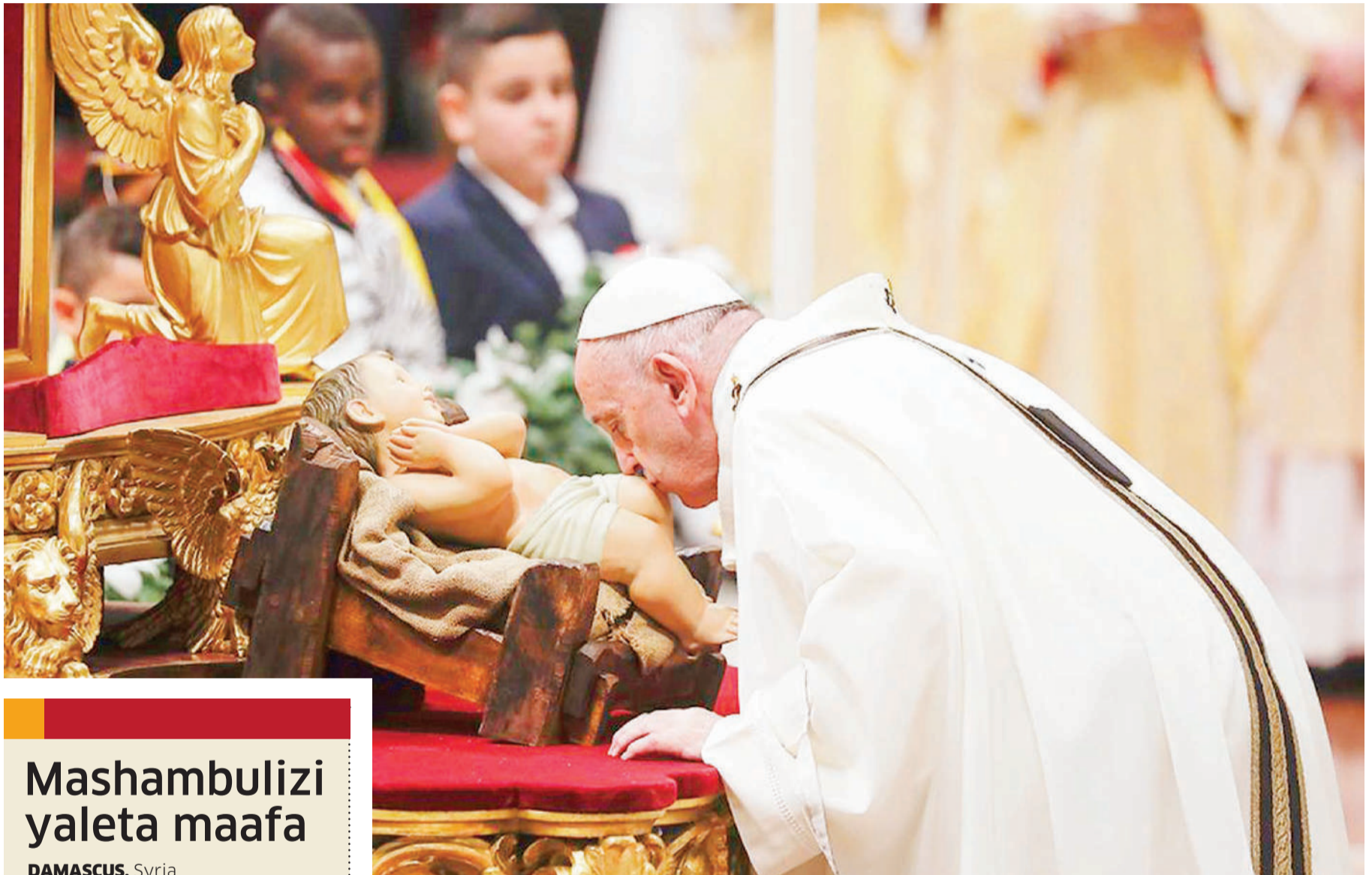
Papa Francis akibusu sanamu ya mtoto Yesu katika kusherehekea sikukuu ya Krismasi katika Kanisa la Mt. Peter Basilica, Vatican.

Miongoni mwa wale wanaoshiriki katika ibada hiyo ni watoto waliochaguliwa kutoka mataifa kama vile Venezuela, Iraq na Uganda. BBC