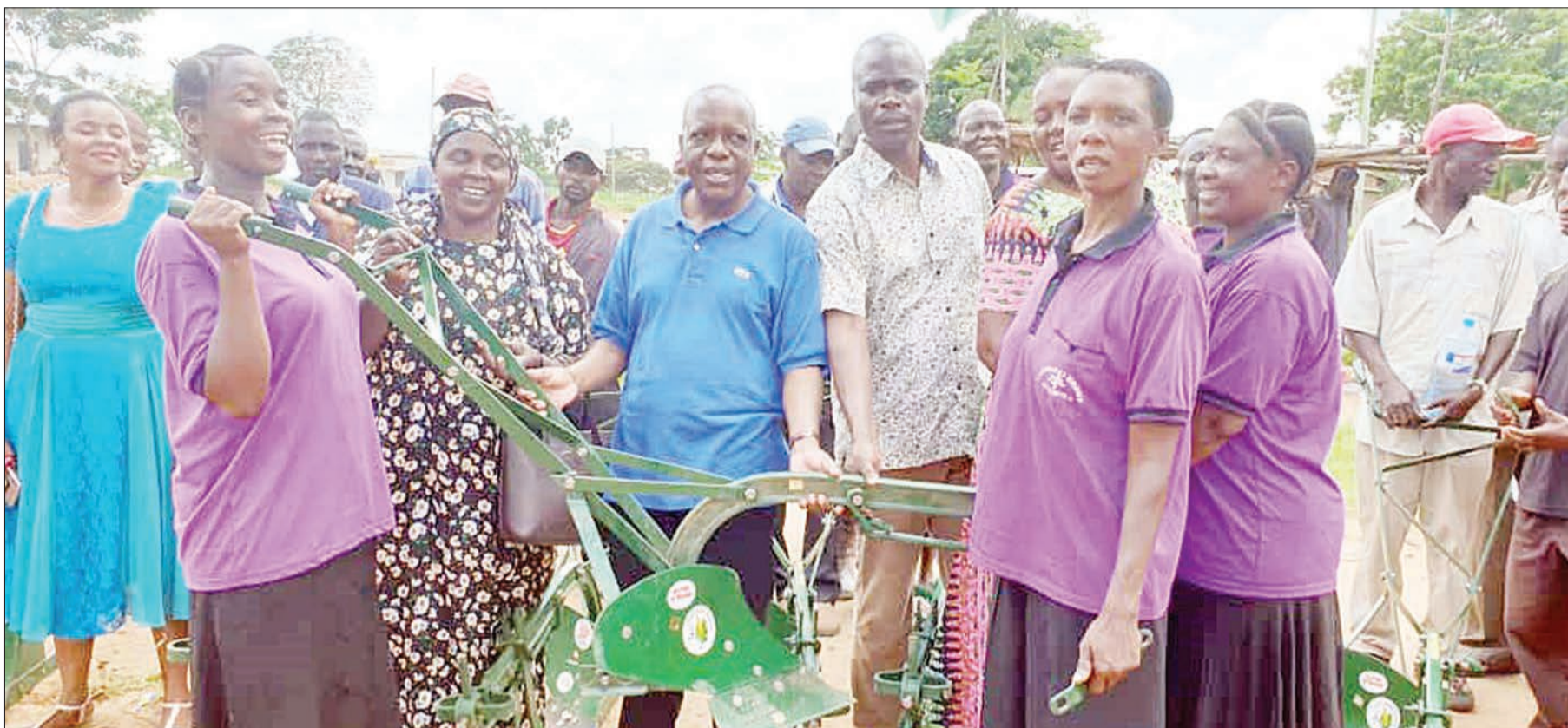
Mbunge wa Musoma Vijijini mkoani Mara, Profesa Sospeter Muhongo (mwenye tisheti ya bluu) na wakazi wengine wa jimboni mwake, wakiwa na moja ya majembe ya kukokotwa na ng'ombe, ambayo aligawa kwa vikundi 20 vinavyojishughulisha na kilimo, ikiwa ni kampeni ya kupunguza matumizi ya jembe la mkono.