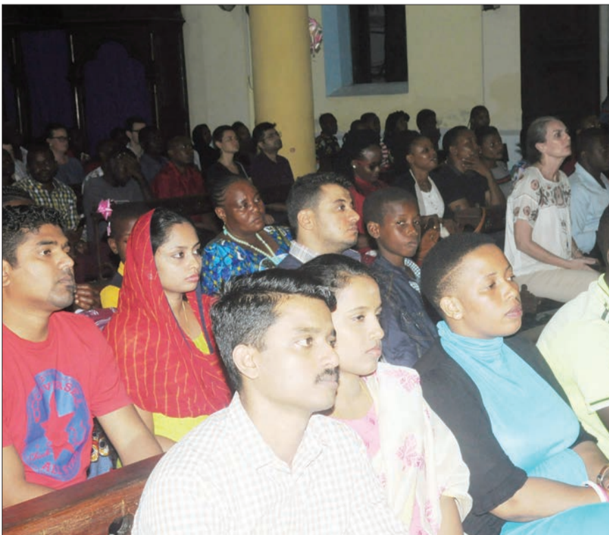
Waumini wa Kanisa Katoliki wakifuatilia ibada ya mkeshwa katika Kanisa la Mt. Joseph mjini Zanzibar, jana.