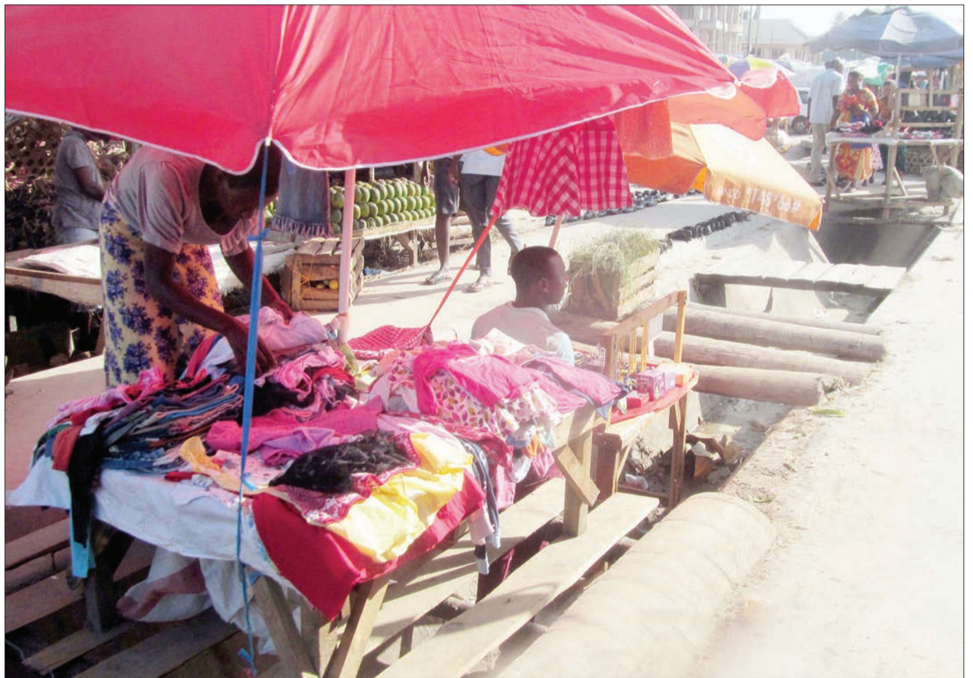
Wafanyabiashara ndogo maarufu Machinga wakiendelea na biashara zao zilizopangwa kwenye mbao juu ya mtaro wa maji ya mvua, eneo la Mbezi Mwisho, jijini Dar es Salaam jana.

"Tunapoelekea kuhitimisha mwaka huu na kuanza mwaka ujao 2020, itakuwa ni fursa ya kijitathmini tulivyoenenda 2019 na kujitahidi kupambanua malengo, mipango na vipaumbele vyetu ili tupige hatua katika maisha yetu," alisema.