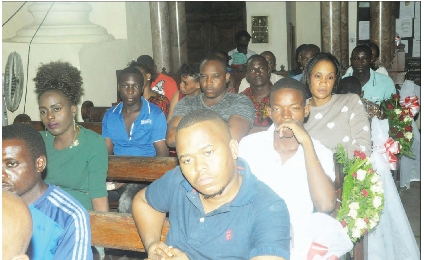
Waumini wa Kanisa la Anglican Mkunazini Zanzibar, wakifuatilia ibada ya mkeshwa wa Krismasi kwenye kanisa hilo jana.

“Pia nasikitishwa sana na wimbi la matukio ya vitendo vya udhalilishaji wa kijinsia kwa jamii yetu huku watoto na wanawake chini ya umri wa miaka 18 wakiathirika vibaya,” aliongeza.