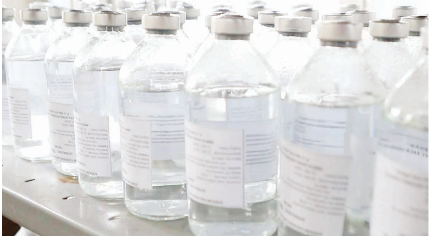
Maji tiba yanayozalishwa katika hospitali Mbeya.