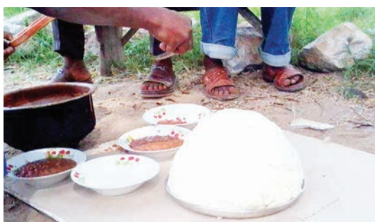
Ugali, mlo unaoliwa zaidi Afrika na unachangia nguvu kwa binadamu.