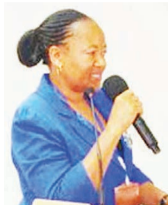
Dk. Julieth Magandi wa Hospitali ya Taifa Muhimbili (MNH) akiwasilisha hoja katika moja ya Siku ya Kuhudumia Watoto Njiti.

"Daktari akamuita nesi ili aje anite nipewe maelekezo nilipofika pale akanielekeza nikamue maziwa kiasi fulani na kumpatia mtoto kupitia bomba la sindano hadi kwenye mrija kulingana na kiasi nilichoambiwa na daktari na kila siku kiasi kilikuwa kinaongezeka kadri uzito unavyoongezeka na kumbeba kifua ni kwa