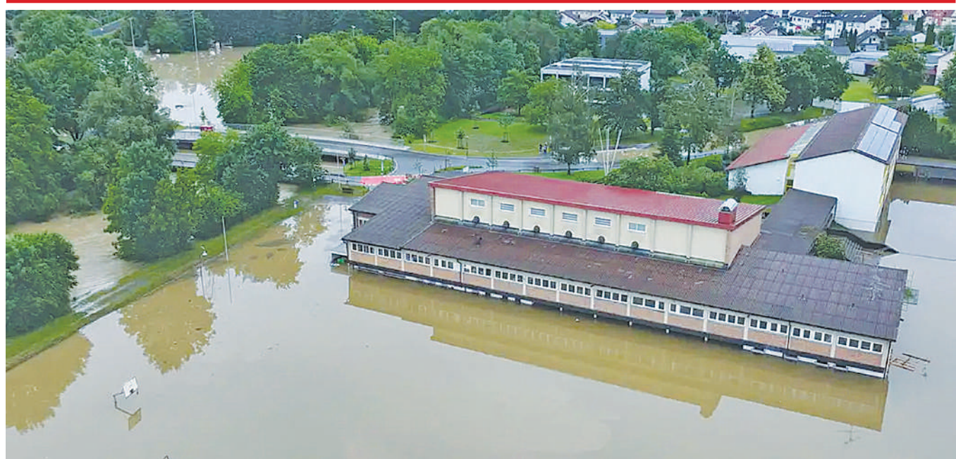
Hali ilivyo katika Jimbo la Baden Wurttemberg nchini Ujerumani baada ya kukumbwa na mafuriko ambayo yamesababisha maelfu ya watu kuhamishwa katika makazi yao jana.