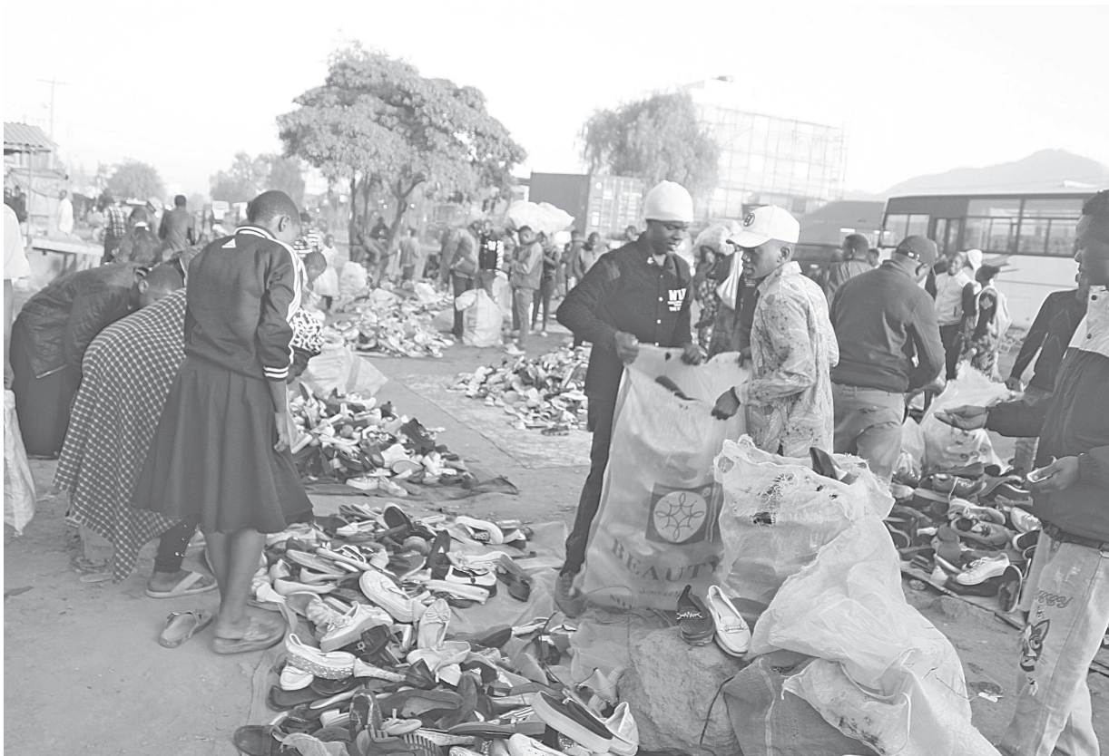
Baadhi ya wajasiriamali wa eneo la Kabwe jijini Mbeya, wakiendelea kuuza viatu pembezoni mwa barabara kuu ya Tanzania na Zambia (TANZAM) baada ya kuondolewa katika eneo la Stendi ya Kabwe kutokana na kuuza bidhaa zao nje ya maduka ya wafanyabiashara wengine na kusababisha migogoro.

Hivi karibuni Waziri Silaa aliwapa wamiliki wa ardhi zikiwamo taasisi za umma zinazodaiwa kodi ya pango la ardhi kuhakikisha wamelipa hadi kufikia Juni 10, mwaka huu, lasivyo, hatua za kisheria zitachukuliwa kwa watakaokaidi amri hiyo.