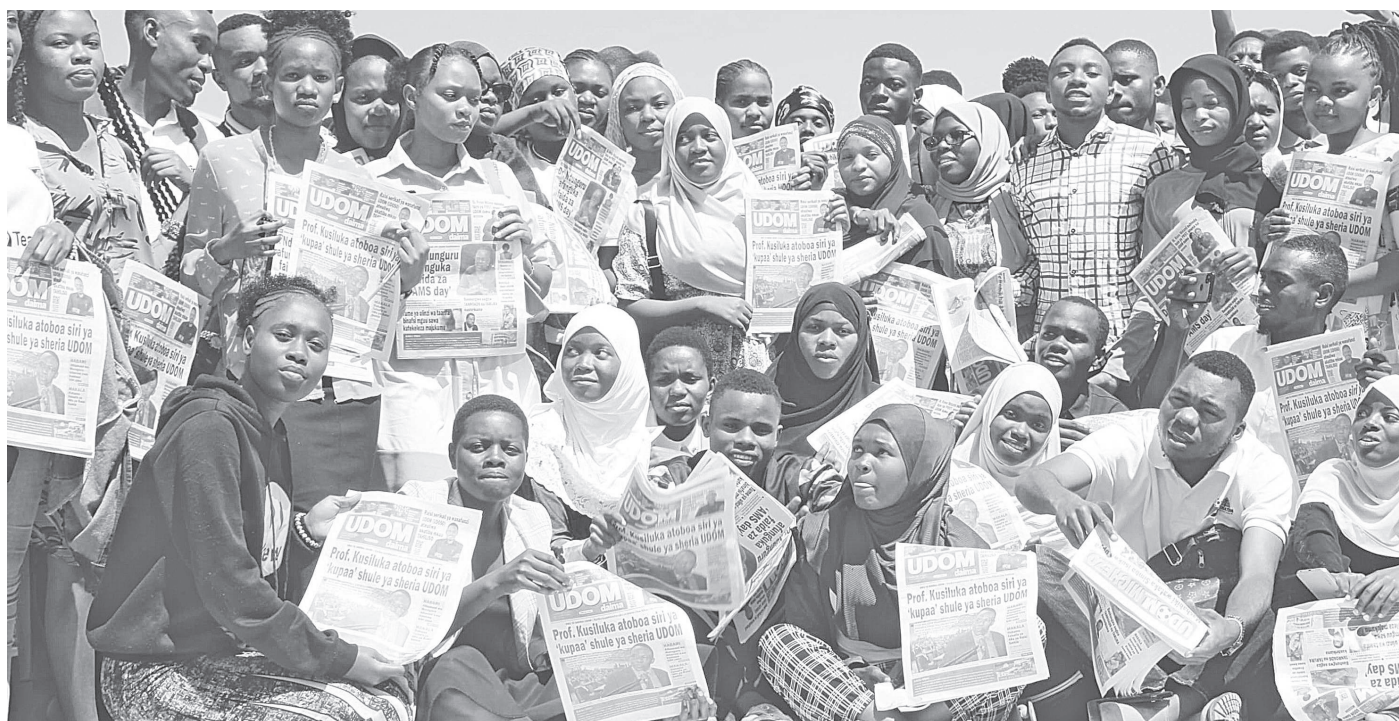
Baadhi ya wanafunzi wa Shahada ya awali ya Uandishi wa Habari na Mahusiano ya Umma (BAJP), kutoka katika Chuo Kikuu cha Dodoma (UDOM) wakifuraha kutimiza ndoto yao ya kuchapisha gazeti la kujifunzia lililochapishwa na Kampuni ya The Guardian hivi karibuni.