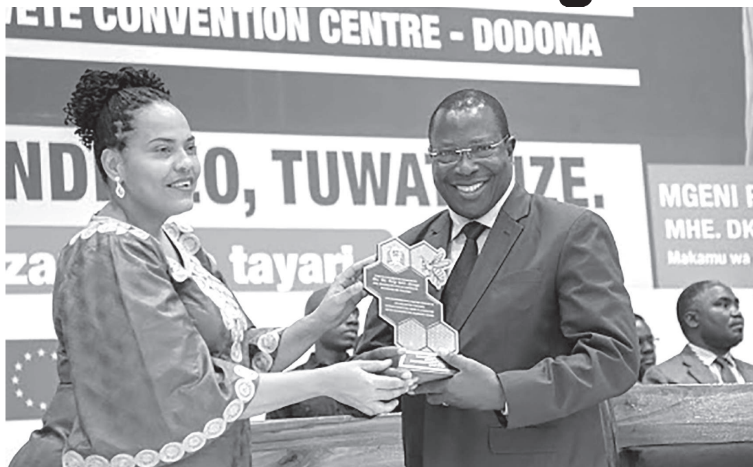
Makamu wa Rais Dk. Philip Mpango, akikabidhiwa tuzo na Waziri wa Maliasili na Utalii, Angelah Kairuki, kutambua mchango wa Rais Samia Suluhu Hassan, kuendeleza sekta ya ufugaji wa nyuki na uhifadhi wa mazingira.

Hivyo, kwa mwaka 2024, wajasiriamali na wadau takribani 90 wanashiriki kikamilifu wakionyesha mazao na bidhaa mbalimbali kutokana na kazi nzuri inayofanywa na 'nyuki'.