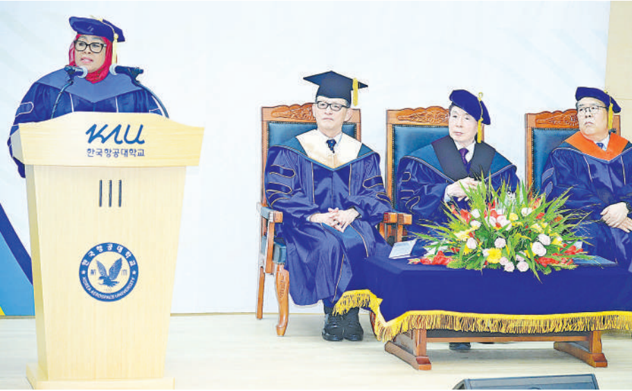
Rais Samia Suluhu Hassan akizungumza na viongozi mbalimbali wa Chuo Kikuu cha Sayansi ya Anga cha Korea pamoja wanafunzi wa chuo hicho baada ya kutunukiwa Udaktari wa Falsafa ya Heshima katika Sekta ya Anga (Honoris Causa) jijini Seoul, Jamhuri ya Korea jana.