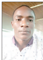
Na Maulid Mmbaga