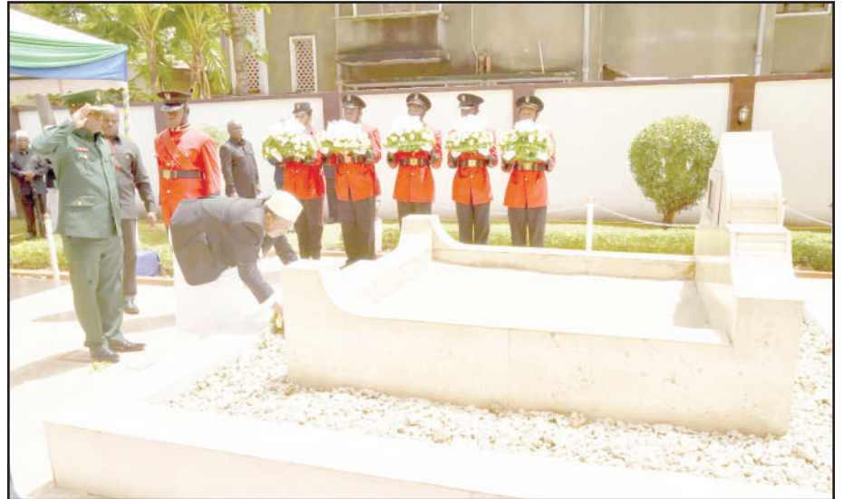
Rais wa Zanzibar na Mwenyekiti wa Baraza la Mapinduzi, Alhaji Dk. Hussein Ali Mwinyi, akiweka shada la maua katika kaburi la Hayati Abeid Amani Karume.