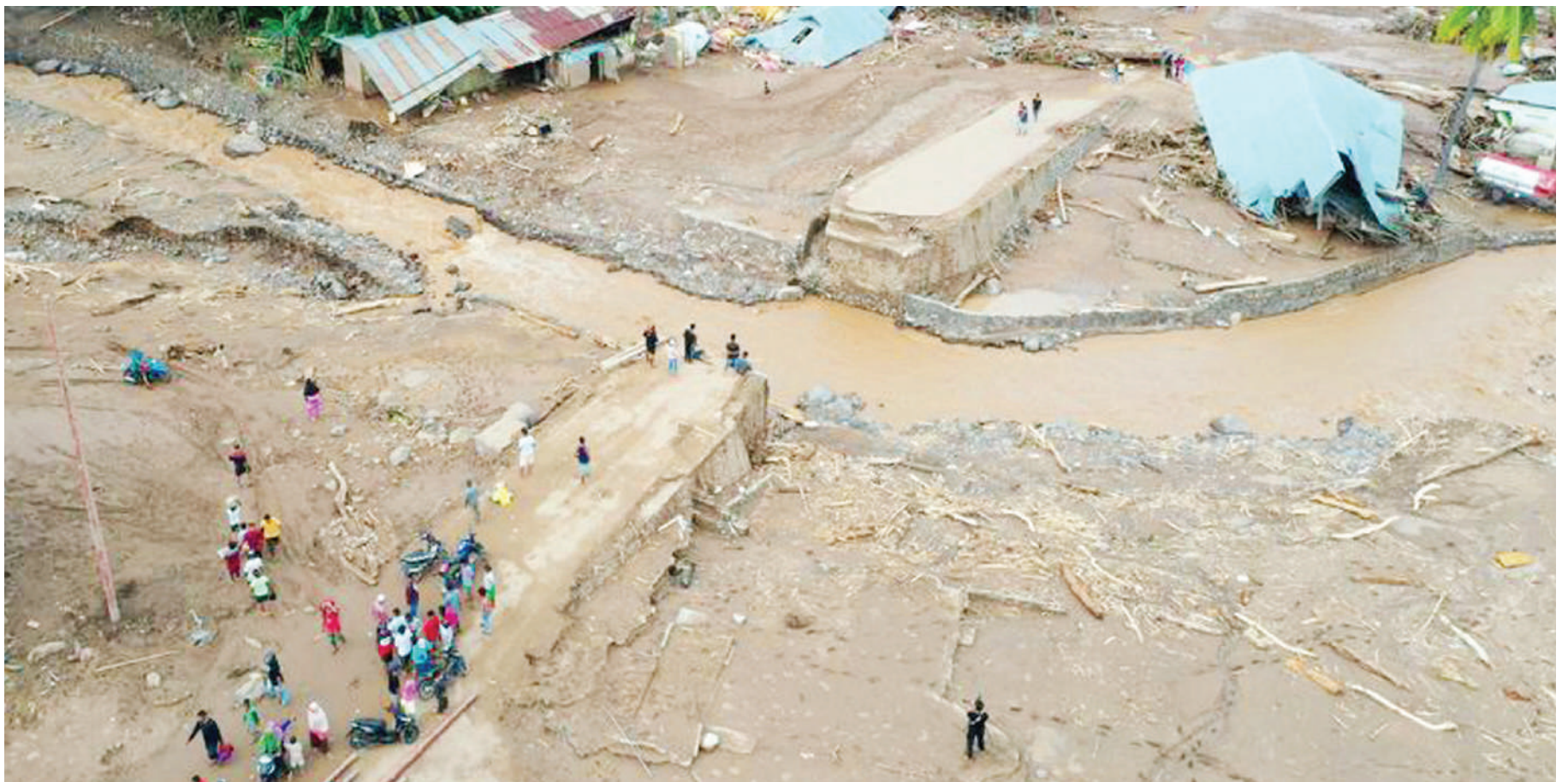
Picha iliyopigwa kwa juu ikionyesha athari za mafuriko na kusababisha barabara kuharibika, nyumba kufunikwa na tope kutokana na mvua kubwa, zilizoikumba kisiwa cha Flores, Jimbo la Nusa Tenggara, nchini Indonesia, juzi.

Mwenyekiti wa SADC, Rais wa Botswana, Mokgweetsi Masisi, alisema mashambulizi hayo yanatishia amani na usalama wa Msumbiji, eneo zima na jumuiya ya kimataifa. DW