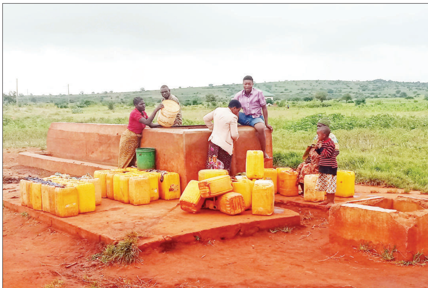
Wanakijiji wa Kijiji cha Pwaga, wilayani Mpwapwa, mkoani Dodoma, wakichota maji katika moja ya kisima kijijini hapo juzi, ambapo mpango wa kunusuru kaya maskini (TASAF), umewawezesha fedha na kwa ajili ya kuchimba bwawa la maji.