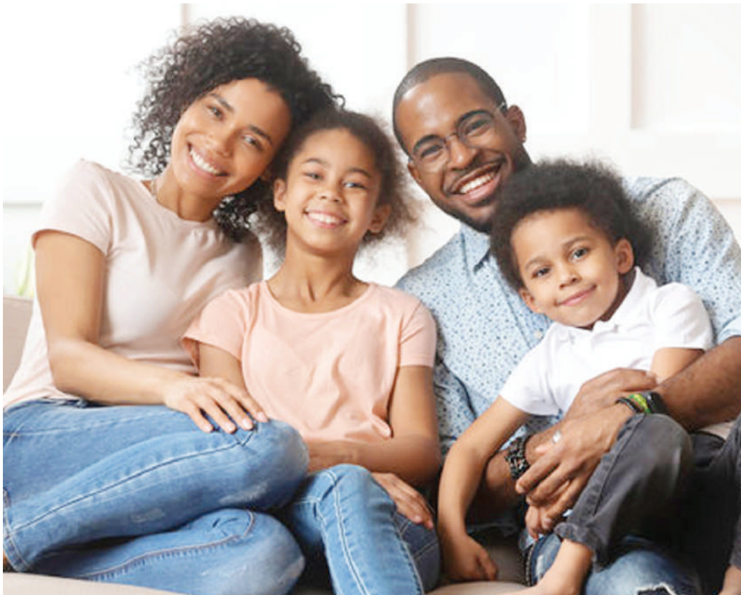
Jamii ya wanafamilia. Picha ya chini; dawa za uzazi.

Anasema, hata kama mwanaume atapoteza asilimia 90 ya uwezo wake wa kuzalisha, bado anaweza kurutubisha yai na hiyo ndio inachangia sababu kidonge