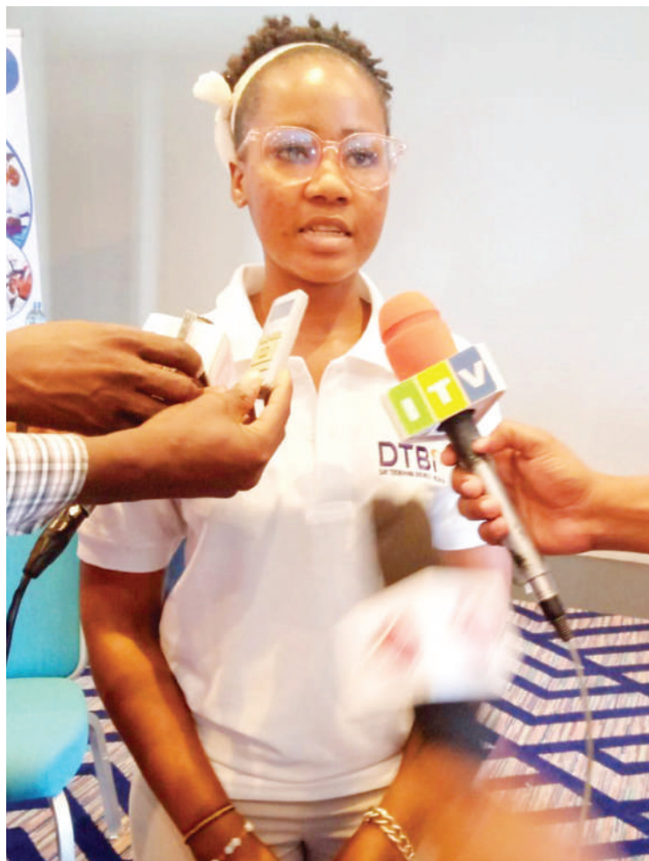
Paulina alipofafanua kuhusu hali ya mradi.