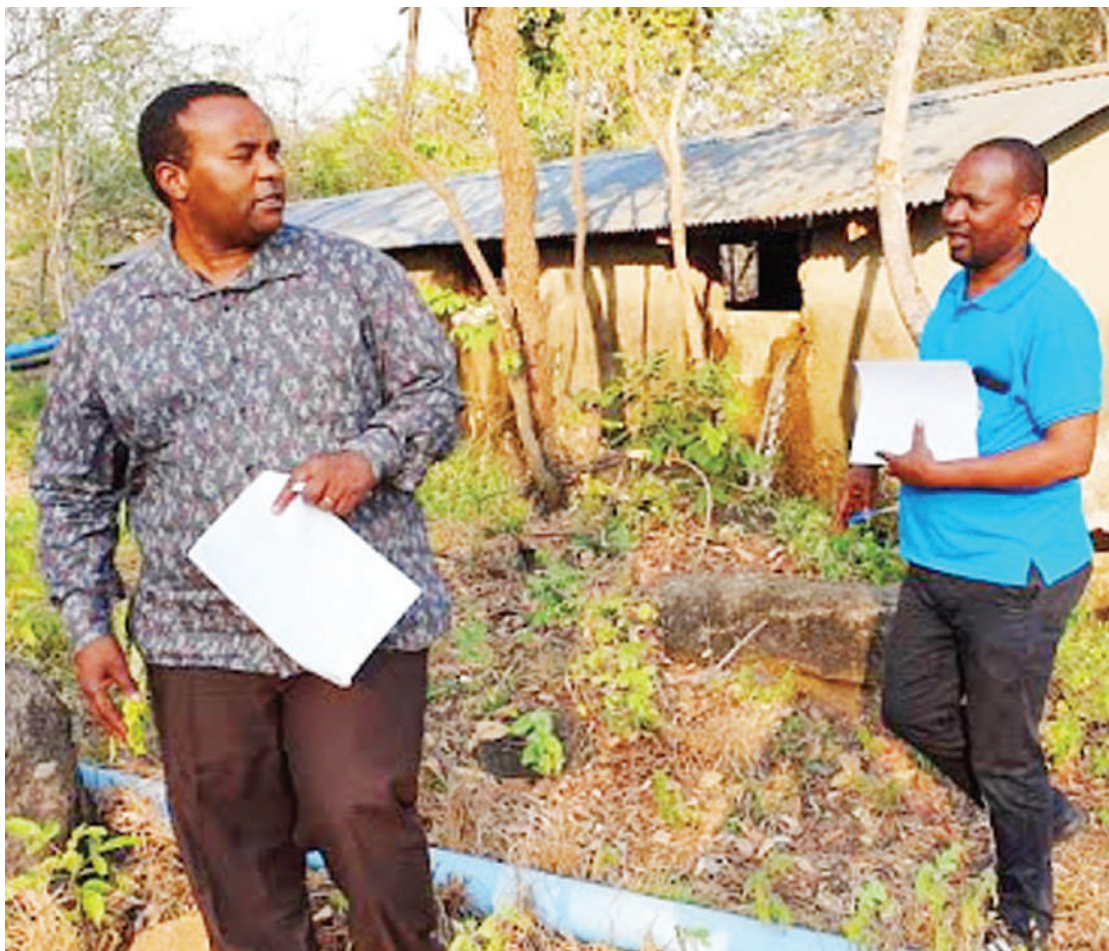
Kituo cha Kuchuja Maji Mutuka, wilayani Babati, sehemu ya miradi ilipokuwa inaendelea kuandaliwa mwaka jana, chini ya RUWASA.