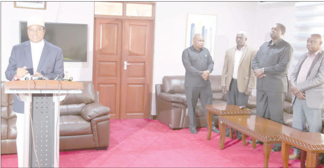
Waziri Mkuu Kasimu Majaliwa na Mwenyekiti wa Kamati ya Mazishi ya aliyekuwa Rais wa Tanzania, Hayati Dk. John Magufuli, akizungumza na waandishi wa habari jijini Dodoma jana, kuhusu kufikia mwisho wa maombolezo ya kitaifa ya kifo hicho, kilichotokea machi 17, mwaka huu.