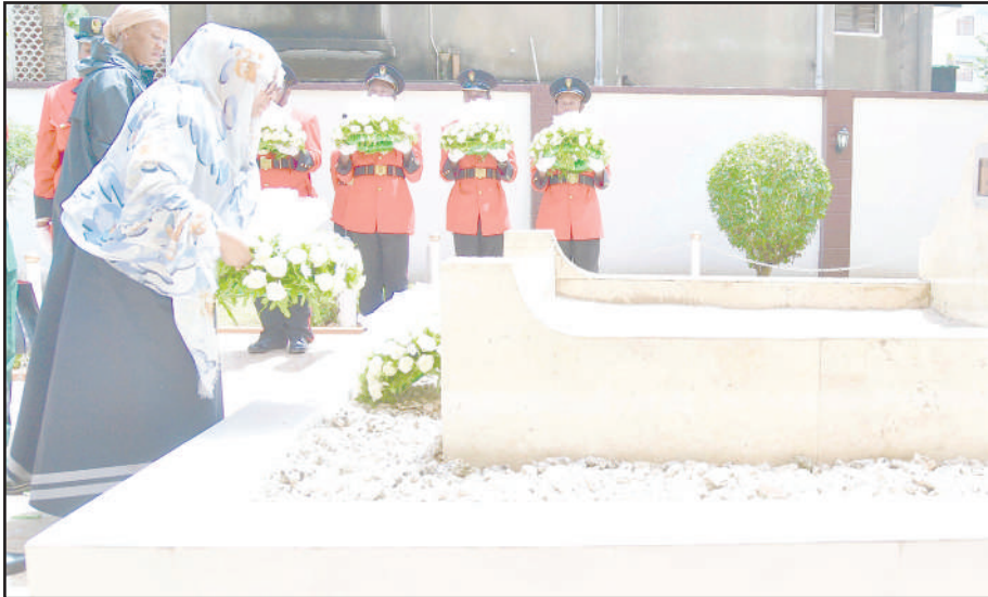
Rais, Samia Suluhu Hassan, akiweka shada la maua katika kaburi la Rais wa Kwanza wa Zanzibar, Hayati Abeid Amani Karume, baada ya dua iliyofanyika katika Ofisi Kuu ya Chama Cha Mapinduzi (CCM), Kisiwandui Zanzibar jana, katika maadhimisho ya Siku ya Kumbukumbu ya Karume (Karume Day).