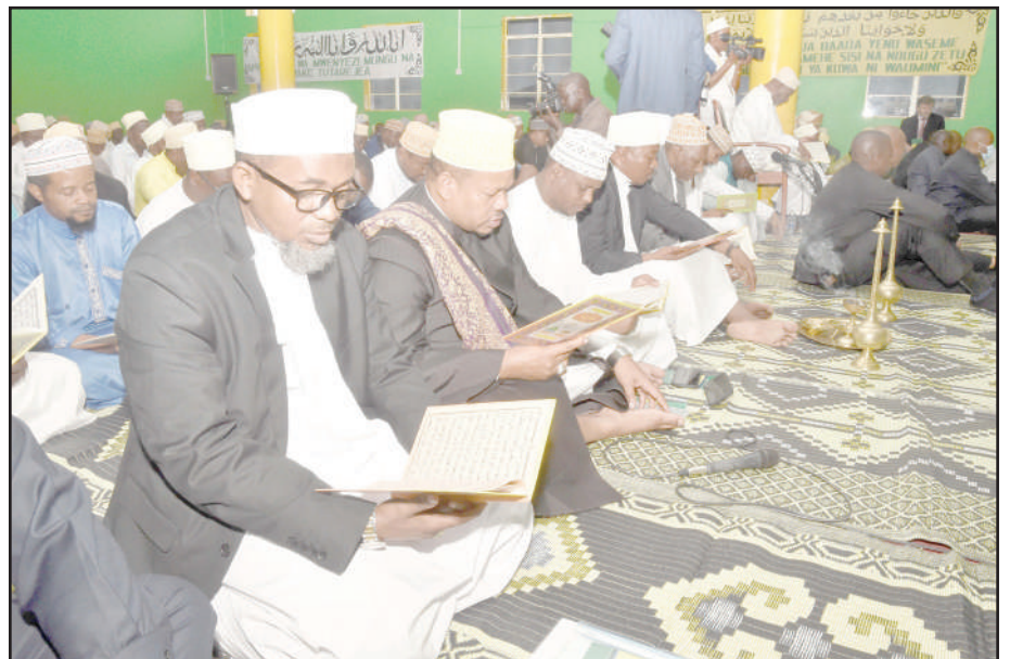
Viongozi wa dini na waumini wa Kiislam wakisoma hitma na dua kumuomba Hayati Abeid Amani Karume.