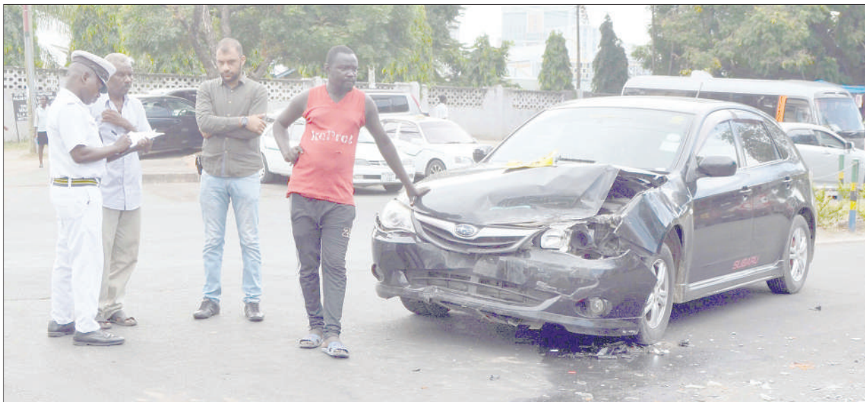
Askari Polisi wa Kikosi cha Usalama Barabarani, akikagua ajali ya gari iliyotokea baada ya dereva wake kugonga ukingo wa Barabara ya Lumumba, jijini Dar es Salaam jana.

"Nikiri kuwa taarifa hizo zimeendelea kutoa mchango mkubwa katika kutambua maeneo yanayofanya vizuri na yale yenye changamoto," alisema