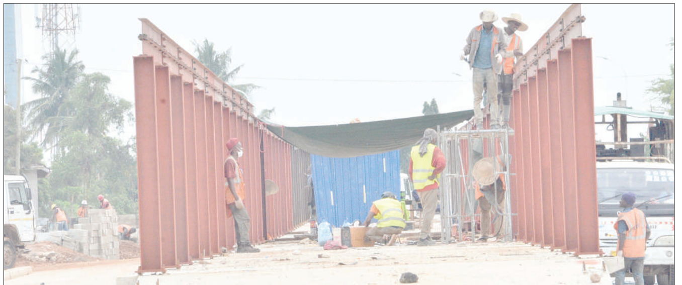
Mafundi wakiendelea na ujenzi wa kituo cha mabasi ya mwendokasi lilipokuwa eneo la stendi ya mabasi ya mikoani, Ubungo, jijini Dar es Salaam jana.

“Madini yapo mchimbaji yupo kila siku anagonga mlango kok kok mlango haufunguki, kila akigonga umefungwa, hebu tukaeni tumalize pachimbwe, tunayaweka pale ya nini, simba sijui tembo hali yale, tunayaweka ya nini, ingekuwa wanayala tungesema tunapunguza ‘share’ (mgawo) ya wanyama wetu, na kama ni kuunguza eneo tuangalie gharama ya kupunguza eneo la hifadhi na gharama ya kuchimba, tumalize haya tusinge mbele.”