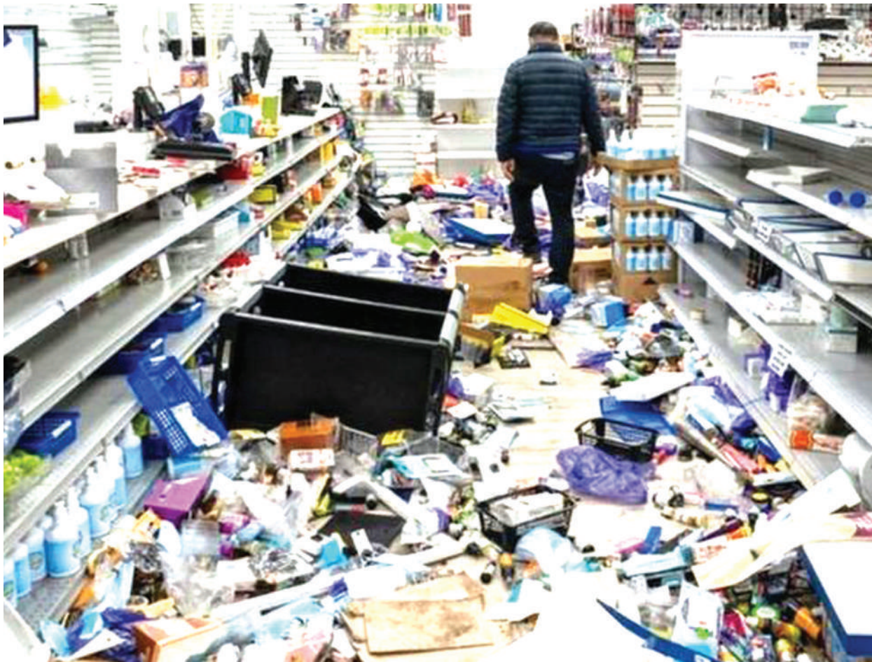
Moja ya duka mjini Philadelphia nchini Marekani, ambalo limevamiwa na wezi baada ya ghasia kuzuka polisi walipompiga risasi na kumuua mtu mweusi.