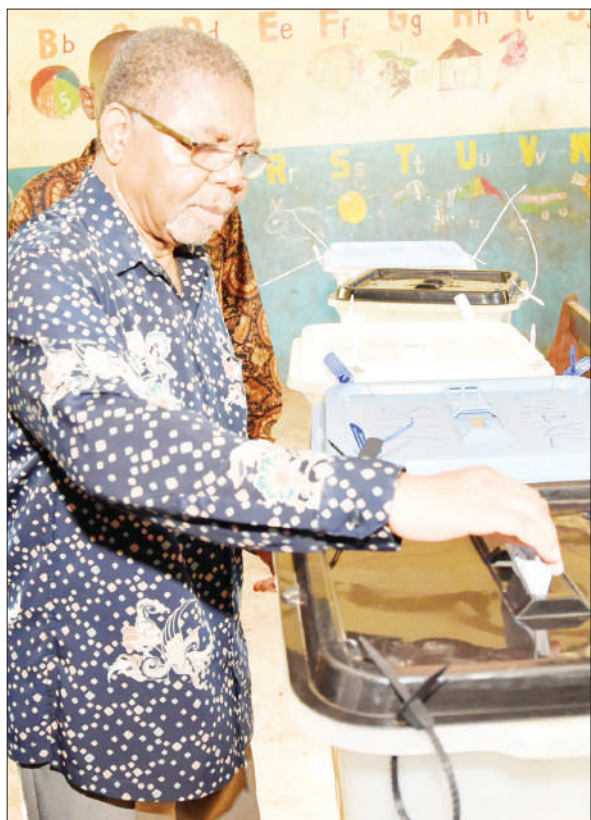
Rais wa Zanzibar na Mwenyekiti wa Baraza la Mapinduzi, Dk. Ali Mohamed Shein, akipiga kura yake ya Rais wa Jamhuri ya Muungano wa Tanzania, Rais wa Zanzibar, wabunge, wajumbe wa baraza la wawakilishi na madiwani, katika kituo cha kupigia kura cha Bungu, Wilaya ya Kati Unga jana.