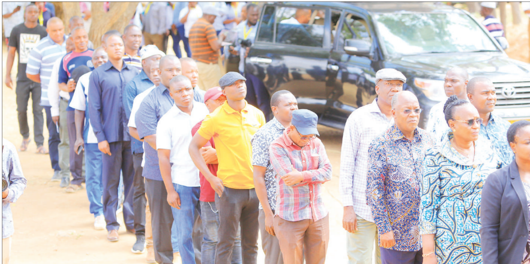
Mgombea urais wa CCM, Dk. John Magufuli na mkewe Mama Janeth Magufuli wakiwa wamepanga foleni kwa ajili ya kupiga kura kwenye kituo cha Idara ya Maji, wilayani Chamwino, mkoani Dodoma jana.