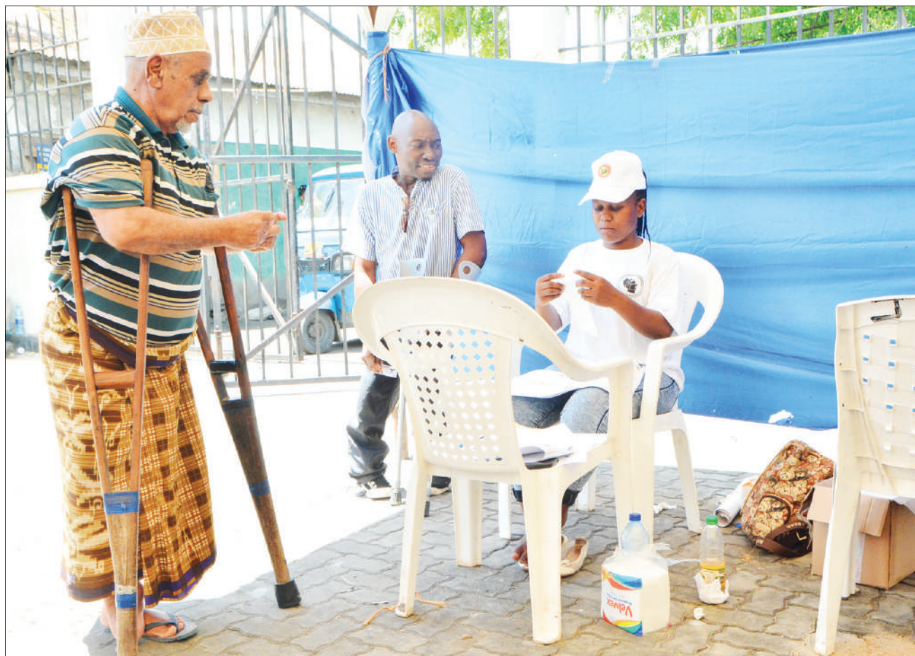
Wananchi wakisubiri kupata maelekezo ili kupiga kura katika kituo cha Ofisa Mtendaji Kata ya Kawe, jijini Dar es Salaam jana.