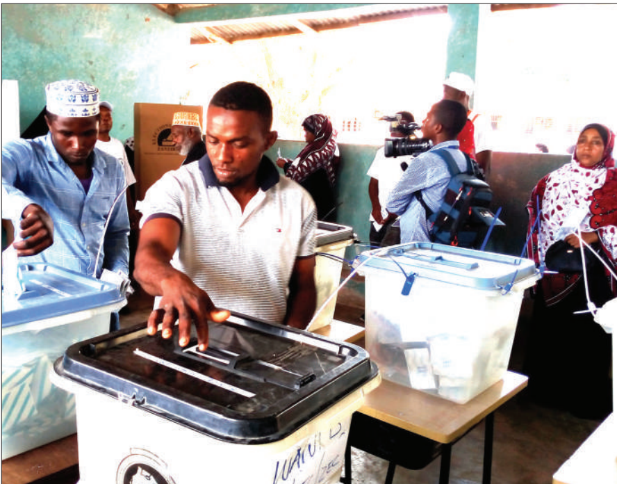
Baadhi ya wananchi wa Jimbo la Wawi, Wilaya ya Chakechake, wakipiga kura katika kituo cha Wawi B.