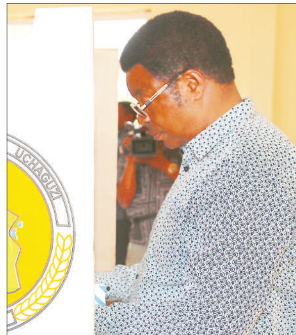
Waziri Mkuu na Mjumbe wa Kamati Kuu ya Halmashauri Kuu ya Taifa ya CCM, Kassim Majaliwa, akipiga kura katika kituo cha kupigia kura cha Shule ya Msingi ya Nandagala wilayani Ruangwa, mkoani Lindi jana.