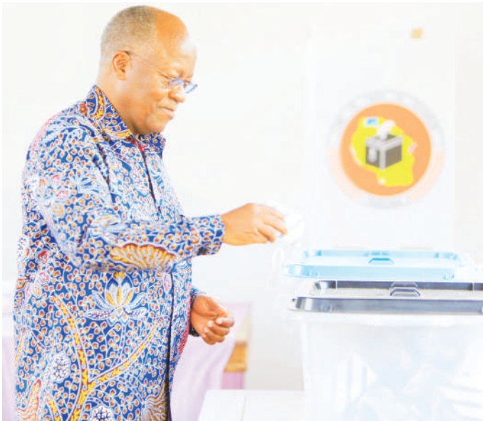
Mgombea urais wa CCM, Dk. John Magufuli akipiga kura.