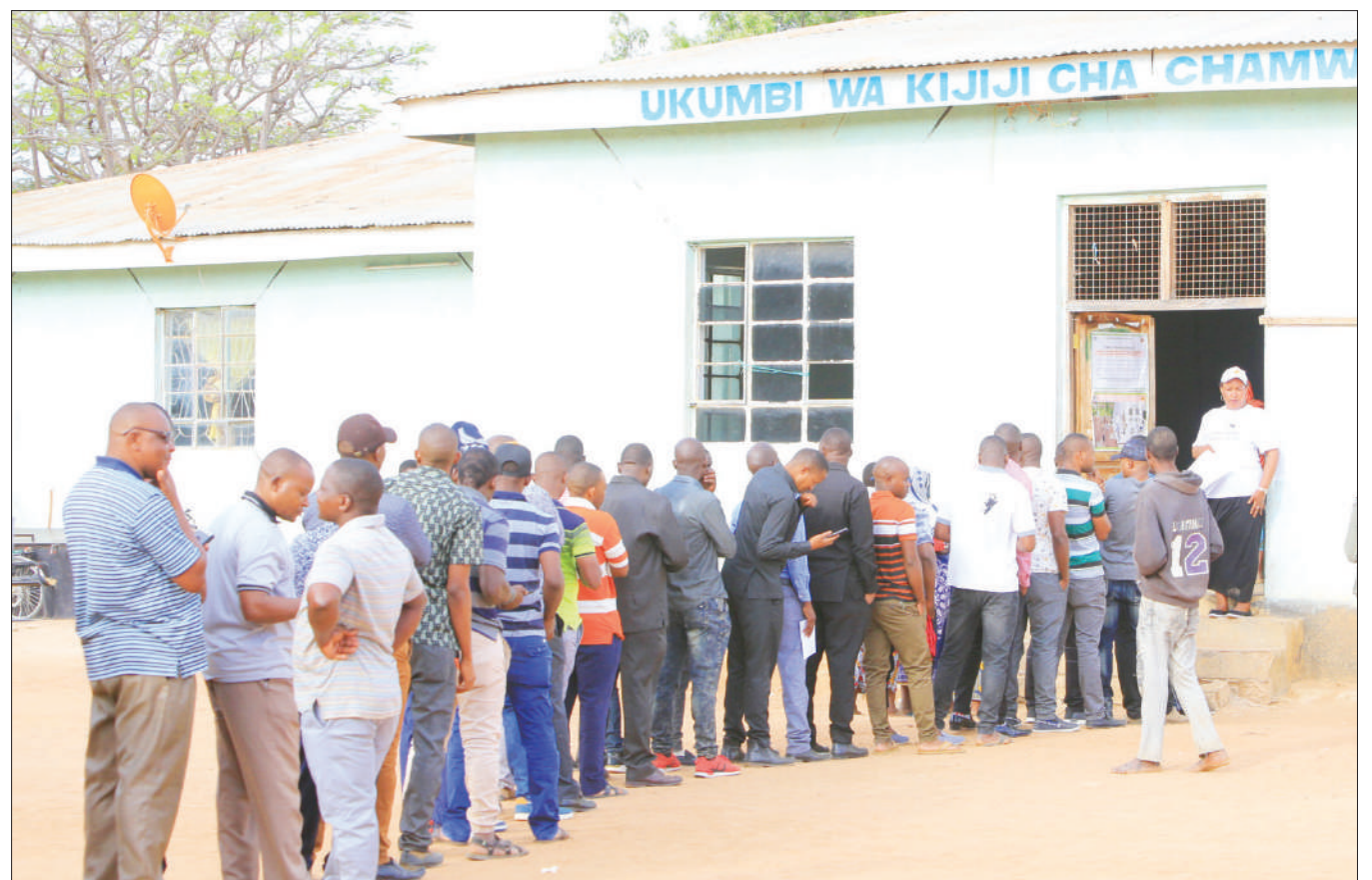
Baadhi ya wakazi wa Chamwino Ikulu, Wilaya ya Chamwino, mkoani Dodoma, wakiwa kwenye foleni kwa ajili ya kupiga kura ya uchaguzi mkuu kwenye kituo cha Idara ya Maji jana.

Mwezi huo utakuwa mwisho wa kujisajili hivyo wataalamu hao wasajili kabla ya kufika muda huo huku akisema baraza litaanza kufanya ukaguzi na kuchukua hatua za kisheria kwa wale wote watakabainika kutotii wito huo.