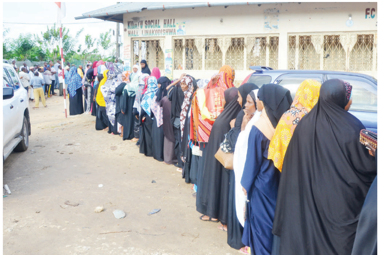
Baadhi ya wananchi wakiwa wamepanga foleni wakisubiri kupiga kura katika kituo cha Garagara, Mkoa wa Mjini Magharibi Unguja jana.

Mimi niko tayari kupokea matokeo yoyote yale na niko tayari kufanya kazi na kumpa ushirikiano mgombea yeyote atayetangazwa kuwa Rais wa Zanzibar.