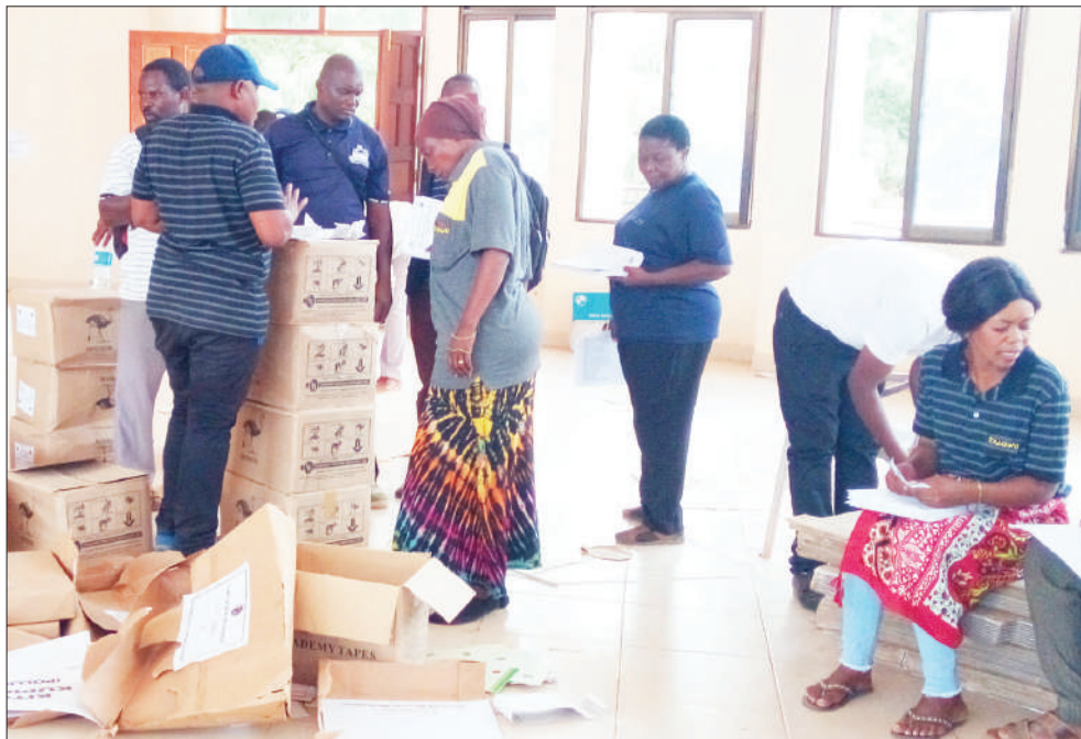
Baadhii ya wasimamizi wa uchaguzi wa majimbo ya Masasi Mjini, Lulindi na Ndanda, wakiwa katika zoezi la uchukuaji wa vifaa vya uchaguzi kwenye ofisi za wasimamizi wa majimbo hayo, mjini Masasi, mkoani Mtwara jana.