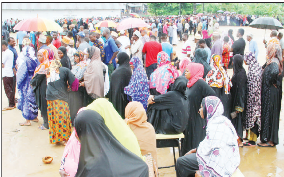
Wananchi wa Zanzibar wakiwa wamekusanyika wakisubiri kupiga kura katika kituo cha Garagara, Mjini Unguja jana.