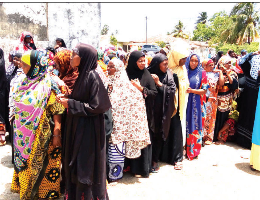
Baadhi ya kinamama wa Jimbo la Kojani, Wilaya ya Wete, wakiwa katika foleni kusubiri kupiga kura katika kituo cha Kangagani, Jimbo la Kojani, jana.