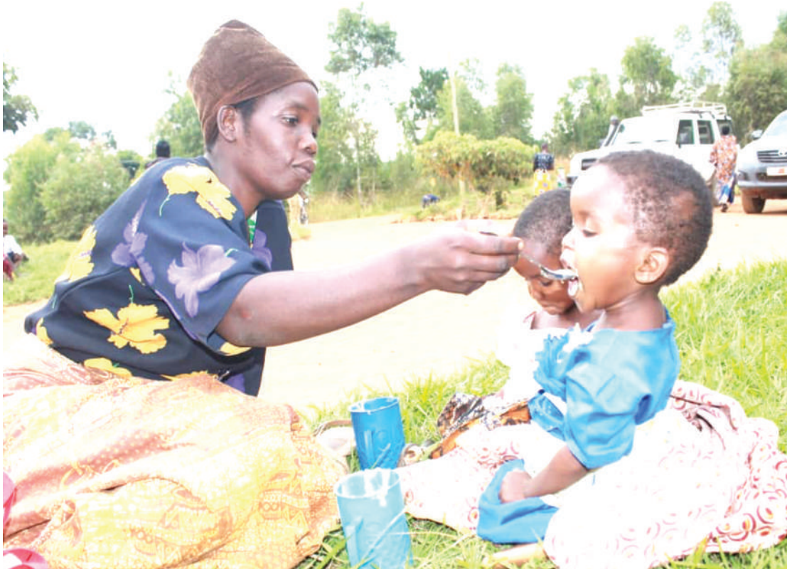
Watoto wakiwa na mama zao katika matukio ya kijamii. Lishe na matunzo bora, ni silaha muhimu kwao kimaisha, zinazooneka kwenye tofauti.