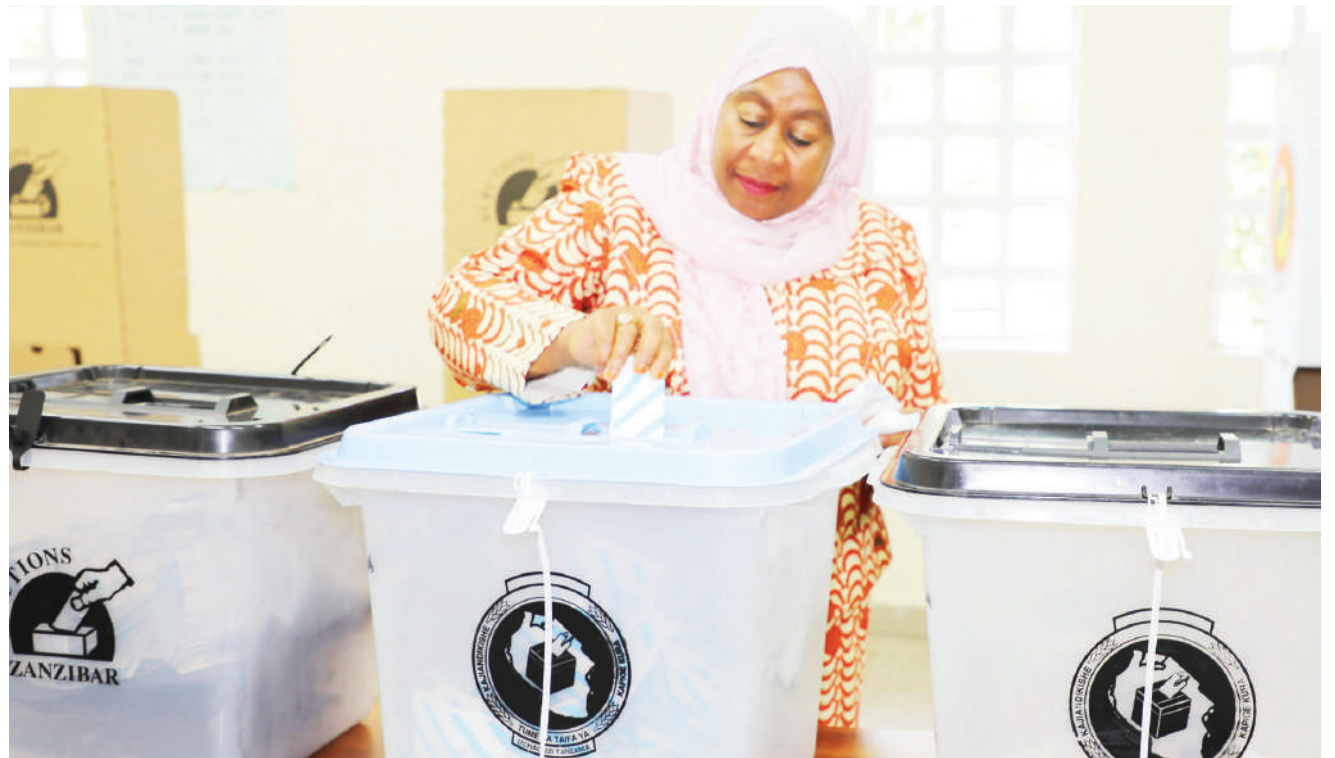
Makamu wa Rais, Samia Suluhu Hassan, akipiga kura kwa ajili ya kuchagua Rais wa Jamhuri ya Muungano wa Tanzania, Rais wa Zanzibar, wabunge, wajumbe wa baraza la wawakilishi na madiwani katika kituo cha SOS Mombasa, mjini Zanzibar jana.