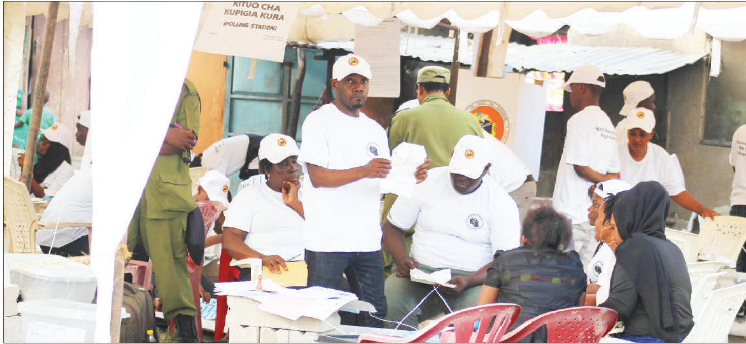
Mawakala wa vyama vyote wakihesabu kura za wagombea katika kituo cha Ukonga Mazizini Dar es Salaam jana.