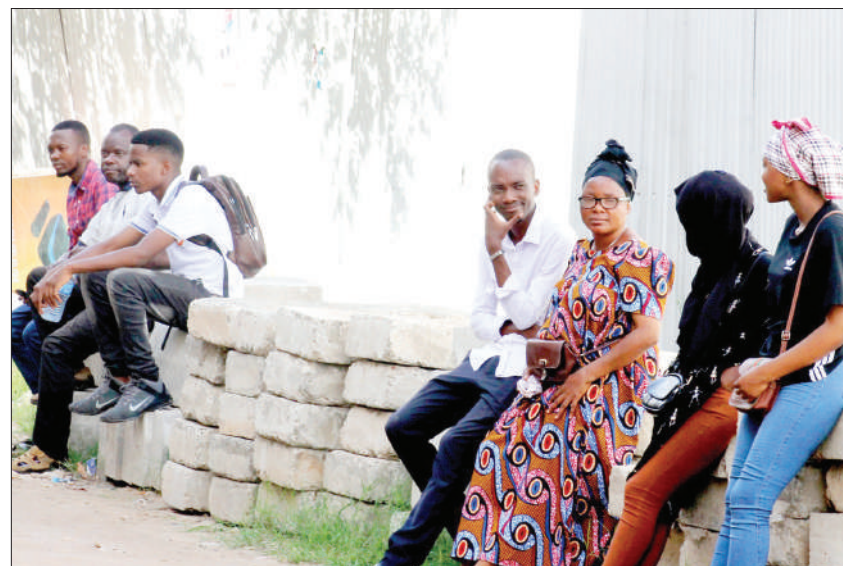
Baadhi ya mawakala wa Chama cha ACT-Wazalendo, wakiwa nje baada ya kuzuliwa kuingia kituo cha kupiga kura cha Chuo Kikuu Huria, jijini Dar es Salaam jana.