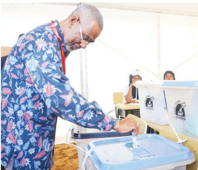
Mgombea urais wa ACT-Wazalendo Zanzibar, Seif Sharif Hamad akipiga kura.