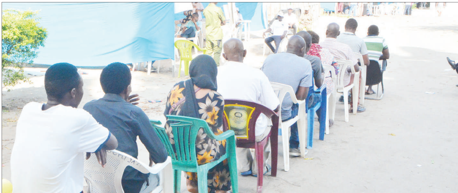
Wananchi wakiwa wamekaa foleni wakisubiri kupiga kura katika kituo cha Hananasif Kinondoni, jijini Dar es Salaam jana.