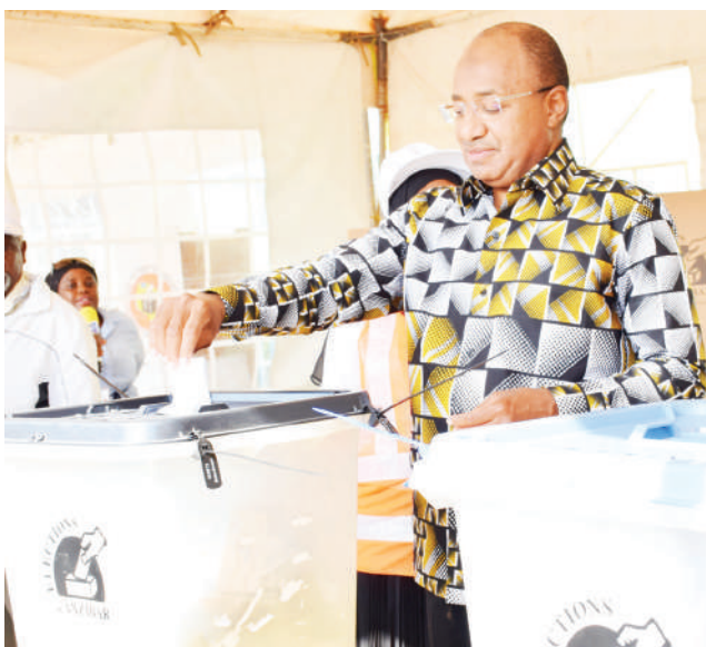
Mgombea urais wa CCM Zanzibar, Dk. Hussein Mwinyi akipiga kura.