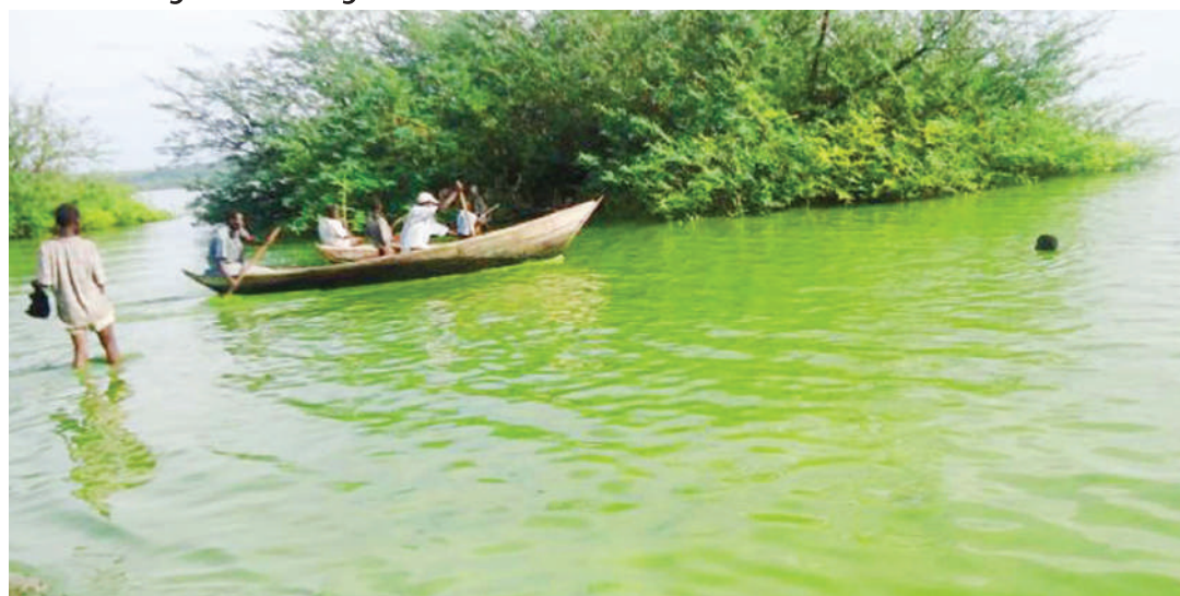
Mazingira rafiki yanayohamasisha kuenea maradhi ya kichocho.

Anasema katika idadi hiyo, Kanda ya Ziwa inaongoza kuwa na maambukizi kati ya asilimia 50 hadi 80 ya magonjwa hayo yaliyokuwa hayapewi kipaumbele.