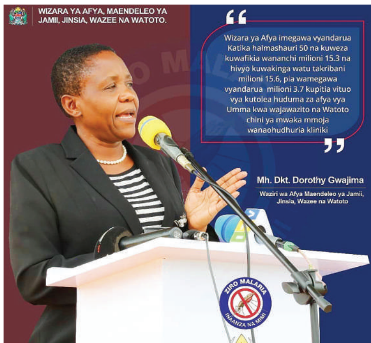
Waziri wa Afya, Maendeleo ya Jamii, Jinsia, Wazee na Watoto, alipozungumza katika Siku ya Malaria Duniani mwezi uliopita.