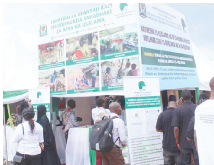
Banda la Maonyesho la Wakala wa Usalama na Afya Mahali pa Kazi (OSHA), katika maadhimisho yake yaliyofanyika kitaifa kwenye Uwanja wa Nyamagana, jijini Mwanza.

Tutayaweka kwenye orodha ya wadaiwa sugu na kuyatangaza katika gazeti, la sivyo yajisalimisho mapema katika ofisi ya Katibu Mkuu.