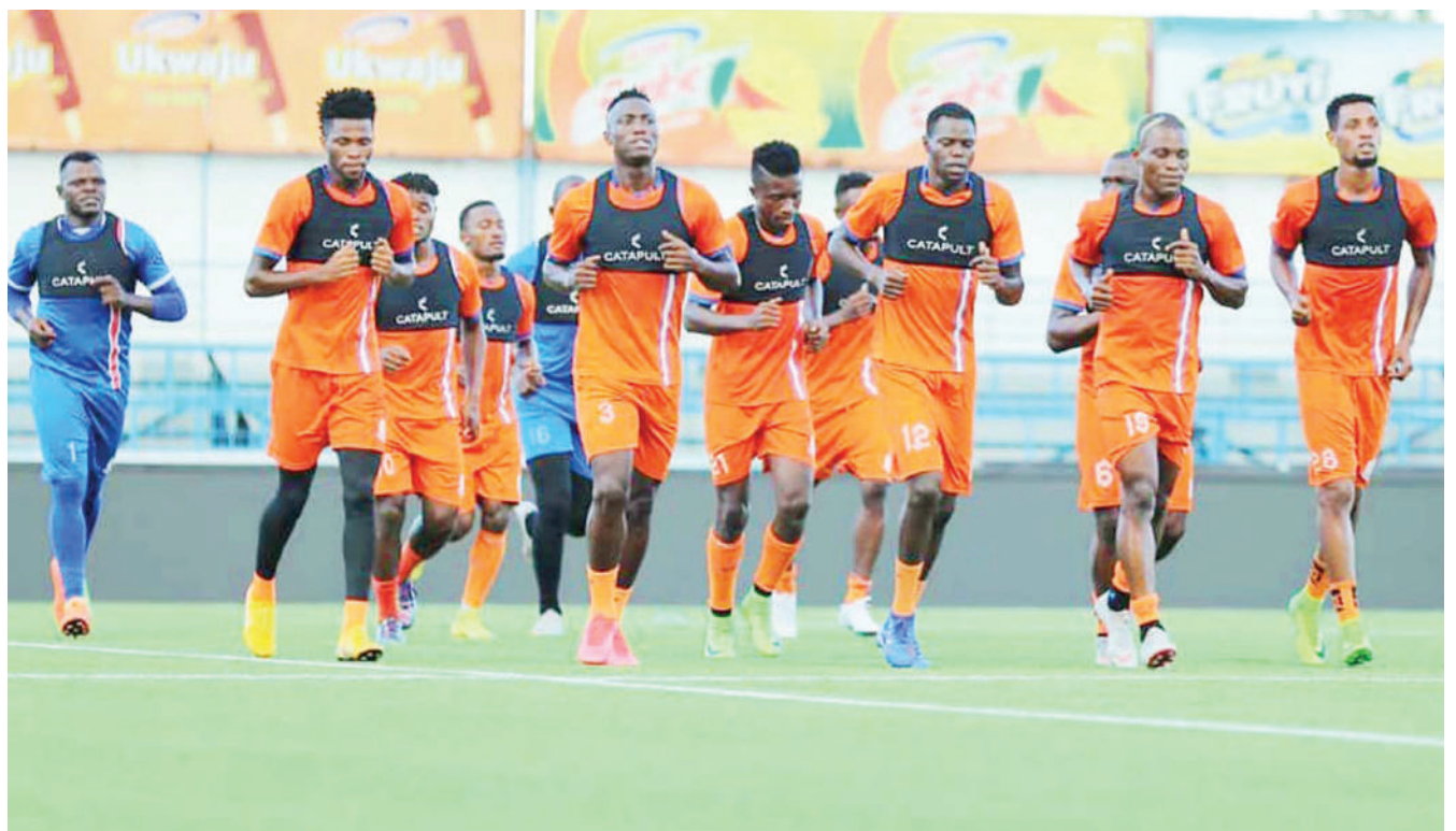
Wachezaji wa Azam FC wakiwa katika mazoezi ya kujiandaa na mechi ya Ligi Kuu Tanzania Bara dhidi ya KMC itakayochezwa keshokutwa kwenye Uwanja wa Azam Complex jijini Dar es Salaam.

Mbeya Kwanza ni timu iliyoanzishwa mwaka 2012 ikiitwa Coca Cola Kwanza, lakini ilipofika mwaka 2014 ilibadilishwa na kuitwa Mbeya Warriors wakati huo ikishiriki Ligi ya Mabingwa Ngazi ya Mkoa.