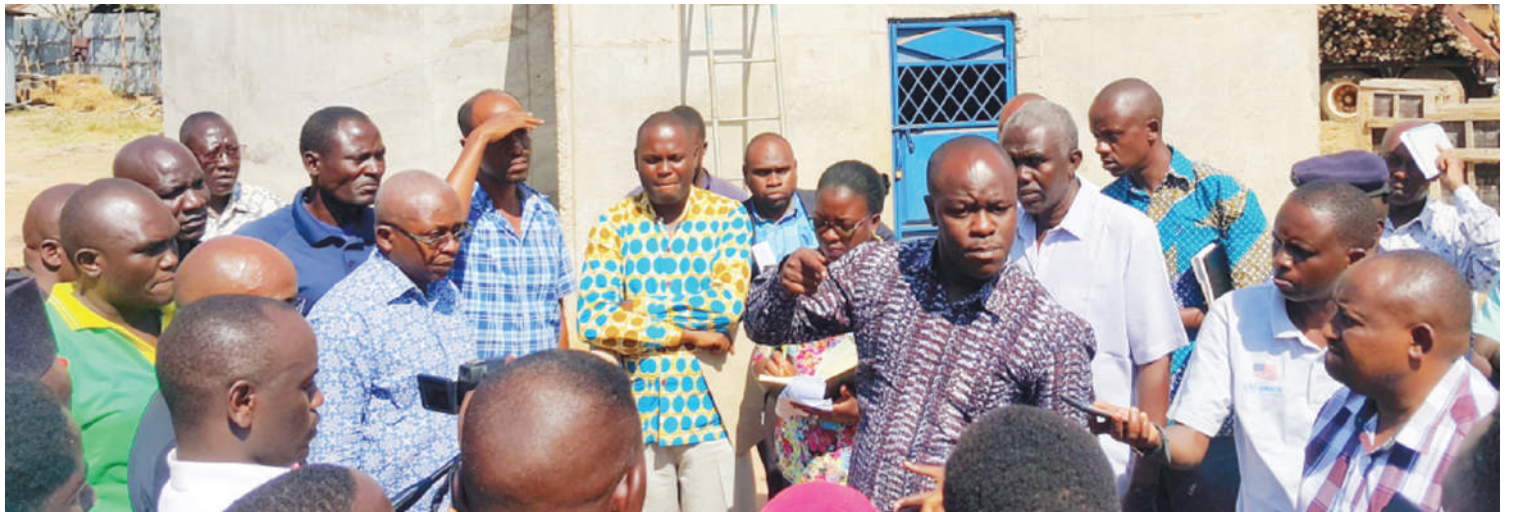
Mradi wa maji ulioko Nguruka, unaohudumiwa na Mamlaka ya Maji Kigoma. Anayeukagua ni Waziri wa Maji, wakati huo akiwa naibu waziri katika wizara hiyo.