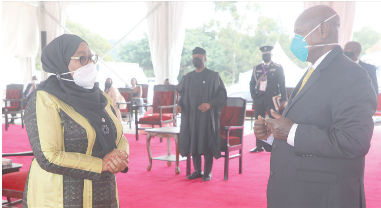
Rais Samia Suluhu Hassan akizungumza jambo na kumpongeza Rais wa Uganda, Yoweri Museveni, baada ya kuapishwa kuliongoza tena taifa hilo, katika Uwanja wa Kololo, jijini Kampala, nchini Uganda jana.