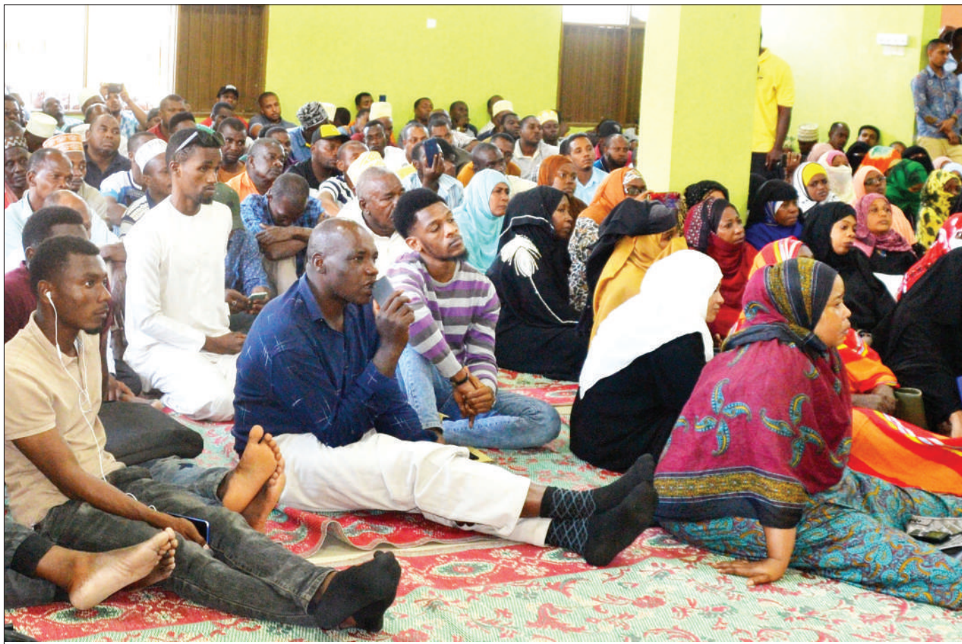
Waathirika mbalimbali wa uwekezaji katika kampuni ya Masterlife wakifuatilia kwa makini kikao cha kamati kilichofanyika ukumbi wa Taqwa Mlandege Mjini Zanzibar.

Hivyo, aliwapongeza viongozi wa shule hiyo kwa kujali wanafunzi wao sambamba na kuwapongeza madaktari wa jumuiya hiyo ambao wamekuwa wakitoa matibabu kwa wananchi katika vijiji mbalimbali kwa lengo la kupunguza matatizo yanayowakabili wananchi yakiwamo wanayoyajua na wasiyoyajua.