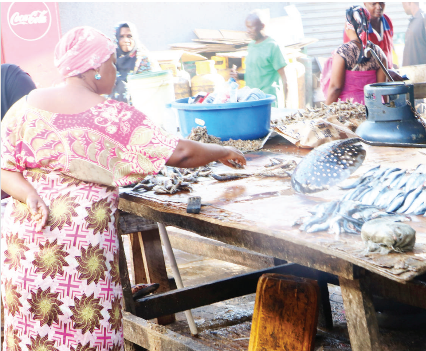
Mjasiriamali akiandaa kitoweo cha samaki katika Soko la Kimataifa la Samaki Feri, jijini Dar es Salaam, jana.

Akizungumzia juu ya ushiriki wa wazazi na jamii katika jambo hilo, mkuu huyo alisema kitendo cha kutokuwa tayari kujitolea kunachangia uwapo wa upungufu huo, licha ya watoto wanaosoma ni wa kwao.