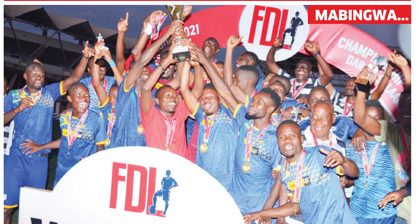
Wachezaji wa timu ya Geita Gold, wakishangilia na Kombe la ubingwa wa Ligi Daraja la Kwanza baada ya kulitwaa juzi katika Uwanja wa Uhuru, Dar es Salaam kwa kuifunga Mbeya Kwanza katika mechi ya fainali.

Pia alisema wizara yake itakamilisha uundwaji na kuanza matumizi ya mifumo ya kielektroniki ya kuwahudumia wasanii na wadau wengine wa sanaa ili kuimarisha ufanisi katika utoaji wa huduma, kurahisisha urasimishaji wa Sekta ya sanaa na shughuli za ubunifu na kubwa zaidi, kuongeza mapato ya wasanii na serikali.