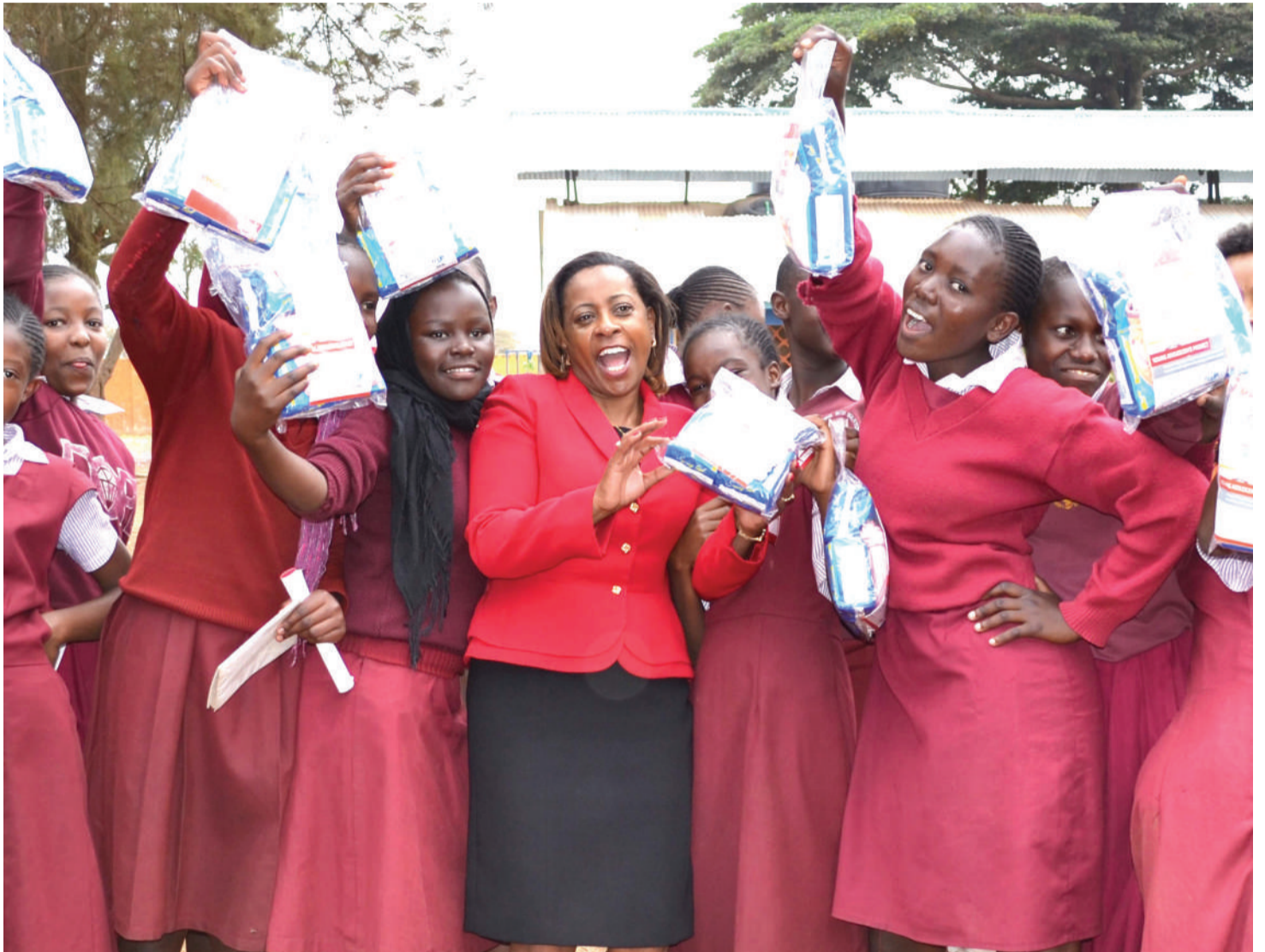
Mabinti wakifurahia kupata taalo za hedhi kwa uhakika na unafuu baada ya serikali kuondoa kodi kwenye bidhaa hiyo.

kadhaa ikiwamo hedhi badala yake, shule zina walimu wanaume ambao huwajelea mabinti kwa kuwapa majina ya kuwadhalilisha wanapozungumzia masuala ya hedhi.