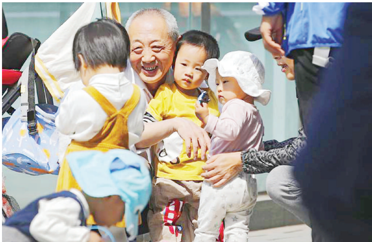
Mzee akifurahia jambo na watoto, jijini Beijing, mapema Mei 10, mwaka huu. Chama cha Kikomunisti China, jana kililegeza sharti la kuzaa watoto wawili na kuruhusu watoto watatu kwa wanandoa, ili kuinua idadi ya watoto, vijana kuendana na mahitaji ya sasa.