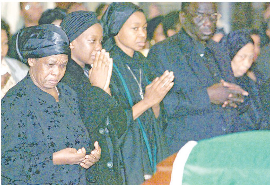
Familia ya Mwalimu Nyerere ikiongozwa na mjane Mama Maria pamoja na watoto wake wakiaga mwili wake, kabla ya mazishi yaliyofanyika kijijini kwake Butiama.