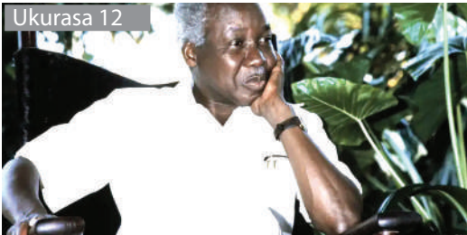
Viongozi na wananchi jipekueni ni wazalendo