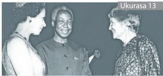
Uhuru na demokrasia, hekima iliyoiacha ilivyo na nafasi enzi hizi za vyama vingi