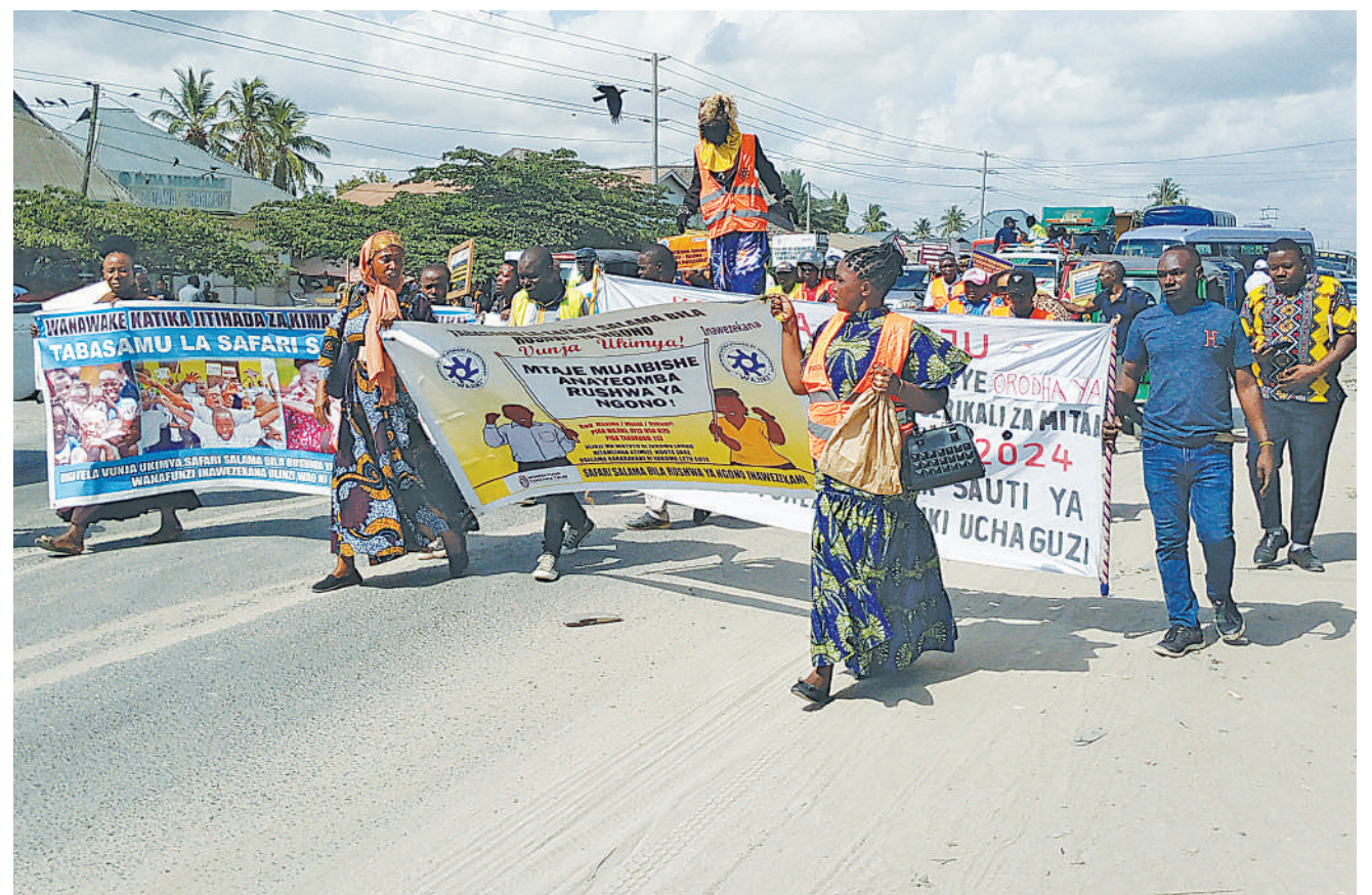
Wadau wa kupinga rushwa ya ngono wakiwamo madereva wa bodaboda wakipita kwenye mitaa ya Bunju A, Dar es Salaam jana, walipokuwa wakiadhimisha Siku ya Kimataifa ya Mtoto wa Kike na kuhamasisha wananchi kujiandikisha kwa ajili ya uchaguzi wa serikali za mitaa. Maadhimisho hayo yaliandaliwa na Shirika la Wanawake Katika Jitihada za Kimaendeleo (WAJIKI).

kwa mujibu wa takwimu za Ofisi ya Mtakwimu Mkuu wa Serikali kwa mwaka jana, matukio 1,954 ya ukatili na udhalilishaji yaliripotiwa kati yao ya wasichana yalikuwa 1,263 sawa na asilimia 77.1.