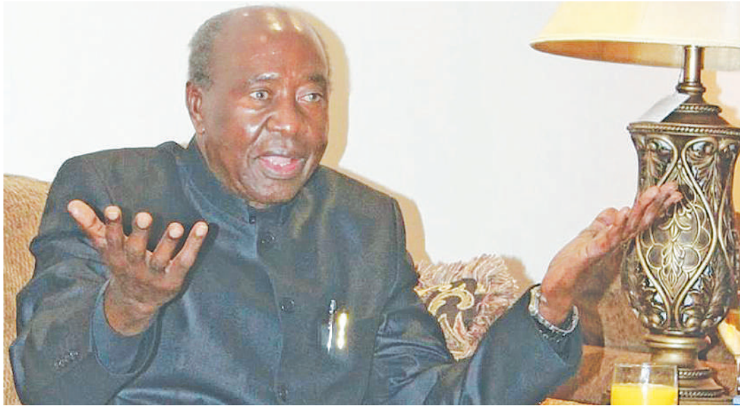
Waziri Mkuu Mstaafu, John Malecela.

• Watu saba duniani waliomtoa Mandela jela • Hifadhi Saanane, pundamilia nikatoa Rudolf Kenya • Ubunifu mfumo wa upigaji kura uliopo sasa • Kuanzisha ubalozi Marekani, pia vyama vingi