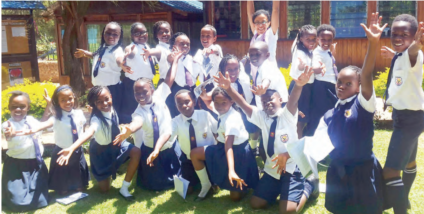
Elimu ikilenga kuwapa wanajamii maarifa ni mwanzo wa kumudu maisha yao, lakini ikibakia ya kukariri kanuni za hesabati kama 'pai' huwa kitendawili kinachotakiwa kupata jawabu.

K WA Tanzania bado haku-na aliyewahi kuelezea kinagaubaga jinsi elimu ilivyozuka na ilivyowekewa viwango, mipaka na mifumo halisi.