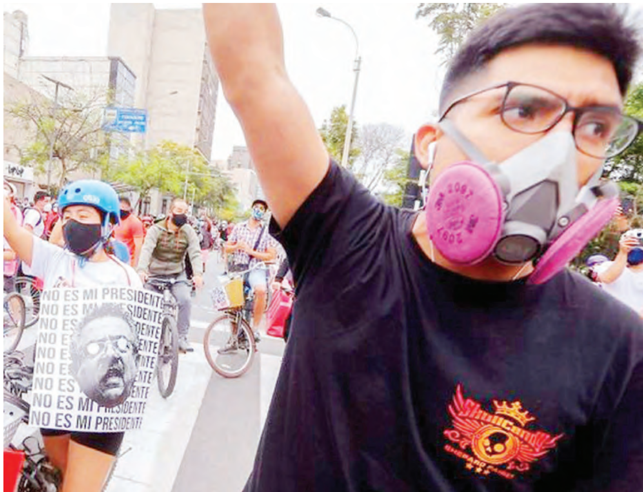
Waandamanaji nchini Peru, wengi wao wakiwa vijana wameingia mitaani kuipinga serikali ya mpito ya Manuel Merino.

Shambulizi hilo linaongeza wasiwasi wa kusambaa kwa vita katika eneo hilo la pembe ya Afrika.