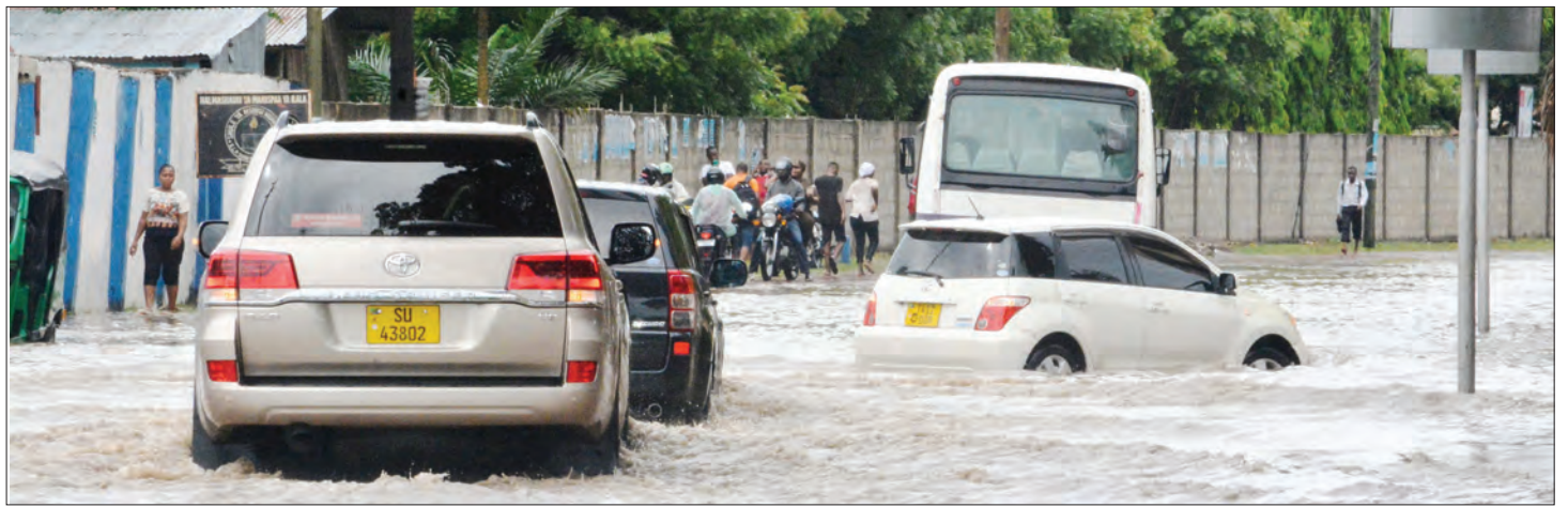
Vyombo vya moto vikipita kwa shida katika eneo la barabara ya Umoja wa Mataifa jijini Dar es Salaam, kujaa maji baada ya mvua kunyesha.

Hata hivyo, alisema mfano umeshaonyeshwa kwa Halmashauri ya Manispaa ambapo matarajio ya kufanikisha katika miji midogo yataonekana.