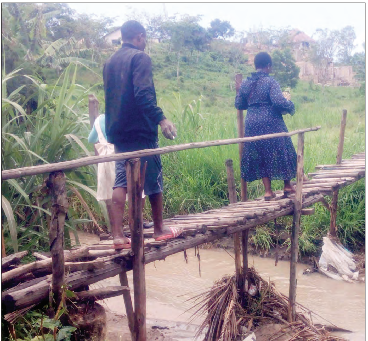
Wakazi wa Malamba Mawili, jijini Dar es Salaam, wakivuka jana kwenye daraja la kienyeji lililotengenezwa na baadhi ya wakazi wa eneo hilo.

Meneja huyo alisema watu wanaobainika kukiuka utaratibu wa kupangishwa nyumba hizo, huondolewa kinguvu na kuwapa wapangaji wengine waliofuata taratibu.