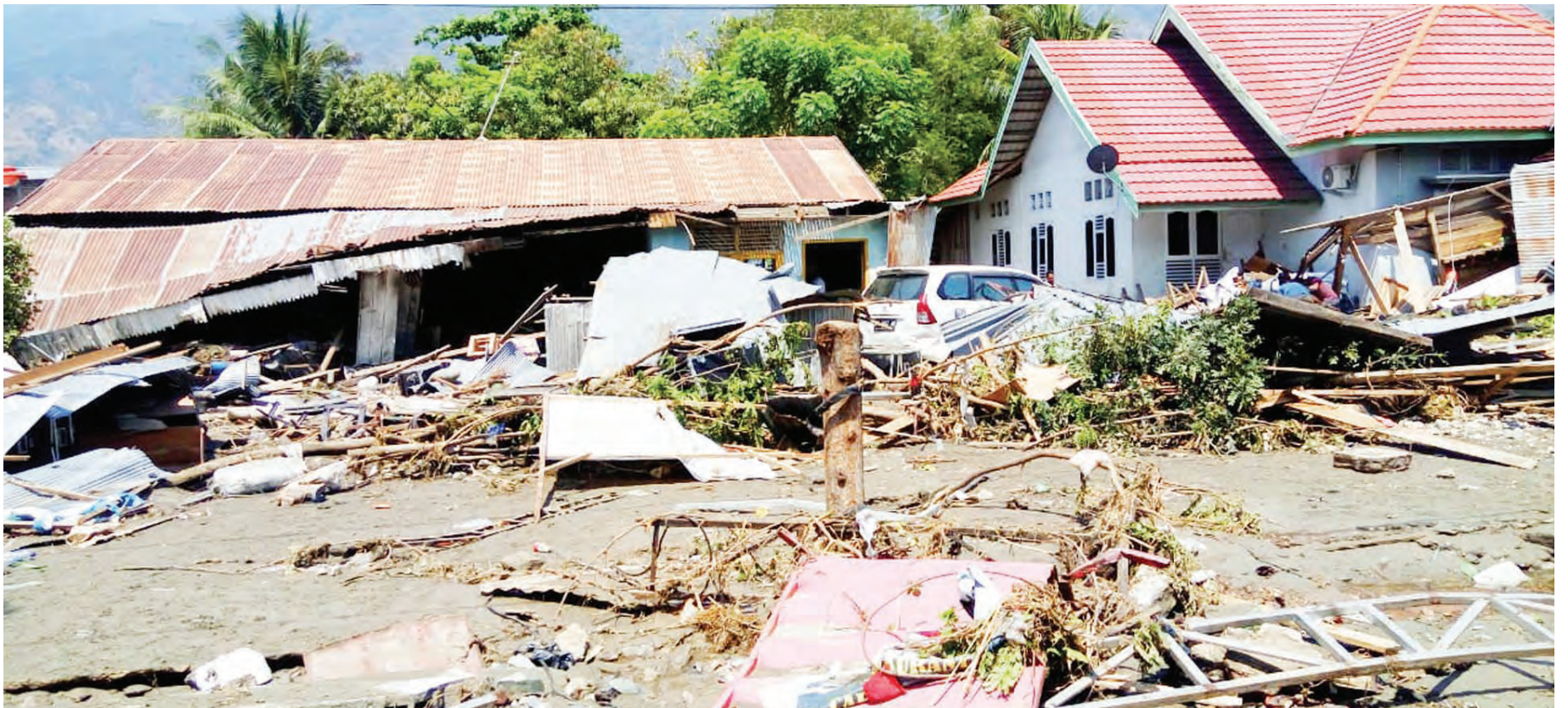
Uharibifu wa mali unaotokana na tetemeko la ardhi, unaweza kuwa kuangukiwa na majengo na mitambo kulipuka. Huenda kipimo cha tetemeko kikifuatwa na tahadhari kuchukuliwa mapema uharibifu unaweza kupunguzwa.

M WANDISHI mmoja anayezungumzia kuhusu tetemeko la ardhi anasema 'tumezoea kuishi katika dunia iliyo imara hivi, kwamba dunia inapoanza kutikisika tunababaika sana.