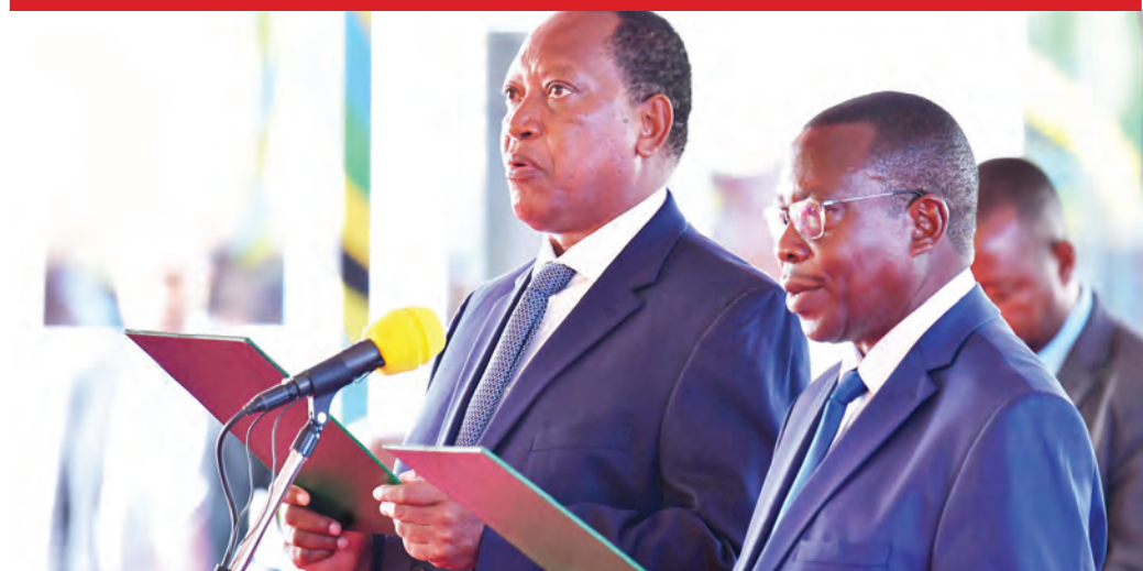
Waziri wa Fedha na Mipango, Dk. Philip Mpango, pamoja na Waziri wa Mambo ya Nje na Ushirikiano wa Afrika Mashariki, Prof. Palamagamba Kabudi, wakila kiapo cha uadilifu baada ya kuapishwa kuwa mawaziri na Rais Dk. John Magufuli, katika hafla fupi iliyofanyika viwanja vya Ikulu ya Chamwino, jijini Dodoma jana.

Naye Rais wa Zanzibar, Dk. Hussein Mwinyi, alisisitiza ushirikiano na Serikali ya Jamhuri ya Muungano ili kutimiza waliyokubaliana katika masuala mbalimbali likiwamo la uchumi ambao unategemea pande zote mbili.