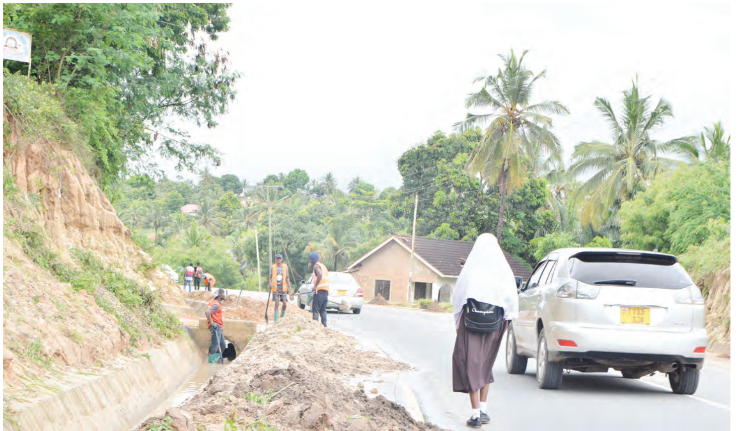
Wakazi wa jijini Dar es Salaam wakitoa mchanga kwenye mtaro katika eneo la Goba Njia Nne.

Awali, akisoma hati ya mashtaka Wakili wa Serikali, alidai Machi 9, mwaka huu mshtakiwa alimbaka mwanamke huyo bila idhini yake kitendo ambacho ni kinyume cha sheria.