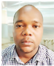
Na Halfani Chusi