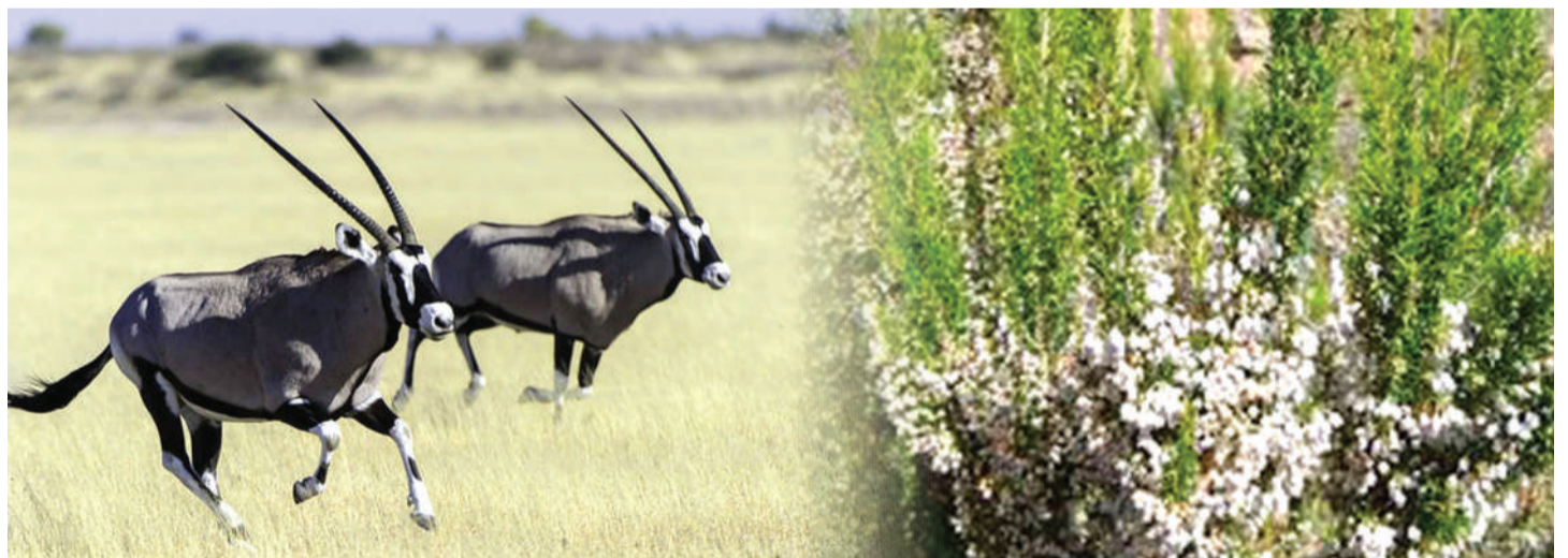
Swala 'oryx' na miti ya 'erica arborea' bayoanuai inayopatikana Mlima Kilimanjaro pekee.

Hakuna majibu ya moja kwa moja kwa sababu kawaida moto husababishwa na shughuli za binadamu kama kuvuta sigara, kuchoma nyasi kusafisha mashamba au hitilafu ya umeme lakini kwenye jambo la asili (natural phenomena) kama