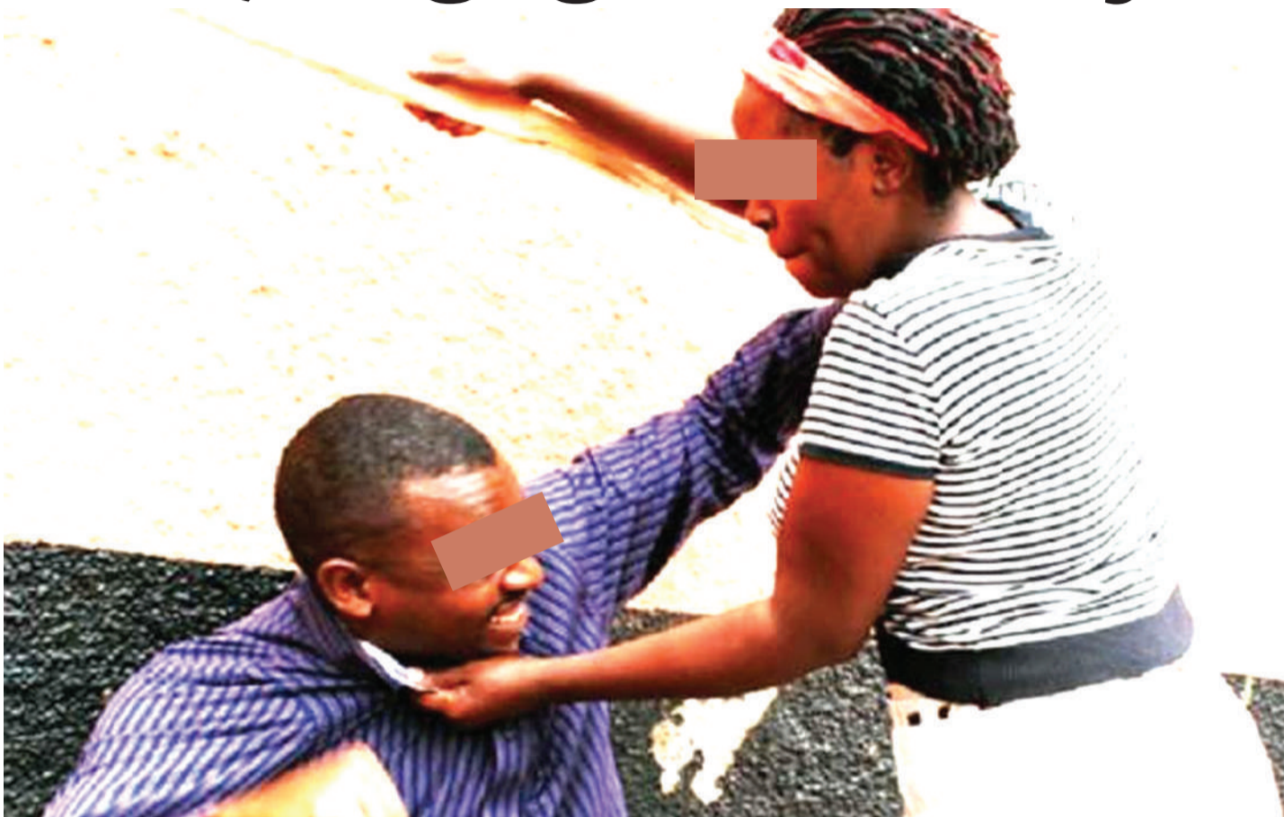
Kugombana wanandoa kunasababishwa wakati mwingine na usiri au kukosa ushirikishwaji kwenye masuala ya kifamilia.

“USIFANYE maamuzi ukiwa na hasira, maumivu au furaha ya kupitiliza”. Ndiyo wenyewe hekima wanavyokushauri.