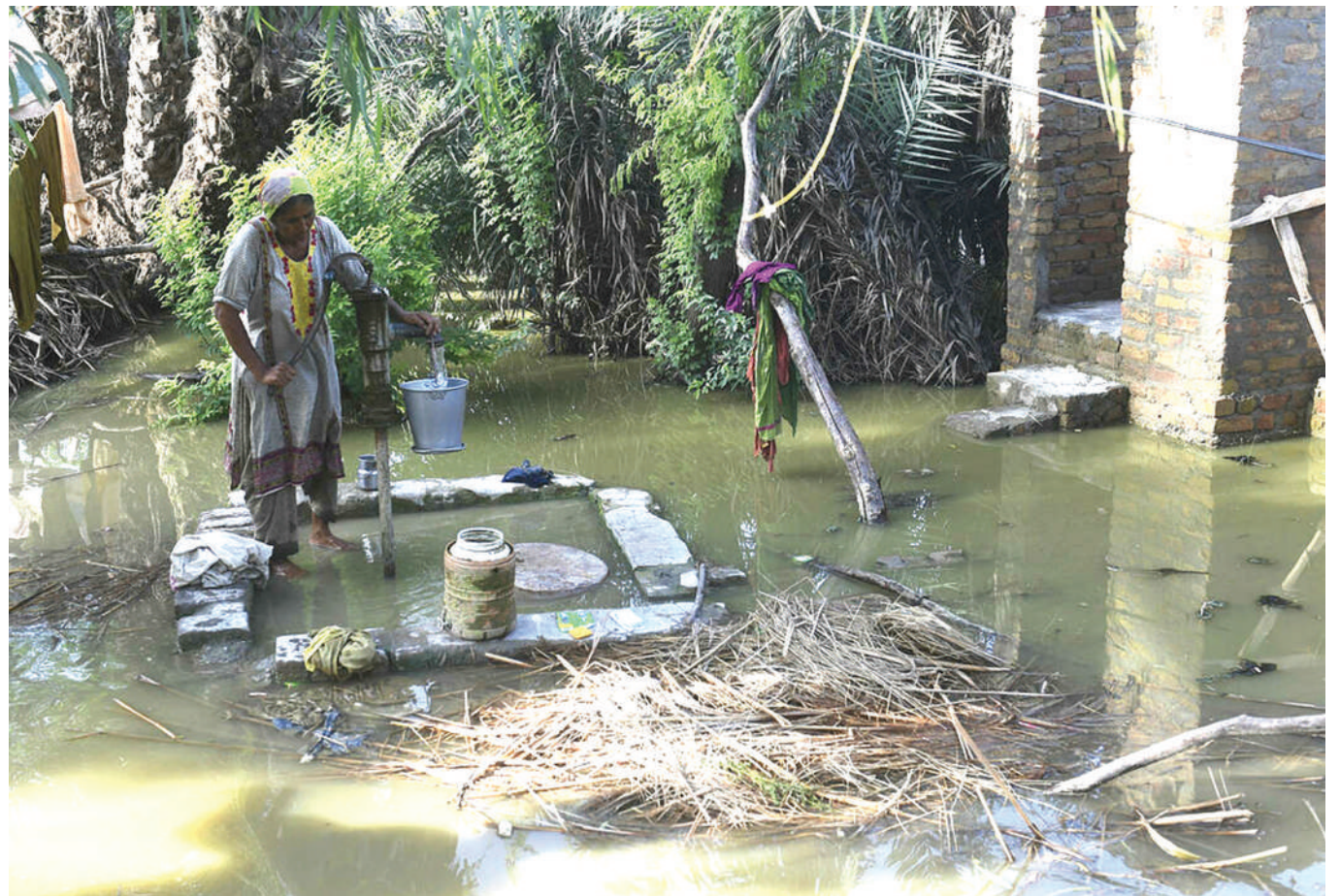
Mwananchi akichota maji katika kisima kilichoko eneo la Sukkur, moja ya sehemu zilizokumbwa na mafuriko.