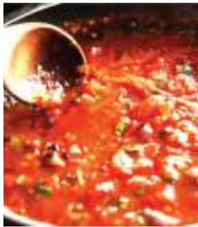
Nyanya zilizokaangwa.