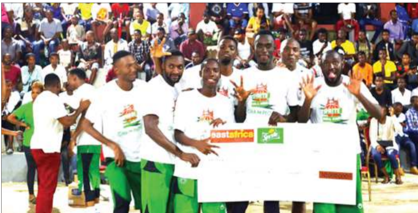
Mabingwa wa mpira wa kikapu, timu ya Mchenga Bball Stars wakiwa na mfano wa hundi ya Sh. milioni 10 baada ya kutwaa ubingwa wa Sprite Bball Kings 2019 juzi, hii ikiwa ni mara ya tatu mfululizo kubeba taji hilo.

Goza alisema, michuano hiyo ya Sprite Bball Kings 2019, ambayo ilihitimishwa rasmi juzi, iliandaliwa na East Africa TV na East Africa Radio kwa udhamini wa kinywaji cha Sprite.