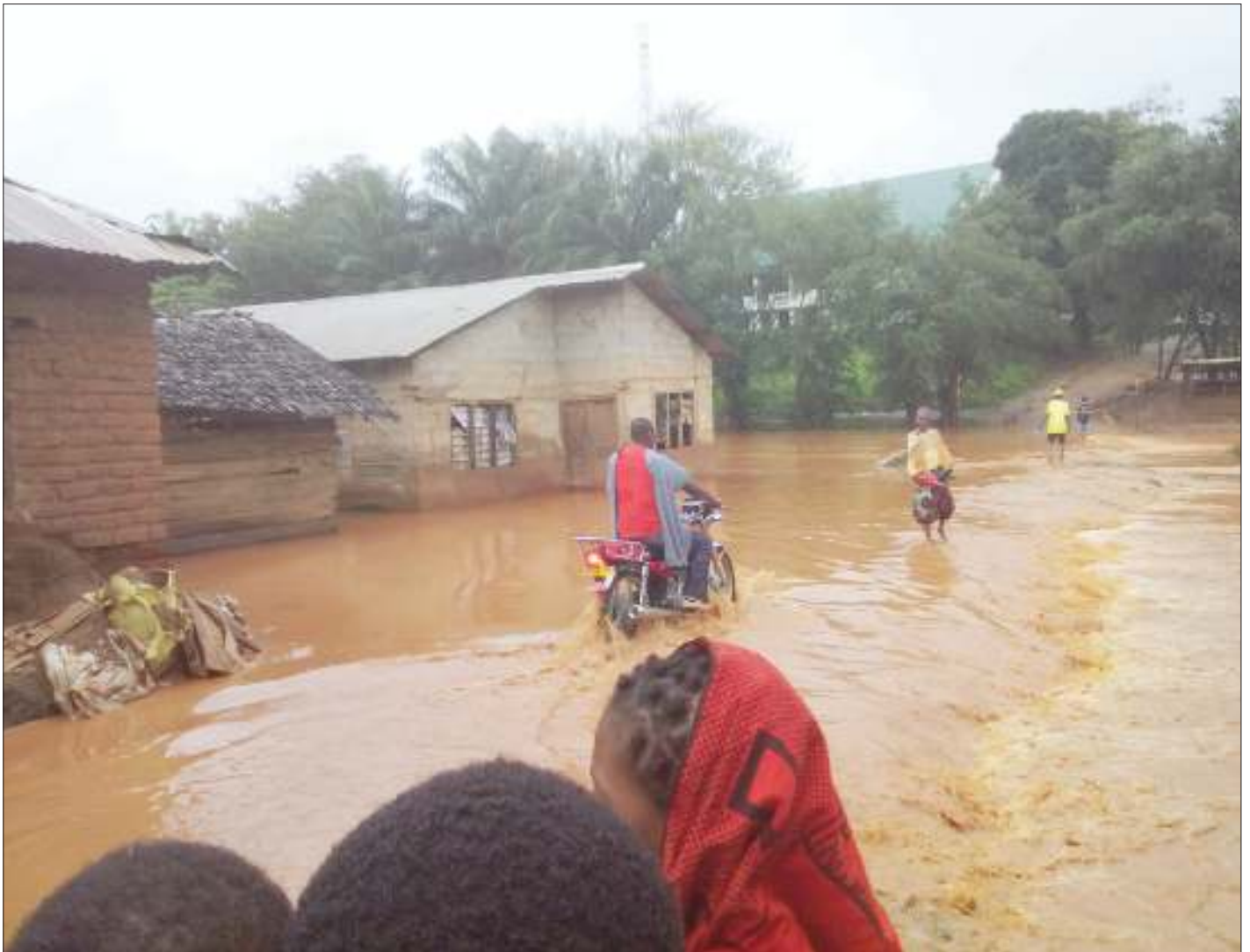
Wakazi wa eneo la Ngwaru Kanisani wilayani Muheza, wakiangalia nyumba zilizozingirwa na maji ya mafuriko katika eneo la daraja la Ngwaru jana.

Upepo huo uliovuja kwa muda wa dakika 15 katika kijiji cha Kikungwi umeharibu takriban maeneo manne ya shehia hiyo.