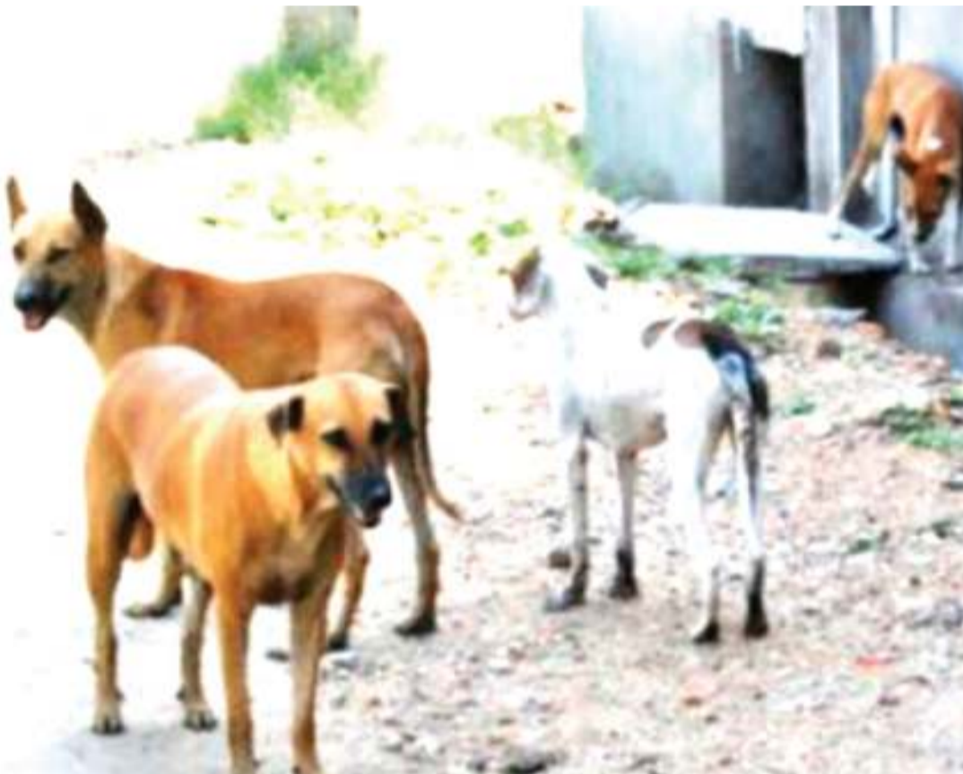
Mbwa wanaozurura ovyo mitaani ni hatari kwa kichaa cha mbwa.

mbwa kinapoingia katika jeraha hushambulia neva (mishipa) za fahamu kutoka katika eneo la jeraha, kuelekea katika uti wa mgongo na hatimaye kuathiri ubongo," anasema.