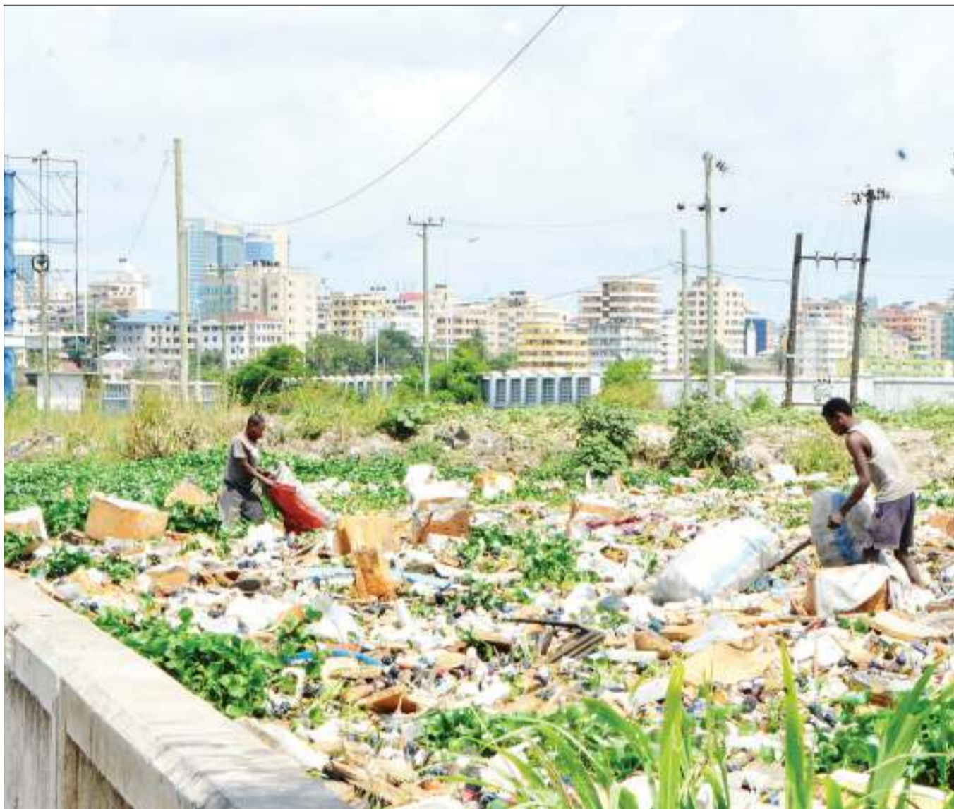
Vijana wakiokota chupa za plastiki kwa ajili ya kwenda kuziua ili wajipatie riziki, kwenye rundo la takataka zilizokusanywa na mvua katika eneo la Jangwani, jijini Dar es Salaam jana.

"Katika kambi ya matibabu ya pamoja tuliyoyafanya na wenzetu wa Shirika la Mending Kids International lenye wataalamu wa afya kutoka nchini Italia na Marekani, watoto wanne walishindwa kufanyiwa upasuaji kutokana na umri wao kuwa mkubwa zaidi ya mwaka mmoja na nusu hivyo wataendelea na matibabu ya kawaida," alisema Dk. Naiz.