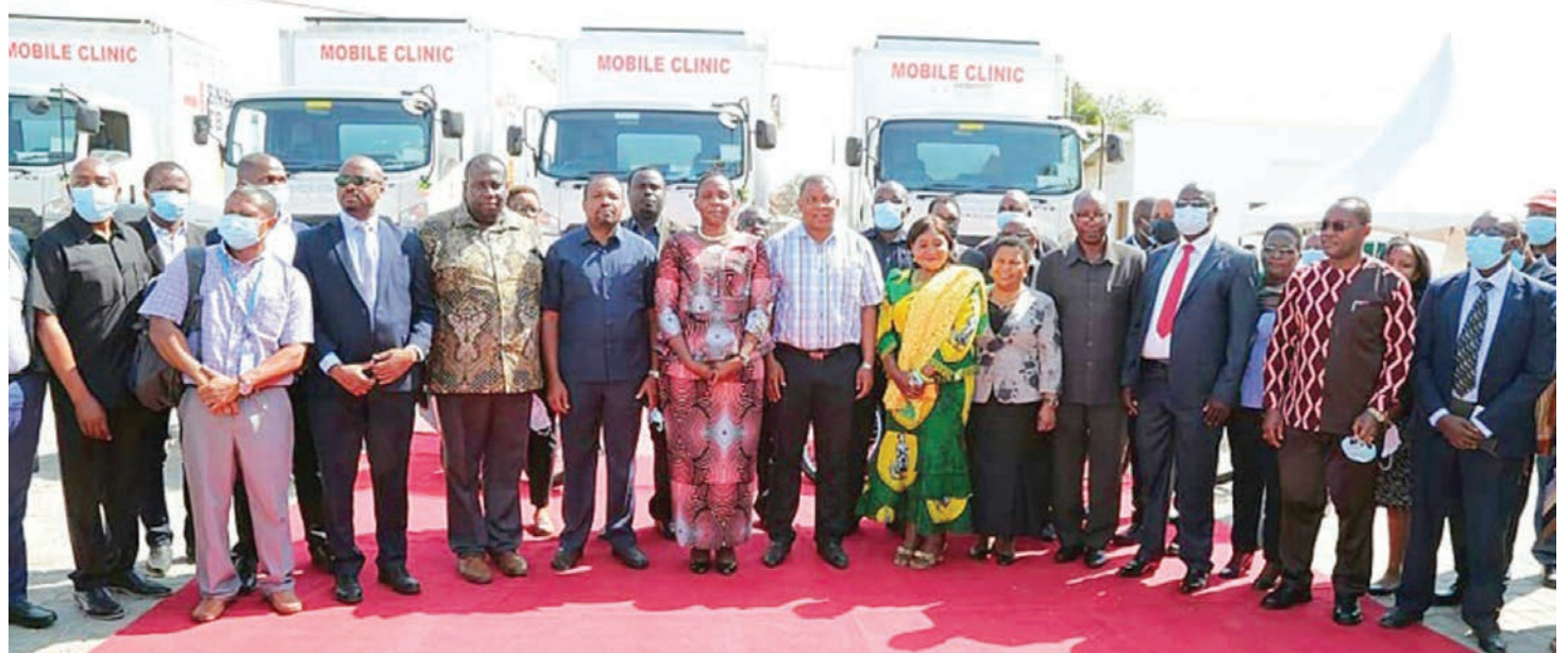
Kliniki zinazotembea, zilipozinduliwa mjini Dodoma, mwezi huu, moja ya hitaji lake kuu ni kutibu kifua kikuu.

Naibu Waziri wa Afya, Maendeleo ya Jamii, Jinsia, Wazee na Watoto, Dk. Godwin Mollel, wakati wa uzinduzi wa Muungano wa Wadau wa Kupambana na Kifua Kikuu Tanzania, ulioshirikisha wabunge, viongozi wa dini taasisi