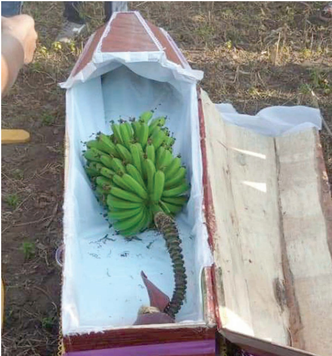
Jeneza lenye mkungu wa ndizi ndani, likiwa limetelekezwa shambani katika kijiji cha Kiwawa, Kata ya Imbaseny, wilayani Arumeru, mkoani Arusha jana, kitendo kilichozua taharuki kwa wakazi wa eneo hilo.