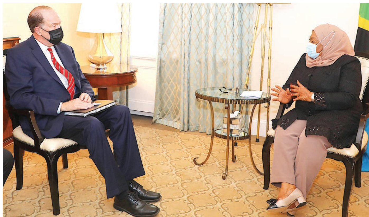
Rais Samia Suluhu Hassan, akizungumza na Rais wa Benki ya Dunia (WB), David Malpass, walipokutana katika ufunguzi wa mkutano wa 76 wa Baraza Kuu la Umoja wa Mataifa (UN), jijini New York, nchini Marekani juzi.

• Kigogo wake ateta na Rais Samia Marekani, aahidi kukuza uchumi... Endelea ukurasa 2