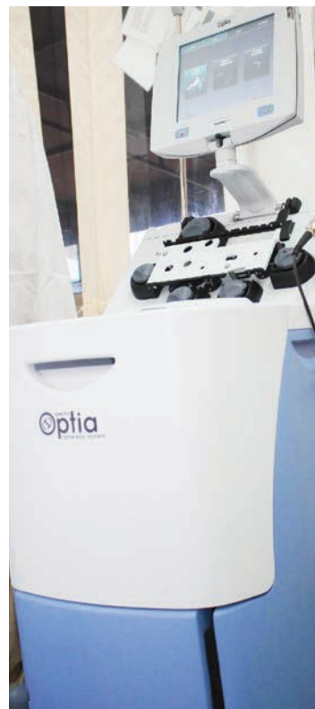
Mashine mpya na ya kisasa iliyoletwa katika Hospitali ya Taifa Muhimbili, kuleta mageuzi kwa wanaoalemewa na tatizo la upungufu wa damu.

Anasema mashine hizo zenye thamani ya Sh. milioni 245 zitasaidia kuvuna chembe mama za kuzalisha damu (hematopoietic stem cells), mazao ya damu ikiwamo chembe sahani (platelets), chembe nyeupe (granulocytes) na utegili (plasma).