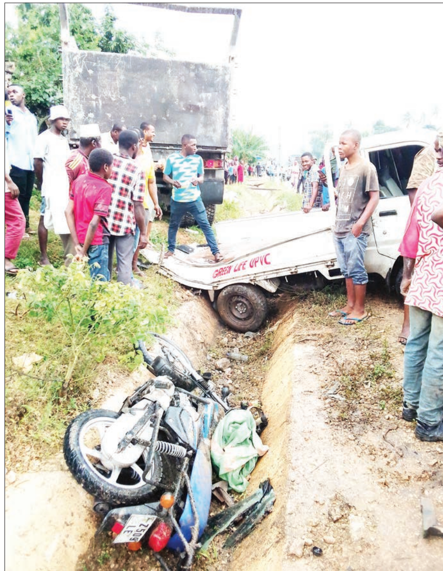
Wakazi wa eneo la Kitope Maili 13, Mkoa wa Kaskazini Uguja, wakishuhudia ajali ya barabarani iliyoyahusisha magari mawili na pikipiki moja jana, ambapo watu watatu wamejeruhiwa.

Mwatam aliwataka wanawake wa mkoa huo kujitokeza kwa wingi wakati utakapofika wa kugombea nafasi mbalimbali za uongozi kuanzia ngazi za chini hadi taifa.