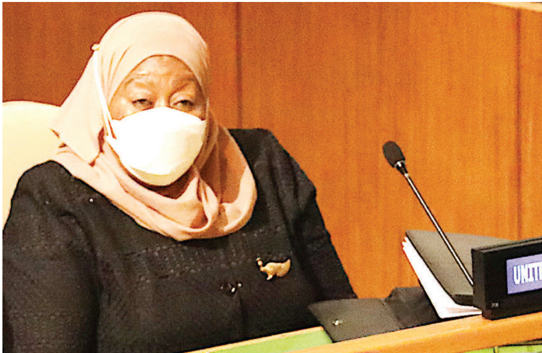
Rais Samia Suluhu Hassan akishiriki mkutano wa 76 wa Baraza Kuu la Umoja wa Mataifa jijini New York, Marekani.

Ni aina ya hatua ambayo imekuwa ikichukua nafasi kimataifa kutoka nchi nyingi, ikiwamo China imekuwa ikitoa mfano mara nyingi nchini Tanzania, ambako katika ziara zake kisiasa, wakiwa wageni wa marafiki zao Chama Cha Mapinduzi (CCM)