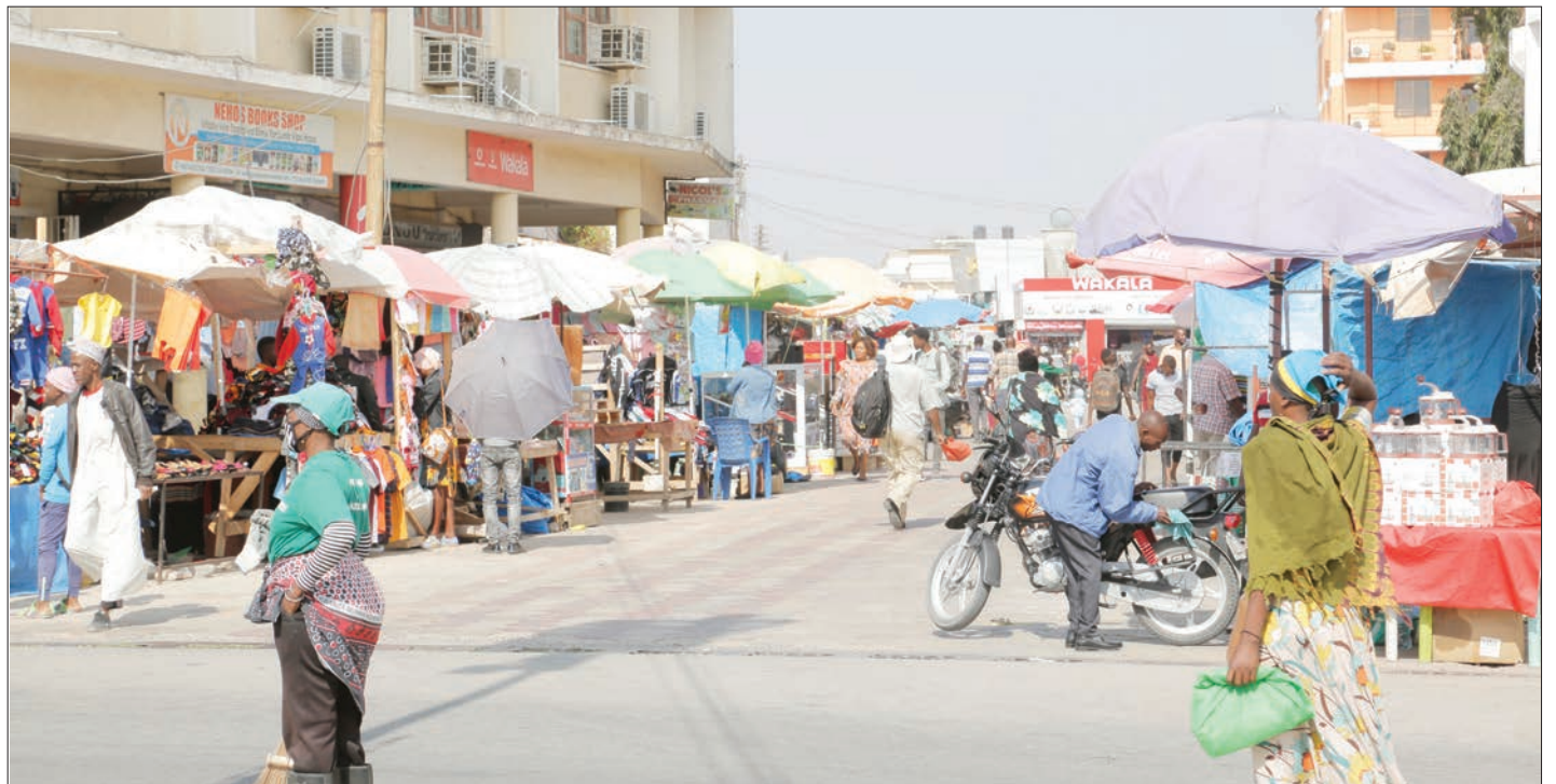
Baadhi ya wafanyabiashara wadogo maarufu machinga, wakiendelea na shughuli zao huku wakiwa wamepanga bidhaa zao mbele ya maduka, kwenye eneo la barabara ya Oneway, jijini Dodoma jana.