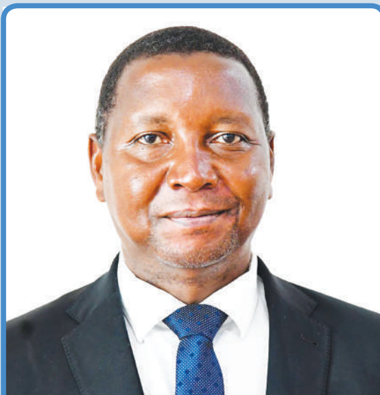
Prof. Adolf Faustine Mkenda Waziri

MUHTASARI WA HOTUBA YA BAJETI YA WAZIRI WA ELIMU, SAYANSI NA TEKNOLOJIA PROF. ADOLF F. MKENDA (MB.) AKIWASILISHA BUNGENI MAKADIPIO YA MAPATO NA MATUMIZI YA FEDHA KWA MWAKA 2024/2025