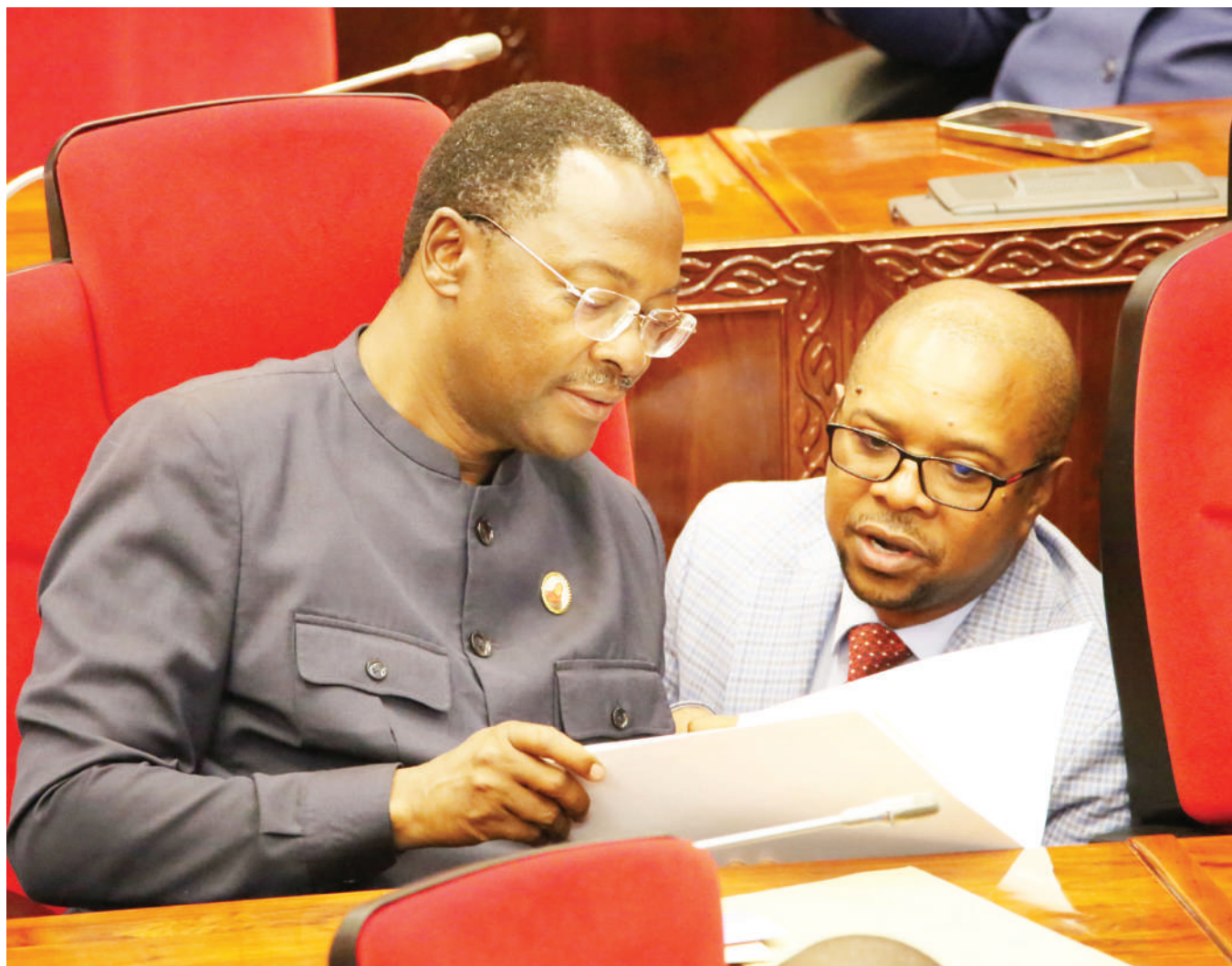
Waziri wa Nchi, Ofisi ya Rais, Menejimenti ya Utumishi wa Umma na Utawala Bora, George Simbachawene (kushoto), akijadiliana jambo na Naibu wake, Ridhiwani Kikwete, Bungeni jijini Dodoma jana.