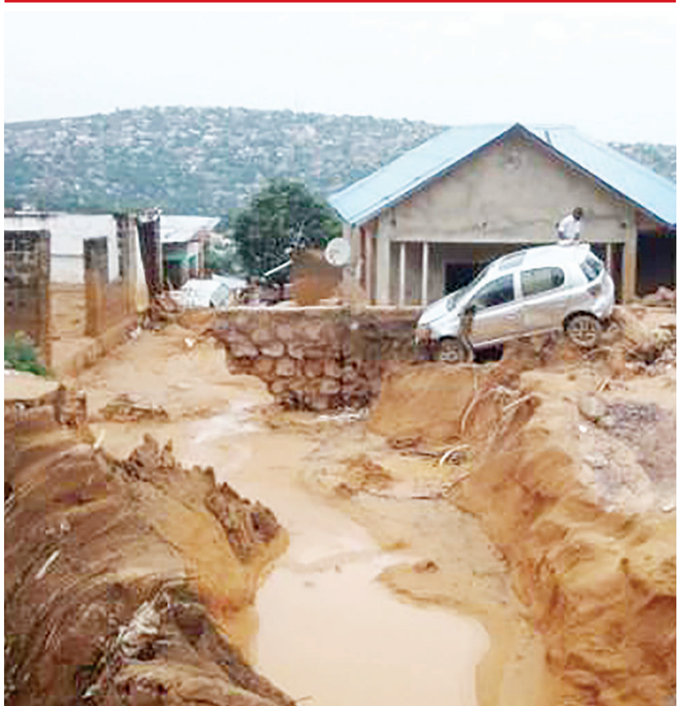
Baadhi ya nyumba na mali zilizoathirika na mafuriko katika mji mkuu wa DRC, Kinshasa juzi.

Mashambulizi hayo yanadhiriisha jinsi mji huo mkubwa kabisa wa Ukraine ulivyo katika hatari ya kushambuliwa na mashambulizi ya mara kwa mara ya Russia ambayo yameharibu miundombinu na maeneo mengine ya makaazi, hasa mashariki na kusini mwa nchi hiyo katika wiki za karibuni. DW