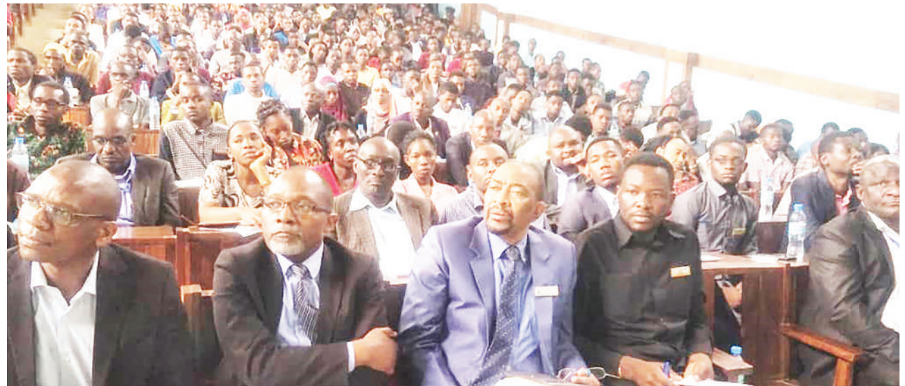
Wahadhiri na wanafunzi wa Chuo Kikuu cha Sayansi na Teknolojia Mbeya (MUST) wakifuatilia mhadhara uliokuwa unatolewa na Prof. Livin Mushi wa Chuo Kikuu cha Ardhi (hayupo pichani), mhadhara huo ni sehemu ya matukio yanayofanyika chuoni hapo kuelekea kwenye mahafali ya chuo hicho.

Aliwataka viongozi wa serikali katika mkoa huo kushirikiana na wadau mbalimbali wa maendeleo kutekeleza miradi na kuisimamia ili wananchi waone thamani halisi ya miradi hiyo.