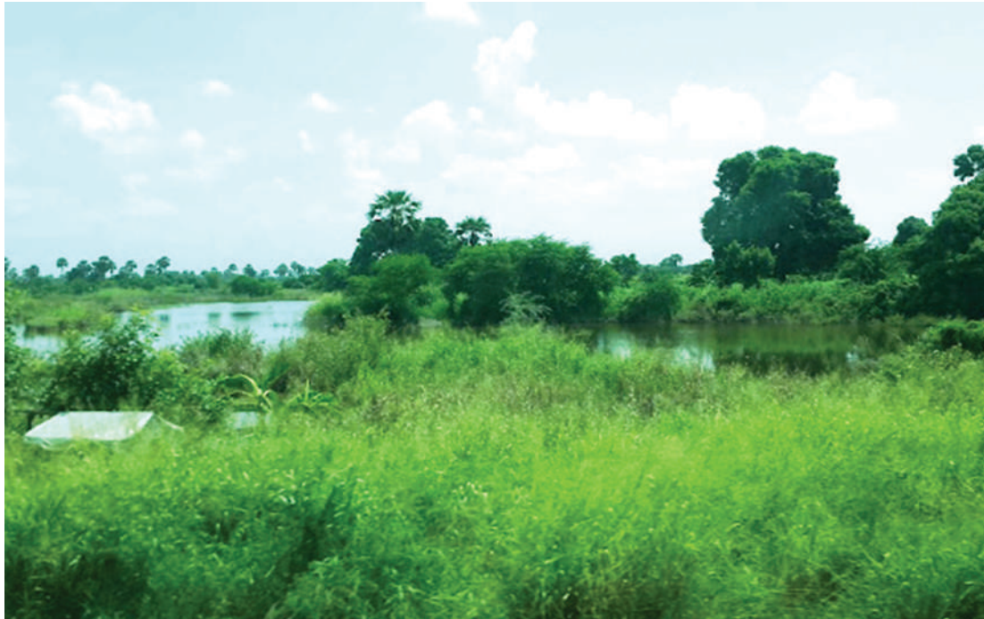
Bonde la Mto Rufiji, eneo la Ikwiriri, mkoani Pwani. PICHA ZOTE: MTANDAO.

"Hapo ndipo yalipofanyika maamuzi ya kulinda maeneo ya