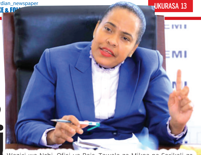
Waziri wa Nchi, Ofisi ya Rais, Tawala za Mikoa na Serikali za Mitaa, Angellah Kairuki.