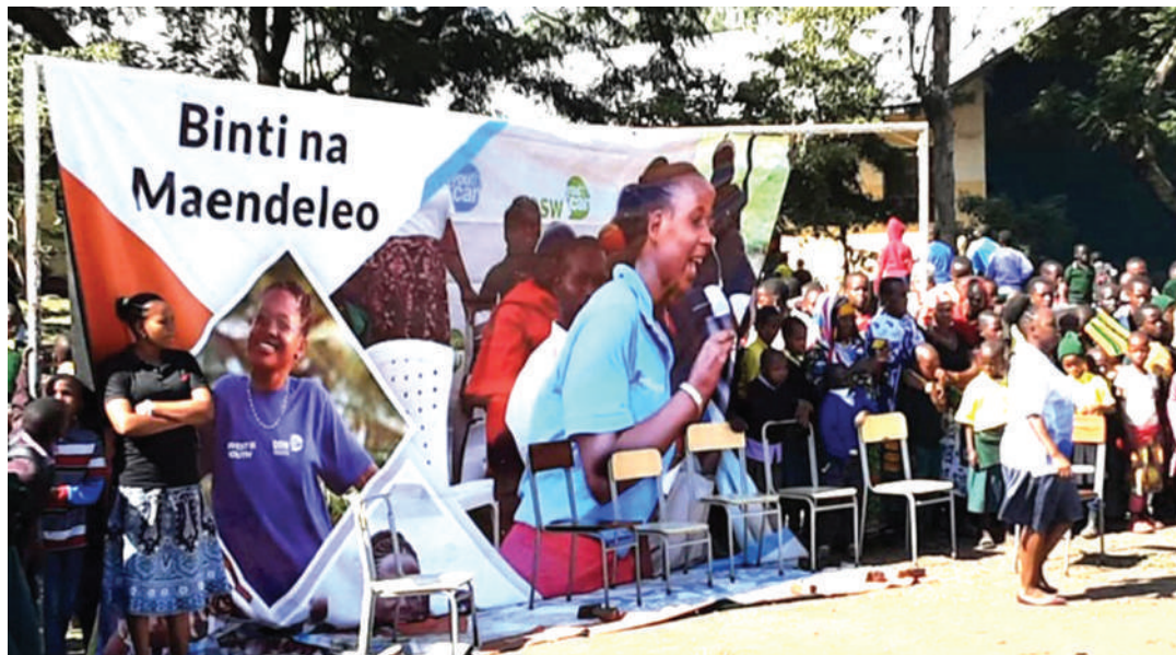
Sehemu ya kampeni dhidi ya ndoa za utotoni mkoani Arusha, ambazo huendana na uonevu kwa mabinti wanaoolewa.

Baada ya kuhofu mume angecharuka, akaenda kwa rafiki wa mume amuombee msamaha kwa mkasa huo, mama huyo akifanua alichokambulia ni kipigo kutoka kwa rafiki ambaye akamrejesh