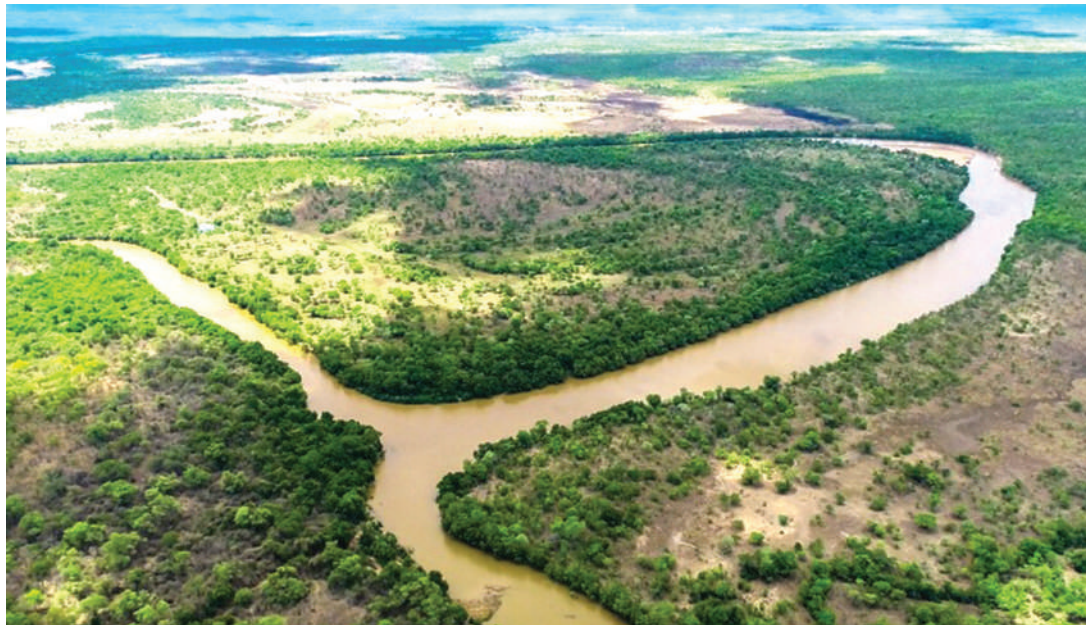
Uhalisi wa mto Ruvuma.

Kutokea hapo, anasema mto huo umepita hadi katika eneo la Tulila wilayani Mbinga, ambako Shirika la Watawa wa Katoliki wa Mtakatifu Agnes, wameweka mradi mkubwa wa umeme wa maji,