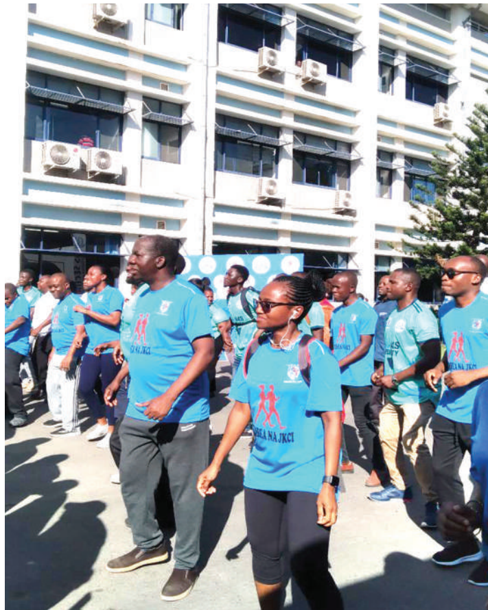
Madaktari na wataalamu wa afya katika jamii ya hospitalini Muhimbili, jijini Dar es Salaam, waliojumuika katika mazoezi ya pamoja kujenga afya.

Nipashe imeshuhudia madaktari wa ngazi mbalimbali, wauzuzi wa madaraja na wafanyakazi wa kada ya afya, kwa pamoja wakikimbia kuanzia kutoka katika viwanja hivyo vya Muhimbili na kukimbia mitaa mbalimbali ya Dar es Salaam, umbali wa kilomita tano, lengo ni kuweka sawa afya zao na kuhamasisha jamii iige mfa-