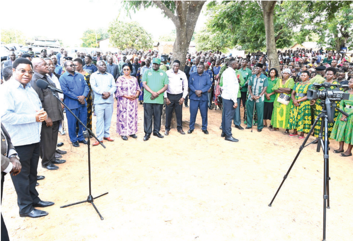
Waziri Mkuu, Kassim Majaliwa, akizungumza na wananchi katika kijiji cha Mapili wilayani Mlele baada ya kukagua barabara ya lami ya Inyonga - Mapili yenye urefu wa kilomita 8.69.