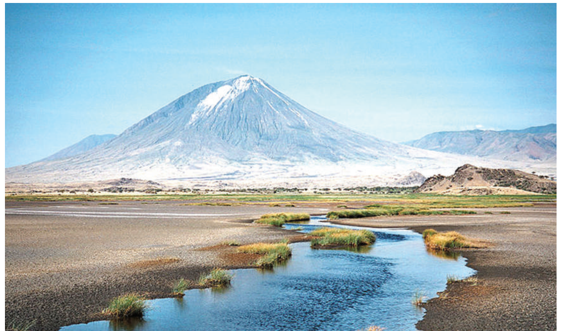
Ukanda wa Ziwa Natron, mkoani Manyara.

Anahitimisha kuwa, uharibifu katika maeneo oevu Tanzania ni zao la matumizi mabaya ya ardhi oevu na kutokuwapo elimu kuhusu umuhimu wake katika sura za; thamani, matumizi na faida ya kutunza maeneo hayo.