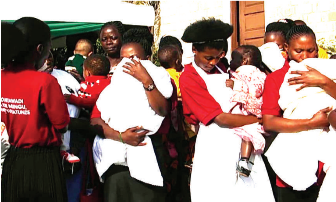
Baadhi ya watoto wanaolelewa katika Kituo cha Kulea Watoto, wakiwa wamebebwa na wasaidizi wao.

“Wengine wanaandikisha taarifa za uongo, tukienda tukafika huko tunaambiwa huyo mtu ha-