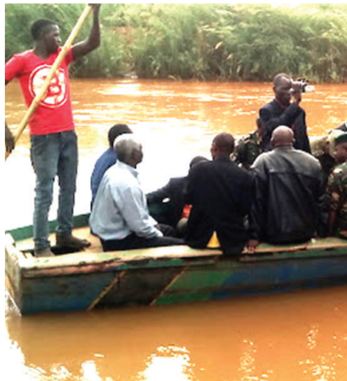
Shuguli zikiendelea ndani ya Mto Ruvuma.

Kwa mujibu wa Orio, Mto Ruvuma unamwaga maji yake katika Bahari ya Hindi kwenye eneo la Msimbati mkoani Mtwara nchini Tanzania na Rasi ya Delgado nchini Msumbiji.