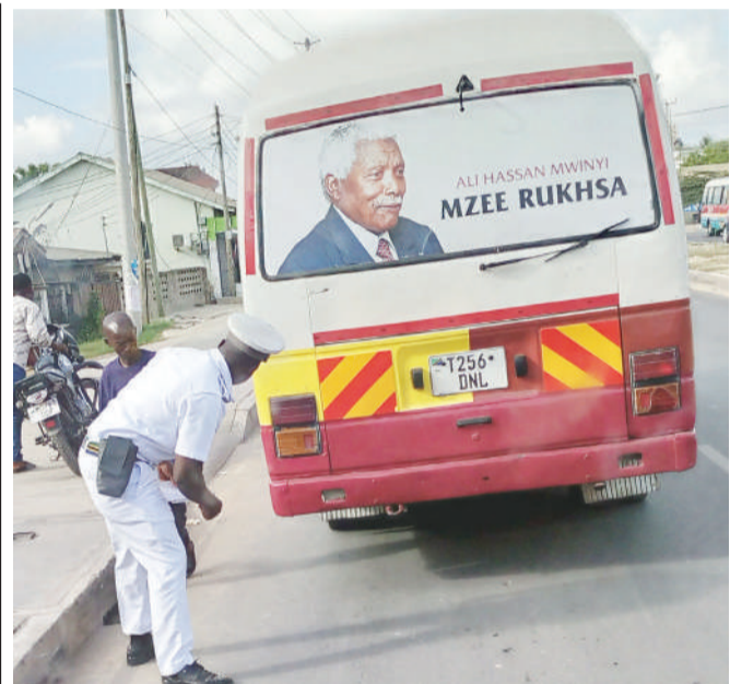
Askari wa Kikosi cha Usalama Barabarani, akikagua daladala baada ya kulisimamisha eneo la Sinza Mugabe Dar es Salaam juzi.

Muhimu: EACOP itapitia na kuchambua nyaraka zilizotumwa na makampuni yaliyoonesha nia kulingana na Tangazo hili la Nia ya kutoa Huduma, na kisha kufanya tathmini kulingana na vigezo vya ndani vya EACOP ili kubaini makampuni yenye sifa yatakayojumishwa kwenye orodha ya awali ya makampuni yenye vigezo. Mwaliko kwa Makampuni kutuma maombi ya zabuni utatumwa kwa Makampuni ya Awali yenye vigezo baada ya makampuni hayo kusaini Makubaliano ya Utunzaji wa Taarifa (NDA). Kampuni ya EACOP LTD ina haki ya kuteua au kukataa kampuni na kubaki na maamuzi yake bila ya kutoa sababu kwa kampuni husika.