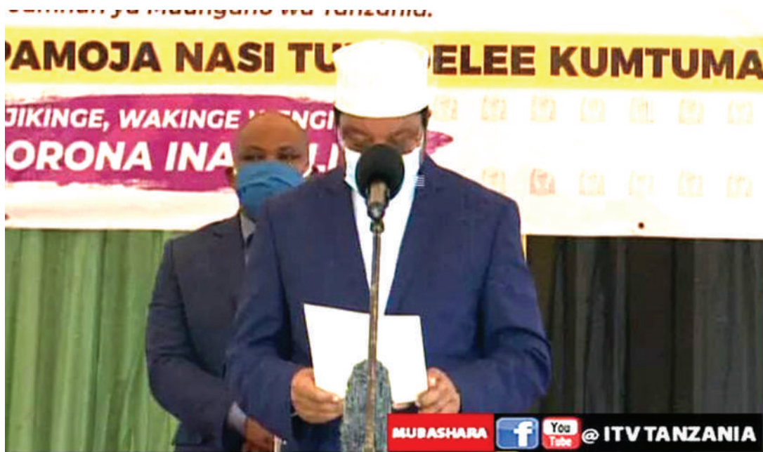
Waziri Mkuu Kassim Majaliwa alipotoa neno la kitaifa kuhusu maradhi Uviko - 19.

"Watu wengi waliokuwa wakilazwa kwenye wodi ya wagonjwa mahtuti, walikuwa wakitumia mitungi mikubwa kabisa. Kuna watu walikuwa wanatumia mitungi minane mpaka 10 na mtungi mmoja ulikuwa unagharimu mpaka Sh.40, 000. Kwa hiyo unapotumia mitungi 10 kwa saa 24