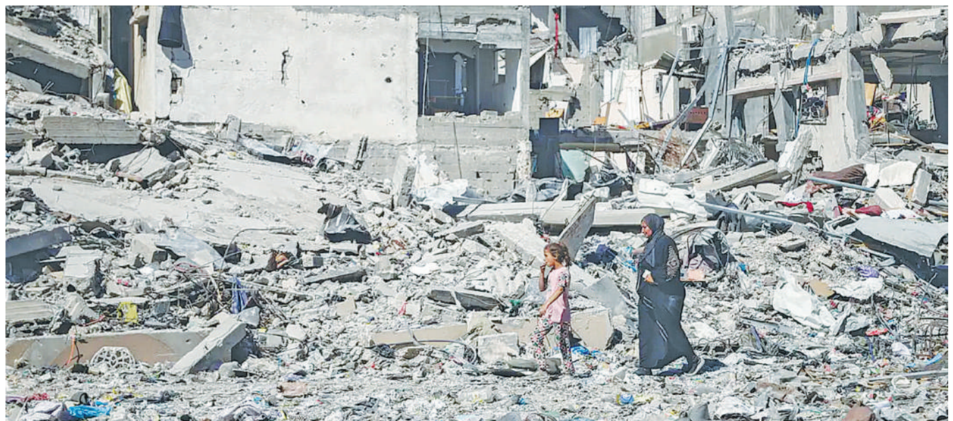
Baadhi ya wakazi katika Ukanda wa Gaza wakitazama makazi yao yaliyoharibiwa vibaya na mashambulizi ya Israel.

Benki hiyo ilikiri mara mbili kukiuka vikwazo dhidi ya Iran na nchi nyingine mwaka 2012 na 2019 na kulipa faini ya jumla ya zaidi ya dola bilioni 1.7 (Sh. Trilioni 4.4) lakini haijakubali kufanya shughuli za miamala kwa mashirika ya kigaidi. BBC