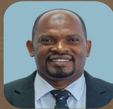
MHE. HAMAD HASSAN CHANDE (MB) NAIBU WAZIRI WA FEDHA