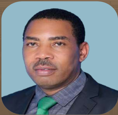
MHE. DKT. MWIGULU NCHEMBA (MB) WAZIRI WA FEDHA