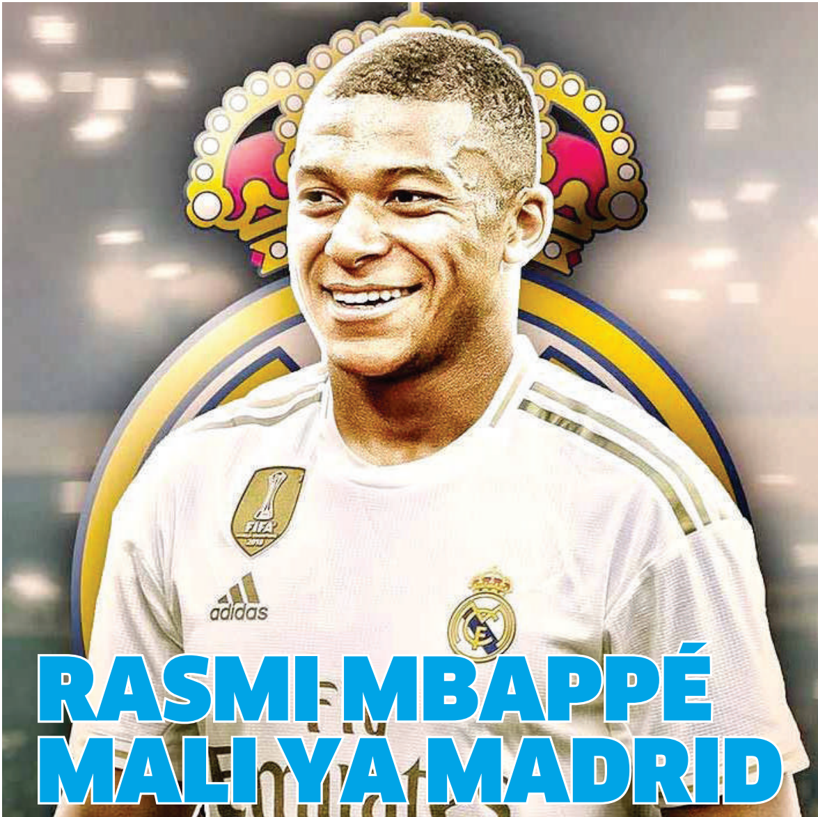
MADRID , Hispania

R EAL Madrid imetangaza rasmi kumsajili mshambuliaji wa Ufaransa, Kylian Mbappé, kwa uhamisho wa bila malipo, hivyo basi kuhitimisha kusubiri kwa miaka mingi kumtaka ajiunge na klabu hiyo.