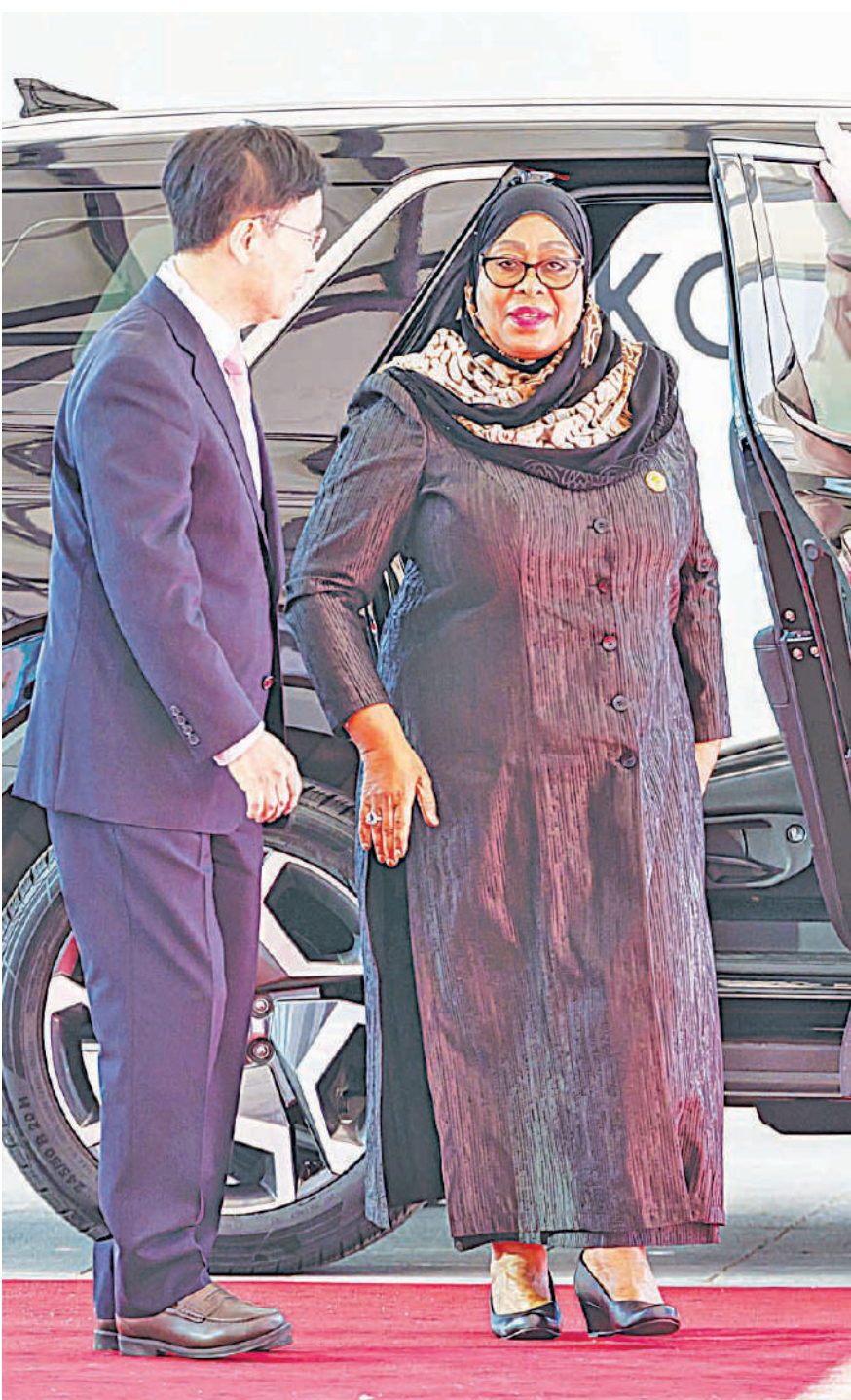
Rais Samia Suluhu Hassan akiwasili Kintex, nje kidogo ya Jiji la Seoul, Jamhuri ya Korea jana, kwa ajili ya kuhudhuria mkutano wa Korea na Afrika.