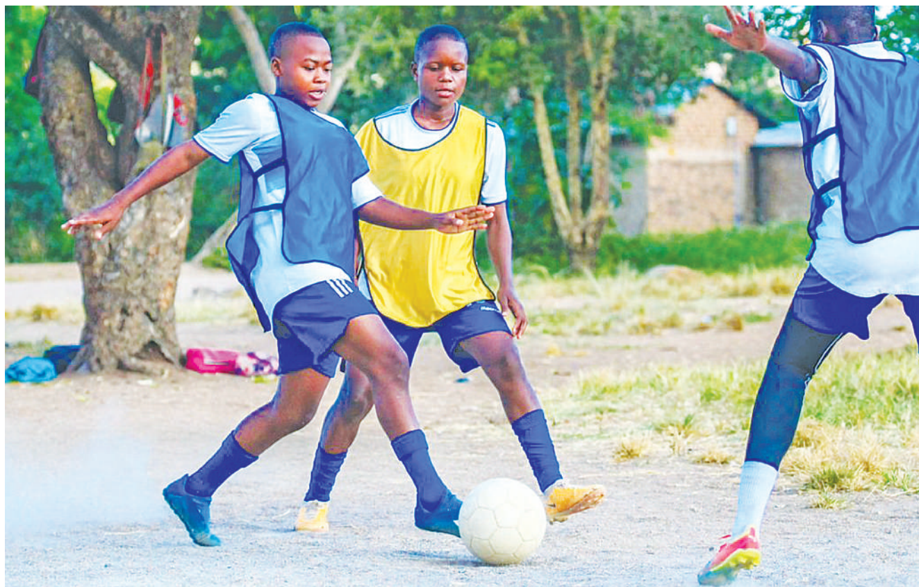
Wachezaji wa Bunda Queens wakifanya mazoezi kwa ajili ya kujiandaa na mechi ya Ligi Kuu ya Wanawake Tanzania dhidi ya Yanga Princess kutoka Dar es Salaam itakayochezwa keshokutwa Mjini Musoma mkoani Mara.