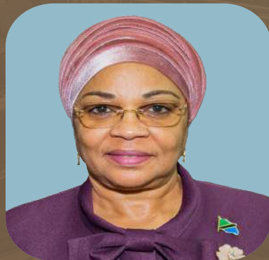
DKT. NATU EL-MAAMRY MWAMBA KATIBU MKUU - WIZARA YA FEDHA