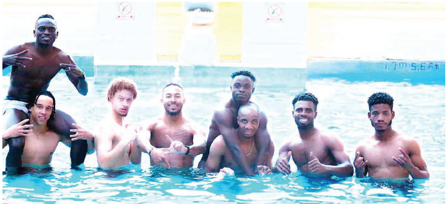
Wachezaji wa Timu ya Soka ya Taifa (Taifa Stars), wakifanya mazoezi ya kujenga utimamu wa mwili kabla ya kuanza safari ya kurejea Tanzania wakitokea Indonesia kucheza mechi ya kirafiki ya kimataifa

Chanzo chetu kingine kilisema Coastal Union imeshaanza mazungumzo na meneja wa beki huyo ili kupata saini yake na uamuzi huo umetokana na uzoefu alionao katika michuano ya kimataifa.