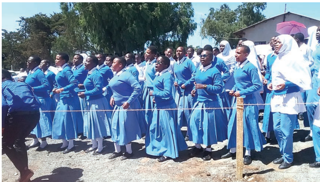
Wasichana wanafunzi wa Hanang'. Sehemu ya kundi maalum linalolengwa katika kuzuia kansa ya shingo ya kizazi na matiti.

Dk. Kodd anasema, matibabu ya ugonjwa huo katika hatua za awali yalipatikana wilayani hapo na kufikia hatua nyinginezo, kupatikana nje ya wilaya hiyo (Ocean Road), baada ya kuwapitishia katika Hospitali ya Misheni ya Haydom.