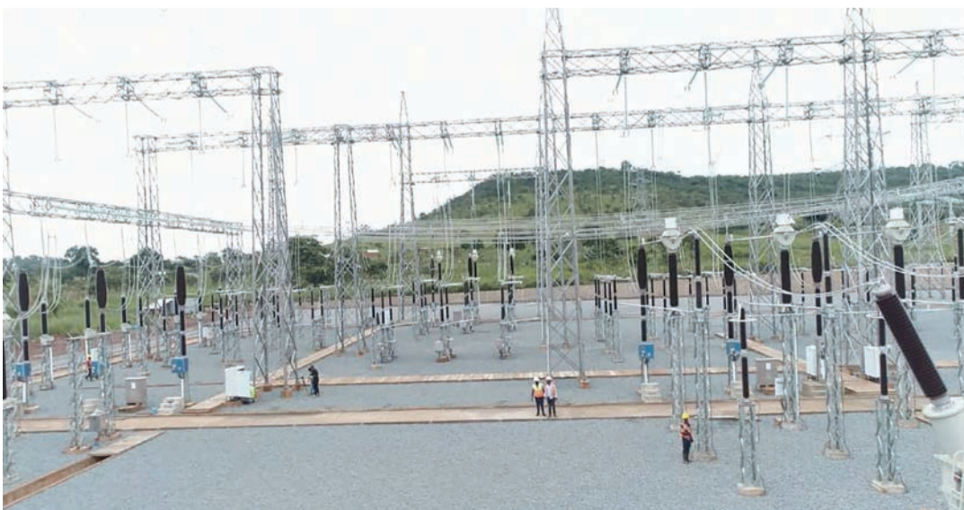
Kituo Cha kupokea na kupoza umeme wa msongo wa kilovoti 220/33 Cha Nyakanazi

TANESCO ni shirika linalohusika na ugawaji wa umeme nchini Tanzania. Shirika hili lilianzishwa mwaka 1964. Shirika la TANESCO linamilikiwa na serikali ya Tanzania. Wizara inayosimamia shughuli za TANESCO ni Wizara ya Nishati.