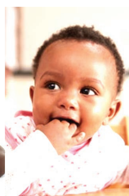
Ni umri wa mtoto fizi zinawasha.