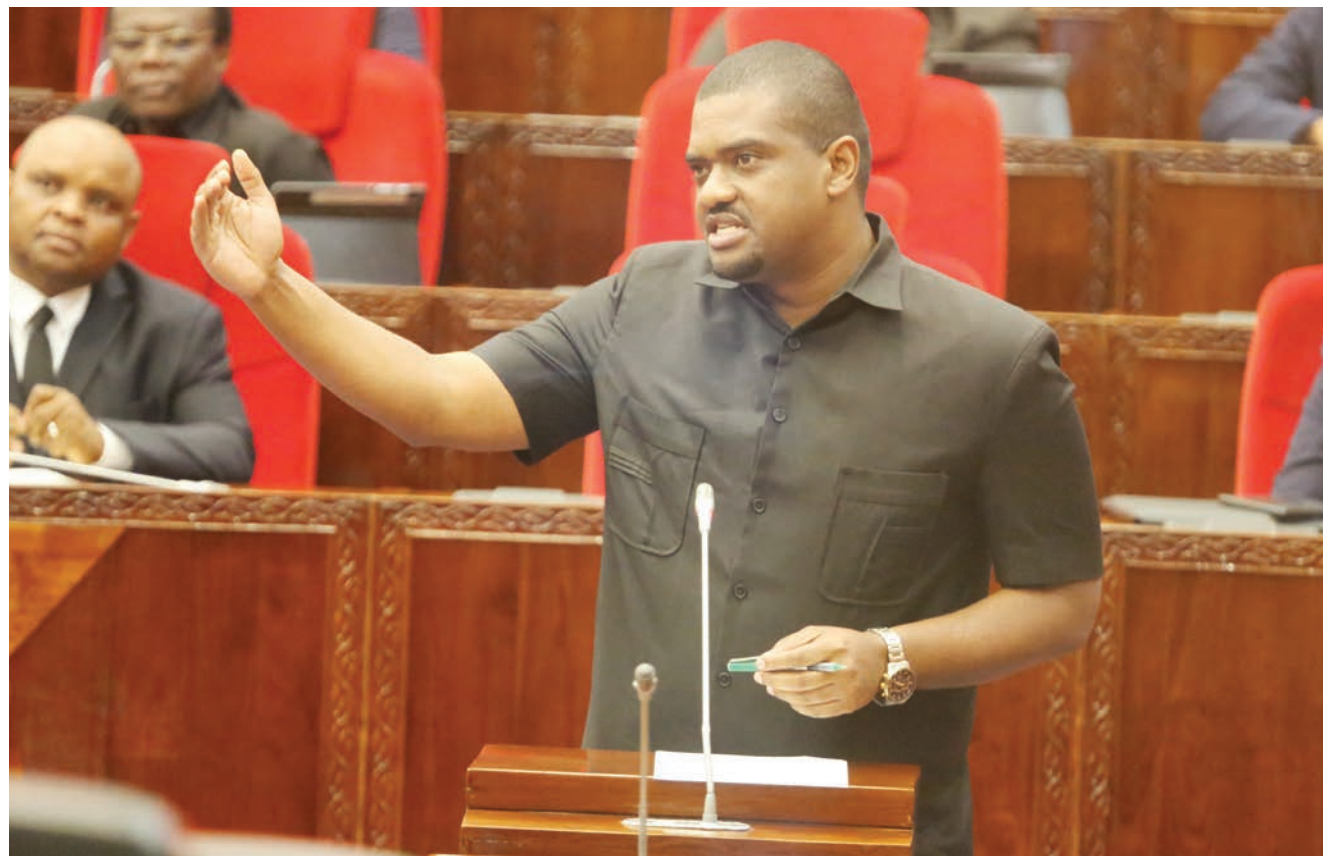
Naibu Waziri Ofisi ya Rais, Menejimenti ya Utumishi wa Umma na Utawala Bora, Deogratius Ndejemi, akijibu maswali yaliyoulizwa na baadhi ya wabunge Bungeni, jijini Dodoma jana.

Pia alisema suala la elimu tayari kuna kwenye mpango kutakuwa na timu maalum itakayozunguka kutoa elimu kwa wananchi ili kujua fursa na faida za kimazingira zilizopo kwenye mradi huo.