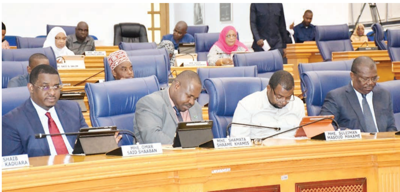
Baadhi ya wajumbe wa Baraza la Wawakilishi, wakifuatilia kikao cha baraza hilo, Chukwani, Zanzibar jana.

Kwa mujibu wa taarifa ya Mamlaka ya Usimamizi wa Mazingira nchini yapo zaidi ya maeneo 150 yameathirika na mabadiliko ya tabianchi ikiwamo baadhi ya visiwa vidogo vilivyoko Unguja na Pemba na baadhi ya wakazi wake wameanza kuvihama.