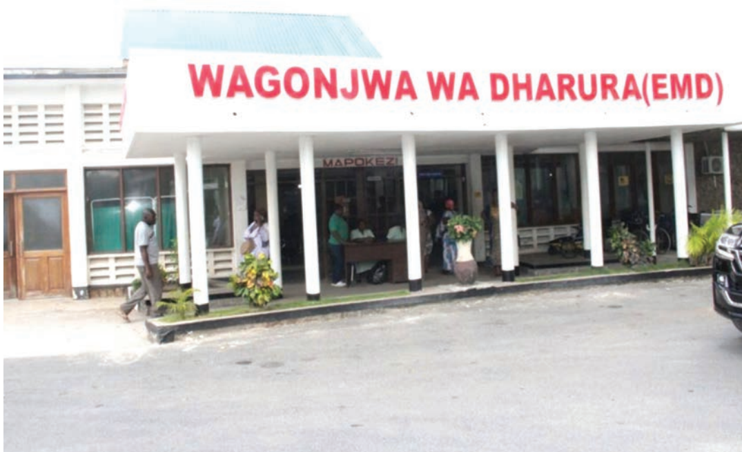
Sehemu ya huduma za dharura hospitalini Temeke.