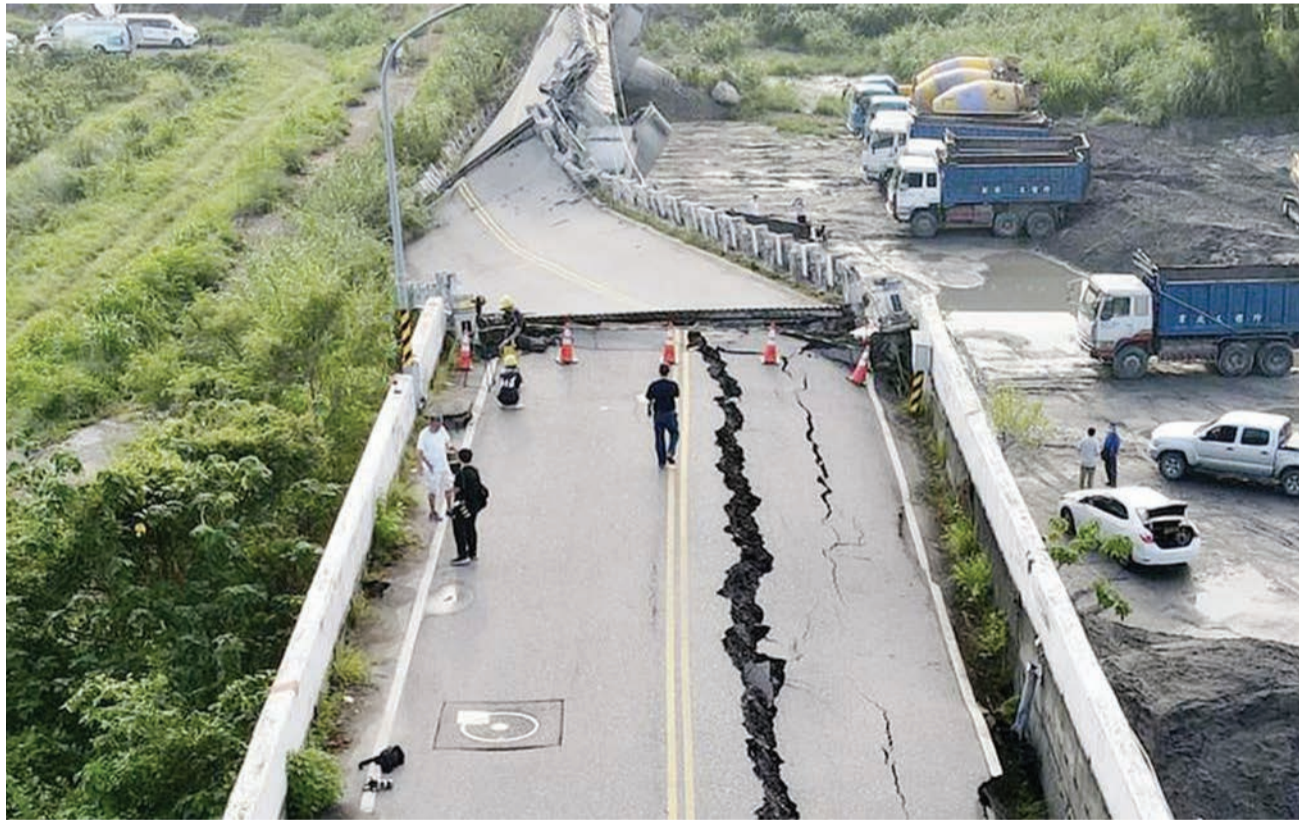
Mwonekano wa daraja la Gaoliao lilivyovunjika baada ya kutokea tetemeko la ardhi lenye ukubwa wa 6.8 katika mji wa Yuli kisiwa cha Taiwan juzi.