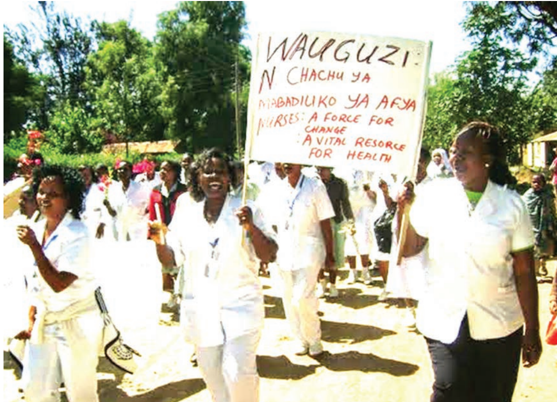
Wauguzi wa wilayani Hanang', mkoani, Manyara, wakiandamana kwenye maadhimisho ya Siku ya Wauguzi. Hao, ni wakala muhimu katika vita vya kuikabili kansa.

saratani kuwa ni pamoja na saratani ya ngozi, shingo ya kizazi, koo, ziwa na chembe hai nyeupe za damu, akisema kinamama wa Hanang wanasumbuliwa zaidi na saratani ya mlango wa kizazi.