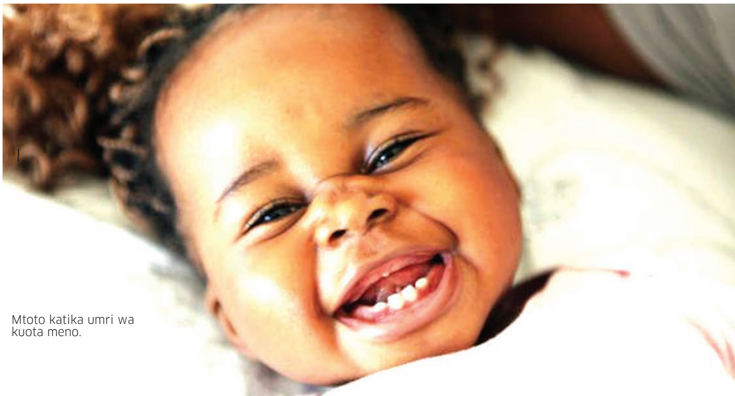
Mtoto katika umri wa kuota meno.