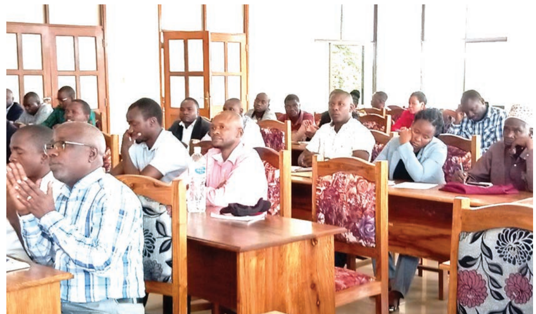
Washiriki wa kikao wakiwamo kutoka asasi zisizo za kiserikali wakiwa kikaoni na mkuu wa mkoa.