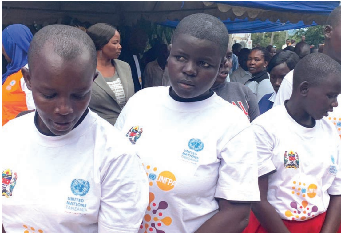
Wasichana wilayani Bunda katika hafla inayohusu ustawi wao, iliyoandaliwa na UNFPA.

"Tunatambua umuhimu wa kupanua huduma za afya na uzazi