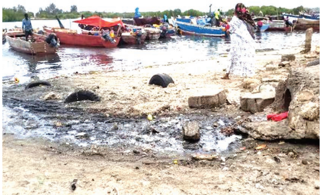
Shughuli za kibinadamu katika bandari isiyokuwa rasmi ya Kipumbwi, mkoani Tanga.

Aidha, anasema mamlaka husika ziweke bayana maeneo mahususi ya kila bandari kwa kuweka mipaka au alama kwani kwa sasa maeneo hayo hayaoneshi mipaka ya maeneo ya bandari kwamba itasaidia uendeshaji wa bandari husika kutoingiliana na mifumo ikolojia kwenye mazingira katika kufanikisha azma ya serikali ya kuwa na maendeleo endelevu.