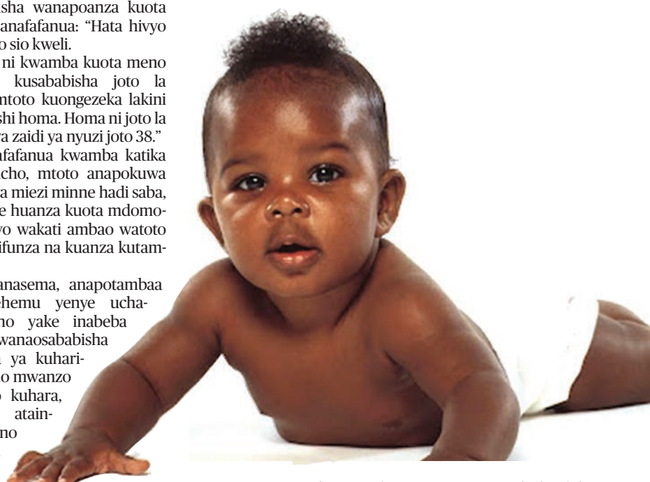
Mtoto anayetambaa, moja ya vyanzo vya kuharisha.

Anasema, ni muhimu kuzingatia ushauri huo kwa sababu ni wakati mwingine mtoto anaweza kuwa na ugonjwa unaoweza kuhatarisha maisha yake.