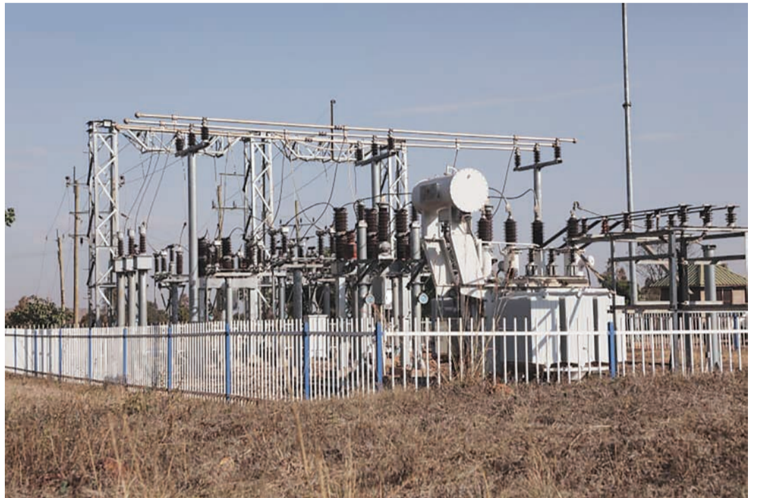
Kituo Cha kupokea na kupoza umeme wa msongo 33/11 Cha kibondo

"Pamoja na hatua hii nzuri, pia TANESCO imekamilisha ujenzi wa njia ya kusafirisha umeme wa msongo wa Kilovoti 33 kutoka Nyakanazi hadi Kakonko kwa lengo la kuunganisha Kakonko, Kibondo na Kasulu kwenye Gridi ya Taifa," alieleza.