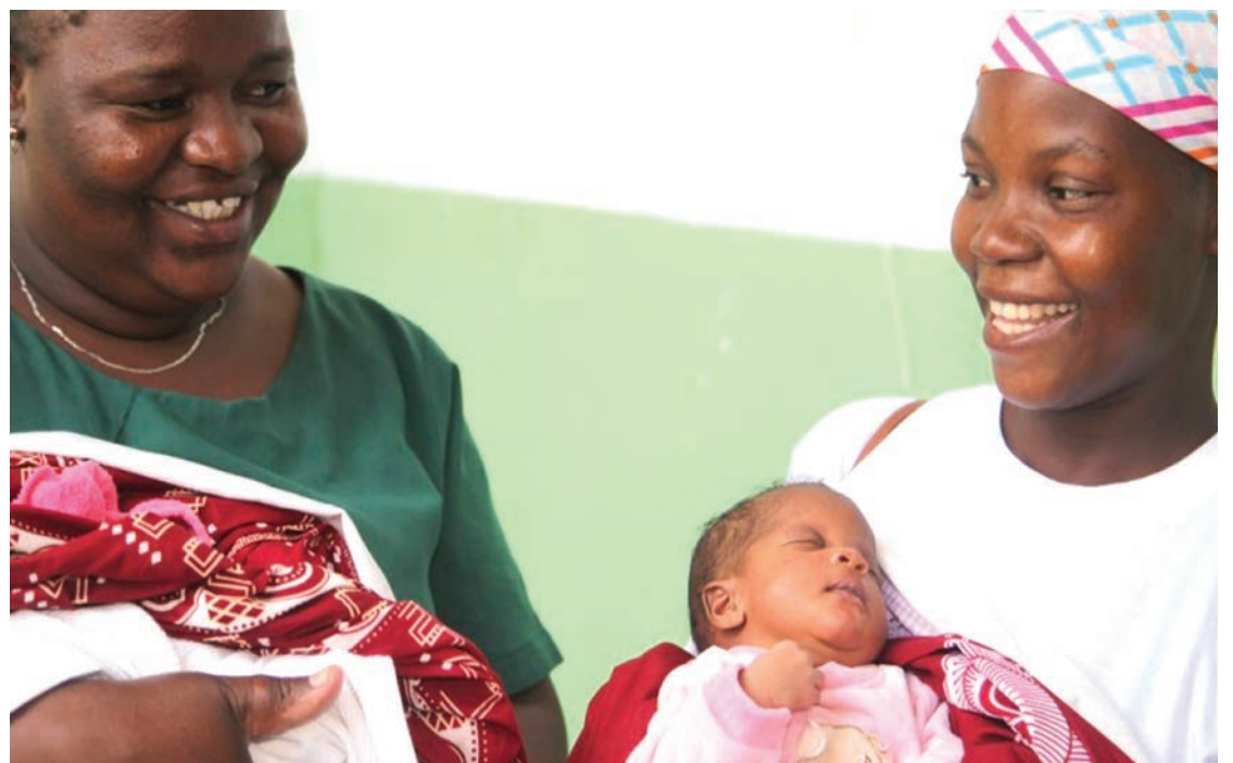
Muuguzi akimpongeza mzazi baada ya kujifungua salama.

Mkurugenzi huyo anakumbusha kwamba, maendeleo ya nchi yanategemea ahadi zilizotolewa katika Mkutano wa Kimataifa wa Idadi ya Watu na Maendeleo wa mwaka 2019, ikijumuisha kuzuia vifo vya uzazi kupitia mpango wa kuhudumia afya ya uzazi na uzazi, mafanikio makubwa yakishuhudiwa.