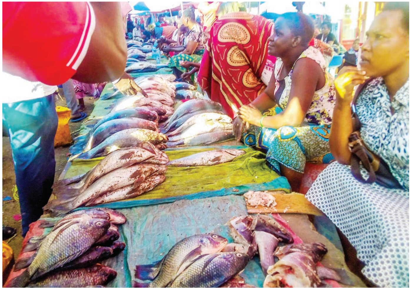
Wachuuzi wa samaki aina ya sato na sangara, wakisubiri wateja katika soko kuu la Mirongo, jijini Mwanza jana. Samaki mmoja anauzwa kwa bei ya 5,000/- hadi 8,000/- kulingana na ukubwa wake.

Alisema: "Sisi kazi yetu ni kutega samaki na dagaa tukiishawafikisha nchi kavu hatuhusiki nao tena hivyo matumizi ya hayo maji yanayohusishwa sisi hatujui chochote," alisema Robert.