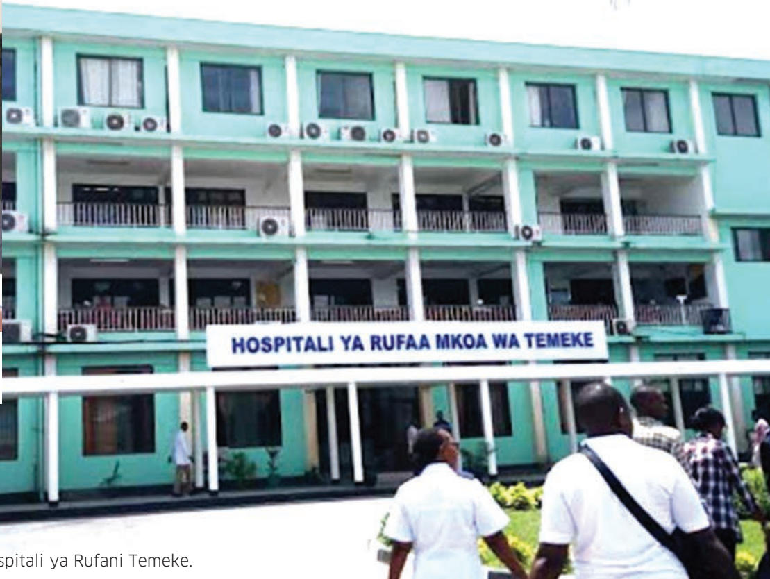
Sehemu ya Majengo ya Hospitali ya Rufani Temeke.