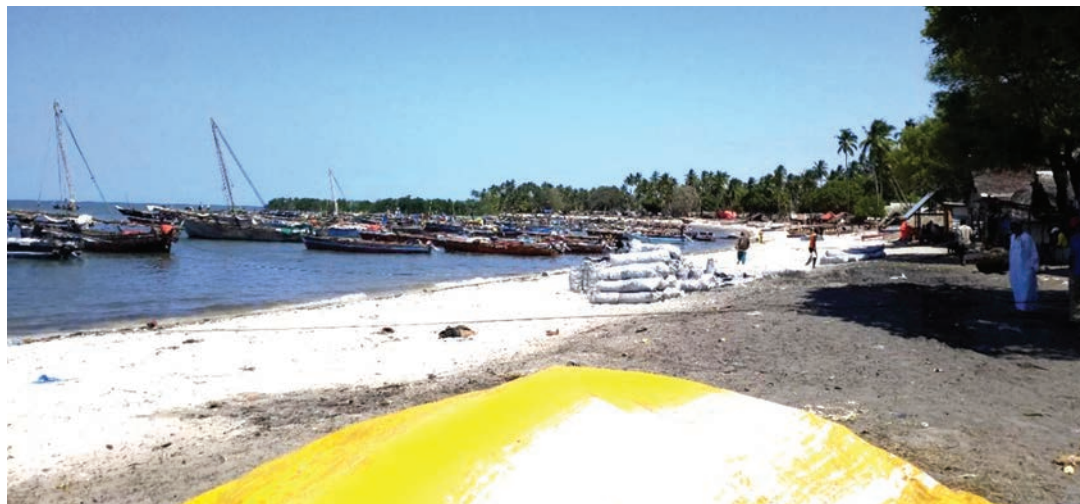
Maji taka yakitiririshwa baharini katika bandari isiyokuwa rasmi ya Kunduchi jijini Dar es Salaam.

na malengo mahsusi ya kubaini maeneo zilipo bandari bubu kwa kutumia mifumo ya kijiografia, kutathmini mifumo ikolojia inayozunguka na kugundua shughuli mahsusi zinazofanyika katika kila bandari.