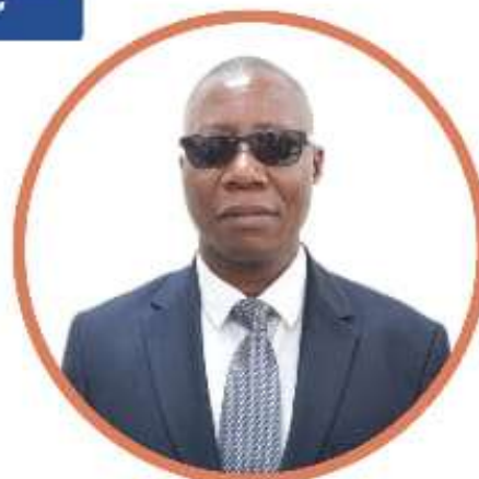
Amon Mpanju Naibu Katibu Mkuu Wizara ya Maendeleo ya Jamii, Jinsia, Wanawake na Makundi Maalum