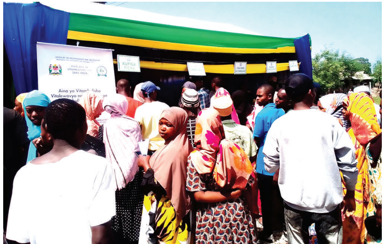
Wananchi wa Jiji la Tanga wakipanga foleni kwa ajili ya kupata huduma za Kitambulisho cha Taifa kwenye banda la NIDA katika maonyesho ya 9 ya biashara yanayoendelea jijini humo jana.