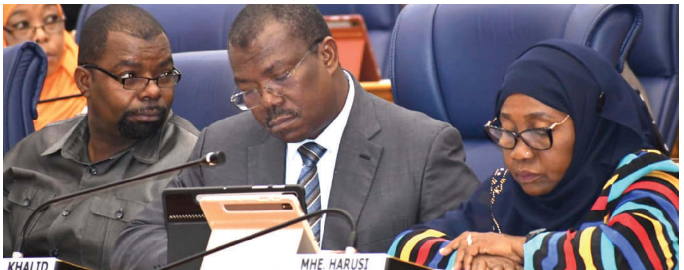
Baadhi ya mawaziri wa serikali ya Zanzibar wakifuatilia kikao cha Baraza la Wawakilishi.

Alisema Shirika la Umeme Tanzania (TANESCO), limekamilisha ukarabati wa miundombinu na lengo ni wananchi kupata huduma hiyo kwa ukamilifu bila usumbufu.