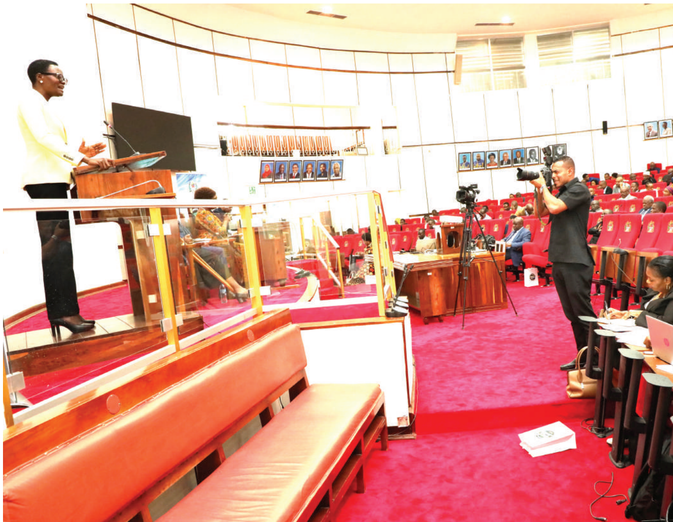
Spika wa Bunge, Dk. Tulia Ackson, akizungumza na wabunge katika semina iliyoandaliwa kwa ajili ya maandalizi ya Sensa ya Watu na Makazi ya Mwaka 2022 jijini Dodoma jana.

Aliwataka kujiunga na vikundi kubuni shughuli za ujasiriamali za kufanya zenye kuwaingizia kipato ambazo zitawakwamua kwenye utegemezi.