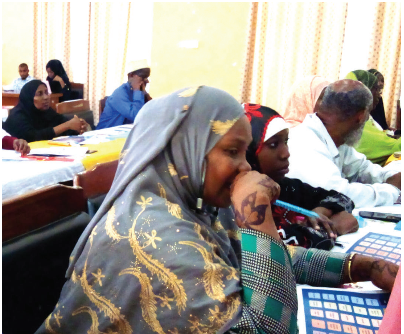
Washiriki wa mkutano mtandao wa Mpango Jumuishi wa Maendeleo katika Jamii (CBID) uliofanyika ukumbi wa Makonyo Wawi Chakechake wakiwa katika mkutano huo, ambao uameandaliwa na MEC-PZ kwa ufadhili wa Shirika la Watu Wenye Ulemavu la Norway (NAD).

Alisema boti zitakazotolewa ni 500 kwa wakulima wa mwani na 577 kwa wavuvi wadogo.