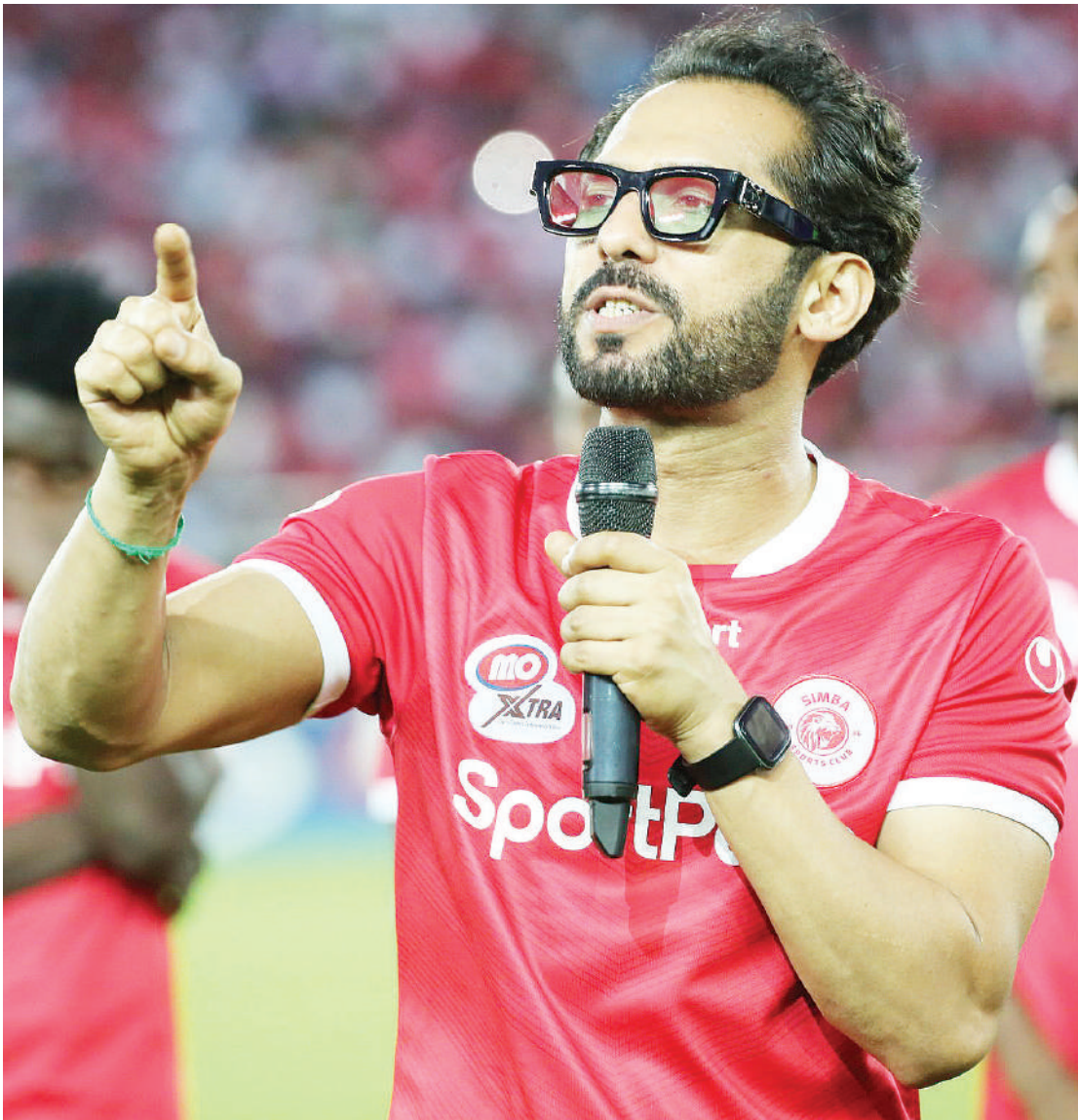
Rais wa Heshima na Mwekezaji wa Klabu ya Simba, Dk. Mohamed "Mo" Dewji.