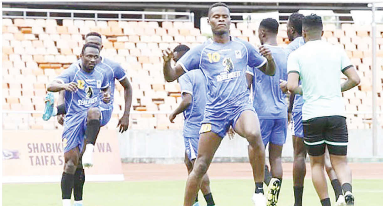
Wachezaji wa Timu ya Taifa ya Tanzania, 'Taifa Stars' wakiwa mazoezi katika Uwanja wa Benjamin Mkapa, Dar es Salaam juzi, kujiandaa na michezo ya kufuzu Fainali za Mataifa ya Afrika (AFCON) 2023 dhidi ya Niger na Algeria itakayochezwa Juni 4 ugenini na Juni 8 nyumbani kwa Mkapa.

Wakati Yanga ikiichapa Simba bao 1-0 kwenye mechi ya nusu fainali iliyochezwa Uwanja wa CCM Kirumba Mwanza Jumamosi iliyopita, Coastal Union iliiondosha Azam FC kwa mikwaju ya penalti 6-5 kwenye Uwanja wa Sheikh Amri Abeid, Arusha baada ya dakika 120 za suluhu.