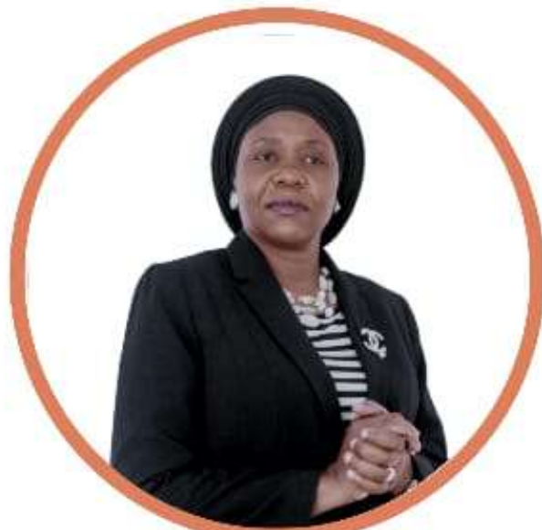
Mhe. Dkt. Dorothy Gwajima (Mb) Waziri wa Maendeleo ya Jamii, Jinsia, Wanawake Makundi Maalum