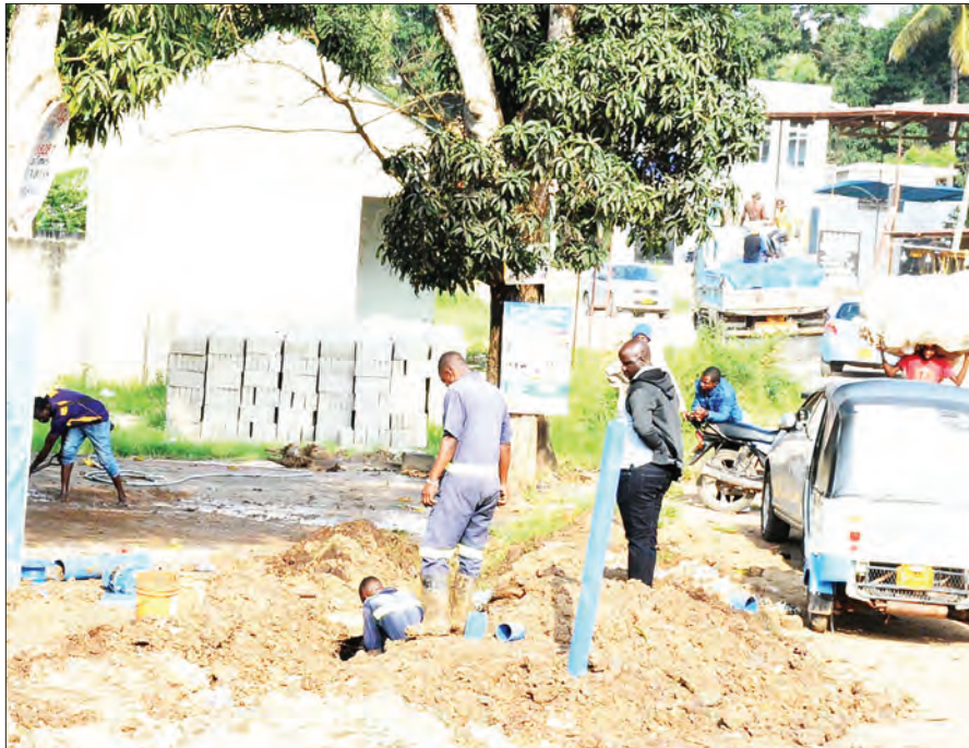
Mafundi wa Mamlaka ya Majisafi na Usafi wa Mazingira Dar es Salaam (DA-WASA), wakiunganisha huduma mpya ya maji eneo la njia panda ya Goba Tegeta A, Dar es Salaam jana.