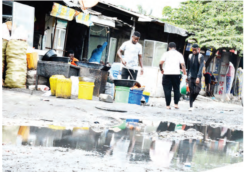
Wauzaji wa chipsi wakifanya biashara kwenye mazingira hatari kiafya kutokana na maji machafu yanayotuma na kutoa harufu mbaya katika eneo la Biafla Kinondoni, Dar es Salaam juzi.

Alivitaja vyakula hivyo ni pamoja na dengi, kunde, choroko, soya, maharage ambayo ni mbadala wa kula nyama na vyakula vyenye wanga mwingi kama ugali na wali.