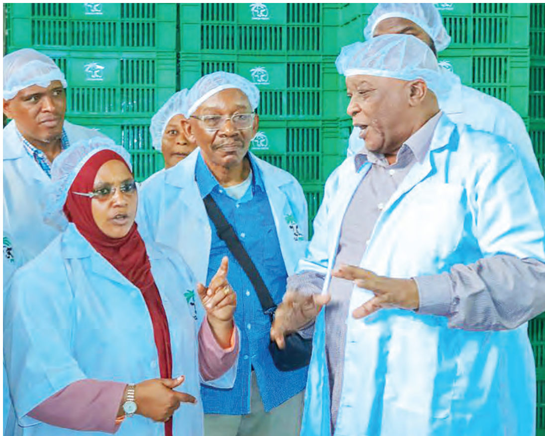
Waziri wa Viwanda na Biashara, Dk. Ashatu Kijaji (wa pili kushoto), akipata ufafanuzi wa jambo alipofanya ziara ya kikazi alipotembelea kiwanda cha Maweni Limestone kinachozalisha saruji ya Huaxin, jijini Tanga juzi.