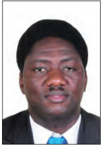
Na Magabilo Masambu

T UKIWA katika msimu wa maonyesho ya Nanenane ambao wakulima, wafugaji na wavuvi wanapata nafasi na wavuvi wanapata nafasi wanazozalisha mashambani na viwandani pamoja na kutoa elimu kuhusu kilimo, ufugaji na uvuvi, ni muhimu kuendelea kukumbushana mambo kadhaa hasa yanayogusa afya zetu kama watumiaji wa bidhaa zitokanazo na sekta hizo.