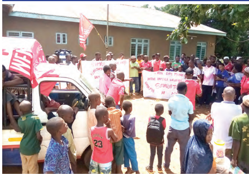
Mashabiki wa Simba Tawi la Shauri Moyo (Mahakama ya Nazi), lililoko katika Wilaya ya Muheza, Tanga wakiwa pamoja baada ya kumaliza kufanya usafi kwenye Kituo cha Afya cha Ubwari kama sehemu ya sherehe za Simba Day 2023 ambazo kilele chake ni leo.

Aliongeza licha ya timu chache kushirikiri, mashindano hayo yamefanikiwa kwa asilimia kubwa.