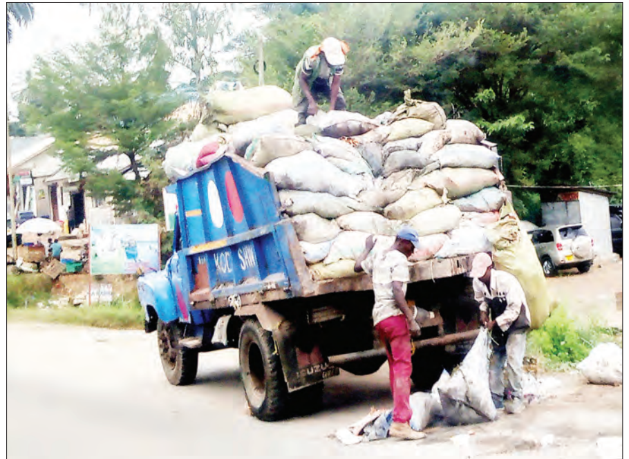
Wafanyakazi wa kampuni ya usafi wakizoa taka huku wakiwa hawajavaa vifaa vya kujikinga mikononi, eneo la Mbezi Mwisho, Manispaa ya Ubungo, Dar es Salaam juzi, kitendo kinachoweza kuhatarisha usalama wa afya zao.