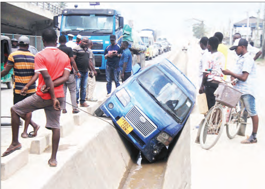
Gari dogo likiwa limetumbukia kwenye mtaro wa maji ya mvua, baada ya kugongwa kwa nyuma na lori katika eneo la Tazara, Dar es Salaam hivi karibuni. Hakuna mtu aliyenjejeruhiwa.