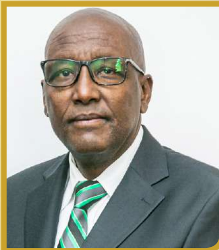
Mhe. Dkt. Steven Lemomo Kiruswa (Mb.) Naibu Waziri wa Madini