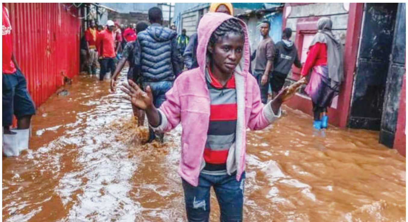
Hali ya mafuriko ilivyo nchini Kenya.

Iwapo sheria hiyo itaanza kufanya kazi, itaongeza muda wa kifungo jela na ufutaji wa haki za mashoga na wanatuhumiwa kuukuza utambulisho wa mashoga, wasagaji na makundi mengine ya watu wachache au utambulisho wa kijinsia. VOA