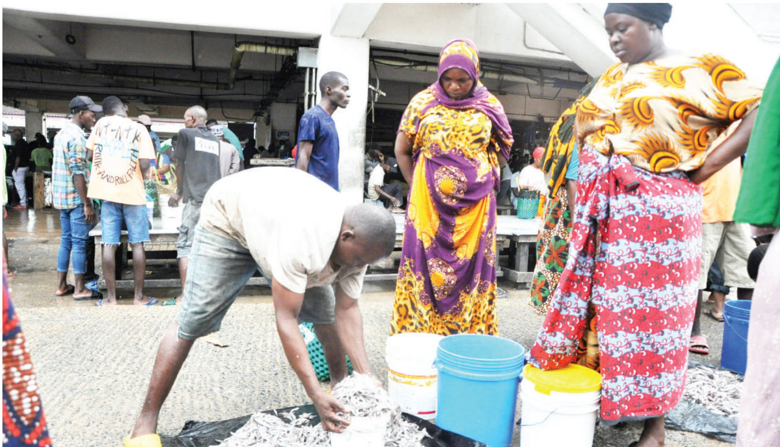
Mchuzi wa dagaa akimhudumia mteja wake katika mnada wa soko la samaki la Kimataifa la Magogoni maarufu Feri, jijini Dar es Salaam mwishoni mwa wiki. Kwa mujibu wa wavuvi, kitoweo hicho, kimekuwa adimu sokoni hapo kutokana na hali ya hewa mbaya baharini inayosababishwa na msimu wa mvua zinazoendelea kunyesha.