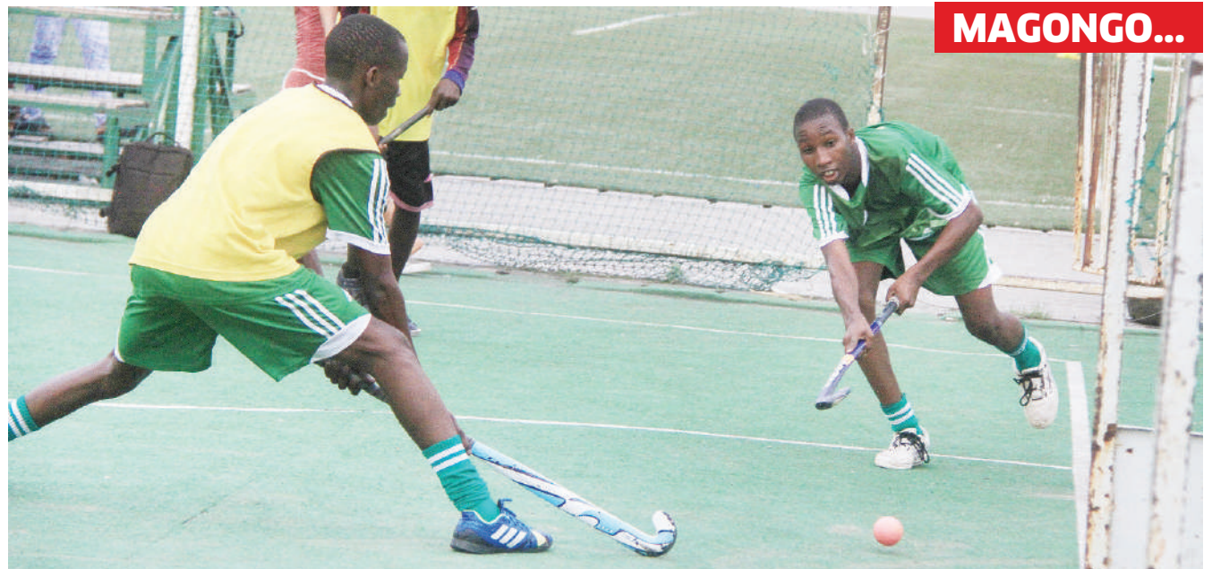
Wachezaji wa Timu ya Mpira wa Magongo ya TMK, wakifanya mazoezi katika viwanja vya Jakaya Kikwete jijini Dar es Salaam juzi.