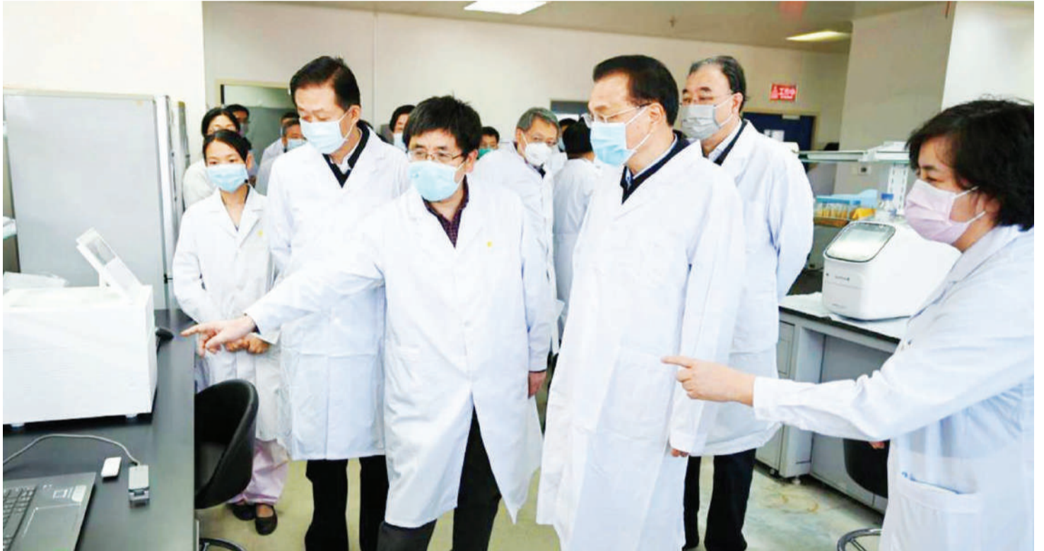
Wataaluma katika Idara ya Afya ya Dunia katika Chuo Kikuu cha Washington, Marekani wakiwa maabara, wanafanyia kazi nyendo za ugonjwa corona.