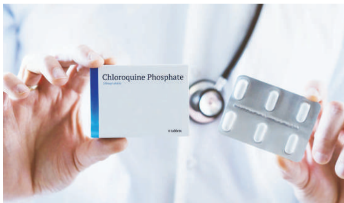
Dawa aina ya klorokwini.

Nchini Nigeria kumesuhudiwa ongezeko la bei za dawa hiyo, bada aya kutangazwa sifa za kuweza kutibu.