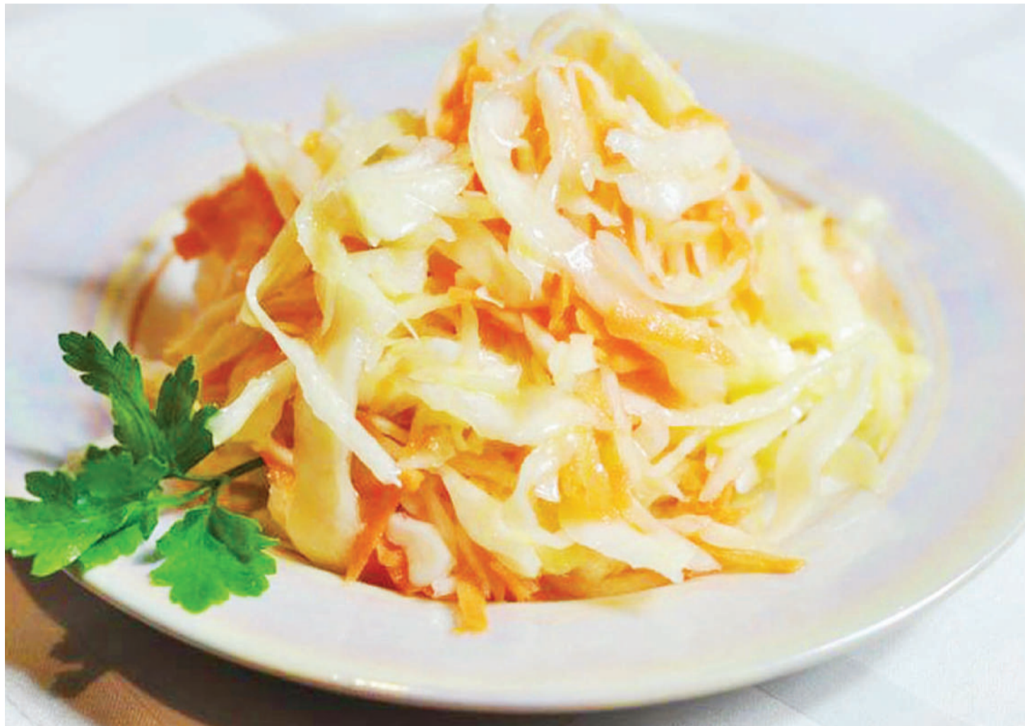
Kabichi iliyokwishaandaliwa. PICHA ZOTE: MTANDAO.