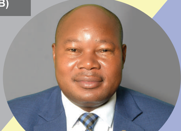
NAIBU WAZIRI, (E) OR-TAMISEMI MHE. MWITA WAITARA. (MB)