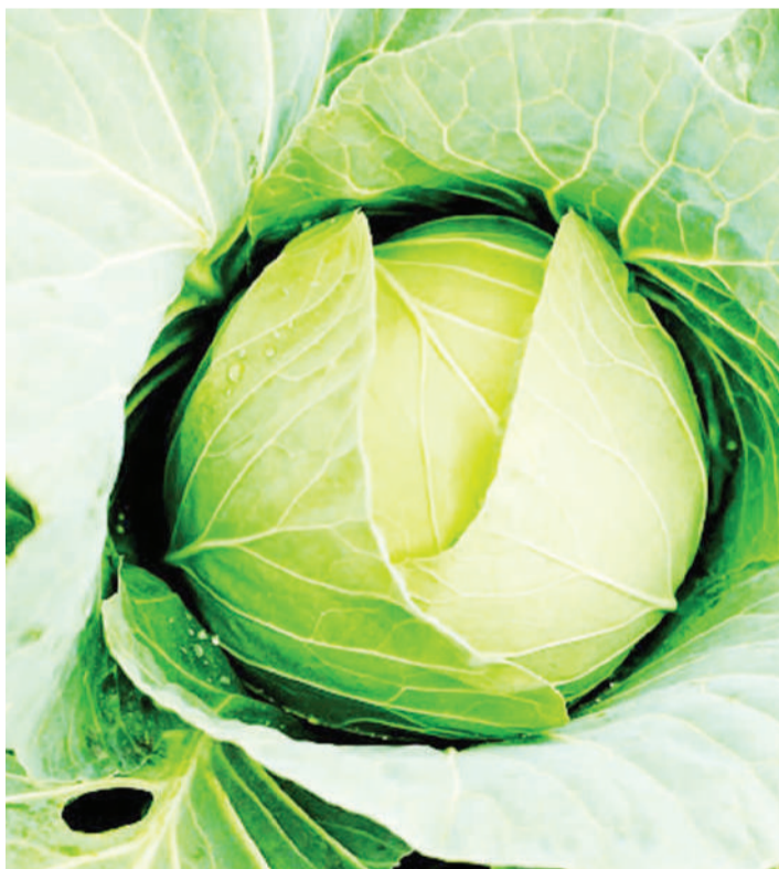
Kabichi kutoka shambani.

Kabichi imeonekana kuwa na uwezo wa kipekee katika kupambana na ugonjwa huo, kutokana na kuwa na kiasi kikubwa cha aina tatu muhimu za virutubisho.