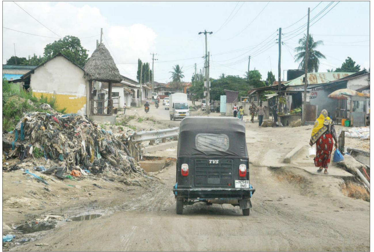
Lundo la takataka zilizoletwa na mafuriko ya mvua katika daraja la Mto Ng'ombe, linalounganisha eneo la Kijitonyama Ali Maua na Tandale kwa Mtogole, jijini Dar es Salaam, zikiwa zimetelekezwa kwa muda mrefu bila ya kuondolewa.