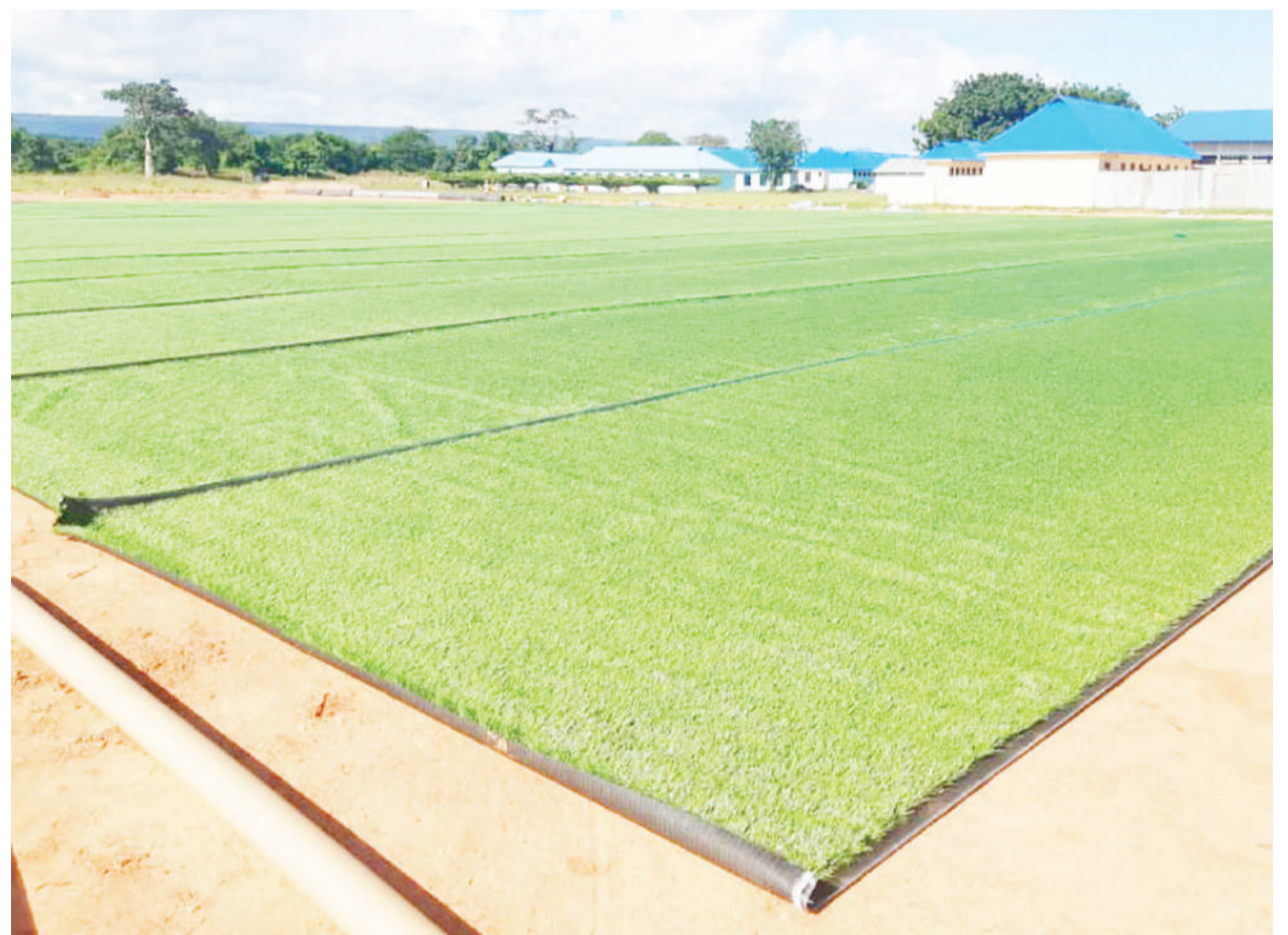
Uwanja wa kisasa wa mpira wa miguu unaojengwa na Kampuni ya Juvenile Sports Academy, katika eneo la Shule ya Sekondari ya Nyangao, iliyopo Lindi kwa ajili ya mikoa ya Kanda ya Kusini. NA MPIGAPICHA WETU

Kiongozi huyo pia alisema klabu yao imewapiga marufuku wachezaji wao kuzungumza na vyombo vya habari bila ya kupata ruhusa.