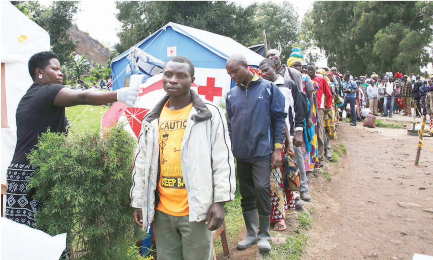
Mhudumu wa afya, akipima joto la mwananchi kwenye eneo la mpakani mwa Jamhuri ya Kidemokrasia ya Congo (DRC) na Uganda, pindi lilipozuka janga la Ebola, Februari, mwaka jana.