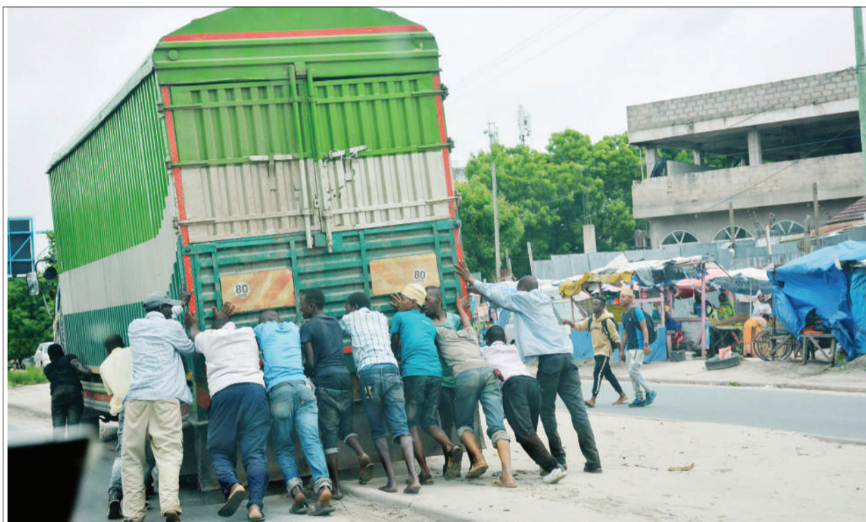
Wasamaria wema wakisaidia kulikusuma lori baada kuharibika katikati ya barabara ya Uhuru, eneo la Buguruni Rozana, jijini Dar es Salaam jana.

Watu waliwekwa karantini katika mkoa huo ni Watanania 53, kutoka Jamhuri ya Kidemokrasia ya Kongo (6) na Burundi (2).