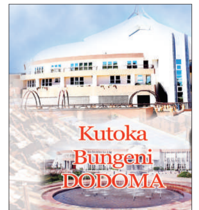
Habari zote na Augusta Njoji, DODOMA

Pia, ilisema kuboresha miundombinu ya usafirishaji na kuongeza tija na uzalishaji ili kupunguza gharama za uzalishaji na kuongeza bei na kipato kwa wakulima wa pamba.