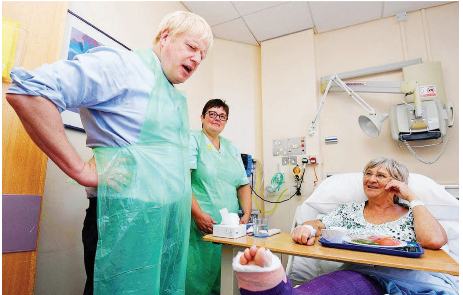
Waziri Mkuu wa Uingereza, Boris Johnson, wakati wa mlo hospitalini, Jumatatu wiki hii alipolazwa, Baada kugundulika kuwa na corona.