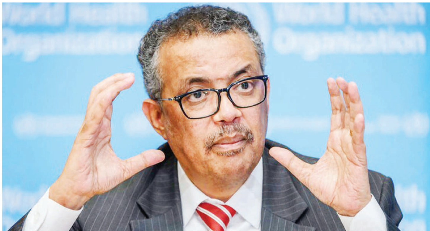
Mkurugenzi Mkuu wa WHO, Dk. Tedros Adhanom Ghebreyesus.

• WHO inasema feki, Trump aweka oda maalum India