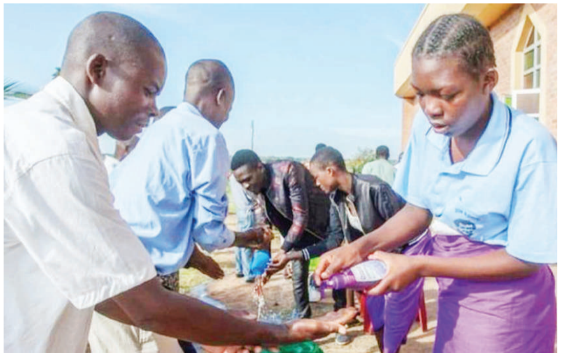
Wakazi wa jijini Lilongwe, Malawi wakinawa mikono kujihami na maambukizi ya corona.

Mara baada ya virusi kuzaliana kwa kasi mwilini, kinga ya mwili huzidiwa uwezo na inachukua juma kadhaa kuangamiza 'vijidudu' vyote.