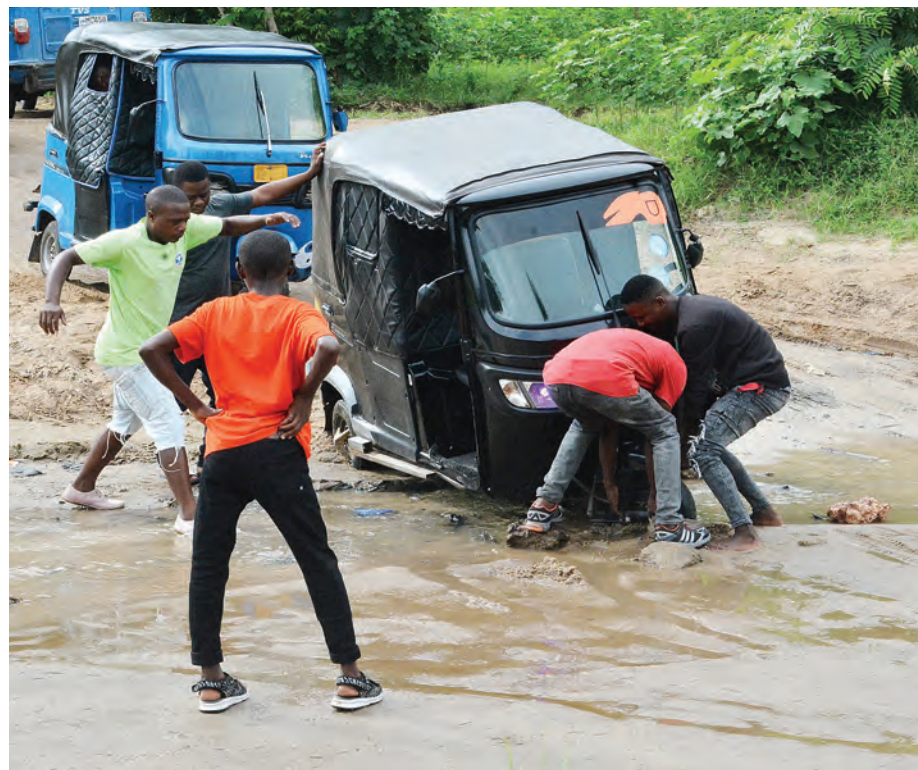
Abiria wakilazimika kumsaidia dereva wa bajaji, kuikwamua kwenye maji baada ya kukwama kwenye mchanga, wakati akitaka kuvuka Mto Tegeta, eneo la Goba Tegeta A, jijini Dar es Salaam jana.

Pia alipiga marufuku baadhi ya watu ambao wamekuwa wakifanya shughuli za udalali wa ardhi katika Wilaya ya Kiteto kwa kuwauzia wengine wanaotoka nje ya wilaya hiyo maeneo ya malisho ya mifugo kwa kuwadanganya kuwa ni ya kilimo.