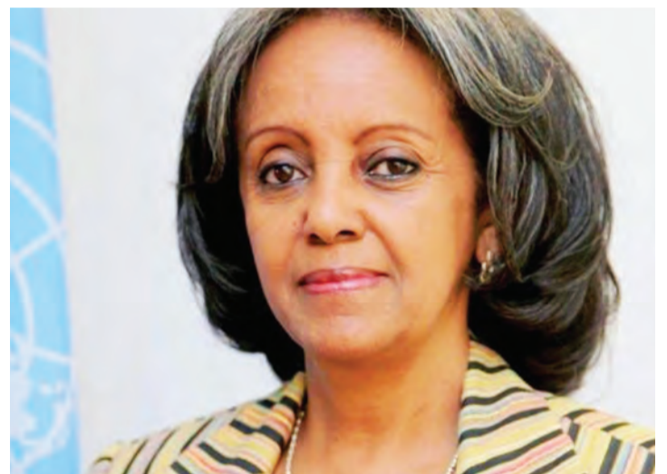
Rais wa Ethiopia, Sahle-Work Zewde.

Rais Saara Kuugongelwa-Amadhila, naye anaingia kwenye historia hiyo, baada ya aliteuliwa waziri mkuu wa Namibia, mwaka