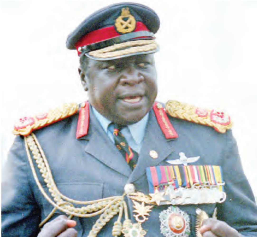
Aliyekuwa Rais Idi Amin Dada.

fakari na matokeo yake yalizaa Mwongozo wa TANU uliopitishwa na ukawa halisi ukisimamia shughuli muhimu za kisiasa na kiuchumi kitaifa.