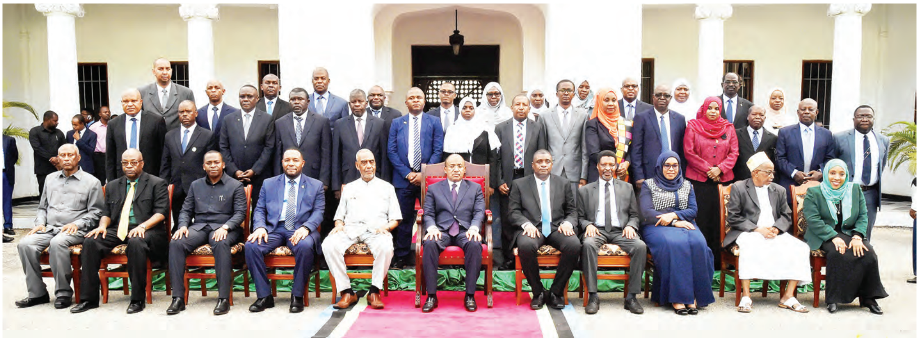
Rais wa Zanzibar na Mwenyekiti wa Baraza la Mapinduzi, Dk. Hussein Ali Mwinyi, akiwa na Makamu wake wa Kwanza, Maalim Seif Sharif Hamad na Makamu wake wa pili, Hemed Suleiman Abdalla, na viongozi wa serikali baada ya kuwaapisha makatibu wakuu na manaibu, katika viwanja vya Ikulu, Zanzibar juzi.

Aliutaka uongozi wa Wizara ya Fedha kurekebisha mfumo huo mara moja, huku akiwataka makatibu wakuu hao kuyafanyia kazi mambo hayo ili kuhakikisha fedha za serikali zinatumika katika mambo yaliyokusudiwa badala ya kutumika ovyo nje ya bajeti.