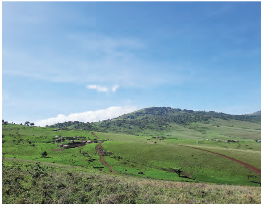
Baadhi ya makazi ya wananchi wanaoishi ndani ya Mamlaka ya Hifadhi ya Ngorongoro (NCAA), kutokana na ongezeko la watu na mabadiliko mbalimbali wameanza kujenga nyumba za bati na kuachana na nyumba za asili. Eneo hilo kwa sasa limeelemewa na watu kutoka 8,000 mwaka 1959 hadi 200,000 pamoja na mifugo.

“Lengo kuu la Ngorongoro ni kuhakikisha majukumu ya uhifadhi, utalii na kueleza wananchi waliomo yanawekwa katika usawa, bila hivyo eneo hilo litabaki