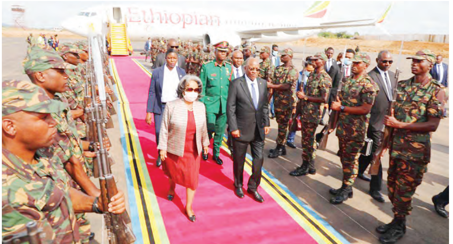
Rais wa Ethiopia, Sahle-Work Zewde, alipokuwa na mwenyeji wake, Rais John Magufuli, alipompokea katika Uwanja wa Ndege wa Chato, mkoani Geita.

Rais Zewde ni mwanadiplomasia mzoefu, aliyewahi kuwa Balozzi wa Ethiopia nchini Senegal na Djibouti. Pia aliwahi kushikilia nyadhifa kadhaa katika Umoja wa Mataifa (UN), ikiwamo Mkuu wa Ujenzi wa Amani katika Jam-