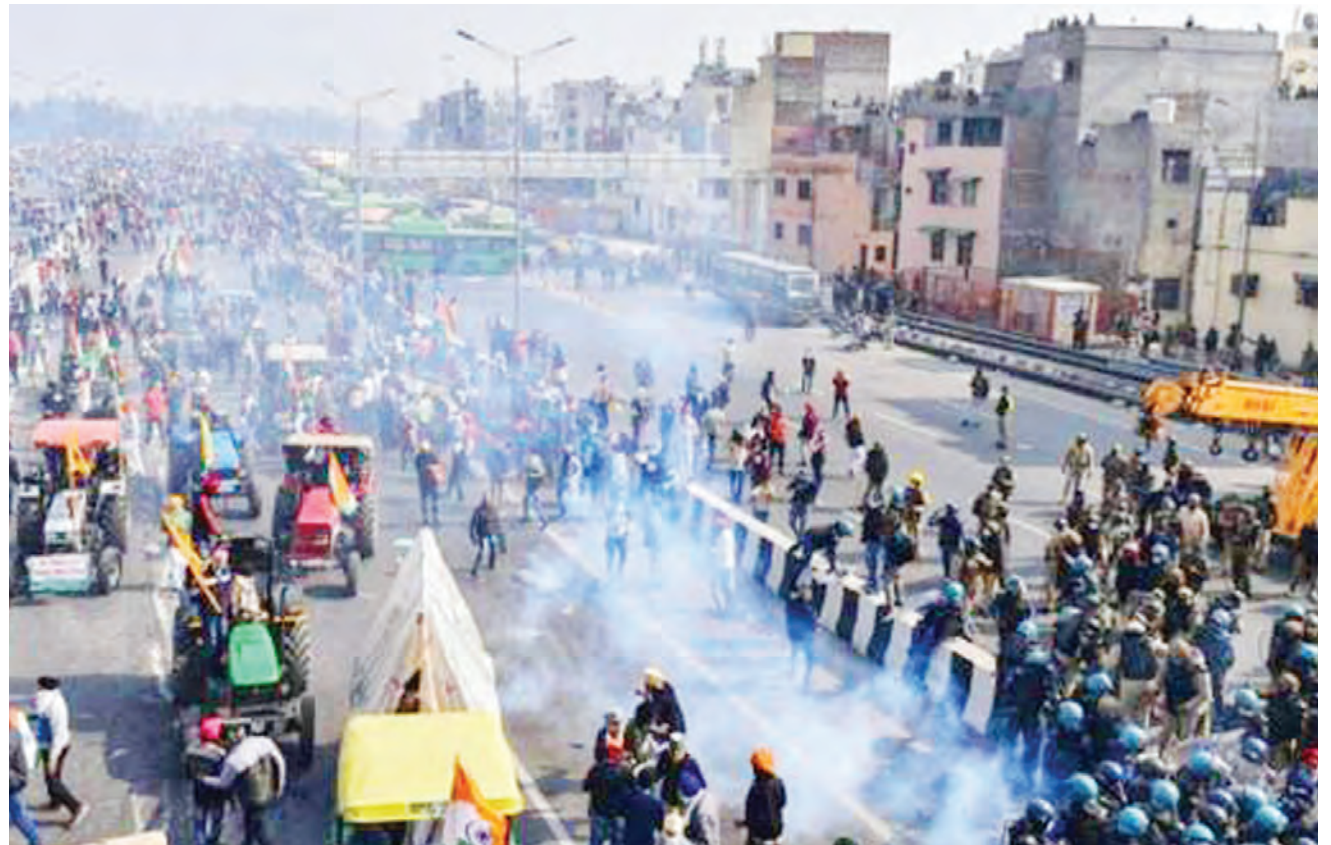
Maelfu ya wakulima wakikabiliana na polisi nchini India, walioandamana jana kudai mabadiliko kwenye sekta ya kilimo wakiingia katika uwanja wa kihistoria wa Red Fort katika mji mkuu, New Delhi.

Rais wa zamani wa CAR, François Bozize, ameendelea kunyooshewa kidole cha lawama kwamba anahusika katika kuhatarisha usalama wa nchi hiyo. RFI