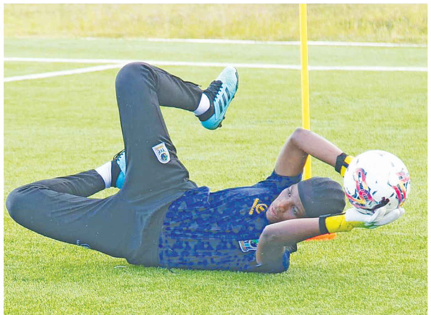
Golikipa wa Timu ya Soka ya Taifa ya Wasichana wa umri chini ya miaka 15 akifanya mazoezi ili kujiandaa na mashindano ya shule ya Afrika kwa mwaka huu yatakayofanyika hivi karibuni nchini Uganda.