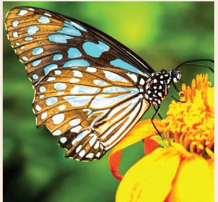
Vipepeo kwa ajili ya kuuzwa.

Anachojivunia ni ameweza kutoa elimu kwa wajasiriamali, kutengeneza makaushio ya usindikaji na kutengeneza mtandao wa soko katika nchi mbalimbali.