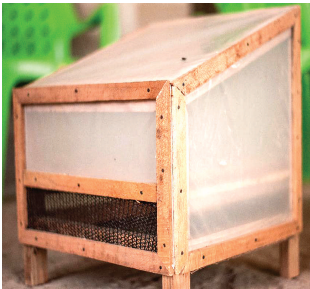
Kifaa kinachotumika kukausha mboga na matunda.