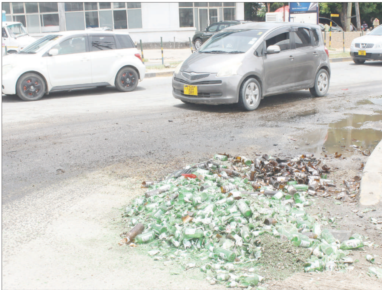
Vipande vya chupa vikiwa vimezagaa katika Barabara ya Maktaba, Manispaa ya Ilala, jijini Dar es Salaam jana, kitendo ambacho ni hatari kwa waenda kwa miguu, lakini pia kwa magari kwani vinaweza kusababisha pancha.