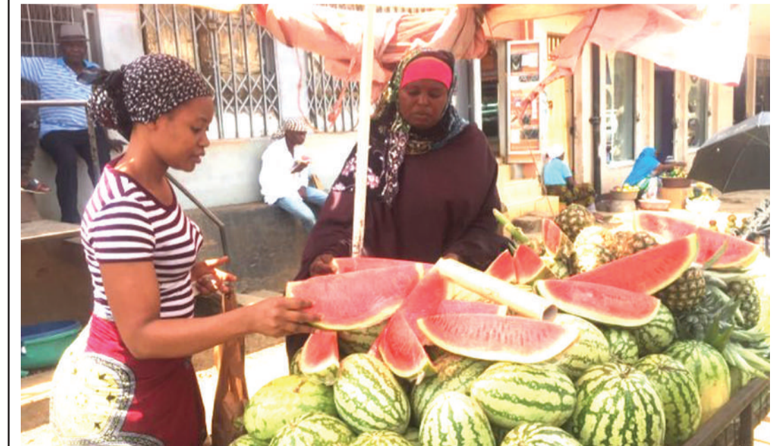
Mchuzi wa matunda ya aina mbalimbali katika Manispaa ya Moshi, Maisara Msechu (kulia), akimhudumia mteja wake, katika eneo la makutano ya barabara kuu katika manispaa hiyo, mapema wiki hii.