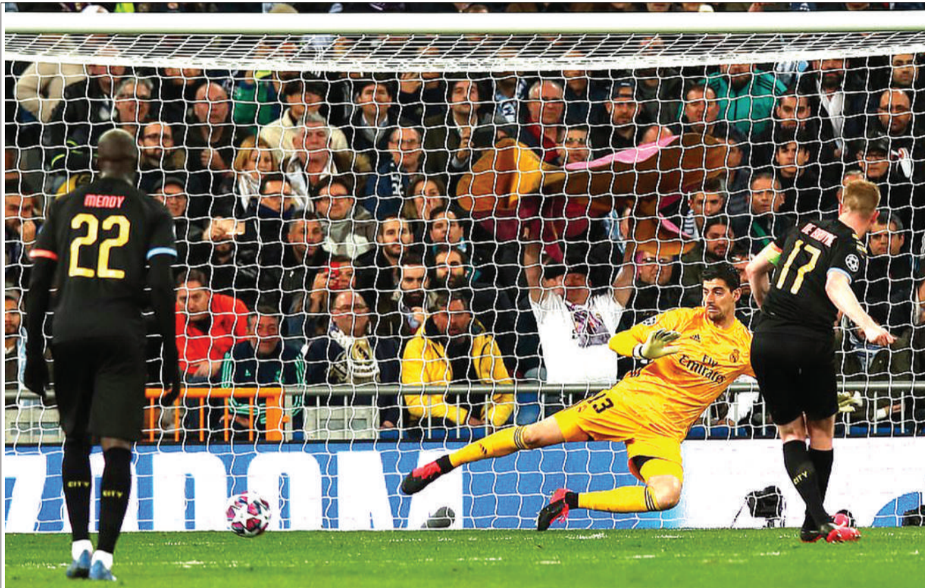
Nahodha wa Manchester City, Kevin De Bruyne (kulia), akifunga bao kwa penalti katika mechi ya Ligi ya Mabingwa Ulaya iliyochezwa kwenye Uwanja wa Santiago Bernabeu juzi usiku huku golikipa wa Real Madrid, Thibaut Courtois akishindwa kuzuia shuti hilo. City ilishinda mabao 2-1.