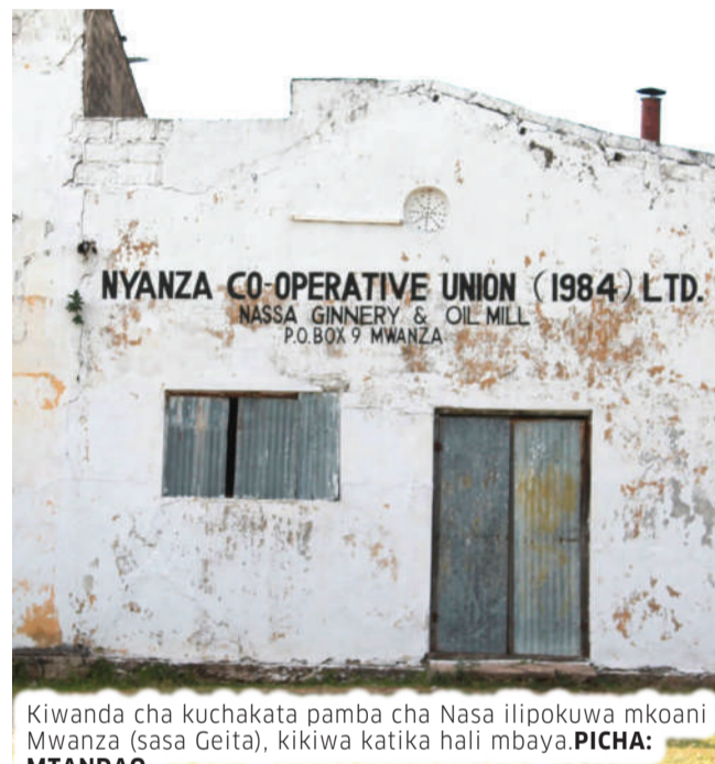
Kiwanda cha kuchakata pamba cha Nasa ilipokuwa mkoani Mwanza (sasa Geita), kikiwa katika hali mbaya.

wauzia pamba yao kutokana na manyanyaso waliokuwa wakipata wakati wa kuzaa pamba yao, ndipo walipoamua kuanzishwa kwa muungano huo wa mikoa mitatu ya wakulima wa pamba na kuunda (V.F.C.U)