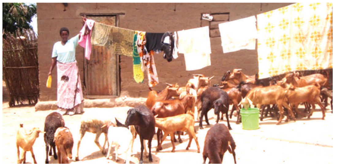
Mnufaika wa Tasaf mkoani Njombe, akiwa na mradi wa mifugo yake nyumbani.