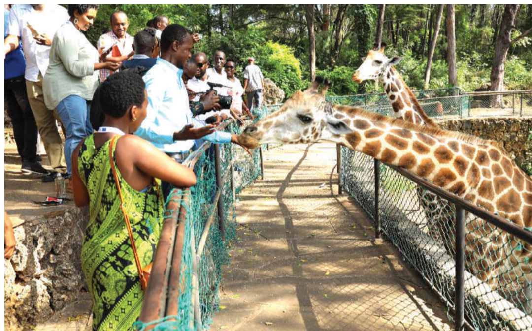
Ndivyo ilivyo mbwembwe za kitalii, hifadhini Bamburi.