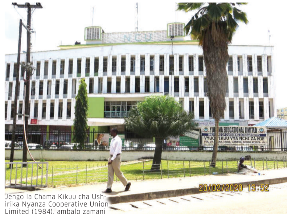
Jengo la Chama Kikuu cha Ushirika Nyanza Cooperative Union Limited (1984), ambalo zamani lilikuwa makao makuu ya Muungano wa Vyama vya Ushirika vya Wakulima wa Pamba, katika mikoa ya Mwanza, Shinyanga na Mara.