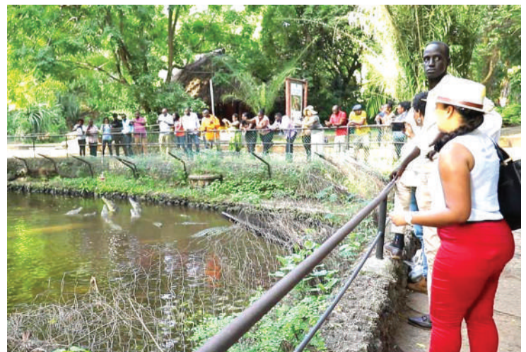
Bwawa lenye wanyama mbalimbali.

"Kampuni ya Bamburi iko kimataifa kwenye nchi zaidi ya 90 duniani chini ya kampuni ya LafargeHolcim Holding company, katika maeneo yote tunakochimba malighafi. Lengo ni kupanda miti ya asili ili kuongeza hifadhi ya mazingira Pwani," anaibainisha.