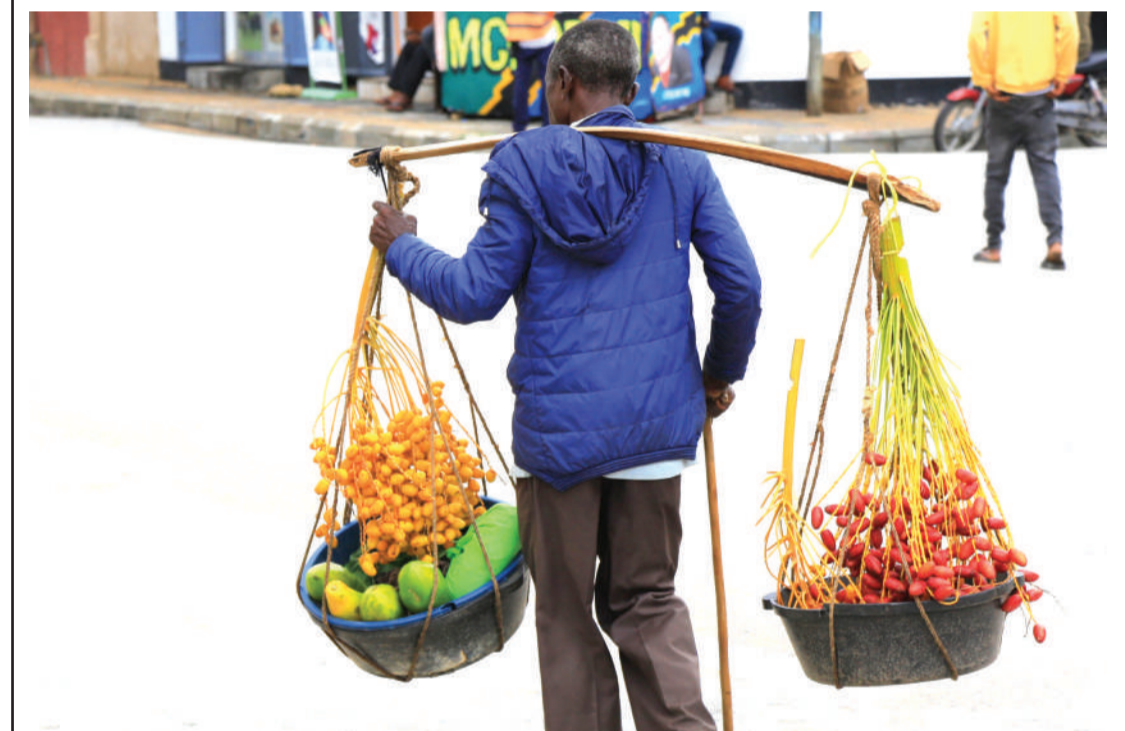
Mchuzi wa matunda akitafuta wateja katika eneo la Mji Mpya, jijini Dodoma jana.