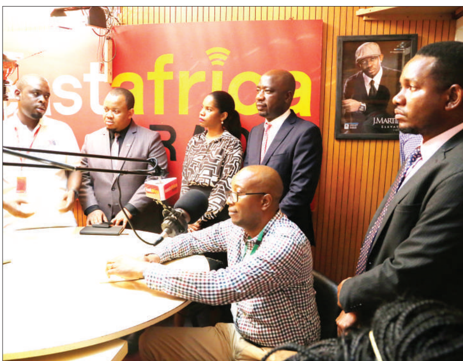
Ujumbe wa NMB Benki, ukipata maelezo ulipotembelea kituo cha redio cha East Africa.