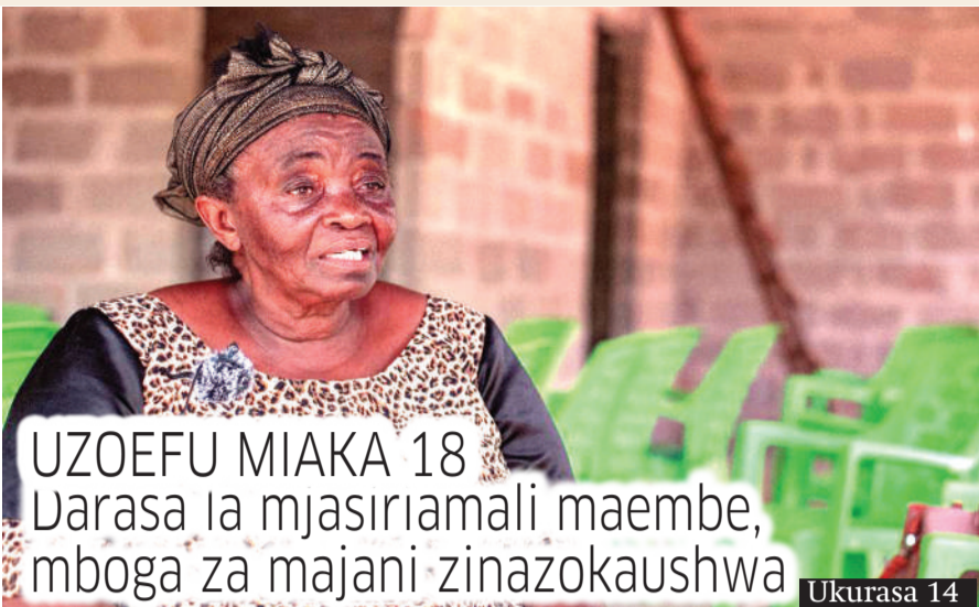
UZOEFU MIAKA 18 Darasa la mjasiriamali maembe, mboga za majani zinazokaushwa