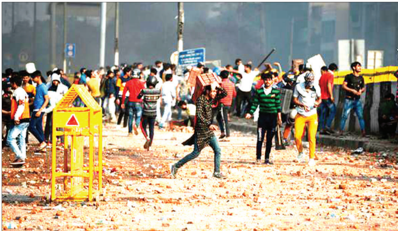
Waandamanaji wakitawanyika baada ya mashambulizi ya kurushiana mawe, karibu na Mji Mkuu wa India, New Delhi Jumatatu iliyopita.