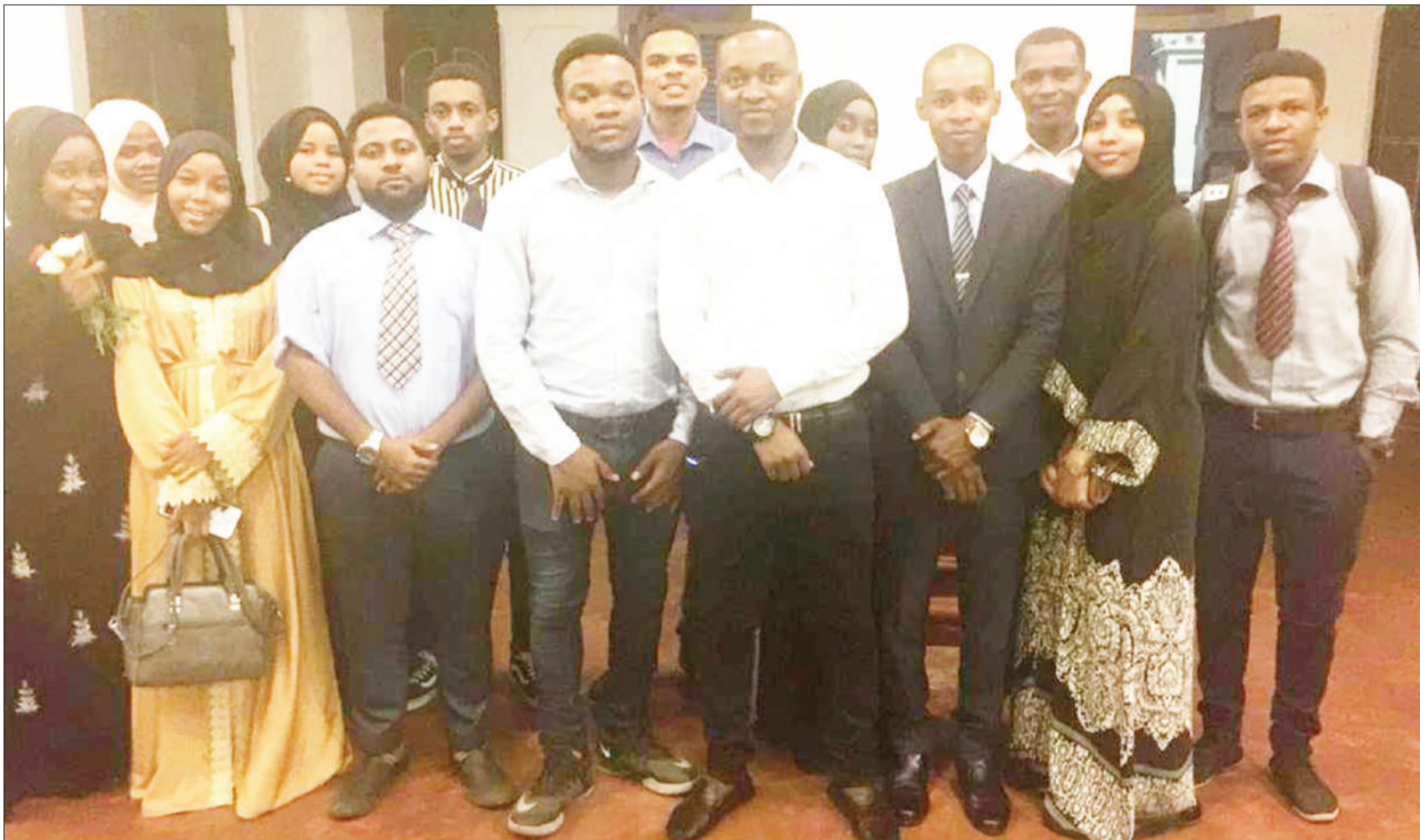
Wanafunzi 18 wa Chuo Kikuu cha Zanzibar, wakiwa katika picha ya pamoja baada ya kushiriki mdahalo wa wazi kuhusu ikolojia ya kilimo Zanzibar, uliofanyika Old Dispensary katika Mji Mkongwe, Zanzibar juzi, kwa udhamini wa Ubalozi wa Ufaransa hapa nchini, chini ya ofisi ndogo ya kisiwani humo.