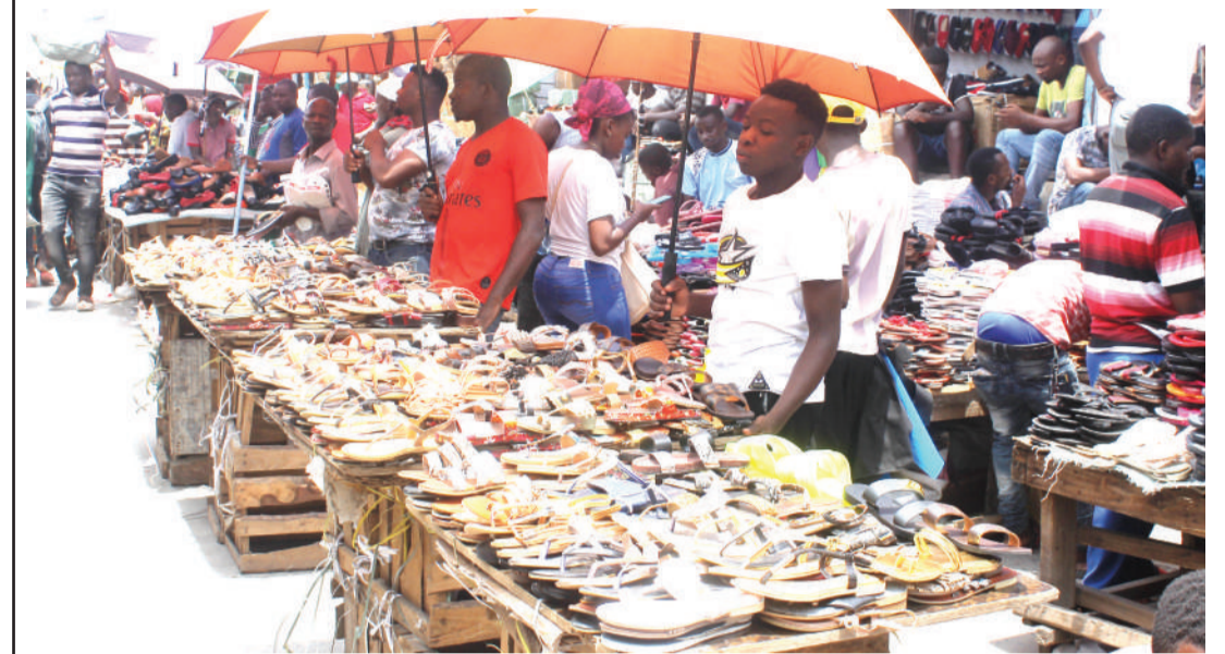
Wafanyabiashara wadogo maarufu kama machinga wakifanyia shughuli zao katikati ya barabara za mitaa ya eneo la Kariakoo, jijini Dar es Salaam jana, na kusababisha usumbufu kwa watembea kwa miguu.