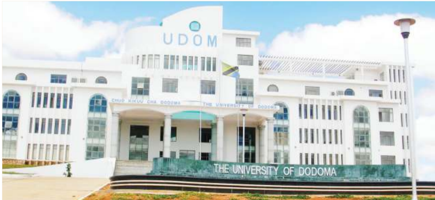
Chuo Kikuu cha Dodoma.

wepo ila umilionea, kwani milioni ya wakati huu si ajabu ni sawa na elfu kumi ya wakati huo, wakati dola ya Marekani iliuwza shilingi saba, na sasa ni karibu na Sh. 2,500 kuonyesha kuzidisha kwa mara 80, hivi.