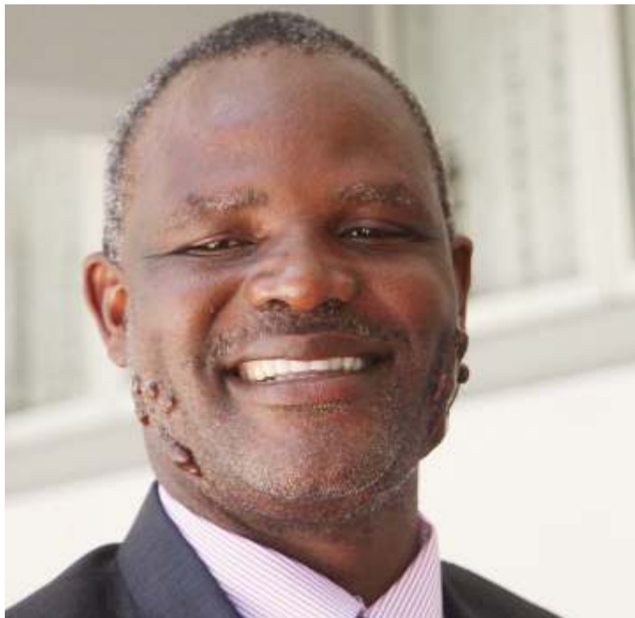
Waziri wa Kilimo, Japhet Hasunga