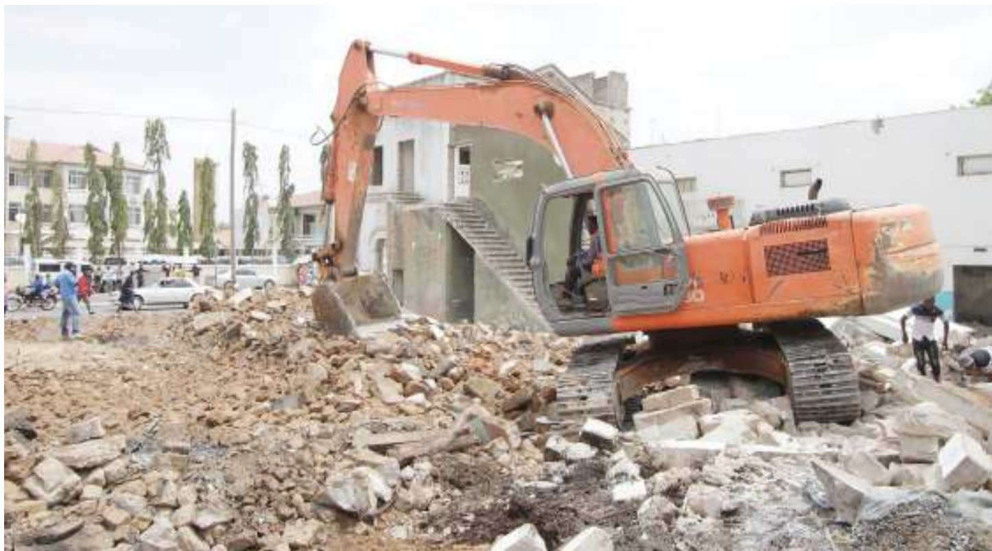
Mafundi ujenzi wa Kampuni ya Kichina ya Stecol Corporation, wakiendelea na kazi kuandaa eneo kwa ajili ya ujenzi wa jengo la kitega uchumi la Jiji la Dodoma litakalokuwa na ghorofa zaidi ya 10 katika eneo la Uhindini jana.

Takwimu za ajali nchini zinaonyesha kati ya mwaka 2016 hadi Julai 2019 kumetokea jumla ya ajali 20,683 zilizosababisha vifo 8,399 na majeruhi 19,722, kiwango ambacho ni kikubwa ambapo taifa limepoteza nguvu kazi, fedha na vifaa.