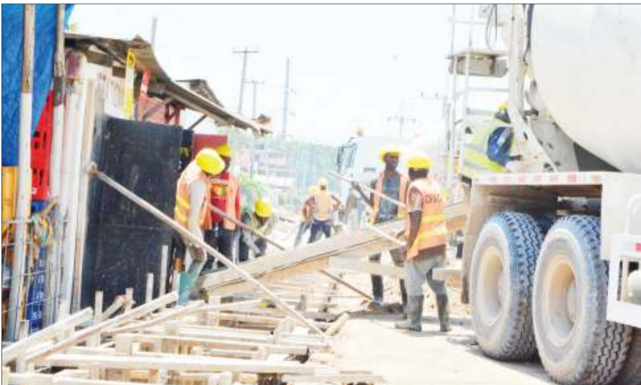
Mafundi wa ujenzi wakiendelea na kazi ya kujenga mifereji ya maji taka katika Mtaa wa Salmin Amour Mwenge, jijini Dar es Salaam jana.

Naibu Waziri aliyataja baadhi ya mikoa ambayo maeneo ya hifadhi yamevamiwa kwa kiasi kikubwa na wananchi baada ya tamko la Rais kuwa ni Geita, Morogoro, Kagera, Singida, Lindi na Mtwara.