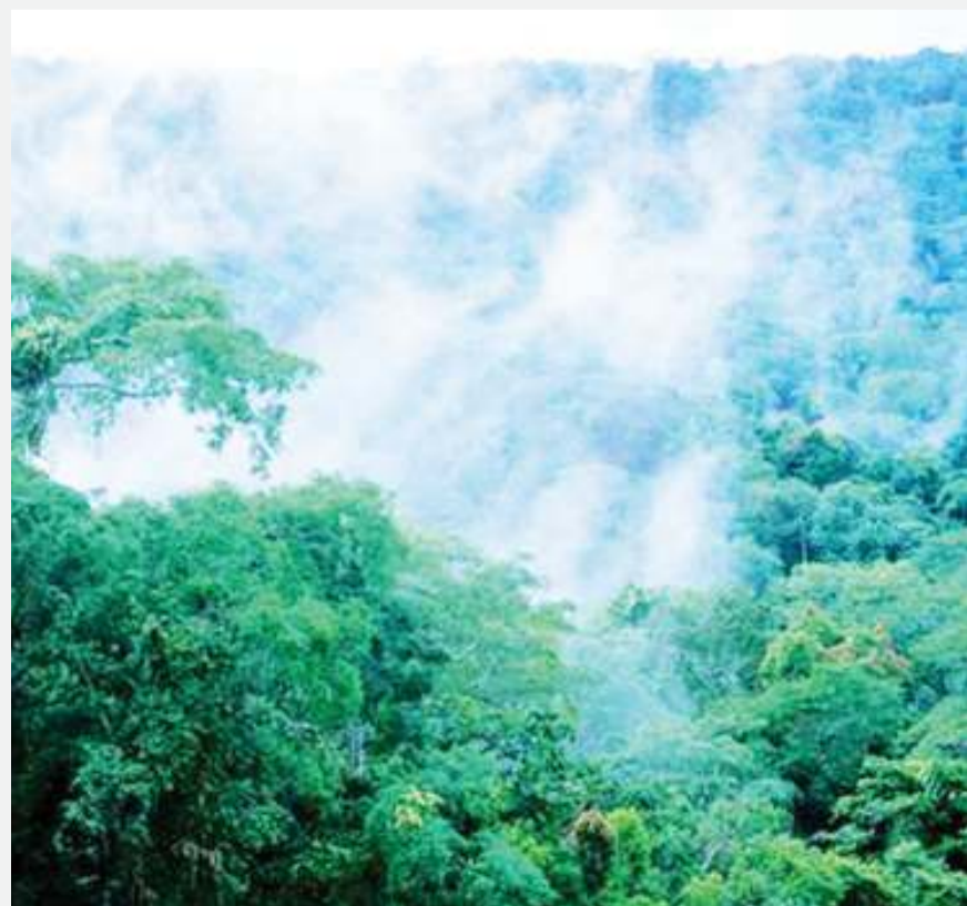
Umande katika msitu wa mvua Bonde la Kongo Magharibi.

Kama ilivyo kwa msitu wa Amazon, msitu wa bonde la Kongo unachangia kusafisha hewa chafu ya kaboni kwa kiasi kikubwa na ni njia muhimu kwa mujibu wa wataalamu ya kupambana na mabadiliko ya tabianchi. DW