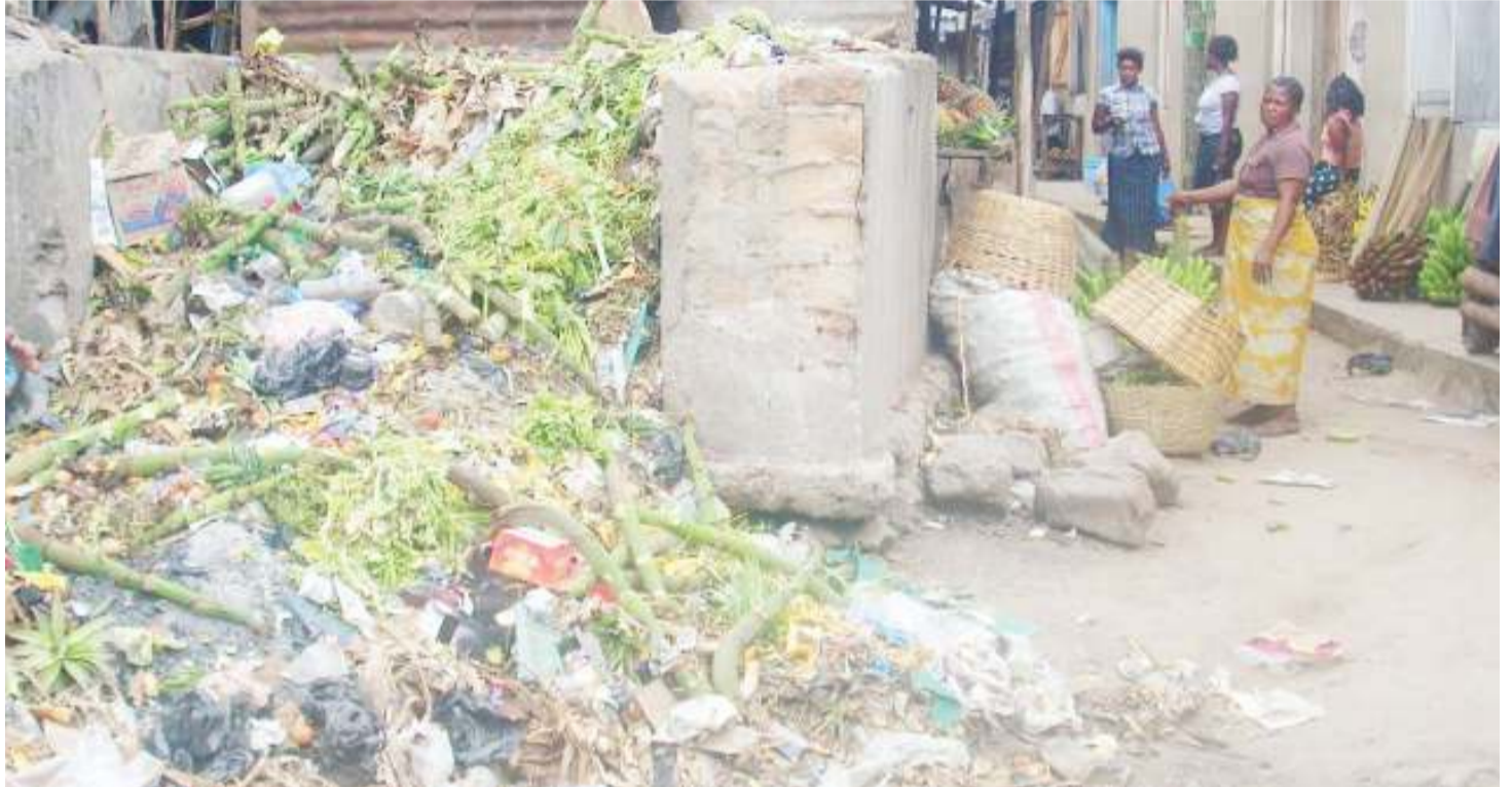
Uchafuzi kama huu katika miji yetu unaweza ukadhibitiwa kikamilifu kwa kuitumia Mahakama.

Yawezekana msomaji wa makala hii ukajiuliza, kama jukumu kuu la Mahakama ni kutoa haki, Je ni kwa namna gani chombo hiki cha