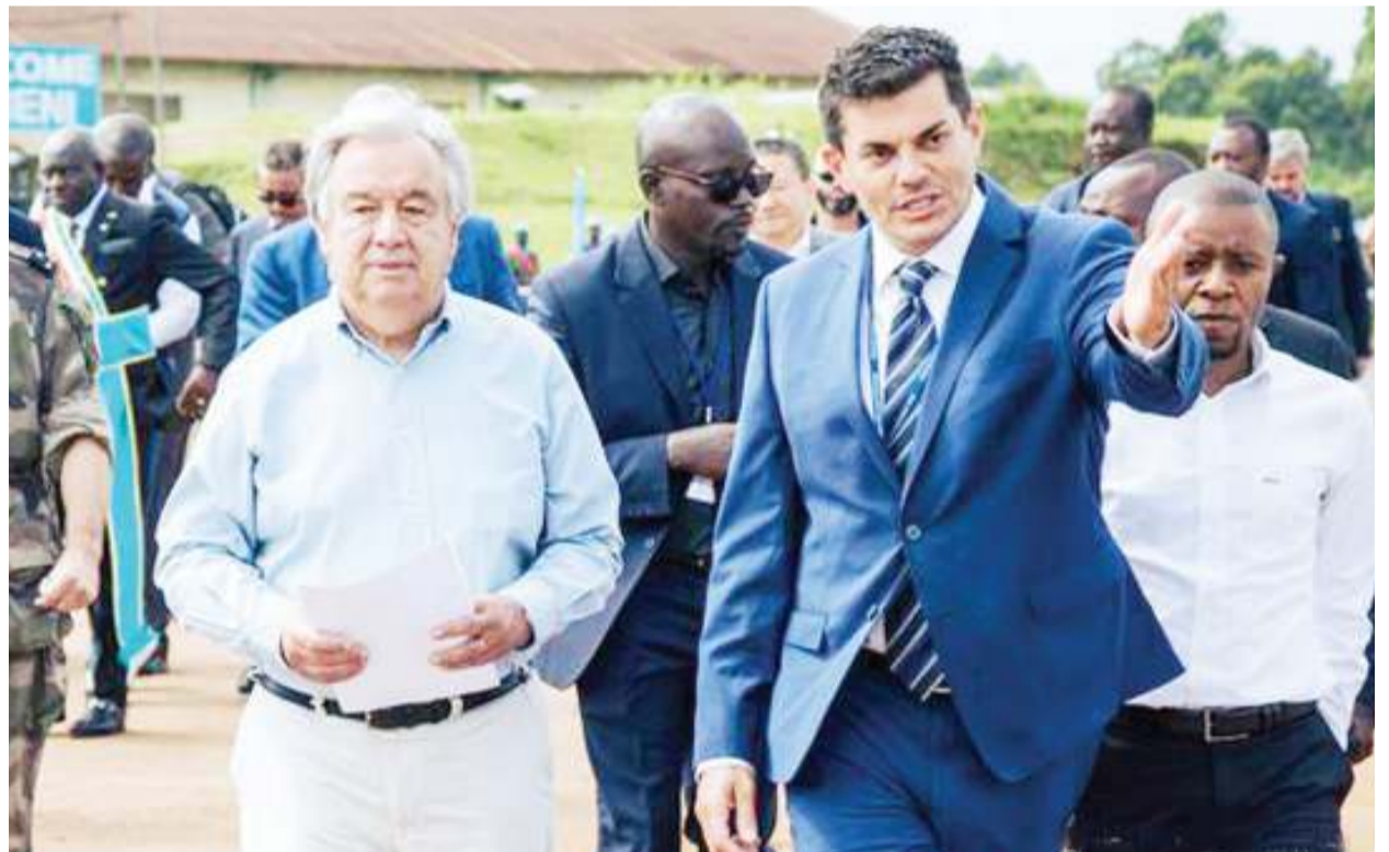
Katibu Mkuu wa Umoja wa mataifa, Antonio Guterres (katikati), akiwa Jamhuri ya Demokrasia ya Congo (DRC) alipotembelea kituo cha afya wanakotibiwa wagonjwa wa Ebola magharibi mwa mji wa Beni.

Pia litakuwa mojawapo ya maswala yatakayojadiliwa katika mkutano baina yake na Rais wa DRC, Félix Tshisekedi mjini Kinshasa.