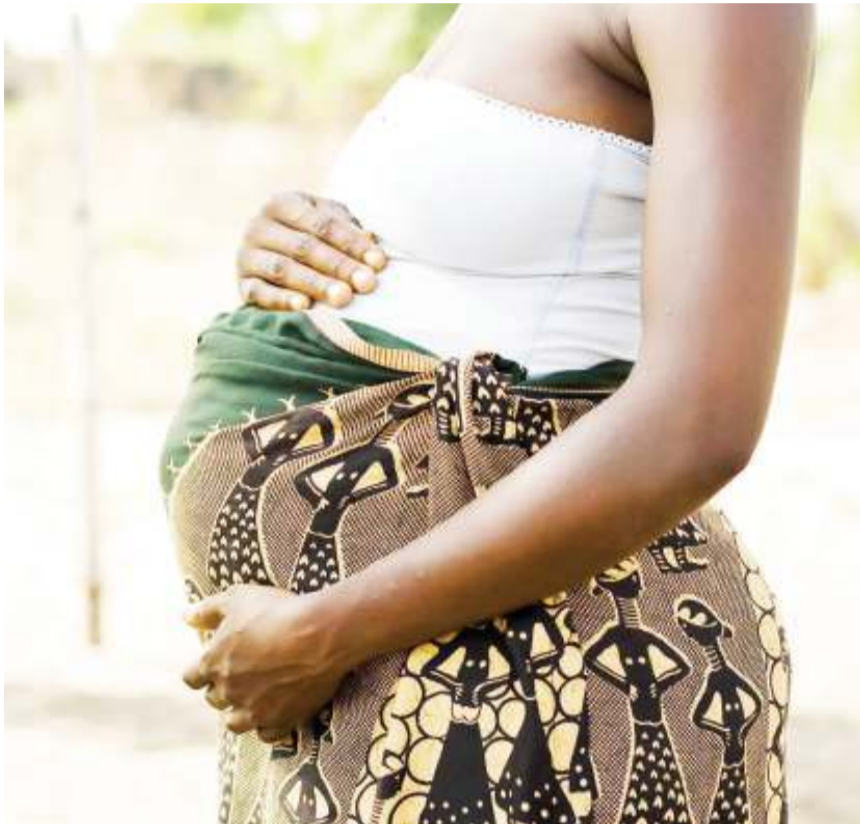
Utafiti umegundua njia za kuondoa msongo wa mawazo kwa wajawazito kama mama huyu.

K ARIBU watu milioni 450 duniani wanakabiliwa na tatizo la msongo wa mawazo, hali inayofanya wengi wao kupata matatizo ya kiafya.