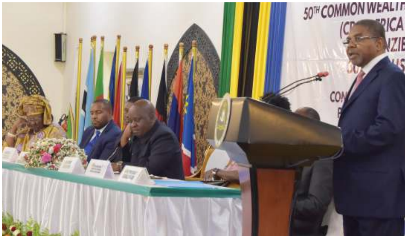
Rais wa Zanzibar na Mwenyekiti wa Baraza la Mapinduzi, Dk. Ali Mohamed Shein, akifungua Mkutano wa 50 wa Mabunge ya Nchi za Jumuiya ya Madola kwa Kanda ya Afrika, katika ukumbi wa Hoteli ya Madinat Al Bahar Mbweni nje kidogo ya mji wa Zanzibar jana.