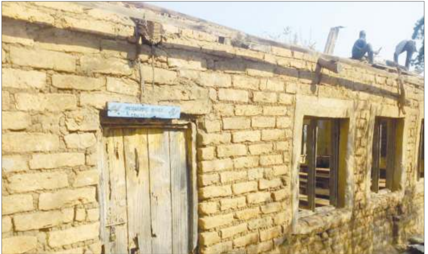
Baadhi ya wananchi wa Kata ya Ruanda, wakibomoa majengo chakavu tayari kwa kuanza ujenzi wa madarasa nane na ofisi katika Shule ya Msingi Weru 2, iliyopo wilayani Mbozi mkoani Songwe jana.

Aliwataka wamiliki wa viwanda kuwa na umoja na kushirikiana katika kutatua changamoto zinazowakabili kwenye uzalishaji wao na kwamba serikali itaendelea kushirikiana nao katika kutatua changamoto zao.