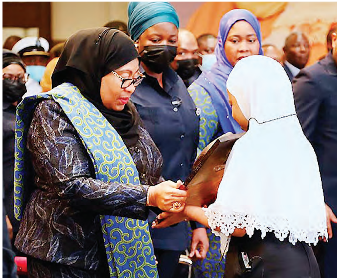
Samia Suluhu Hassan, akipokea tuzo yenye saini 50 za wanafunzi wa kike waliotafaidika na Taasisi ya Mwanamke Initiatives Foundation (MIF) katika hafla iliyofanyika, Zanzibar Juni, mwaka jana.

Mnamo mwaka 2019, Kituo cha Sheria na Haki za Binadamu kwa kushirikiana na kingine, Centre for Reproductive Rights, kiliwasilisha malalamiko kwa Kamati ya Wataalamu ya Haki na Ustawi wa Mtoto Afrika ((AC-ERWC)), kupinga kufukuzwa na kutengwa kwa wasichana wa-