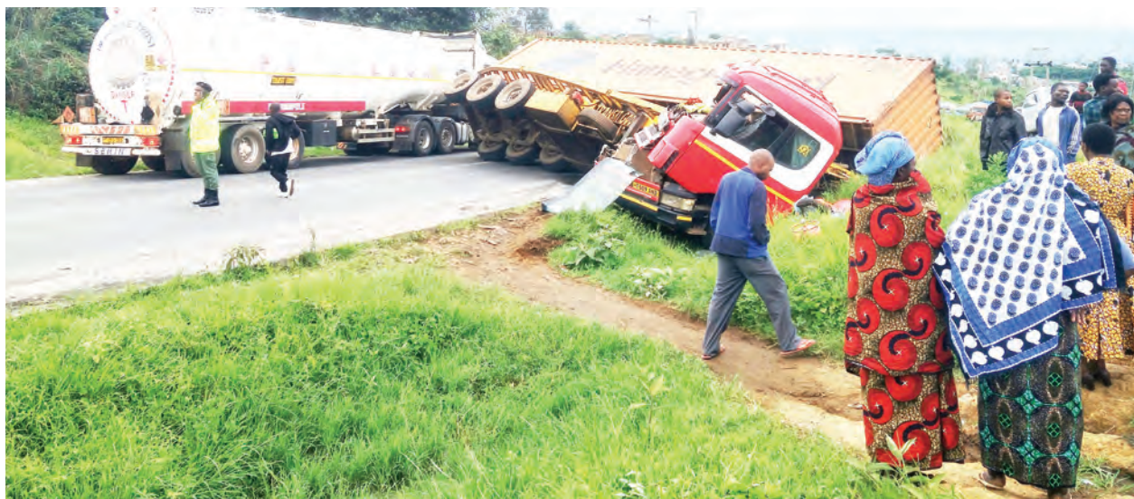
Lori la mizigo likiwa limeanguka na kufunga barabara kuu ya Tanzania na Zambia kwa zaidi ya saa mbili, eneo la mteremko wa Iwambi jijini Mbeya jana.

Alisema katika Wilaya ya Chunya walikamata meno 35 na Kyela walikamata meno 38 jambo ambalo linaashiria kwamba vitendo vya ujangili vinaendelea kwenye hifadhi mbalimbali za taifa.