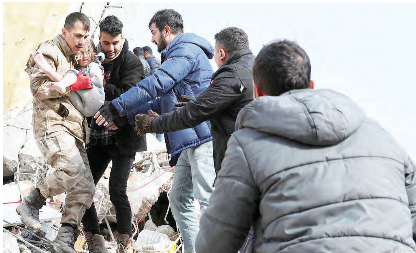
Maofisa wa uokoaji wakiwa wamembeba mtoto miongoni mwa manusura waliookolewa kwenye vifusi vya nyumba zilizoporomoka baada ya kukumbwa na tetemeko la ardhi nchini Uturuki.

Kamishna wa Umoja wa Ulaya (EU) anayeshughulikia mizozo Jan- ez Lenarcic, alisema timu 27 za waokoaji kutoka nchi 19 wanachama wa umoja huo zimepelekwa Uturuki kusaidia, akieleza kuwa timu hizo zinajumuisha wataalamu 1,150 na mbwa 70 wenye mafunzo ya kunusa. BBC/DW