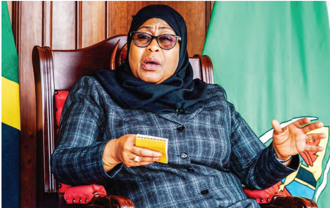
Rais Samia Suluhu Hassan.

Akitangaza uamuzi wa maelezo ya Rais Dk. Samia, waziri