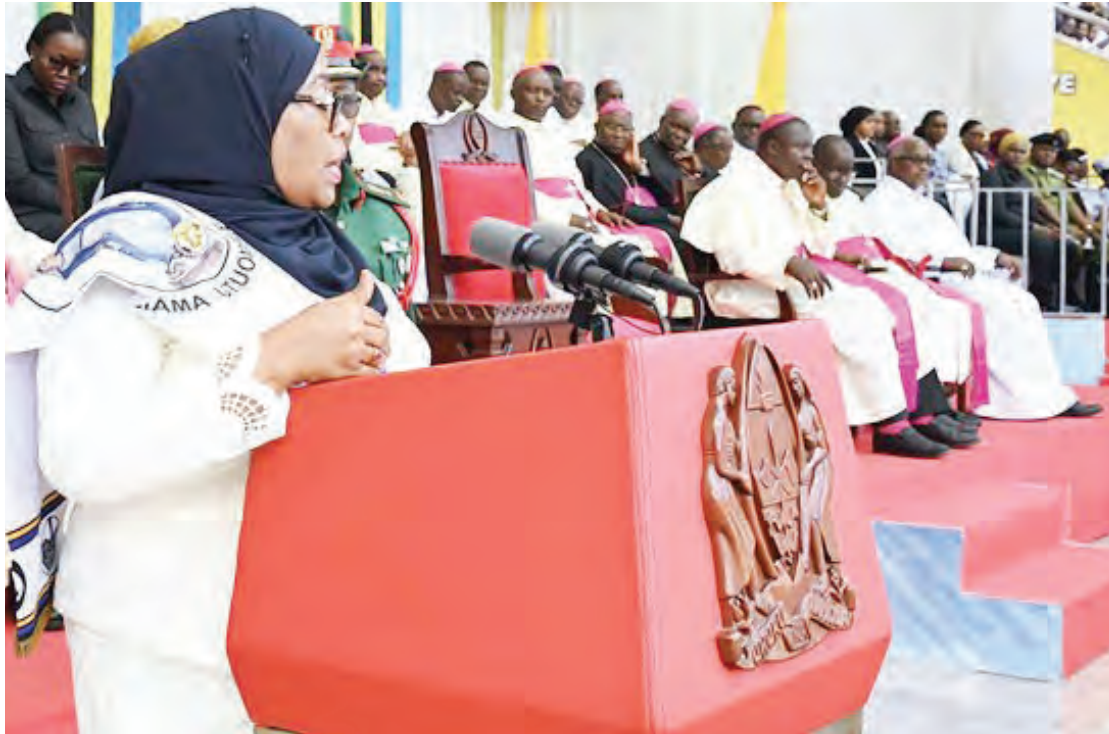
Rais Dk. Samia Suluhu Hassan, alipokuwa kwenye Mkutano wa Wanawake Wakatoliki Tanzania (WAWATA) jijini Dodoma mwaka jana, ambako akatangaza ujio wa muswada wa Bima ya Afya kwa Wote, akidokeza sura na manufaa yake.

Ikirejewa takwimu ni kwamba, hadi sasa asilimia 85 ya Watanzania hawana bima za afya, huku kukishuhudiwa matukio ya baadhi ya kaya zinazoelemewa na mahitaji ya kitabibu, kulazimika kuuza rasilimali zake, kupata fedha za