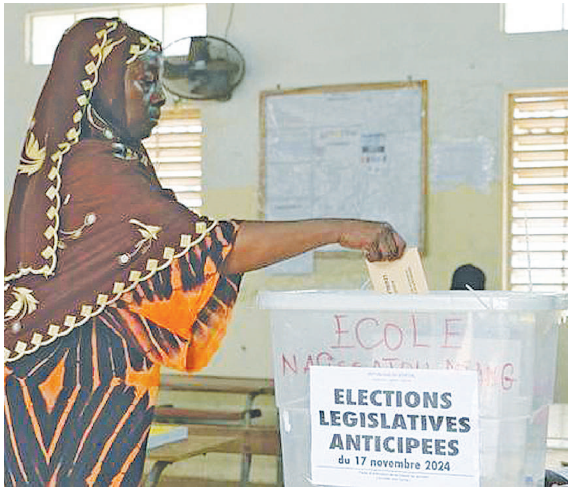
Mmoja wa wananchi nchini Senegal akipiga kura katika uchaguzi wa kuchagua wabunge jana.