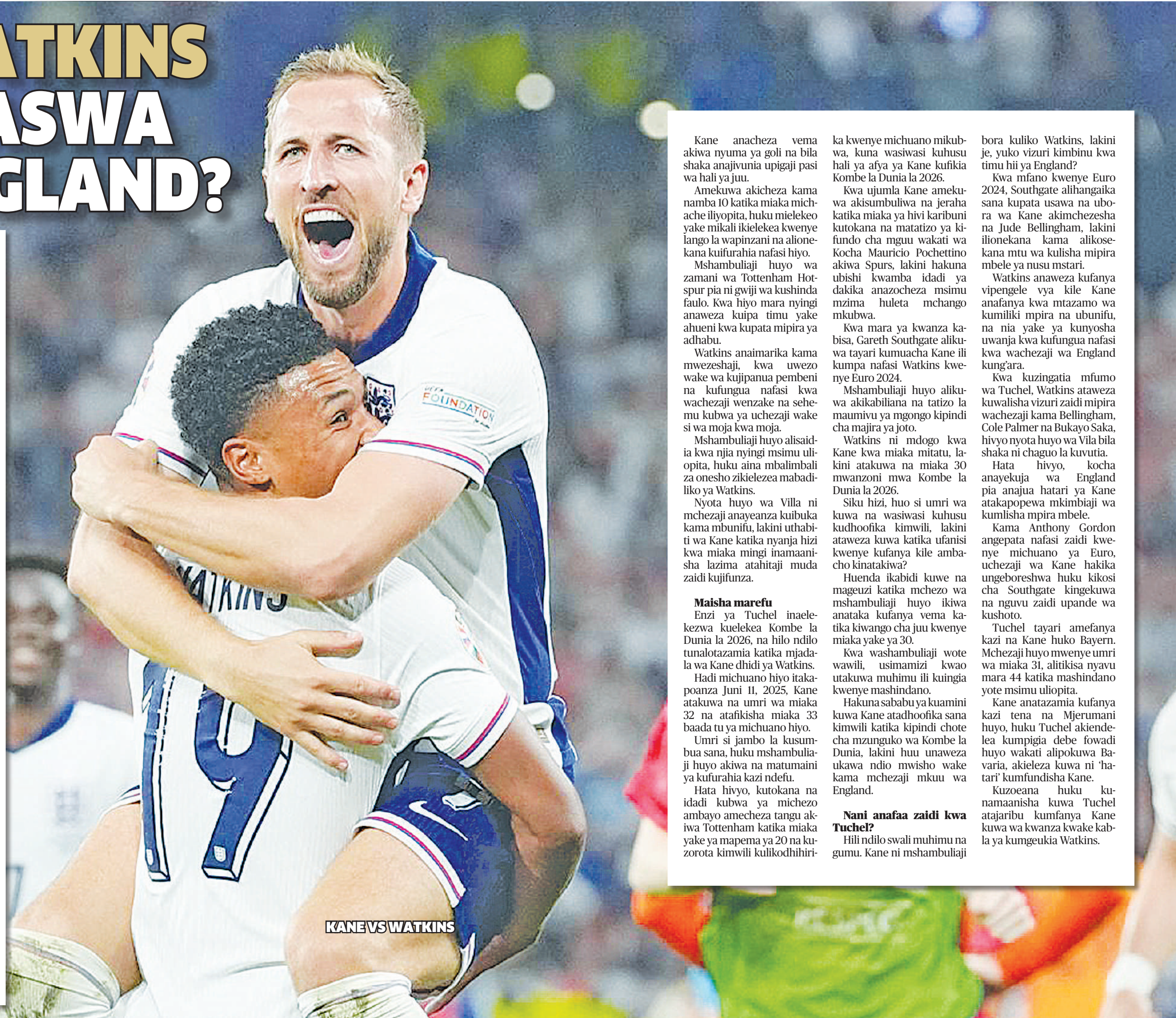
KANE VS WATKINS

Mara moja tu Kane ameboresha takwimu hiyo. Alirekodi asisti 14 kwenye ligi msimu wa 2020/21 wakati huo akicheza kwa upatana mzuri na Son Heung-min aliyekuwa kwenye kilele chake cha ubora.