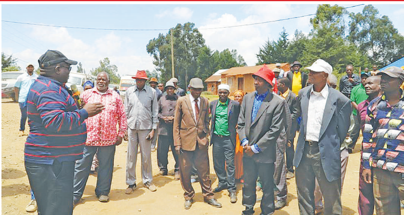
Naibu Waziri wa Ujenzi na Mbunge wa Ileje, Godfrey Kasekenya, akisisitiza jambo kwa wazee wa Ileje, mkoani Songwe alipokagua miradi ya maendeleo jimboni kwake juu.

Hata hivyo nishati hiyo ya jua zenye mfumo wa taa na redio zimefungwa kwenye kaya 50 wilayani Makete ambapo inakadiriwa kuwa watu zaidi ya 250 wanatarajia kunufaika na msaada huo ambao umetolewa na Chama cha Kimisionari cha Semu kutoka nchini Sweden.