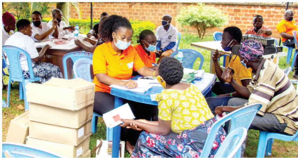
Baadhi ya madaktari ambao ni wana-chama wa Chama cha Madaktari Tanzania (MAT), wakishirikiana na wadau mbalimbali kutoa huduma za afya bure kwa wakazi wa mji wa Geita. Mpango huo maalumu wa siku tatu umefadhiliwa na Kampuni ya GGML chini ya uratibu wa Ofisi ya Mkuu wa Mkoa Geita na chama hicho.