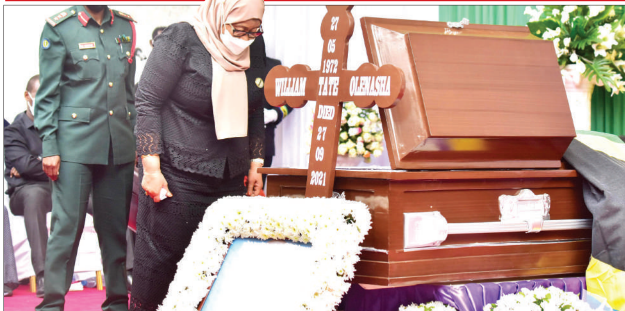
Rais Samia Suluhu Hassan, akiongoza Watanzania kuaga mwili wa aliyekuwa Naibu Waziri, Ofisi ya Waziri Mkuu, Uwekezaji, marehemu William Tate Ole Nasha, katika viwanja vya Bunge, jijini Dodoma jana. Habari Uk. 4.