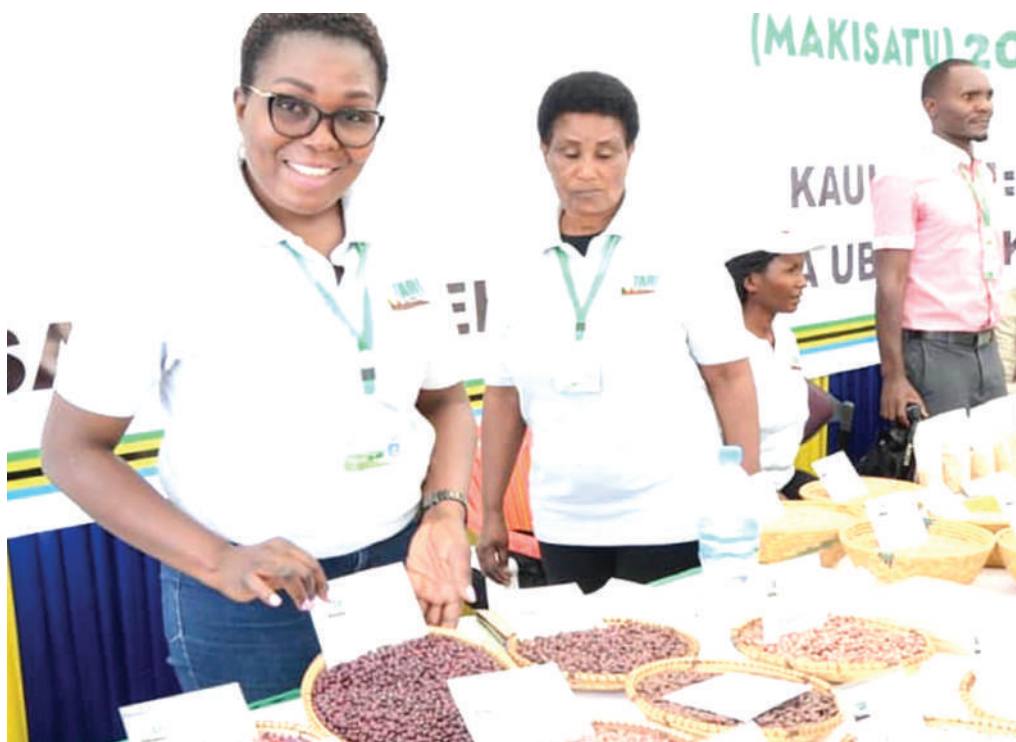
Washiriki wa Maonyesho ya Kitaifa ya Sayansi Teknolojia na Ubunifu, kuhusu namna teknolojia inavyotumika kuchochea mapinduzi ya kilimo nchini, katika Uwanja wa Jamhuri jijini Dodoma.

da, akizindua kituo hicho cha usambazaji wa teknolojia, anasema kwamba changamoto kubwa ya