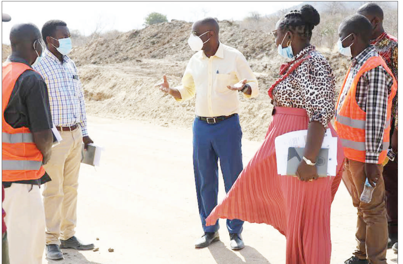
Waziri wa Ujenzi na Uchukuzi, Prof. Makame Mbarawa (katikati), akifafanua jambo kwa makandarasi wa kampuni ya Inter-Consult Ltd, inayojenga barabara ya mzunguko ya urefu wa kilometa 112.3, jijini Dodoma, wakati alipokuwa akikagua maendeleo ya ujenzi wa mradi huo.

Aliwataka mameya, wenyeviti na wakurugenzi kuhakikisha wanakusanya mapato ipasavyo na kusisitiza kuwa endapo halmashauri haitafanya vizuri kati-ka eneo la ukusanyaji wa mapato Mkurugenzi atakuwa hatoshi katika hiyo nafasi.