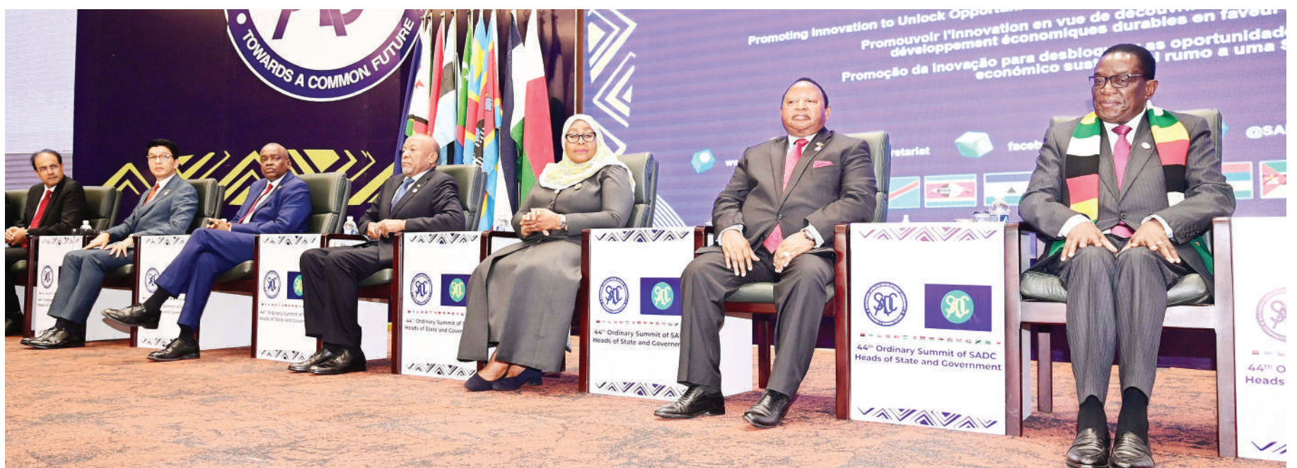
Rais Dk. Samia Suluhu Hassan akiwa na viongozi wengine katika Mkutano wa 44 wa Wakuu wa Nchi na Serikali wa Jumuiya ya Maendeleo Kusini mwa Afrika (SADC), jijini Harare, nchini Zimbabwe jana.