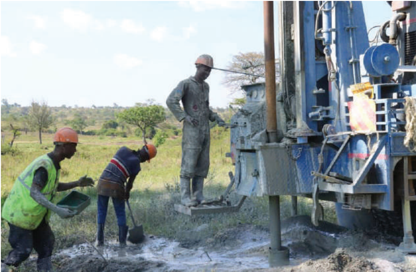
Mafundi wakiendelea na kazi ya kuchimba kisima cha maji safi, katika kitongoji cha Stooni, kijiji cha Nyichoka, wilayani Serengeti mkoa ni Mara mwishoni mwa wiki. Mradi huo, unasimamia Uhifadhi na Urejeshi Bonde la Mto Grumeti katika Ikolojia ya Serengeti.