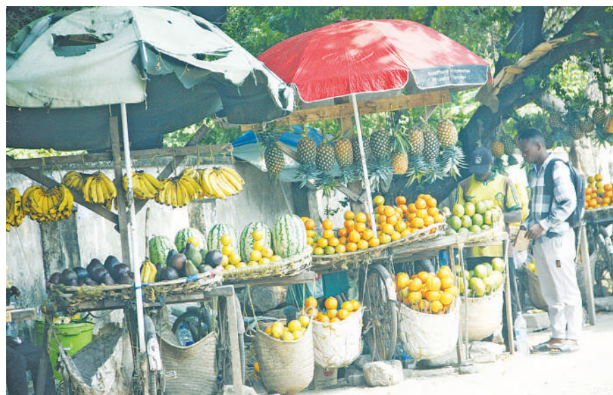
Wachuuzi wa matunda wakiwa wameyaweka kwenye baiskeli zao, wakati wakisubiri wateja kando ya ukuta wa makaburi ya Kinondoni, jijini Dar es Salaam mwishoni mwa wiki.