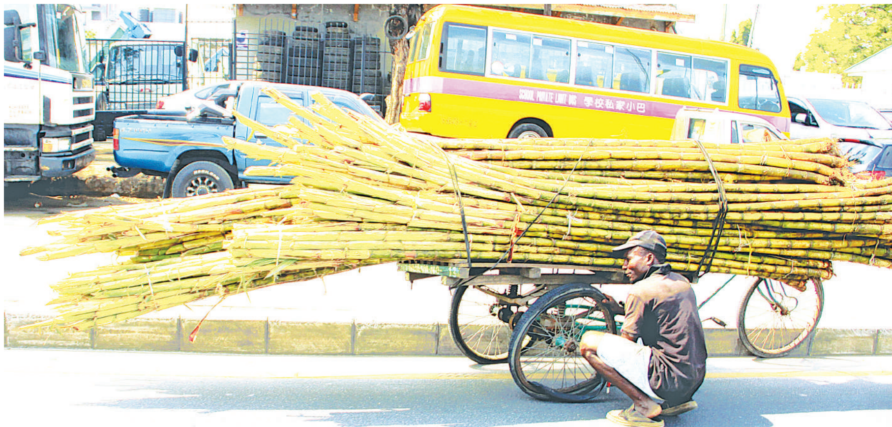
Mwendesha baiskeli ya magurudumu matatu maarufu Guta, akiitengeneza baada ya kuharibika katika barabara ya Kawawa, eneo la Magomeni Mikumi, Dar es Salaam, hivi karibuni.