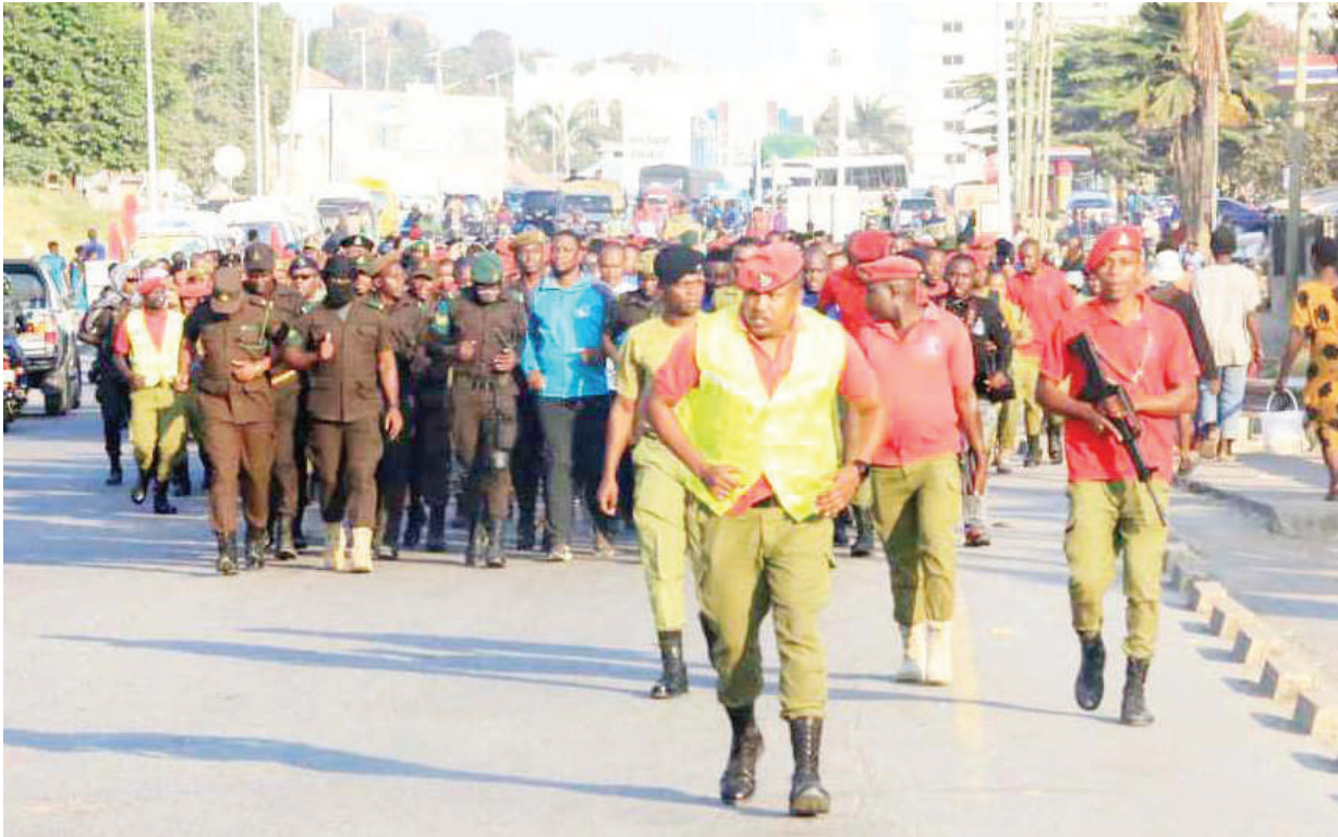
Askari kutoka vyombo vya usalama, mkoani Mwanza, wakifanya mazoezi ya matembezi ya hiari katika mitaa mbalimbali ya Jiji la Mwanza jana, kwa lengo la kudumisha ushirikiano baina yao, kuelekea Uchaguzi wa Serikali za Mitaa unaotarajiwa kufanyika Novemba 27, mwaka huu.