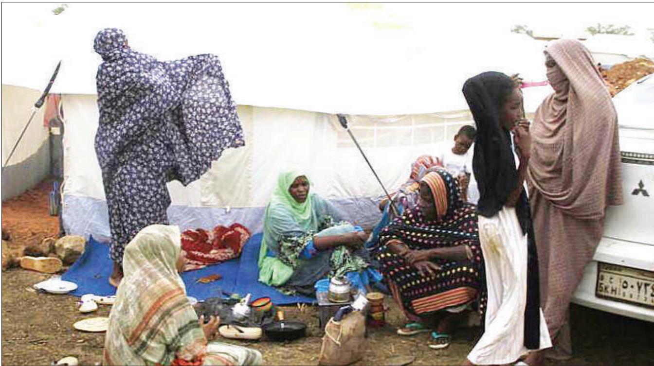
Wakimbizi wa Sudani kutoka jimbo la Sennar kusini-mashariki mwa Sudani wakiwa katika kambi maalumu wakikimbia mapigano yanayoendeshwa na vikosi vya RFS.

Waziri Mkuu wa Israeli Benjamin Netanyahu alitoa wito kwa wapatanishi kuishinikiza Hamas kukubali mapendekezo ya Rais Joe Biden. RFI