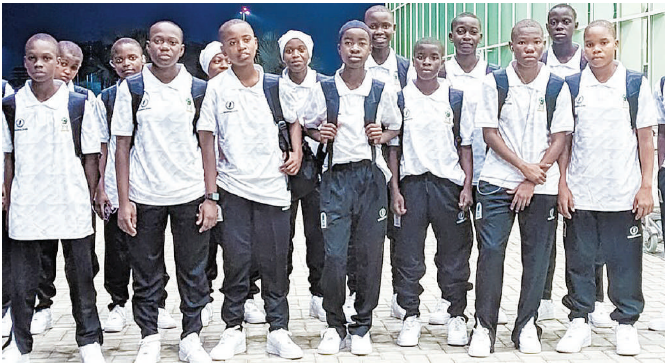
Wachezaji wa Timu ya Taifa ya Wasichana wa umri chini ya miaka 12 wakiwa kwenye Uwanja wa Ndege wa Julius Nyerere kwa ajili ya safari ya kuelekea China kushiriki mashindano ya vijana ya Female Universal Youth Cup yatakayofanyika kuanzia Agosti 21 hadi 23, mwaka huu nchini humo.