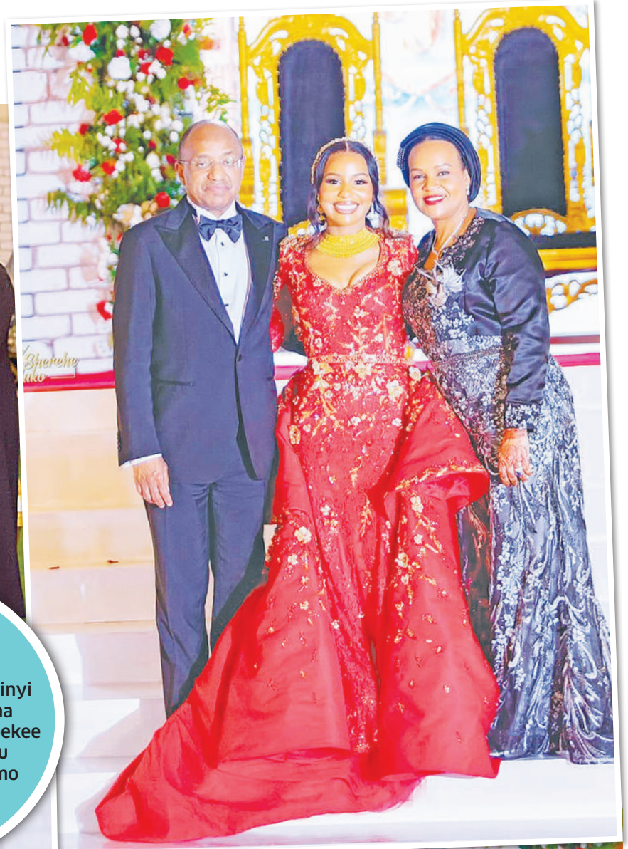
Unaweza kusema ni moja ya harusi iliyotikisa 2024, wakati Rais wa Zanzibar, Dk. Hussein Mwinyi alipomuza binti yake na kuandaliwa sherehe ya kipekee iliyohudhuriwa na watu maarufu nchini wakiwamo viongozi serikalini na wastaafu.